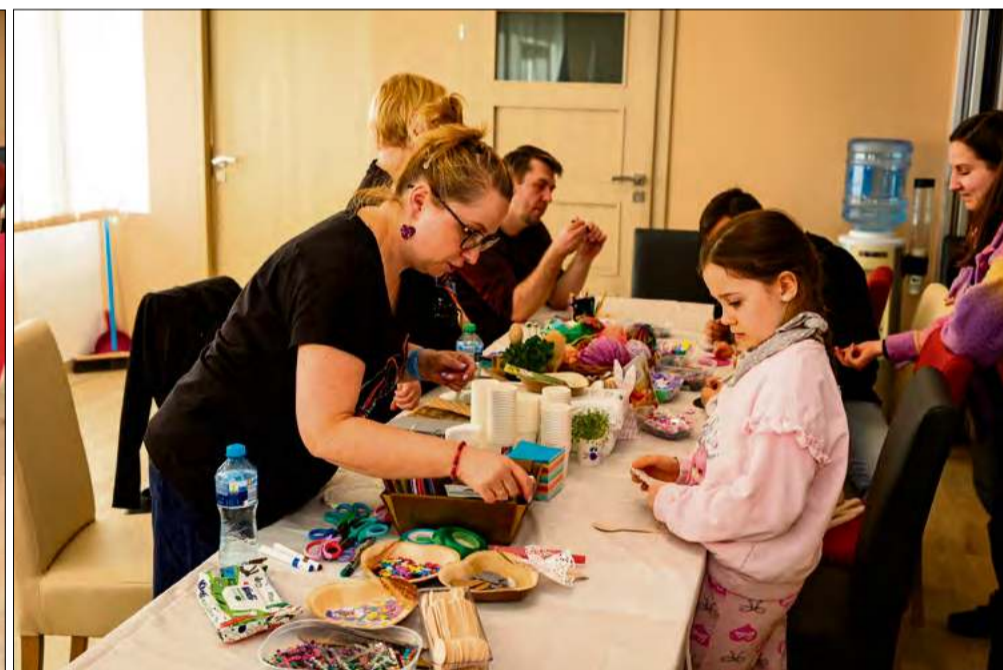
Warsztaty zdobienia pisanek i dekorowania ciasteczek cieszyły się ogromnym zainteresowaniem zarówno dzieci, jak i dorosłych.