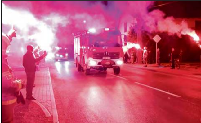
Nowe wozy OSP Stradunia wjechały przy włączonych syrenach i w asyście rac, witane przez mieszkańców i strażaków.

Pierwszym z zaprezentowanych pojazdów jest lekki samochód pożarniczy marki