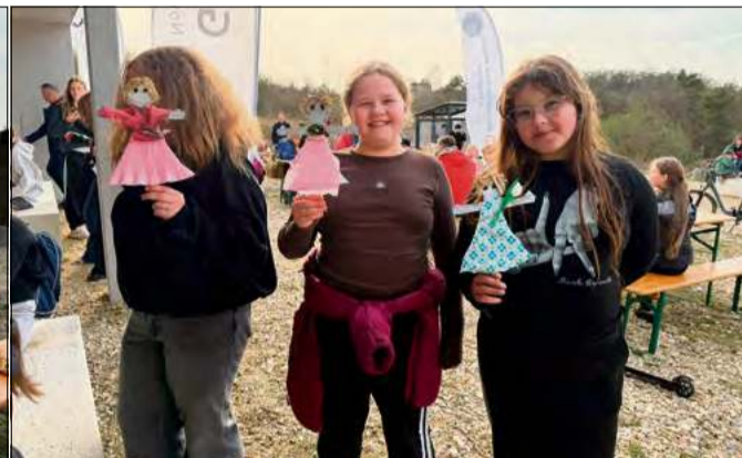
Wydarzenie tradycyjnie już odbyło się w Centrum Bioróżnorodności w Gogolinie.

Głównym organizatorem była Młodzieżowa Rada Miejska w Gogolinie oraz harcerze z 12 DSH „Północ” i 254 DW „Paloma”, przy wsparciu samorządu gminy Gogolin. Warto dodać, że była to pierwsza taka ini-