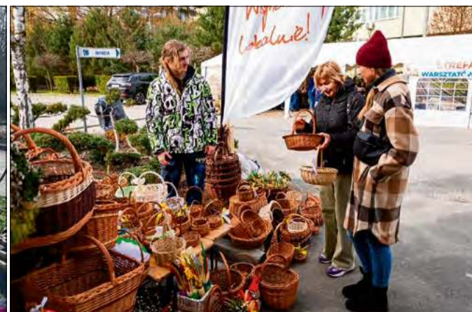
Organizatorzy z tej okazji przygotowali wiele atrakcji.