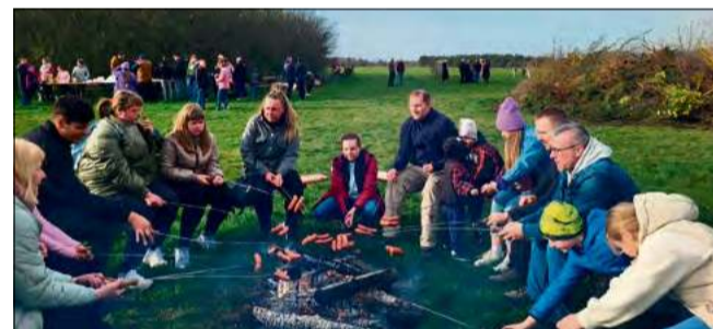
Sołectwa Kamionek i Kamień Śląski połączyły swoje siły i zorganizowały jedno duże wydarzenie.

W pobliżu głównego ogniska, na małym ogniu, każdy mógł sam upiec dla siebie kielbaskę. Te przygotowane zostały przez Sołectwo Kamionek oraz Stowarzyszenie na Rzecz Rozwoju Wsi Kamionek dla wszystkich uczestników spotkania. Obowiązkowo Sołectwo Kamienia Śląskiego przygotowało również