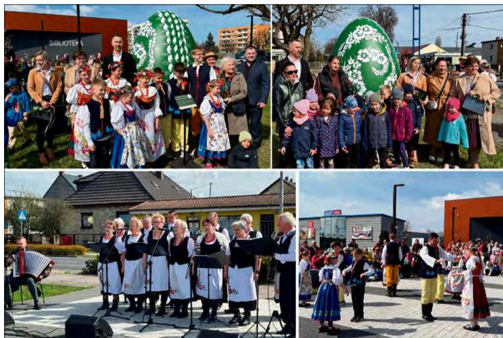
Na kilka dni przed Świątami Wielkiej Nocy w Zdzieszowicach odsłonięto wielką kroszonkę, którą można podziwiać na placu przy miejscowej bibliotece.