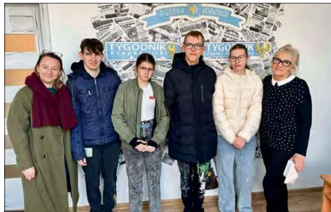
Tradycyjnie przed Wielkanocą odwiedziła nas także wyjątkowa grupa uczniów z Zespołu Szkół Specjalnych im. Juliana Tuwima w Krapkowicach.

Tradycyjnie przed Wielkanocą odwiedziła nas także wyjątkowa grupa uczniów z Zespołu Szkół Specjalnych im. Juliana Tuwima w Krapkowicach. Mili goście przynieśli pięknie wykonaną kartkę i drobny upominek, wpro-