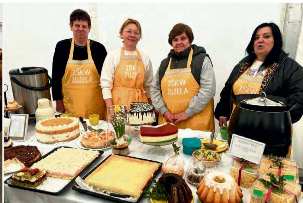
Ręcznie robione pisanki, dekoracje i regionalne przysmaki – kiermasz wielkanocny przyciągnął lokalnych twórców i producentów z całego powiatu.