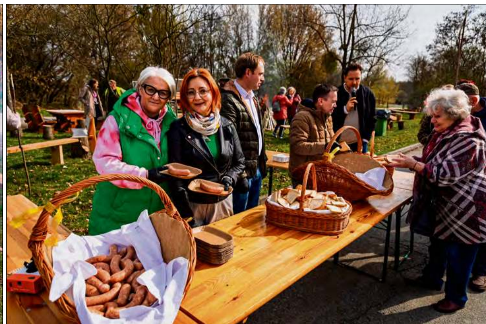
Podczas wydarzenia nie zabrakło wspólnego ogniska.