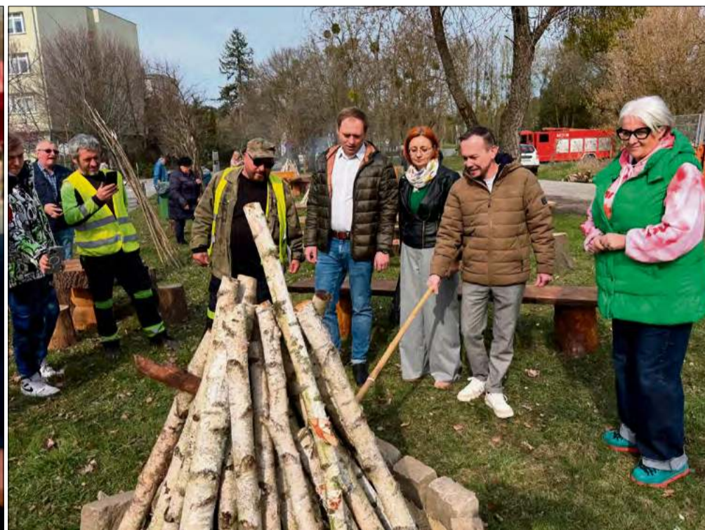
Środa Żurowa w Krapkowicach – mieszkańcy tłumnie wypełnili teren przy Starostwie Powiatowym.

Parking przy Starostwie Powiatowym w Krapkowicach w środowe popołudnie wypełnił się mieszkańcami. Powiat Krapkowicki zorganizował Środę Żurową połączoną z kiermaszem wielkanocnym – wydarzenie, które od lat wpisuje się w kalendarz lokalnych tradycji Wielkiego Tygodnia. Tradycyjnie też pomiędzy Krapkowicami a Gogolinem kursowała darmowa kolejka, która za każdym razem jest nie lada atrakcją.