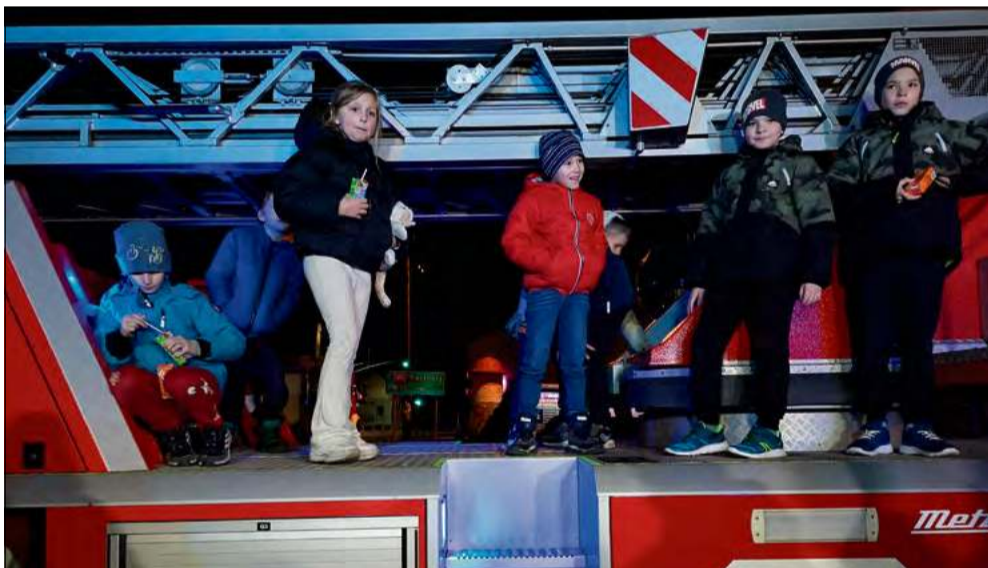
Auto drabina może sięgać aż 32 metrów wysokości i znacząco wzmocni możliwości ratownicze w regionie.