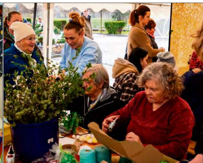
Lokalni rękodzielnicy z dumą prezentowali swoje wyroby, a dzieci podczas wydarzenia tworzyły świąteczne dekoracje.