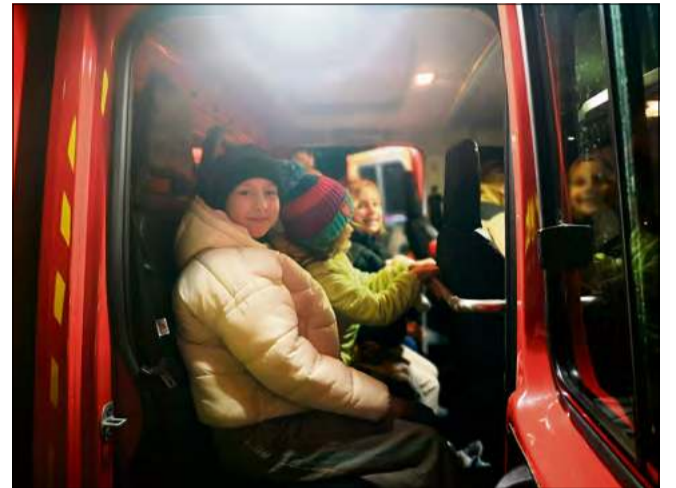
Lekki samochód pożarniczy Iveco będzie wykorzystywany m.in. przy wypadkach drogowych i akcjach ratownictwa technicznego.