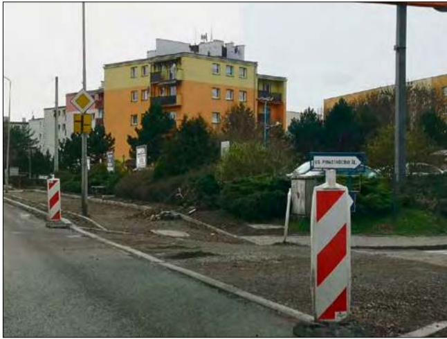
Inwestycja przy ulicy Prudnickiej wyraźnie dzieli mieszkańców.

- Mieszkańcy byli przekonani, że remont będzie realizowa-