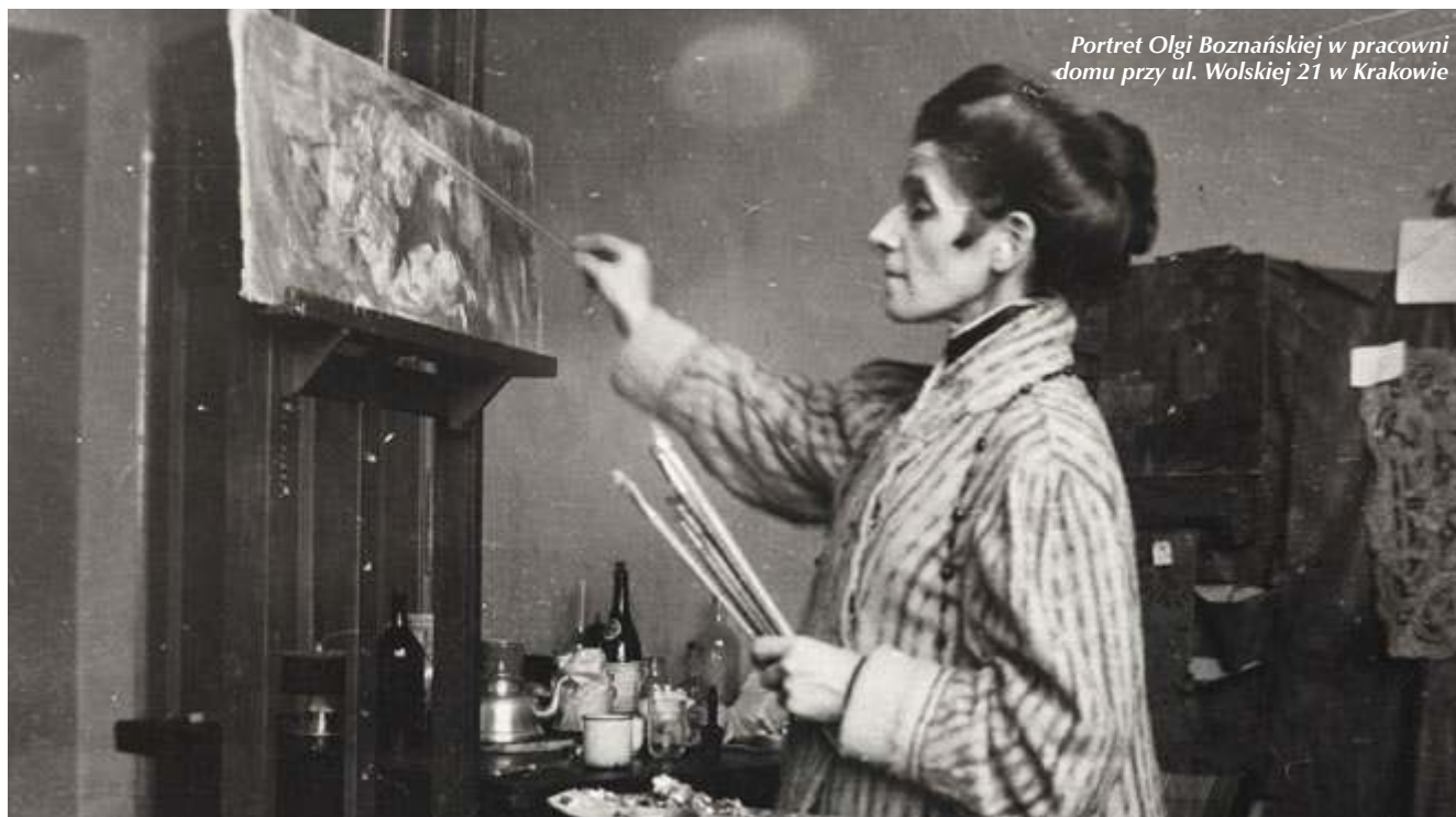
Portret Olgi Boznańskiej w pracowni domu przy ul. Wolskiej 21 w Krakowie