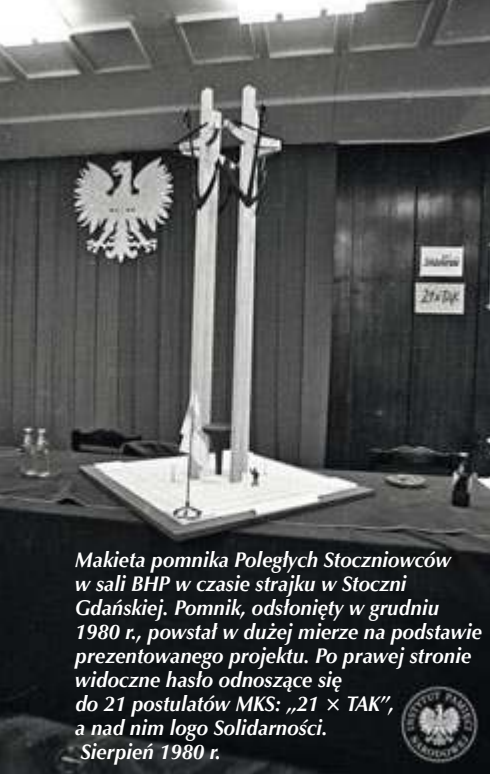
Makieta pomnika Poległych Stoczniovców w sali BHP w czasie strajku w Stoczni Gdańskiej. Pomnik, odsłonięty w grudniu 1980 r., powstał w dużej mierze na podstawie prezentowanego projektu. Po prawej stronie widoczne hasło odnoszące się do 21 postulatów MKS: „21 x TAK”, a nad nim logo Solidarności. Sierpień 1980 r.