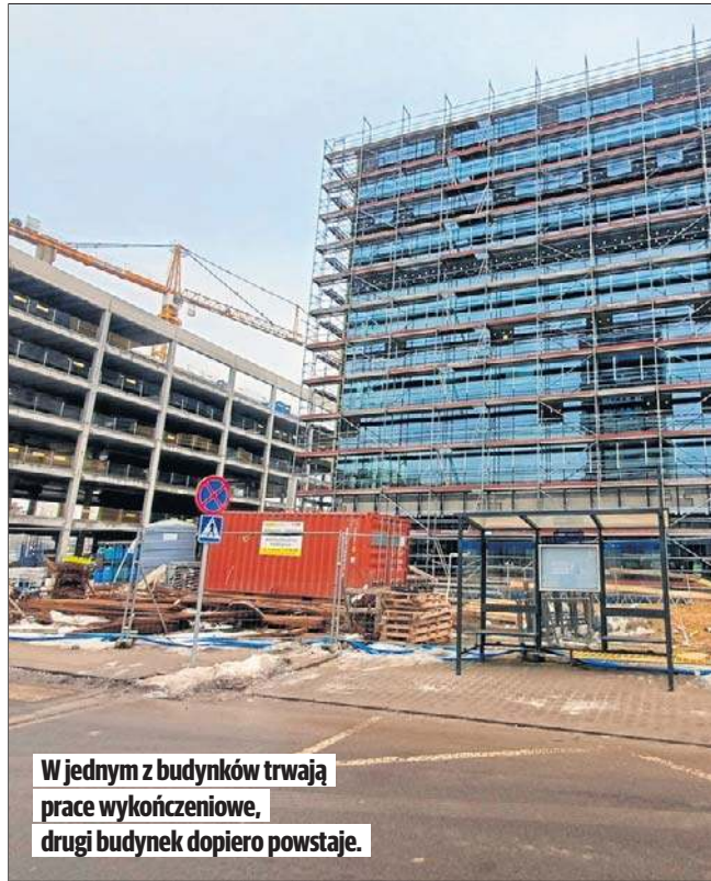
W jednym z budynków trwają prace wykończeniowe, drugi budynek dopiero powstaje.