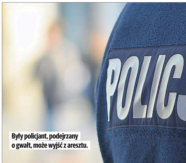
Były policjant, podejrzany o gwałt, może wyjść z aresztu.

W poniedziałek Sąd Rejonowy w Piasecznie zdecydował o uchyleniu tymczasowego aresztowania. W jego miejsce zastosowano poręczenie majątkowe w wysokości 30 tysięcy złotych, dozór policyj-