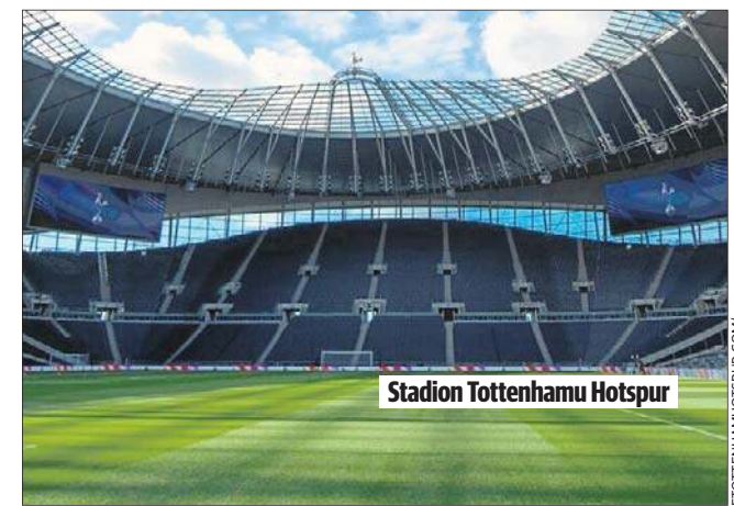
Stadion Tottenhamu Hotspur

UEFA nałożyła na Tottenham także dodatkową karę w wysokości 2250 euro za rzucanie przedmiotami przez kibiców. Ponadto klub dostał zakaz sprzedaży biletów kibicom na jeden mecz wyjazdowy LM, ale tę sankcję zawieszono na rok.