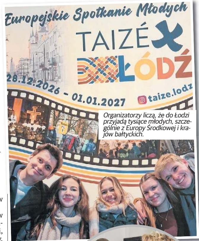
Organizatorzy liczą, że do Łodzi przyjadą tysiące młodych, szczególnie z Europy Środkowej i krajów bałtyckich.