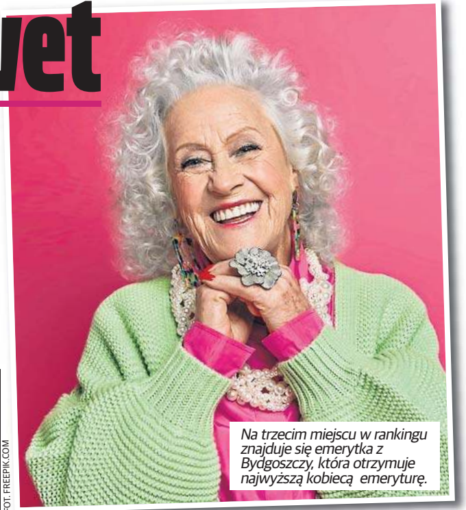
Na trzecim miejscu w rankingu znajduje się emerytka z Bydgoszczy, która otrzymuje najwyższą kobiecą emeryturę.

Już w piątek na konta i do rąk seniorów trafiły pierwsze świadczenia. W tym roku wskaźnik waloryzacji wynosi 5,3 proc. W wyniku waloryzacji kwota najniższej emerytury, renty rodzinnej oraz renty z tytułu całkowitej niezdolności do pracy wzrosną o 99,58 zł i od 1 marca będzie wynosić 1978,49 zł brutto. Do tej samej wysokości wzrosną renta socjalna. Renta z tytułu częściowej niezdolności do pracy i renta szkoleniowa wyniosą 1483,87 zł brutto. Renta z tytułu całko-