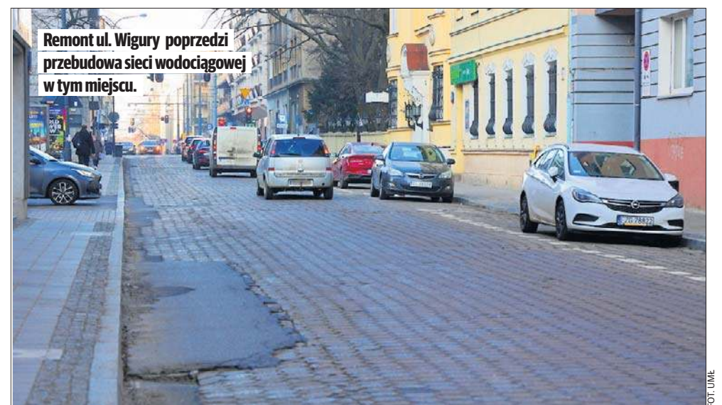
Remont ul. Wigury poprzedzi przebudowa sieci wodociągowej w tym miejscu.

- Podzielenie inwestycji na etapy ograniczy utrudnienia w komunikacji, których nie sposób uniknąć. Po zakońc-