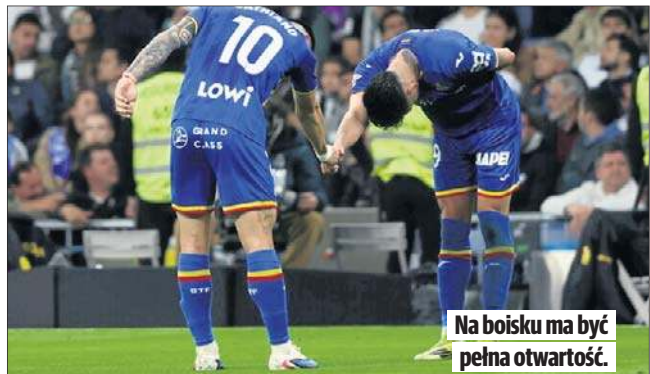
Na boisku ma być pełna otwartość.