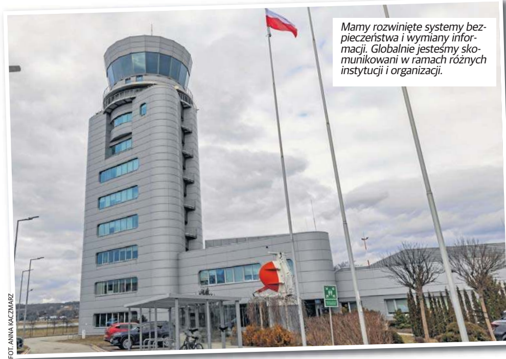
Mamy rozwinięte systemy bezpieczeństwa i wymiany informacji. Globalnie jesteśmy skomunikowani w ramach różnych instytucji i organizacji.

Oczywiście, nie mogę się powstrzymać. Kocham lotnictwo i kocham samoloty.