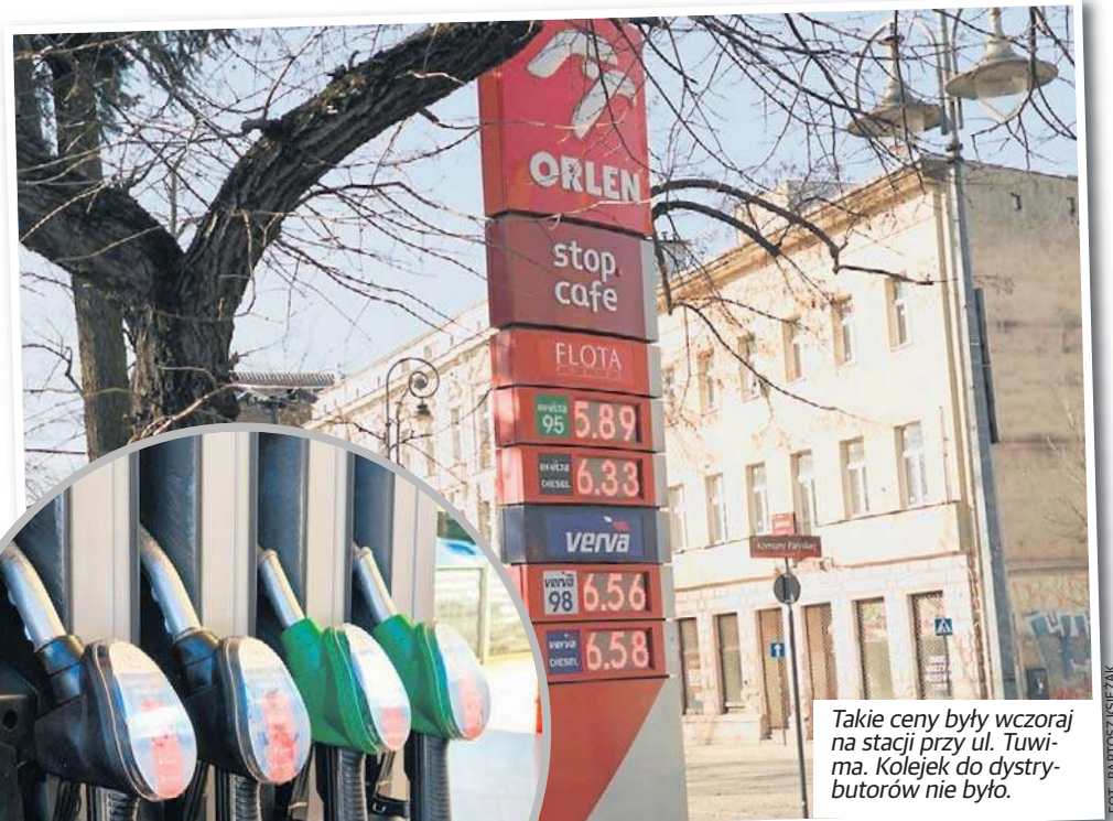
Takie ceny były wczoraj na stacji przy ul. Tuwima. Kolejek do dystrybutorów nie było.

- Obecnie prognozy są obciążone bardzo dużym ryzykiem - zaznacza Urszula Cieślak. Jej zdaniem, ceny spadną dopiero, gdy na rynek dopłyną informacje o ponownej możli-