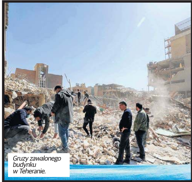
Gruzy zawalonego budynku w Teheranie.

Wszystkie trzy kraje zapewniły, że te przedsięwzięcia -