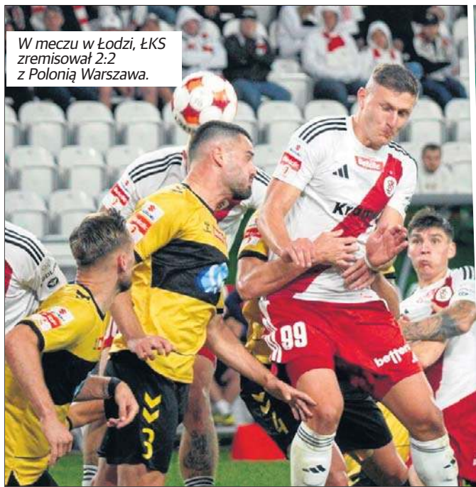
W meczu w Łodzi, ŁKS zremisował 2:2 z Polonią Warszawa.