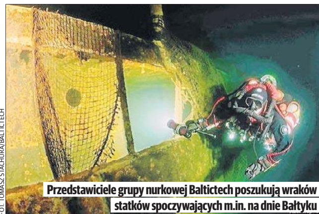
Przedstawiciele grupy nurkowej Baltitech poszukują wraków statków spoczywających m.in. na dnie Bałtyku

Grupa Baltitech skupiająca nurków, poszukiwaczy wraków, chce rozwiązać kwestię