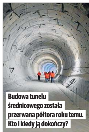
Budowa tunelu średnicowego została przerwana półtora roku temu. Kto i kiedy ją dokończy?

Zakres konsultacji obejmować będzie m.in. zagadnienia dotyczące weryfikacji dalszego harmonogramu robót tunelowych, preferowanego modelu realizacyjnego i podziału ryzyk, możliwych metod zabezpieczenia budynków, w tym obiektów zabytkowych.