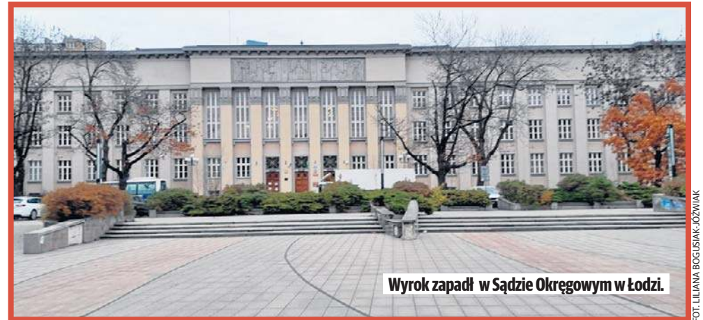
Wyrok zapadł w Sądzie Okręgowym w Łodzi.

Wezwane na miejsce pogotowie przewiozło poszkodowaną do szpitala, gdzie po badaniach lekarze stwierdzili, że pacjentka ma złamaną prawą rękę z przemieszczeniem, złamaną prawą nogę. Po dwóch tygodniach hospitalizacji kobieta została wypisana do domu. W kolejnych miesiącach lekarze wyjęli jej śruby z kości ramienia, wymienili staw kolanowy, a pacjentka rehabilitowała się.