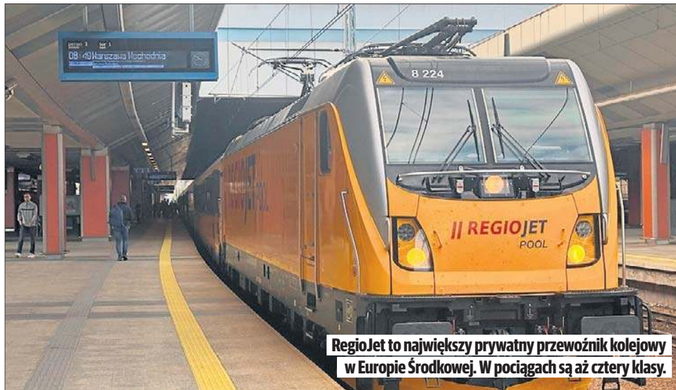
RegioJet to największy prywatny przewoźnik kolejowy w Europie Środkowej. W pociągach są aż cztery klasy.

Jeszcze w tym miesiącu pierwszy z kilkunastu nowych pociągów ma trafić