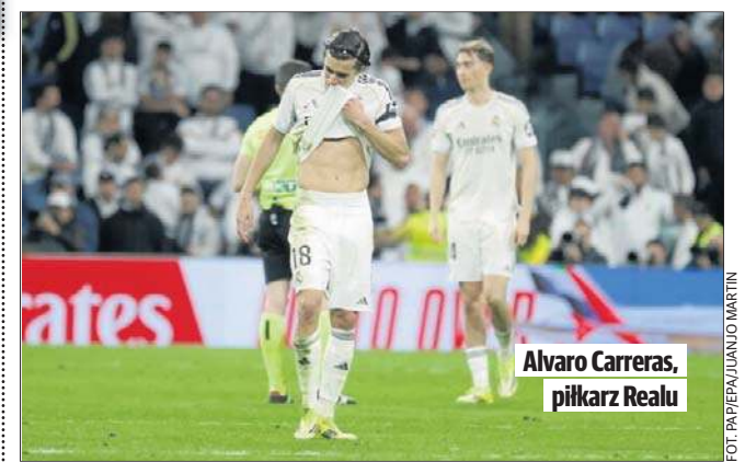
Alvaro Carreras, piłkarz Realu