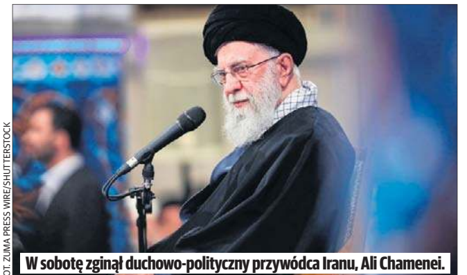
W sobotę zginął duchowo-polityczny przywódca Iranu, Ali Chamenei.