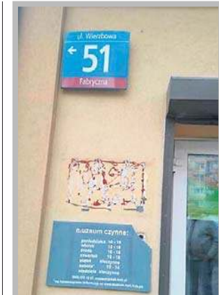
Straty nie są wielkie, ale kradzież zgłoszono na policję.

W Muzeum Komunikacji Miejskiej prezentowane są stare bilety, tablice kierunkowe, mundury pracowników MPK, akcesoria motorniczych i konduktorów oraz fotografie pokazujące historię (128 lat) komunikacji miejskiej w Łodzi. Zbio-