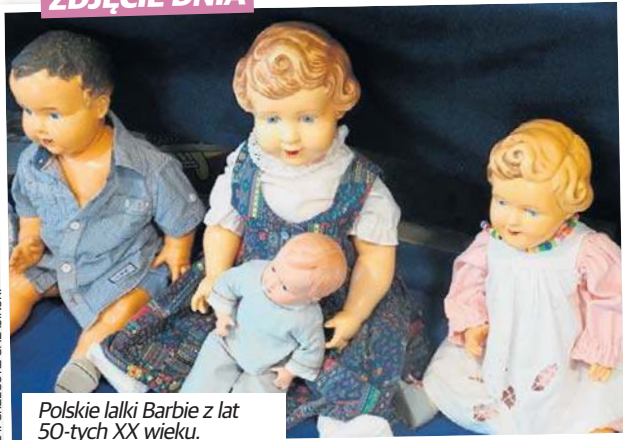
Polskie lalki Barbie z lat 50-tych XX wieku.