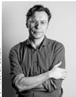
FOT. WOUTEK GÓRSKI