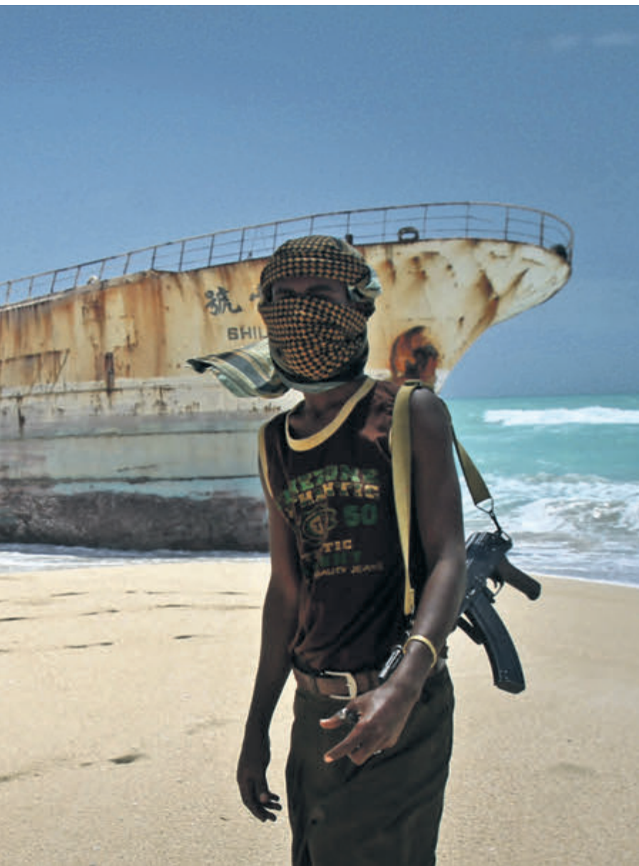
Okolice Hobyo, lądowej bazy somalijczyków piratów

nie 2 maja MT Eureka – sugerują, że Somalijscy współpracują z jemeńskimi rebeliantami z plemienia Huti, uchodzącymi za wiernych sojuszników Iranu. – Jest taka możliwość – przyznał jeden z urzędników kierujący formalnie portami w „pirackim” Puntlandzie, w rozmowie z dziennikiem „The New York Times”. Kontakty z Huti piraci nawiązali kilkanaście lat temu, bo Jemeńczycy byli doskonałym źródłem taniej broni i urządzeń służących do nawiązywania łączności.