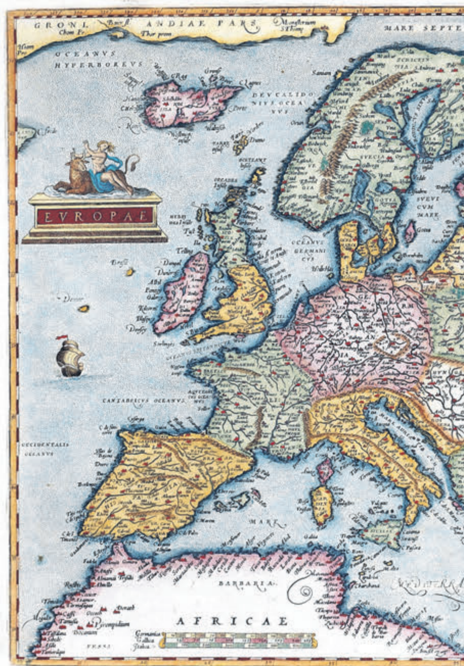
Mapa Europy w 1579 r. autorstwa flamandzkiego kartografa Abrahama Orteliusa

Elledge sporo miejsca poświęca czasom nowoczesnym, ale na początku uczciwie cofa się do początku – do momentu, gdy wynaleziono granice, a wraz z nimi tożsamości polityczne. Co było pierwsze? Jajko (granice) czy kura (tożsamości)? Oczywiście nie da się tego klarownie wyjaśnić, zwłaszcza że przez dziesiątki tysięcy lat, z uwagi na skąpe zaludnienie, grupy ludzkie tworzyły raczej małe, oddalone od siebie wyspki, rozdzielone oceanem dzikiej przyrody. „To prawdopodobnie nie przypadek, że pierwszą znaną nam granicą jest (...) linia między Górnym a Dolnym Egiptem” – pisze Elledge. „Dolina Nilu była jednym z nielicznych miejsc wystarczająco urodzajnych i zamożnych, by utrzymać dwa sąsiadujące, konkurencyjne państwa”.