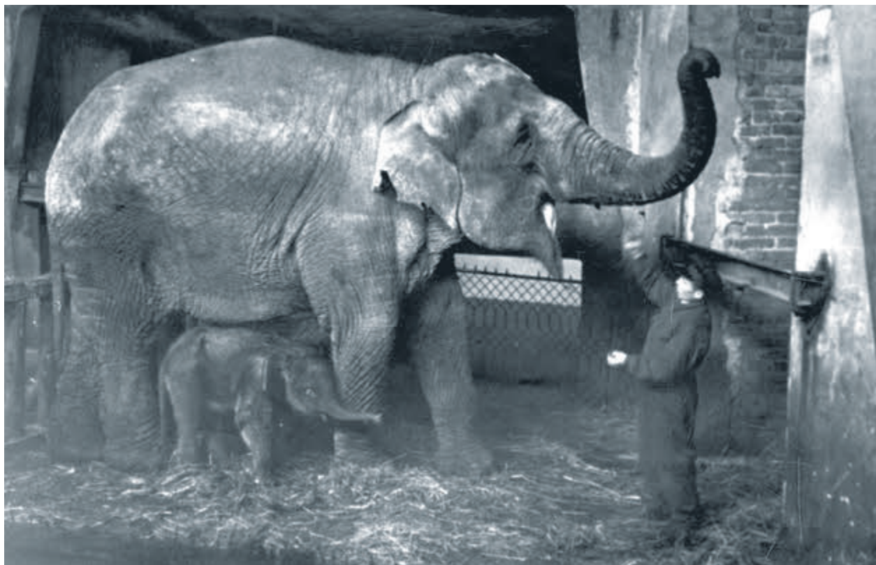
Słonica Tuzinka w warszawskim ogrodzie zoologicznym, Warszawa 1937 r.