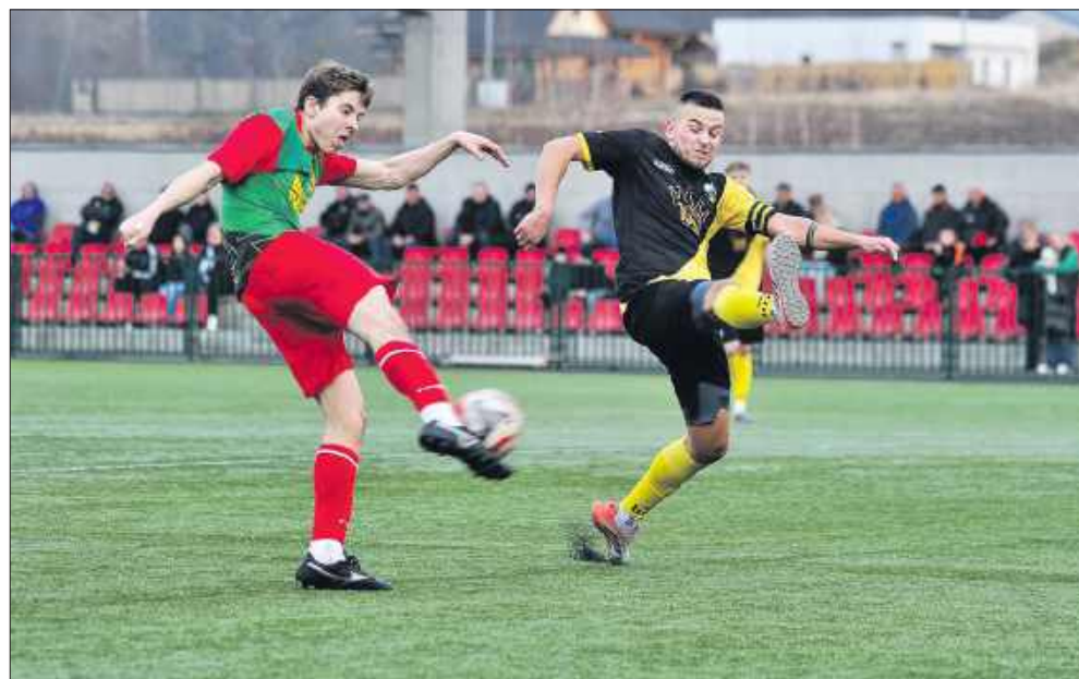
■ Zaległy mecz ligi okręgowej pomiędzy Silesia Lubomia - Ruch Stanowice

Zamiast sportowego święta, po ostatnim gwizdku oglądaliśmy obrazki pełne niedosytu i sportowej złości. Czy arbi-