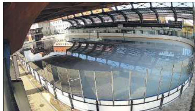
■ Lodowisko w Pszowie zakończyło sezon 28 lutego

W obiekcie funkcjonuje również wypożyczalnia łyżew i szlifiernia. Podczas minionego sezonu wypożyczonych zostało prawie 20 tys. par łyżew. Obsługa lodowiska naostrzyła też ponad 1,3 tys. par. - W ubiegłym roku, tuż przed otwarciem sezonu, modernizację