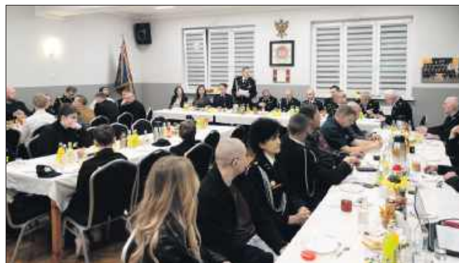
Zebranie sprawozdawczo-wyborcze odbyło się w sobotę 28 lutego