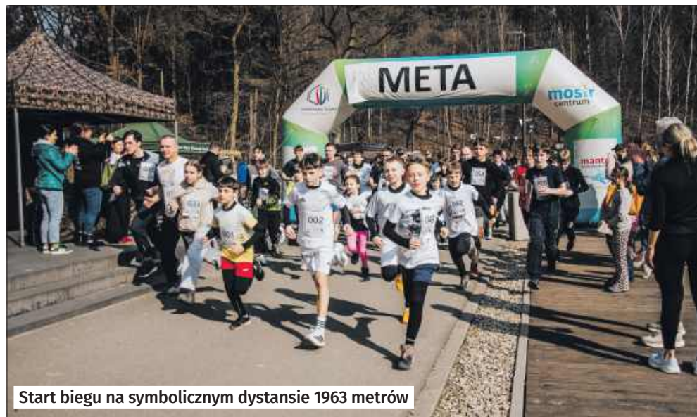
Start biegu na symbolicznym dystansie 1963 metrów

„Tropem Wilczym” to również sposób na zachowanie pamięci o tych, którzy zostali zapomniani przez władze PRL-u i przez długie lata byli demonizowani. Żołnierze Wyklęci to ludzie, którzy w większości przypadków walczyli w lesie, w konspiracji, nie zważając na ogromne trudności i represje. W 2011 roku rozpoczęła się ogólnopolska inicjatywa organizowania tego biegu, a z każdą edycją rośnie liczba uczestników, co świadczy o rosnącym zainteresowaniu tą częścią historii Polski.