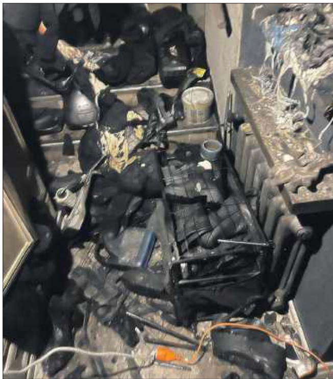
■ Do pożaru doszło w sobotę (31.01) w budynku jednorodzinym przy ulicy Radlińskiej. Zdarzenie spowodowało ogromne szkody.

- Jestem polonistką, oligofrenopedagogiem oraz instruktorem tańca. Pracuję w Zespole Szkolno-Przedszkolnym nr 7 w Wodzisławiu Śląskim, który wsparł mnie bardzo po tej tragedii, cały sztab ludzi z dyrektorem na czele walczyli o nasze lepsze