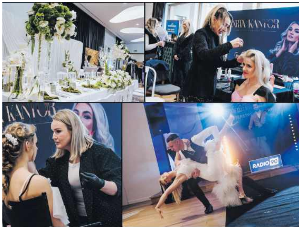
■ Targi ślubne odbyły się w niedzielę 1 marca

Podczas targów ślubnych swoje oferty zaprezentowało szerokie grono wystawców reprezentujących nie tylko branżę ślubną, lecz także szeroko pojęty sektor rozrywki. W trakcie wydarzenia odbyły się