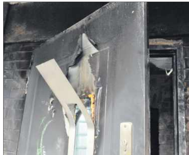
■ Uszkodzone od ognia drzwi wejściowe

- Śmierć mojego męża była dla syna ogromną tragedią. Niestety mąż zmarł tragicznie 5 lat temu. To jest niewyobrażalna tragedia, której nie można przekazać. W zeszłym roku zmarli oboje moi rodzice, a w tym roku pożar. To właśnie od śmierci męża rozpoczął