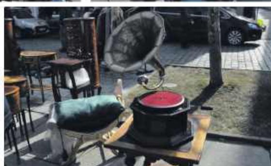
■ Do Wodzisławia przyjechali wystawcy i pasjonaci z całej Polski.

dżety i unikatowe akcesoria z dawnych lat.