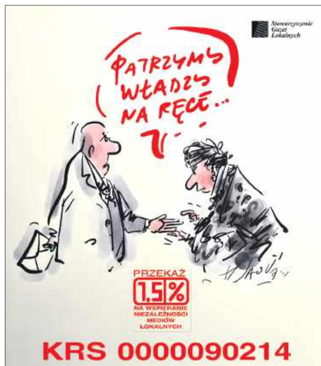
■ Grupa wydawców gazet lokalnych, należących do SGL

To niewielki gest, który wzmacnia coś bardzo konkretnego: niezależne media tam, gdzie zaczyna się codzienne życie.