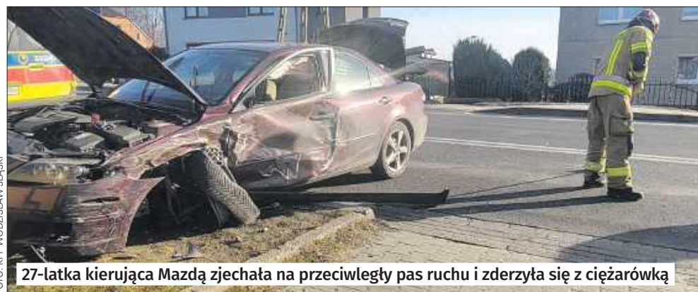
27-latka kierująca Mazdą zjechała na przeciwległy pas ruchu i zderzyła się z ciężarówką