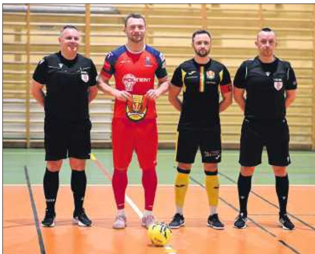
■ Inter Krostoszowice – BKS Stal Futsal Bielsko-Biała / Futsal 2026

Mimo sportowego niedosytu, Inter Krostoszowice patrzy w przyszłość. Futsal w powiecie wodzisławskim