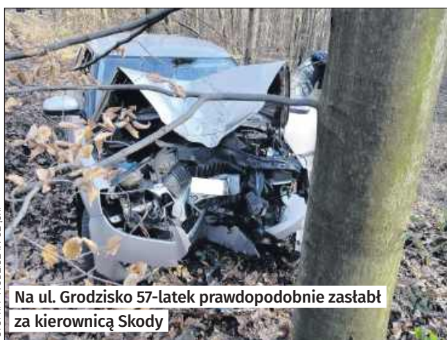
Na ul. Grodzisko 57-latek prawdopodobnie załazł za kierownicą Skody