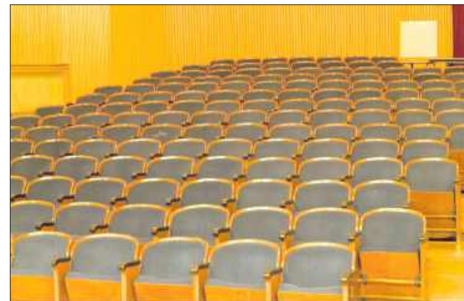
■ W domu kultury w Radlinie zostaną wymienione fotele dla widzów

Z kolei sala MOK w Radlinie również przejdzie