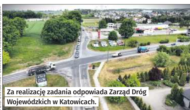
Za realizację zadania odpowiada Zarząd Dróg Wojewódzkich w Katowicach.

Budowa ronda ma uporządkować ruch na skrzyżowaniu, ograniczyć liczbę punktów kolizyjnych, poprawić widoczność i bezpieczeństwo pieszych, a także uspokoić ruch na wlocie do miejscowości.