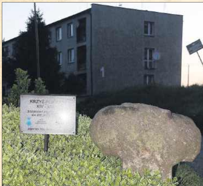
■ Krzyż pokutny w Lyskach przy ul. Bogunickiej

Monolityczne krzyże znaleźć możemy w całej Polsce. Największy z nich znajduje się w Stargardzie Szczecińskim, ma niecałe 4 metry i 2 tony. Na Śląsku znajdziemy liczne mniejsze krzyże wykonane z jednego bloku kamienia. Wszystkie niosą ze sobą tragiczną historię. Krzyże pokutne zaczęto stawiać na ziemiach polskich od XIII wieku. Był to ostatni etap pokuty człowieka winnego morderstwa. Zanim morderca postawił krzyż, musiał m.in. pokryć koszty pogrzebu ofiary i sądu, udać się boso pielgrzymką do świętego miejsca, a później po postawieniu krzyża pojednać się z rodziną ofiary, którą miał za zadanie utrzymywać. Zabójca musiał także złożyć dar ołtarza w lokalnym kościele, np. w