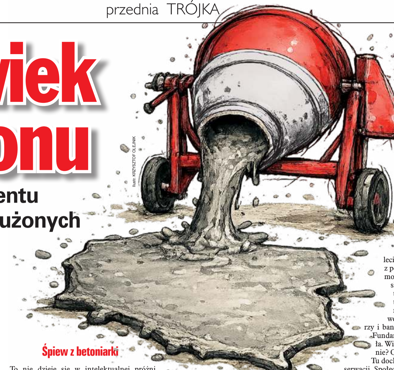
ilustr. KRZYSZTOF OLEJNIK

Drapacze chmur może projektują Amerykanie, ale ktoś musi wnieść cegłę na dwudzieste piętro. Niemcy robią samochody. Szwedzi – meble i prezerwatywy. Włosi – pizzę. Ale żaden z nich nie miałby gdzie tej pizzy jeść, gdzie tej prezerwatywy użyć ani gdzie zaparkować tego samochodu, gdyby nie polski budowlaniec.