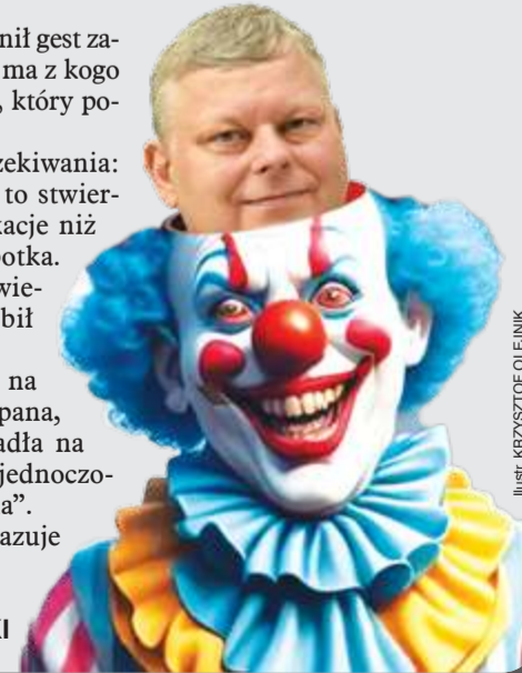
ilustr. KRZYSZTOF OLEJNIK