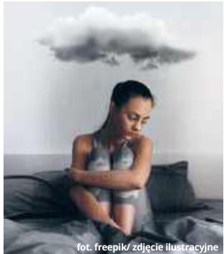
zdjęcie ilustracyjne

W najbliższą niedzielę, 23 lutego, obchodźmy Ogólnopolski Dzień Walki z Depresją. Święto zostało ustanowione przez Ministerstwo Zdrowia w 2001 roku. Celem obchodów jest upowszechnianie wiedzy na temat tej choroby oraz lepsze zrozumienie tego, czym jest depresja i w jaki sposób można jej zapobiegać i leczyć, aby zachęcić więcej osób do szukania pomocy. Należy bowiem pamiętać, że depresja jest uleczalna.