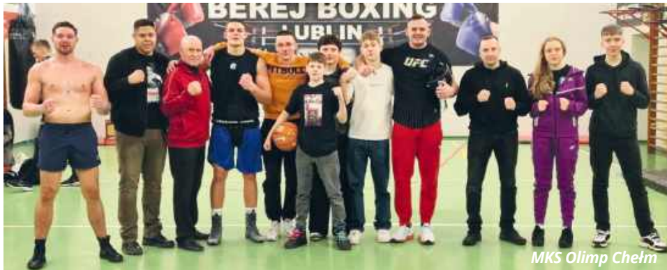
MKS Olimp Chełm