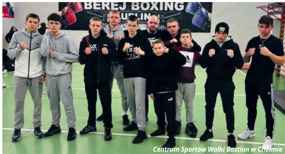
Centrum Sportów Walki Bastion w Chełmie