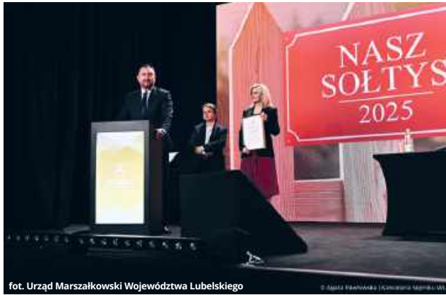
Uroczystość wręczenia nagród w ramach konkursu „Nasz Sołtys” 2025.

Trzy prestiżowe konkursy: „Rolnik z Lubelskiego”, „Ekolubelskie” i „Nasz Sołtys” ponownie otwierają swoje drzwi dla mieszkańców wsi w województwie lubelskim. Inicjatywy te, organizowane już po raz kolejny, mają na celu wyróżnienie rolników osiągających wysokie wyniki w produkcji i ekologii, a także aktywnych sołtysów działających na rzecz lokalnych społeczności. Konkursy promują nowoczesne i zrównoważone rolnictwo, przedsiębiorczość oraz zaangażowanie w rozwój obszarów wiejskich, podkreślając ich znaczenie dla regionu.