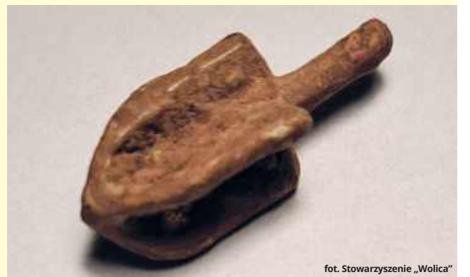
fol. Stowarzyszenie „Wolica”

- Przed powstaniem państwa Izrael w 1948 r. na wszystkich drejdelach znajdowały się litery nun (נ), gimel (ג), he (ה) i szin (ש), które są pierwszymi literami słów w zdaniu: Nes gadol haja