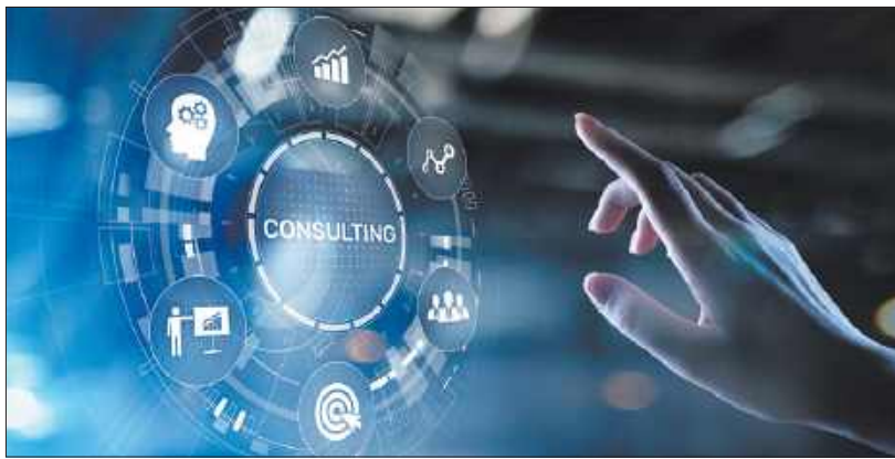
ADOBE EXPRESS NA PODSTAWIE LICENCJI PRZEKAZANEJ PRZEZ LCIT

Lubelska Agencja Wspierania Przedsiębiorczości w Lublinie zaprasza przedsiębiorców do skorzystania z dofinansowania projektu w ramach programu Fundusze Europejskie dla Lubelskiego 2021-2027. Tym razem, w ramach Działania 2.5 Usługi dla MŚP alokacja wynosi blisko 13 milionów zł. O dofinansowanie mogą starać się mikro, małe i średnie firmy. Wsparcie dotyczy będzie zakupu specjalistycznych, proinnowacyjnych usług wsparcia świadczonych przez ośrodki innowacji. Choć brzmi enigmatycznie, jest bardzo proste. Zaczniemy od początku.