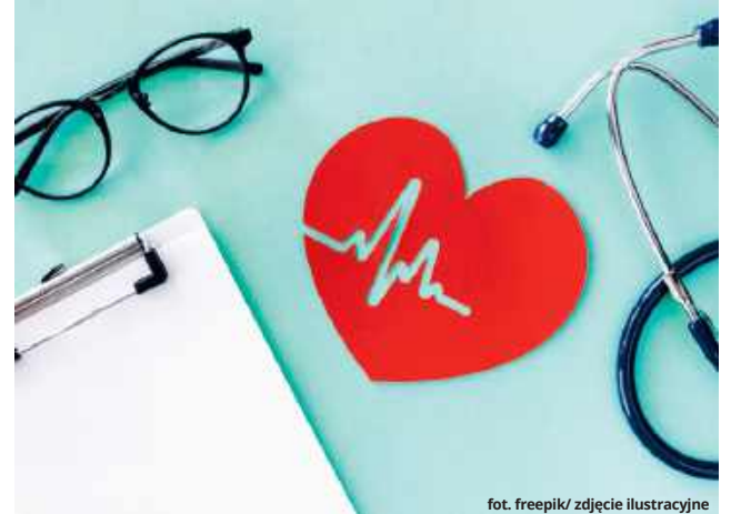
fol. freepik/ zdjęcie ilustracyjne

Skierowany jest do osób, które: są w wieku od 35 do 65 roku życia; są obciążone czynnikami ryzyka takimi jak: palenie tytoniu, nadciśnienie, niska aktywność ruchowa, nadwaga i otyłość, nadmierny stres czy obciążenia genetyczne; nie mają dotychczas rozpoznanej choroby układu krążenia, cukrzycy, przewlekłej choroby