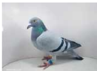
Najlepszy Lotnik Oddziału Krasnostaw w 2024 r. 2 Lotnik Okręgu Lublin i 3 Regionu VII Wschód

merze PL-0210-21-6118 pojawił się w gołębniku 30 czerwca 2024 roku o godzinie 17:39:56, pokonując dystans 1292 km 260 m. Dało mu to tytuł 10 Lotnika w Strefie IV.