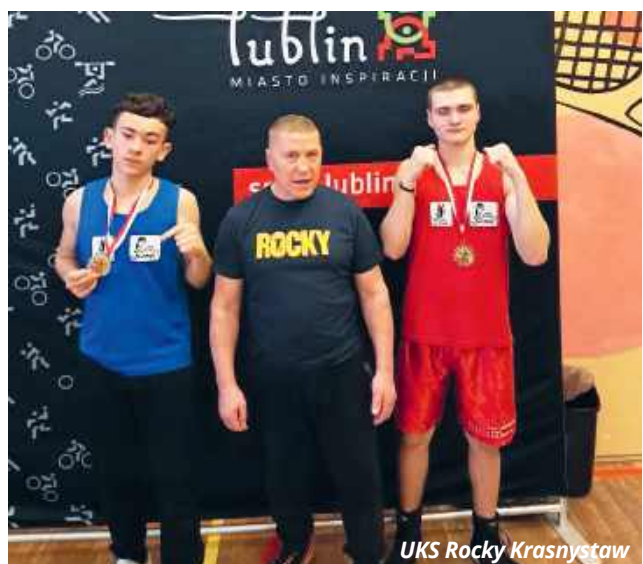
UKS Rocky Krasnystaw