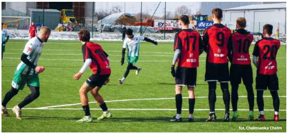
fol. Chełmianka Chełm