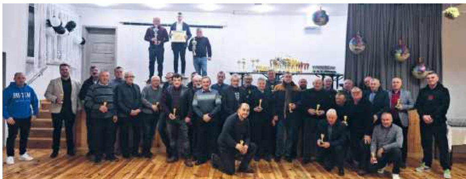
Rozdanie nagród w oddziale za sezon 2024