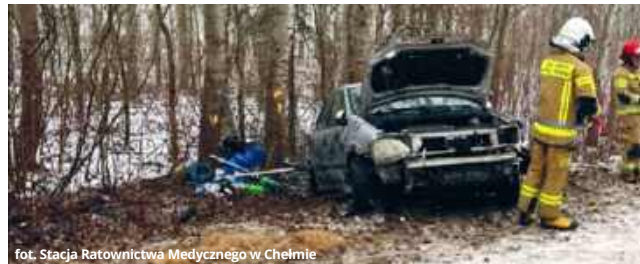
fol. Stacja Ratownictwa Medycznego w Chełmie

Do podobnego zdarzenia doszło tego samego dnia około godziny 16:00. Auto wpadło w poślizg i zjechało do rowu przy lesie w okolicach Wojsławic.