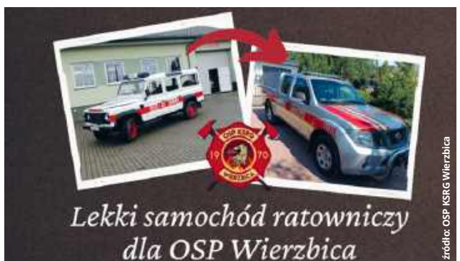
Lekki samochód ratowniczy dla OSP Wierzbica