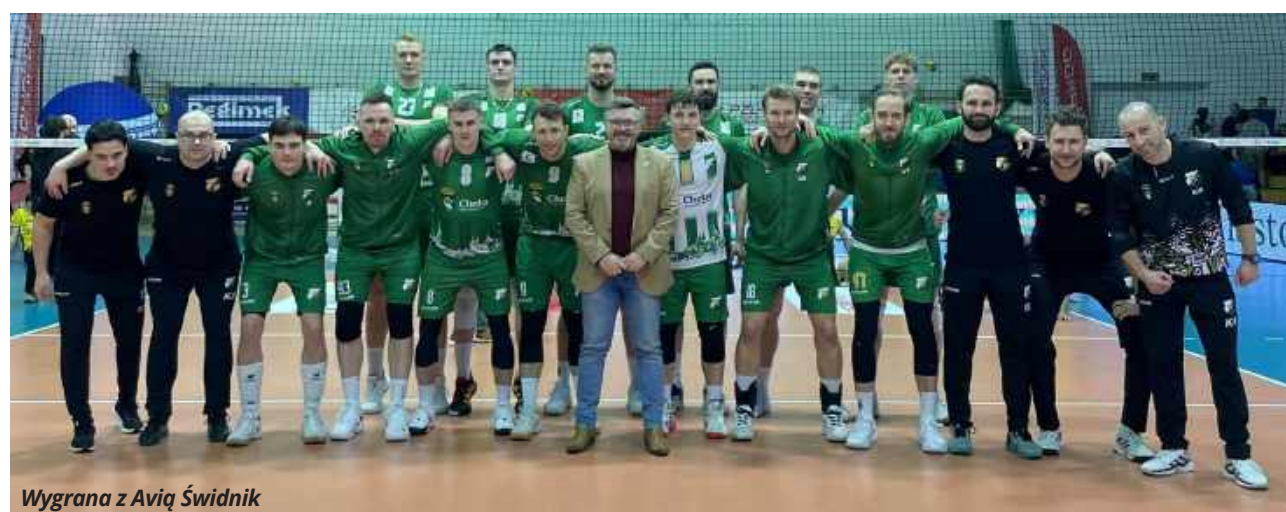
Wygrana z Avią Świdnik

Więcej zdjęć z meczu pucharowego na supertydzien.pl MP, KM