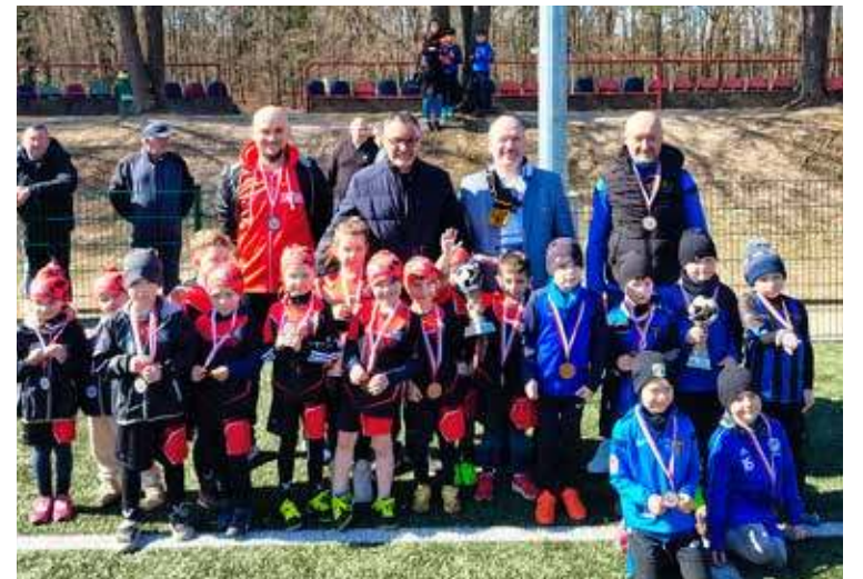
Pamiątkowe zdjęcie na chwilę po wręczeniu medali najmłodszym piłkarzom