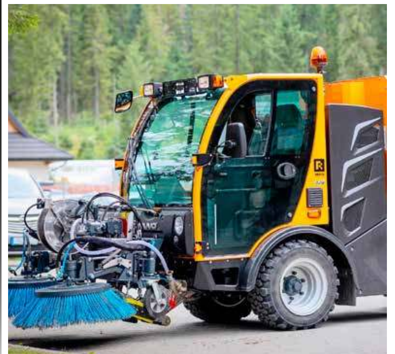
Nowym nabytkiem gminy może stać się zamiatarka uliczna. Jeśli wszystko pójdzie dobrze to dostawa odbędzie się jeszcze w tym roku. Foto. ilustracyjne