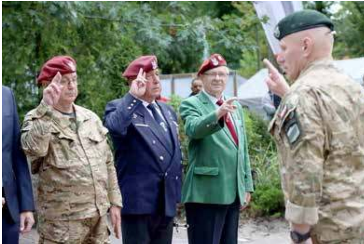
Odnaczenia dla nowogardzian

Już tradycyjnie w trakcie spaceru parkiem miejskim przy ul. Remonta można było z bli-