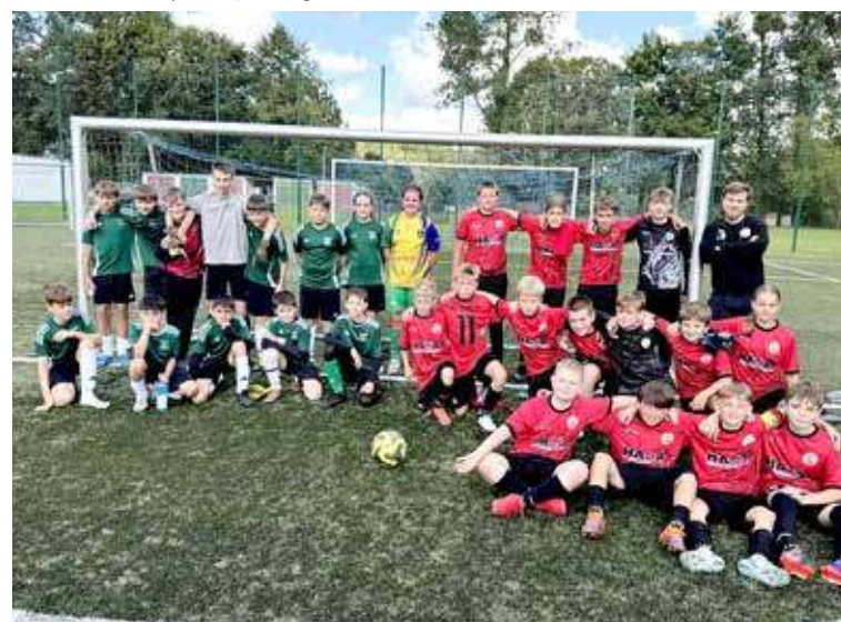
Wspólne zdjęcie obu drużyn na stadionie w Nowogardzie