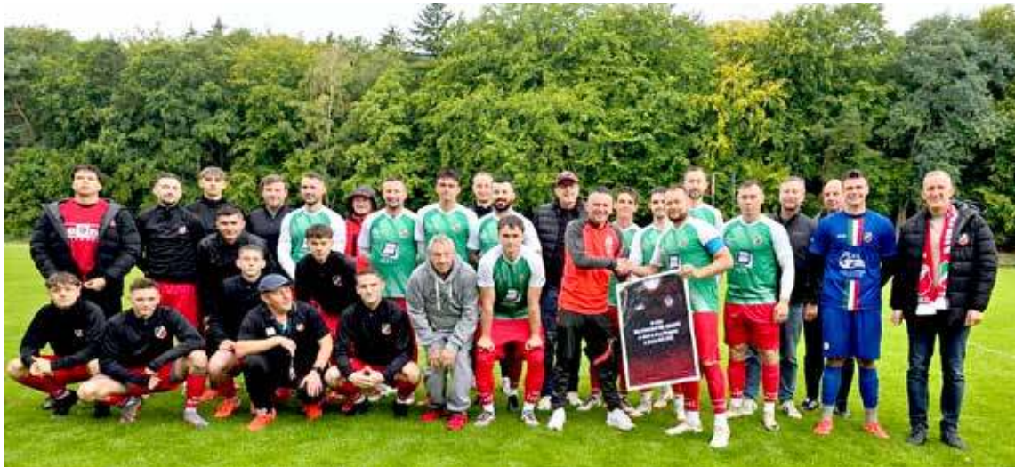
Drużyna jeszcze przed meczem odebrała gratulacje od prezesa ZZPN Macieja Matejki.

W sobotę MKS Pomorzanie 1964 Nowogard rozegrał swój pierwszy mecz w klasie okręgowej przed własną publicznością. Debiut na tym poziomie rozgrywkowym wypadł okazale. Jeziolak Szczecin został odprawiony z bagażem czterech bramek. Również w tabeli sytuacja wygląda nieźle, gdyż nasz zespół plasuje się już na trzecim miejscu.