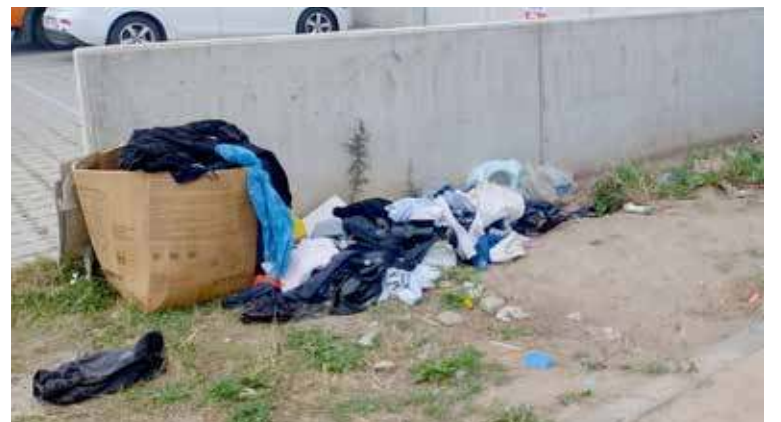
Kontenery na odzież z ul. Bankowej zniknęły, ale problem pozostał