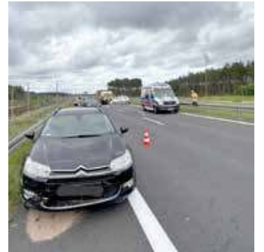
W sumie trzeba było udzielić pomocy aż siedmiu osobom

Jakby tego było mało, to w trakcie działań ratowniczych doszło do drugiej kolizji na przeciwnym pasie ruchu w kierunku Świnoujścia, z udziałem