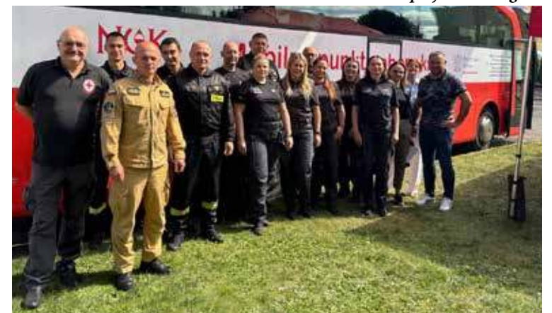
Uczestnicy akcji w środę 20 sierpnia br.