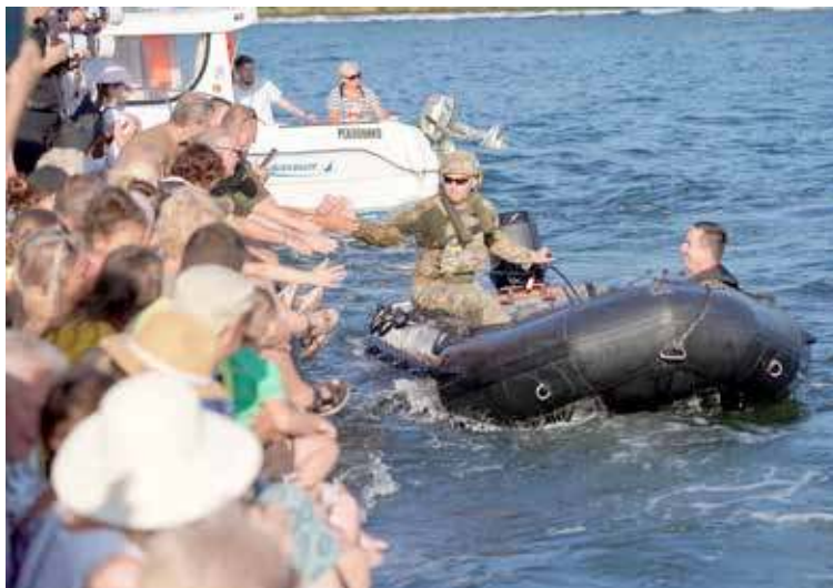
Tłumy zwiedzających w okolicy nabrzeża

Rozpoczęcie nastąpiło o godz. 17.00 w piątek, gdy na maszt wciągnięta została, przy hymnie narodowym, biało-czerwona flaga. To też ważny moment dla kilku mieszkańców naszej gminy. W trakcie uroczystości