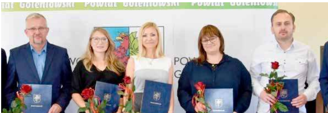
Akty nadania zostały wręczone nauczycielom zaraz po ślubowaniu