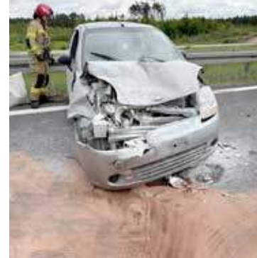
Jedno z aut, które brało udział w poważnej kolizji

stępy Państwowej Straży Pożarnej, dwa Zespoły Ratownictwa Medycznego oraz Policja.