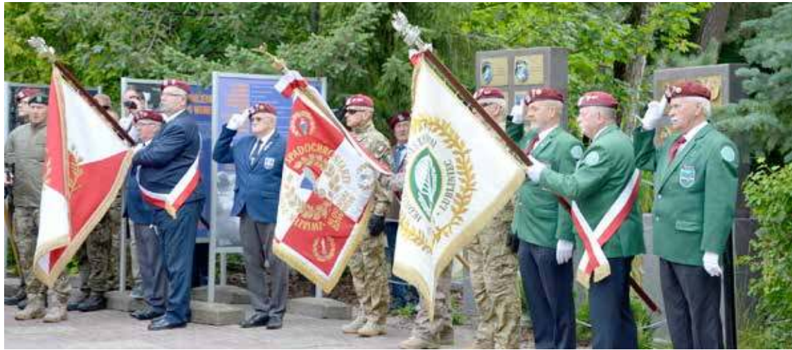
W trakcie apelu sztandar Komandosów z Dziwnowa

ska obejrzyć pokazy elitarnych jednostek komandosów (m.in. Agat, JWK Lubliniec, czy Formoza), zobaczyć nowoczesny sprzęt, rekonstrukcje historyczne, czy wykłady historyczne.