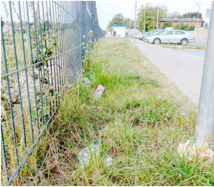
Przynajmniej jeden kosz na odpady przydałby się na terenie wzdłuż łącznika Dworcowej

- Tylko w tym roku udało się już zastąpić 40 starych pojemników nowymi, estetycznymi i bardziej funkcjonalnymi. Zgodnie z zapowiedziami, do końca września liczba wymienionych koszy wzrośnie do 80. Nowe kosze pojawiają się przede wszystkim w miejscach najbardziej uczęszczanych, ale i również na terenach wiejskich – przy przystankach, w parkach, na skwerach i w pobliżu szkół. Ich atutem jest nie tylko nowoczesny wygląd, ale także większa pojemność i odporność na uszkodzenia. Dzięki temu mają służyć mieszkańcom i jednocześnie poprawić estetykę przestrzeni. Do końca września nowe kosze