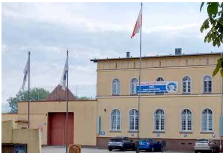
Teren został oflagowany w dniu 18 sierpnia br

Zgodnie z tłumaczeniami, powodem organizacji protestu jest brak realizacji świadczenia mieszkaniowego, pomimo podpisanego porozumienia, jak również brak uzgodnionej w porozumieniu podwyżki uposażeń dla funkcjonariuszy oraz wynagrodzeń dla pracowników cywil-