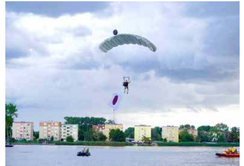
Efektowne skoki do wody ze śmigłowca