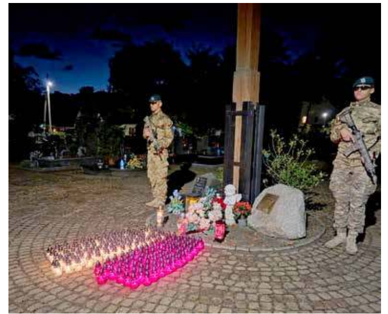
Wieczorny apel na cmentarzu w Dziwnowie

To nie tylko wielka radość i podziękowania za organiza-