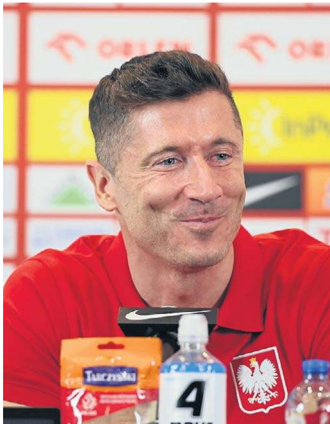
Kapitan kadry Robert Lewandowski w meczu z Albanią zagra w masce ochronnej

Lewandowski do Polski przyleciał swoim odrzutowcem już w niedzielę. Z racji zaawansowanego wieku (w sierpniu skończy 38 lat) walczy o swój ostatni, trzeci mundial w karierze. Gra w Stanach Zjednoczonych wydaje mu się być pisana. Nawet jeśli - odpukać! - Polska nie awansuje na turniej to jest duża szansa, że w tamtejszej Major Soccer League podpisze swój ostatni, duży kontrakt, gdyby tego miała mu nie zaferować Barcelona. W każdym razie na pewno za ocean przeniesie się trzy lata młodszy od niego Antoine Griezmann. Francuz po przegranych przez Atletico