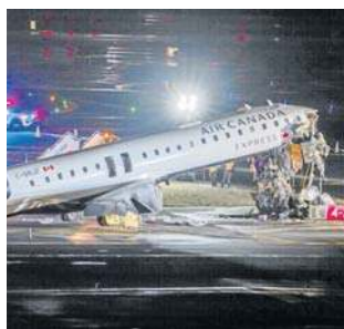
Samolot zderzył się z wozem strażackim w trakcie lądowania na lotnisku LaGuardia w Nowym Jorku