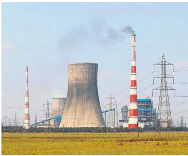
- To nie jest „atom zamiast OZE”. To kwestia kolejności i roli w miksie energetycznym - tłumaczy Dzie duszyski

- Przemysł energochłonny nie ma dostępu do taniej energii bazowej i albo przenosi produkcję, albo bankrutuje - wskazuje prezes ETIC i zaznacza, że dodat-