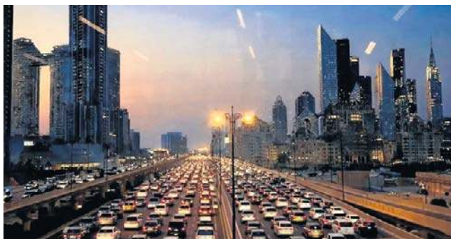
Polka mieszkająca w Dubaju od 20 lat obala mity i pokazuje, jak naprawdę wygląda prowadzenie biznesu w emiracie

Jesteśmy dobrze informowani, dowództwo obrony robi live'y z informacjami i instrukcjami. Wczoraj mieliśmy tylko jedno ostrzeżenie o ataku. Dostaliśmy komunikat na komórki, żeby się schronić, a potem drugi, że już jest bezpiecznie. Poza tym wszyscy chodzą normalnie do pracy, biznesy działają normalnie. System edukacji funkcjonuje jak zwykle i żadne zmiany nie