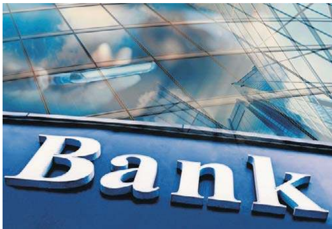
Banki w Polsce mają za sobą rekordowy rok. Do akcjonariuszy może trafić nawet 25 mld zł dywidend, choć wyniki w 2026 r. mogą być już słabsze

Należy jednak pamiętać, że bank w ubiegłym roku na poczet zaliczki dywidendy przeznaczył już 448 551 276,72 zł. Zaliczka na poczet dywidendy na jedną akcję wynosiła 3,44 zł brutto. Ostatecznie wyniki za ubiegły rok dopiero poznamy.