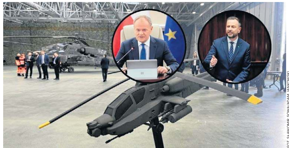
Władysław Kosiniak-Kamysz: Silna polska armia, dobrze wyposażony żołnierz Wojska Polskiego to gwarancja bezpieczeństwa

Jak mówił, silna polska armia, dobrze wyposażony żołnierz Wojska Polskiego to gwarancja bezpieczeństwa. - 96 Apache'ów to druga na świecie armia śmigłowców bojowych produkcji amerykańskiej, zaraz po Stanach