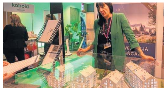
Ostatni weekend marca w Hotelu Marriott może okazać się dobrą okazją do rozpoczęcia nowych planów