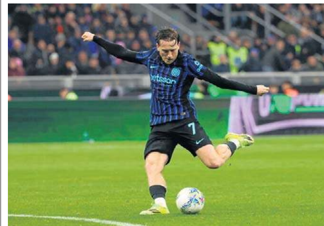
W sobotę Piotr Zieliński stał się bohaterem Interu, strzelając zwycięskiego gola w hicie z Juventusem