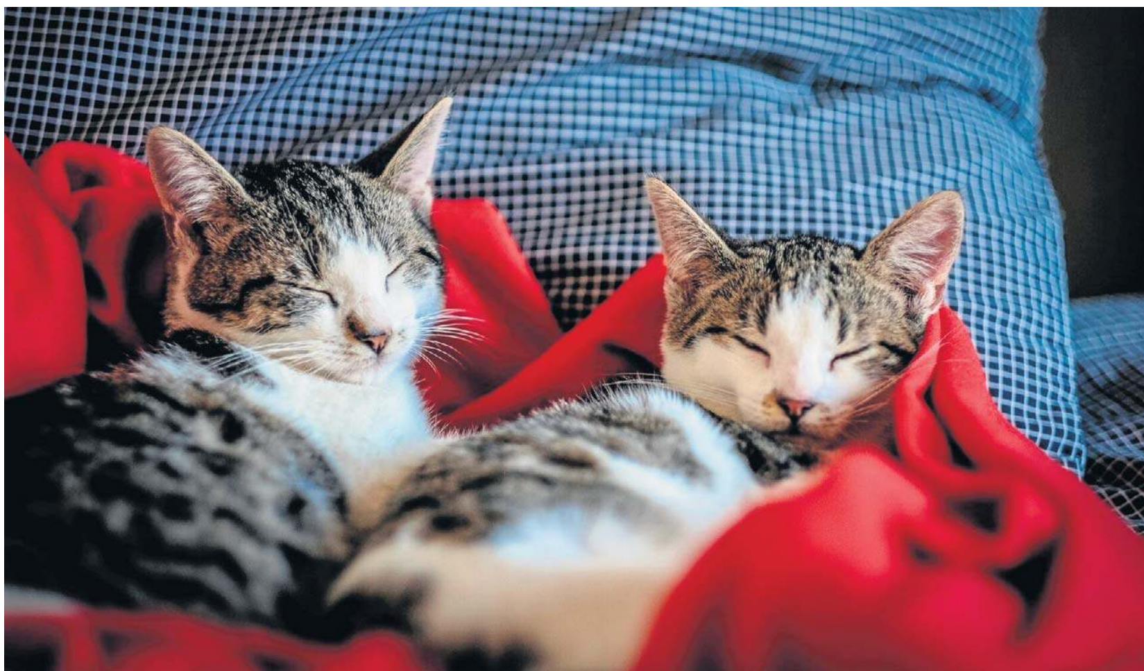
Dzień Kota obchodzi się w Polsce 17 lutego oraz 8 sierpnia. Ma on podkreślić znaczenie obecności kotów w naszym codziennym życiu

Im bardziej dziecko było przywiązane do zwierzęcia, tym bardziej czuło się sprawne,