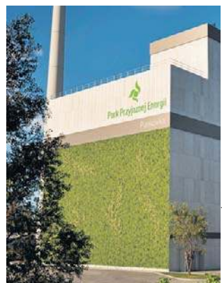
MPEC może już podpisać umowę na budowę

Procedura wyłonienia wykonawcy „instalacji kogeneracji do produkcji energii z przetworzonych odpadów komunalnych z wykorzystaniem ciepła do miejskiej sieci ciepłowniczej w Tarnowie” do najłatwiejszych nie należy. Przetarg na budowę spalarni ogłoszono już bowiem ponad rok temu. W grudniu 2025 roku ostatecznie wybrano ofertę konsorcjum firm, które złożyło najkorzystniejszą ofertę. Firmy Budimex oraz Engitec Technologies Spa