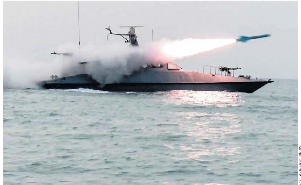
Ćwiczenia morskie Korpusu Strażników Rewolucji Islamskiej w cieśninie Ormuz

W rozmowach stronę amerykańską reprezentowali wysłannik prezydenta USA Steve Witkoff oraz zięć i doradca Donalda Trumpa Jared Kushner. Irańskiej delegacji przewodniczył szef MSZ Abbas Aragchi. W rozmowach, tak jak poprzednio, pośredniczyli dyplomaci z Omanu.