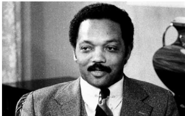
Jesse Jackson walczył o równouprawnienie czarnoskórych Amerykanów od lat 60. XX w.

W ostatnich dziesięcioleciach Jackson otwarcie wypowiadał się na temat czołowych polityków, w tym byłego prezydenta Baracka Obamy. Potępił prezydenturę Donalda Trumpa, mówiąc: „Pięćdziesiąt lat praw obywatelskich zostało zagrożonych”.