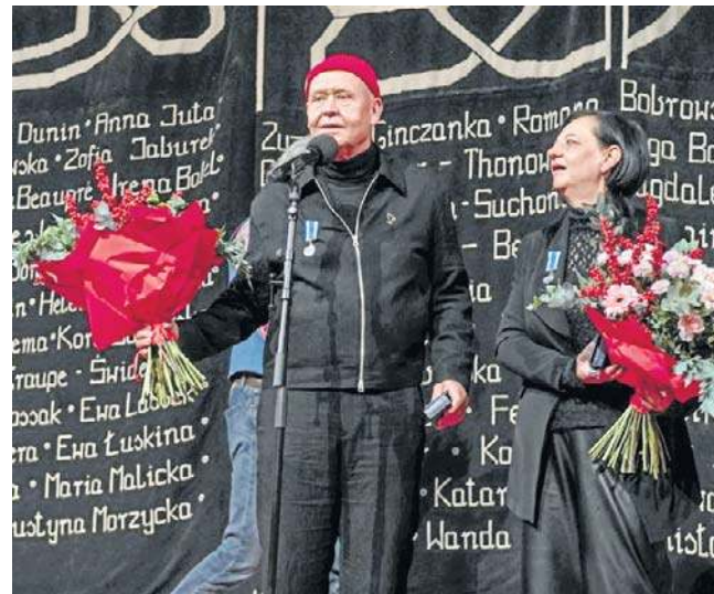
FOT. BOSKA KOMEDIA

- Podchodzę do tego raczej spokojnie i zgodnie z procedu-