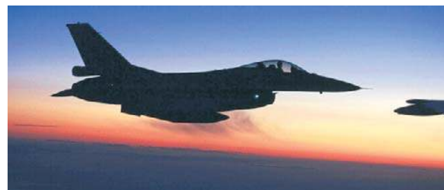
Za sterami F-16 siedzą też weterani z Holandii

Wśród amerykańskich pilotów, którzy przybyli do Ukrainy, by latać F-16, są weterani działań wojennych w Afganistanie i na Bliskim Wschodzie. Ze strony Holandii zaangażowano pilotów, którzy przeszli szkolenie w elitarnych europejskich szkołach lotniczych, specjalizujących się w nowoczesnych taktykach walki powietrznej i zaawansowanych technologicznie operacjach w powietrzu.