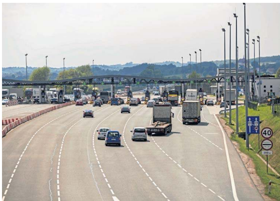
Od marca 2027 r. nie będą pobierane opłaty za przejazd autostradą A4 Kraków – Katowice

Oznacza to, że planowaniem nowej zakopianki z Krakowa do Myślenic zajmie się dyrekcja GDDKiA z Warszawy,