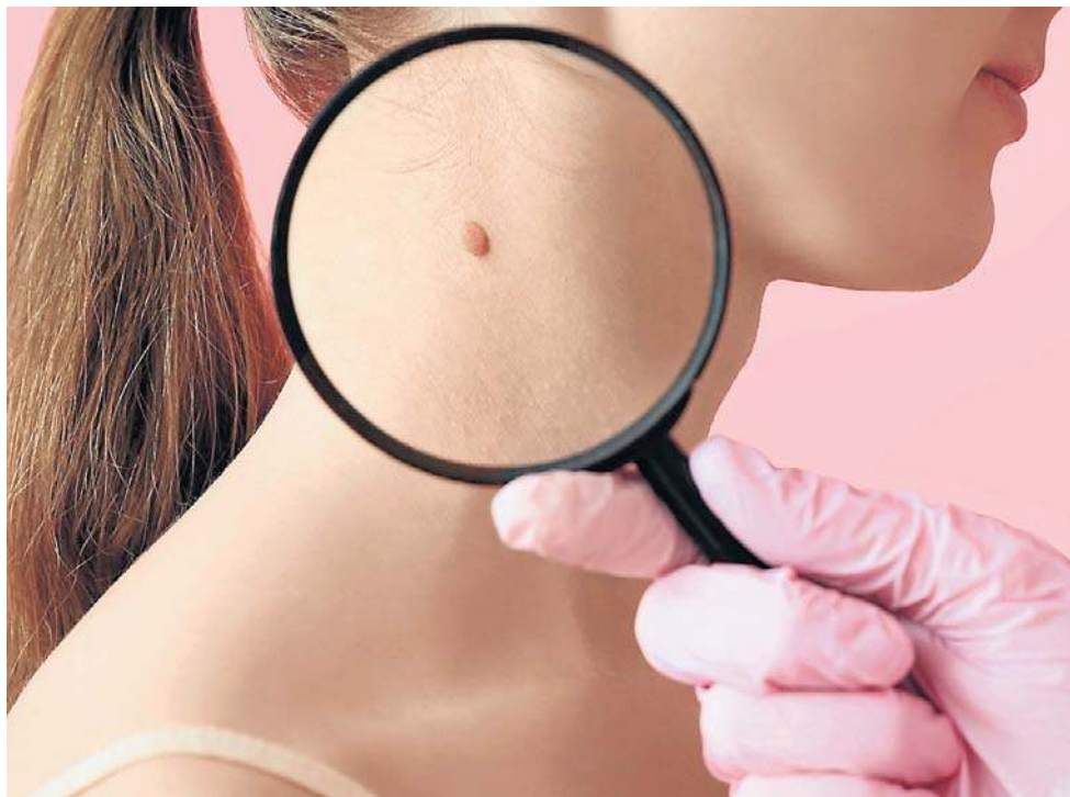
Niektóre objawy raka zbijają z tropu nawet lekarzy

Aby wykryć rozwijającą się chorobę, należy przeprowadzić szereg badań, zaczynając od tradycyjnej morfologii krwi z rozmazem mikroskopowym - to jedno z podstawowych badań, które może wykazać nieprawidłowości sugerujące białaczkę lub inne nowotwory krwi. Wykorzystuje się także m.in. ● biopsję aspiracyjną szpiku kostnego lub trepanobiopsję ● badanie histopatologiczne, ● badania obrazowe (np. USG, PET-CT), ● metody chirurgiczne.