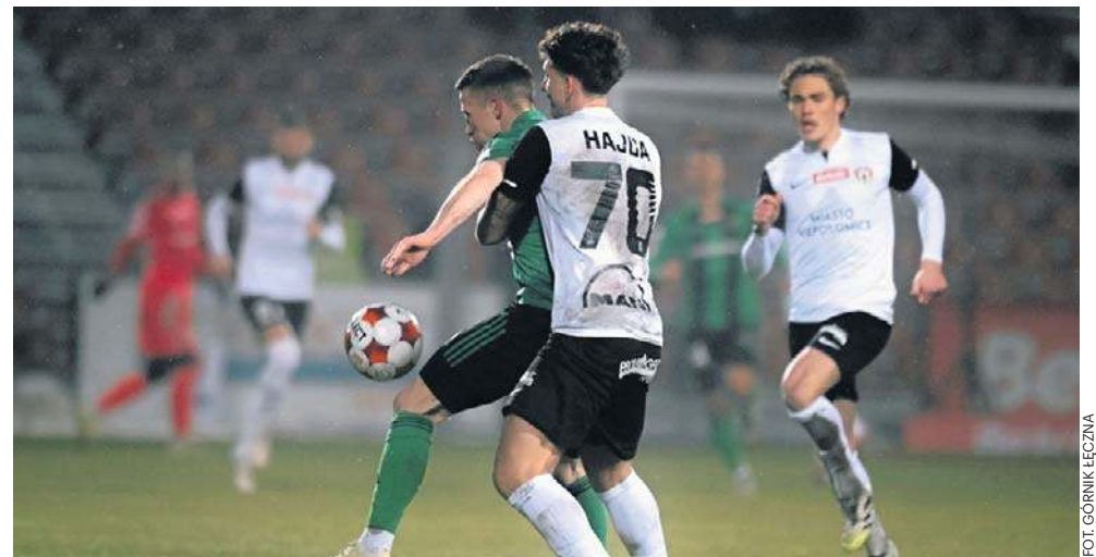
Piłkarzom Górnika Łęczna nie można odmówić ambicji i walki na boisku w Niepołomicach, ale efektem ich starań jest jedynie 11. porażka w sezonie

- Zawodnicy znają presję rywalizacji, mają ambicję i jakość, chcą brać odpowiedzialność