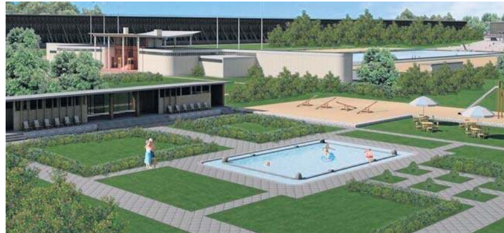
Odbudowa basenu (na zdjęciu jego wizualizacja) prowadzona ma być „w warunkach najwyższej ochrony zabytkowej”