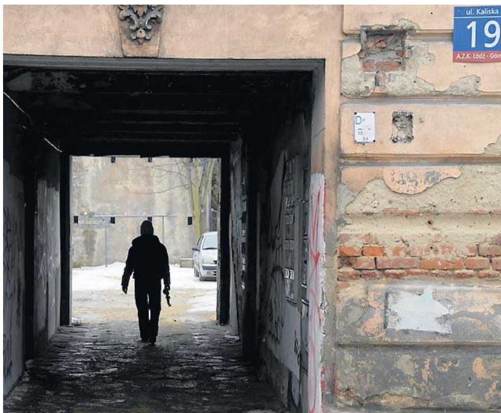
W kamienicy przy ul. Kaliskiej zamarzły dwie osoby

MOPS w Łodzi szybko wyясnił sytuację zmarłych. Nie była ona prosta, a wszyscy otrzymywali różnorodną pomoc. 55-latek z Malinowej 9 miał przyznaną codzienną wizytę opie-