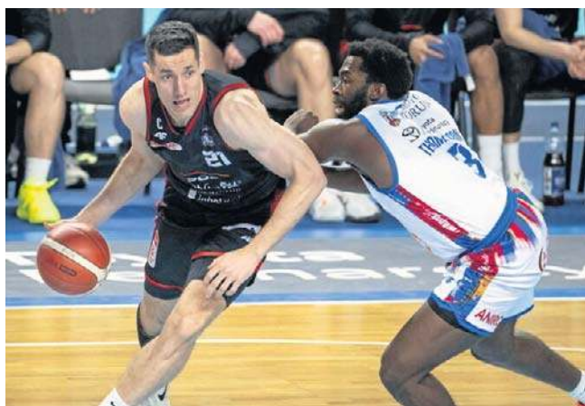
Koszykarze PGE Startu Lublin po słabym meczu przegrali w Toruniu z Twardymi Piernikami

Problemem czerwono-czarnych była również skuteczność. W pierwszej kwarcie gospodarze