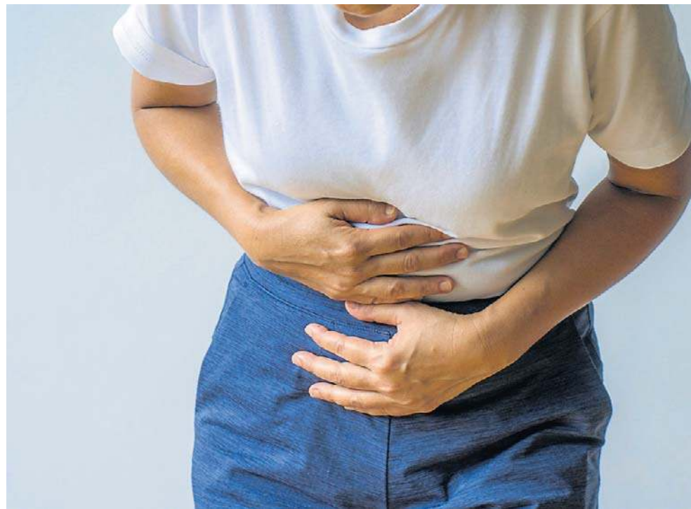
Czasami pierwszym objawem nowotworu jest ostra niedrożność przewodu pokarmowego

Problem w tym, że choroba przez wiele lat może przebiegać