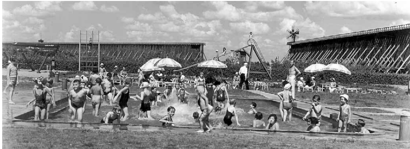
Basen miał 3 strefy: najpłytszą, dziecięcą (32 na 20 m), rekreacyjną (40 na 60 m) i sportową, najgłębszą (40 na 20 m)

Jednym z najbardziej zaawansowanych elementów był system uzdatniania wody. Solanka trafiała do fontanny-odżelaziacza, gdzie była napowietrzana. W ten sposób wytrą-