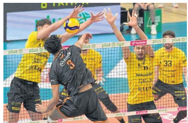
Walczący o utrzymanie w PlusLidze Barkom Każany Lwów niespodziewanie zwyciężył w Lublinie