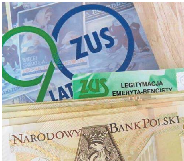
1 stycznia 2026 roku weszła w życie Ustawa, która ma na celu naprawienie zaniżonych „emerytur czerwcowych” poprzez uwzględnienie dodatkowych waloryzacji

W całej Polsce nowe zasady obejmą około 265 tys. osób, w tym 243,6 tys. emerytów i 21,2 tys. osób pobierających