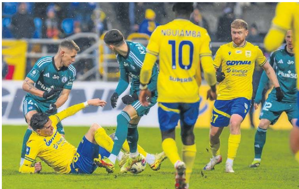
Piłkarzy Arki od pokonania Legii dzieliły minuty. Końcówka należała jednak do gości...

Miniony weekend rozpoczął się od sensacji. Oto Korona Kielce po wyjazdowym ograniu Legii niespodziewanie sama dała sobie wyrwać punkty u siebie, i też