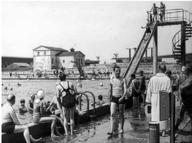
Zjeżdżalnie były z betonu. Ta dla dorosłych miała ok. 5 m