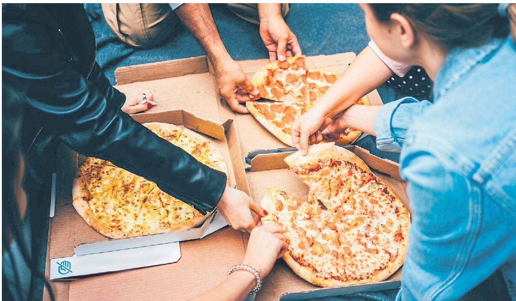
Najzdrowsza pizza to taka, która ma jak najcieńsze ciasto z dobrej jakości mąki i jak najwięcej lekkich dodatków warzywnych, w tym sosu pomidorowego

Kaloryczność pizzy zależy przede wszystkim od użytych składników. Według włoskich źródeł pizza margherita w kawałku o wadze 100 g ma ok. 280 kcal, a capricciosa - 410 kcal. Wybierając dodatki do pizzy, warto zwrócić uwagę na ich kaloryczność i używać zamienników, które mogą znacznie zmniejszyć