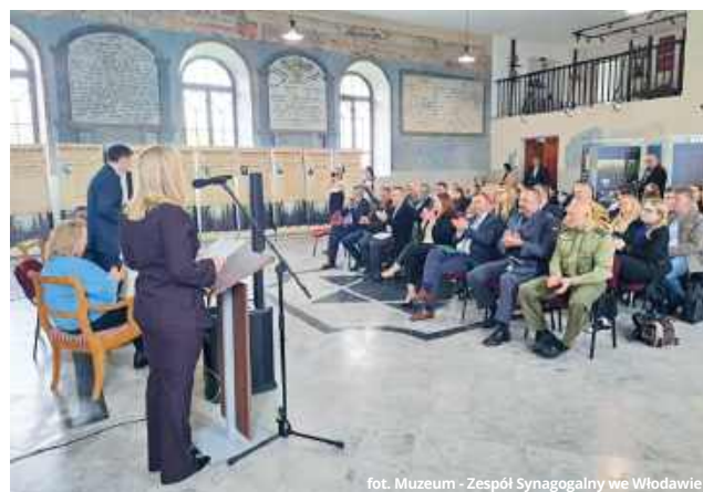
fol. Muzeum - Zespół Synagogalny we Włodawie

● WŁODAWA W małej synagodze Muzeum – Zespołu Synagogalnego we Włodawie 20 maja odbyło się spotkanie historyczne zatytułowane „Spotkania Wołyńskie”. Tematem przewodnim była zbrodnia wołyńska dokonana przez ukraińskich nacjonalistów na polskiej ludności cywilnej podczas II wojny światowej.