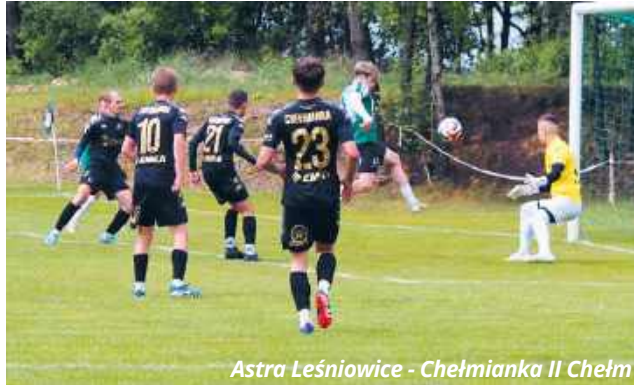
Astra Leśniowice - Chełmianka II Chełm