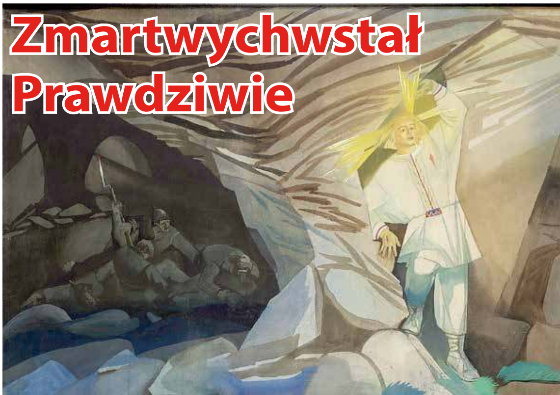
Zofia Stryjeńska - Wyjście z grobu z cyklu Pascha, 1918 r.

„Władza niszczy tych, którzy jej nie mają”