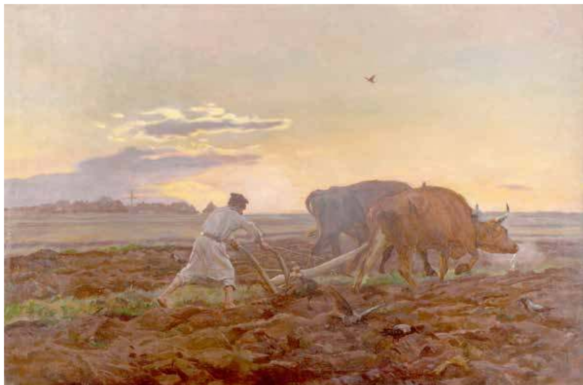
Orka, 1896 - Józef Chełmoński