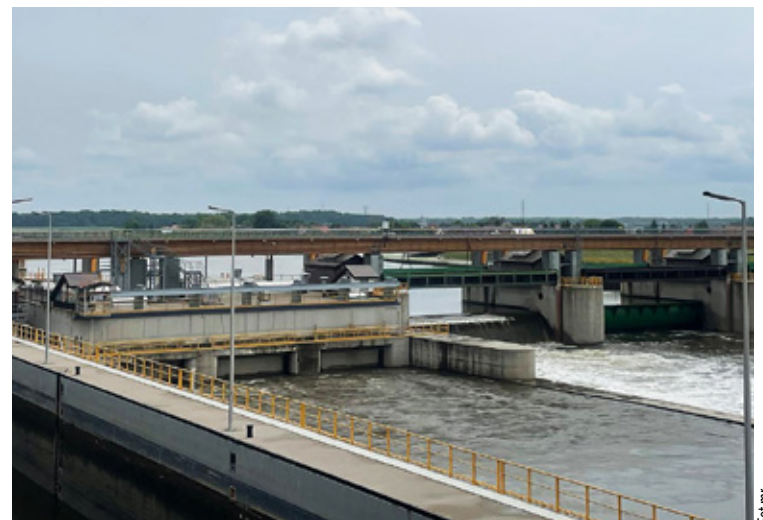
Stopień wodny Malczyce.