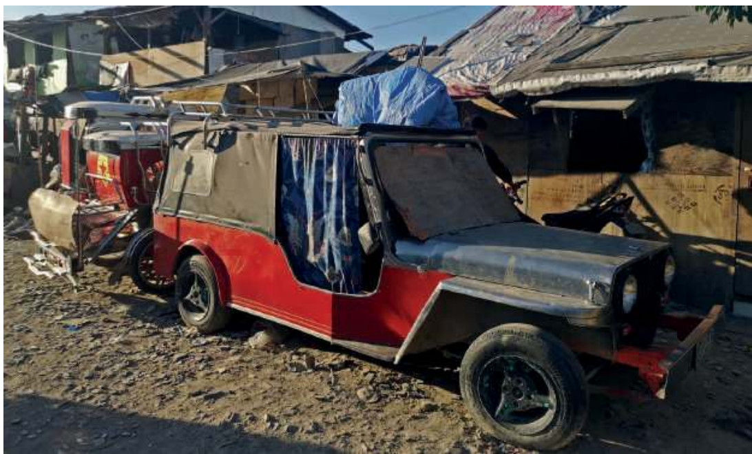
Niektórych mieszkańców Quarry stać nawet na to, aby utrzymać auto

S tojący w pobliżu dom nie ma ścian. Zbudowany jest z kilku swobodnie poukładanych blach. Przy wejściu ktoś postawił drewniany element od jakiejś zabudowy. Zupełnie niepasujący i kolorystycznie, i gabarytowo. To jednak nie jest w tej chwili ważne. Istotne, że dzięki tym imitacjom drzwi do środka nie wejdzie żadna z dzikich świń. Zaglądam do środka. Ciemno. Żadnej elektryczności. Wszelkie otwory, przez które mogłyby dostać się w to miejsce jasne promienie słońca, są w tej chwili szczelnie pozakrywane szmatami bądź materiałami. Pośrodku czegoś odgrywającego funkcję werandy stoi plastikowy stół. Przy nim popękane zielone krzesła. Też z plastiku. Kilka metrów dalej widać leżący na ziemi materac. Przesunięty nieco dalej, w narożnik skonstruowanych naprędce kartonowych ścianek. By zagwarantować leżącej na nim osobie choć minimum prywatności i dyskrecji.