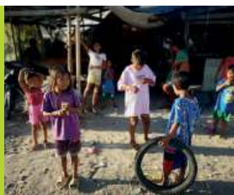
Tutaj umiera się po cichu / 74