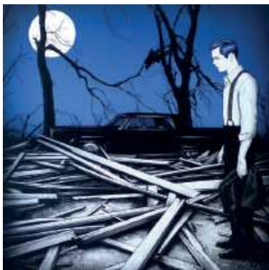
Jack White, FEAR OF THE DAWN, Third Man Records

„Fear of the dawn” to pierwsza z dwóch zapowiadanych w tym roku płyt Jacka White'a. Czy druga okaże się krokiem wstecz? Nie sądzę, choć nie tracę nadziei. ■