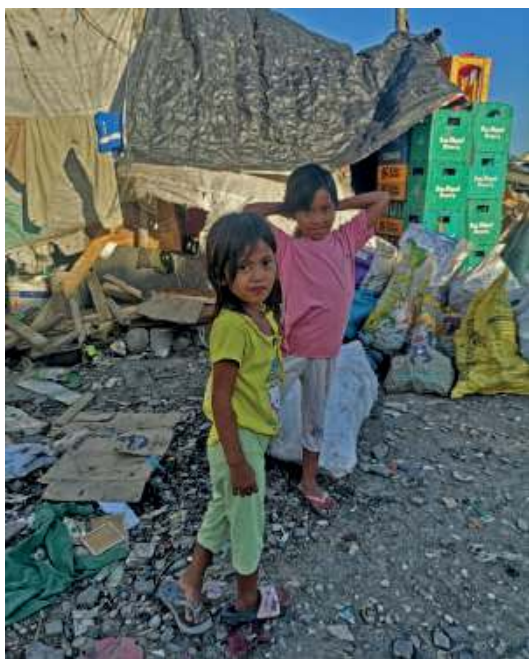
Nie, to nie one są winne tego, że ich domem jest dziś wysypisko śmieci pod Manilą