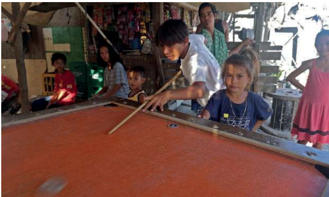
Bieda wyzwała w tych dzieciach inspirację do wymyślania coraz nowszych form spędzania czasu i rozrywki