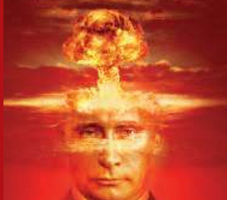
Atomowe bankructwo Rosji / 4