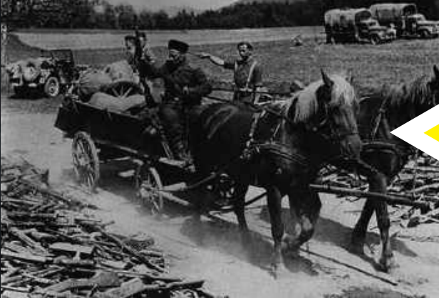
Kozacy składają broń przed Brytyjczykami, 1945 r.

Józef Mackiewicz był niewygodnym świadkiem historii XX wieku, bo ponad wszystko cenił prawdę i nie uznawał poprawności politycznej, która jest potworną chorobą naszych czasów. To on m.in. przekazał literackie świadectwa o zbrodniach popełnionych w czasie II wojny światowej przez Niemców, Sowietów, ale też aliantów. Zbrodnie, których ślady ich sprawcy chcieli zatrzeć. Głównym przedmiotem swoich dociekań uczynił zbrodnię dokonaną przez Sowietów w lesie katyńskim na polskich oficerach: „Jestem ponad wszystko badaczem sprawy mordu katyńskiego, począwszy od r. 1943 do dziś” – pisał w roku 1975.