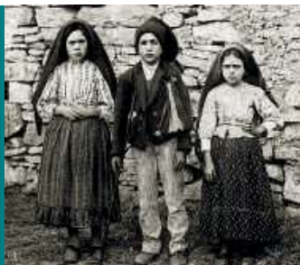
Rosja w objawieniach fatimskich / 30