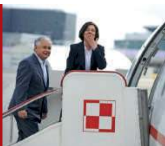
Dlaczego zamordowano Lecha Kaczyńskiego?... / 20

Redakcja zastrzega sobie prawo do skracania i redagowania tekstów. ISSN 1895-4960