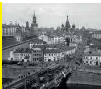
Polak w Moskwie, czyli zuchwały wypad / 48