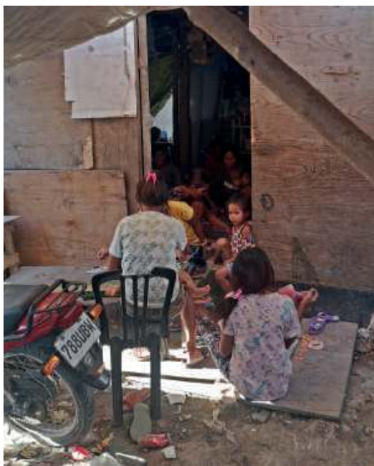
W jednej izbie mieszka tu często nawet po kilkanaście osób

W 2011 roku na wysypisku zamieszkało w sumie 50 rodzin. Dziś jest ich 34. Żyją w atrapach domów, na pokrytej odpadkami ściółce śmieci. Tu nie ma normalnej ziemi. Wszędzie leżą odpadki przywiezione śmieciarkami z miasta. W powietrzu czuć fetor. Mieszkańcy zdążyli się już przyzwyczaić. Dzieci wybudowały sobie nawet małe boisko do koszykówki. Jedna rodzina spro-