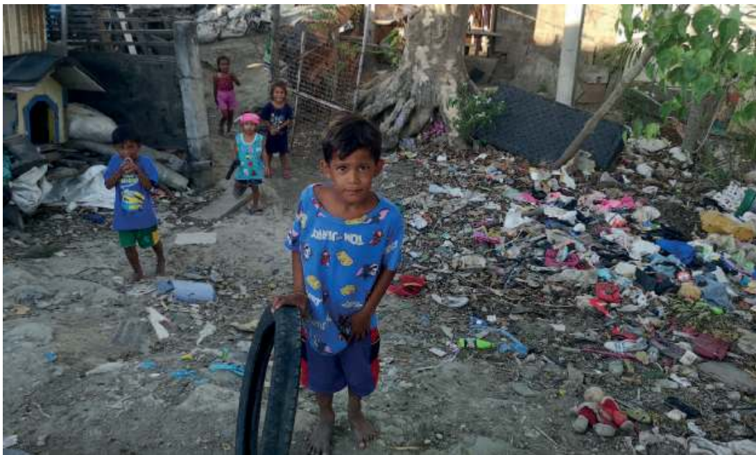
W samej Manili jest dziś ponad 2 mln dzieci żyjących poniżej granicy ubóstwa. Około 75 tys. dzieci zostało osieroconych, nie ma domu bądź z niego uciekła.

chleb. Wszelka działalność zawodowa musiała być zawieszona. Nie było za co żyć.