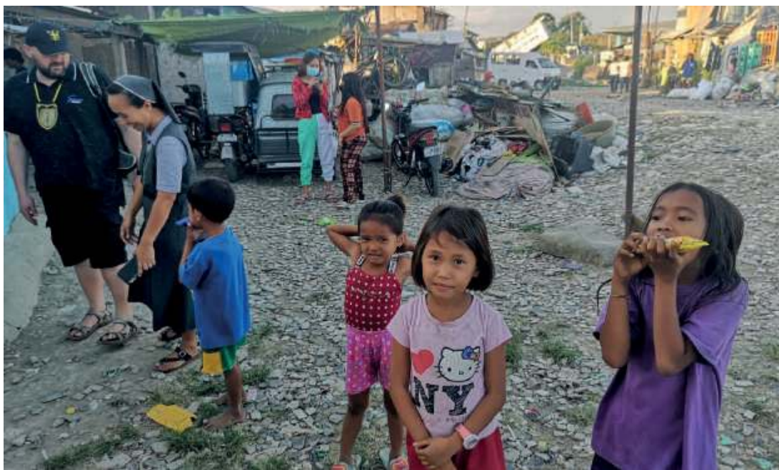
W odróżnieniu od brazylijskich czy wenezuelskich faweli, w filipińskim Quarry z sympatią patrzą na obcych odwiedzających to miejsce