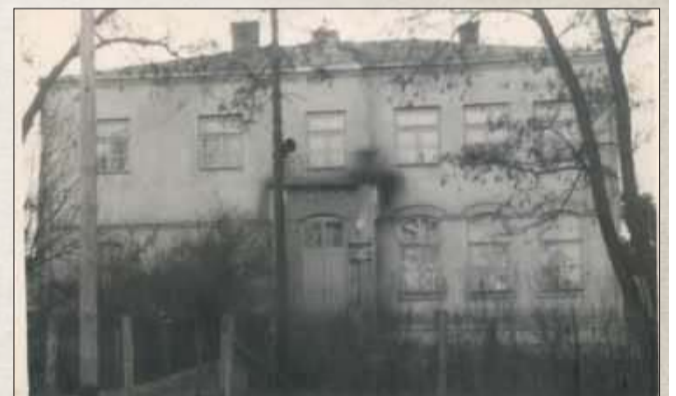
Szkoła Podstawowa w Niwiskach ok. 1950 rok.

przy szkołach, przez Gminny Ośrodek Kultury i Bibliotekę w Niwiskach, po zespoły i kluby sportowe – to efekt inicjatywy nauczycieli i społeczników. Ogromny udział mają też ochotnicze straże pożarne.