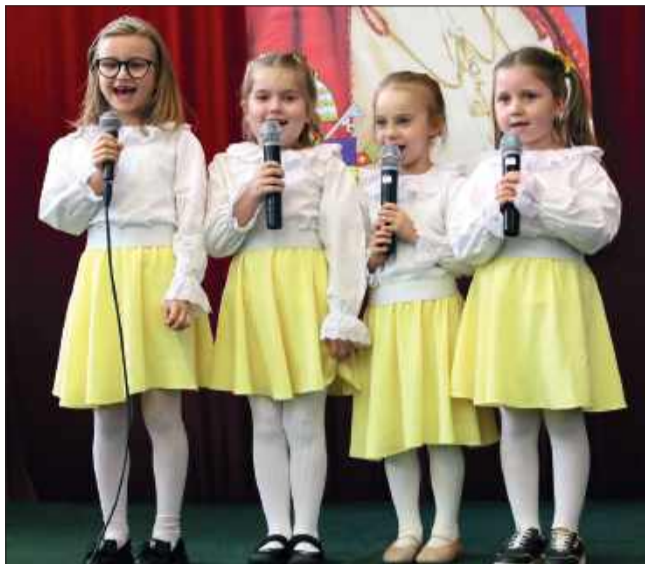
Na scenie zaprezentowali się także najmłodsi.

Uroczystość pokazała, jak wiele talentów rozwija się w kolbuszowskiej gminie, a konkurs umożliwia młodym artystom pokazanie swoich umiejętności i zdobycie wyróżnień za twórczą pracę.