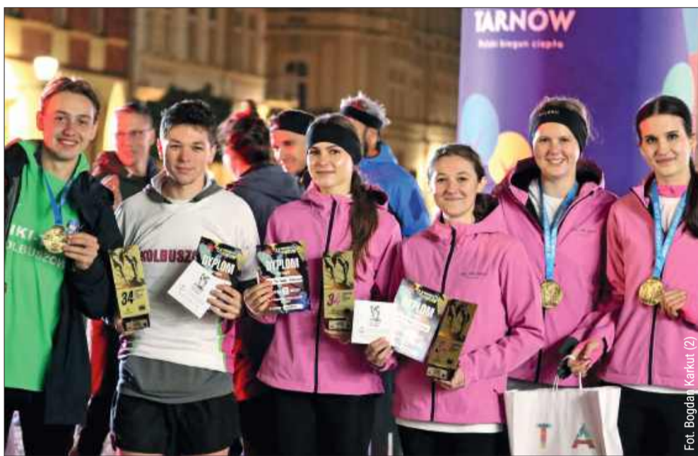
Zawodnicy Tiki-Taki pokazali klasę w Tarnowie.

Młodzi sportowcy z klubu Tiki-Taki Kolbuszowa mogą pochwalić się kolejnymi sukcesami. W ciągu dwóch dni ich talent i wytrwałość zostały docenione podczas dwóch ważnych biegów.