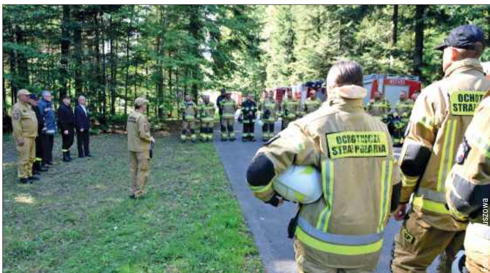
Druhowie z całej gminy spotkali się na ćwiczeniach.