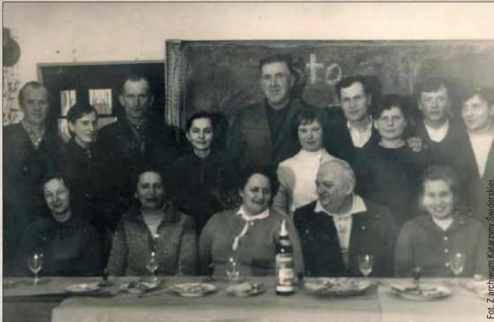
Dzień Kobiet - grono pedagogiczne wraz z rodzicami.

Szkolnictwo? W 1914 roku działają cztery szkoły ludowe: