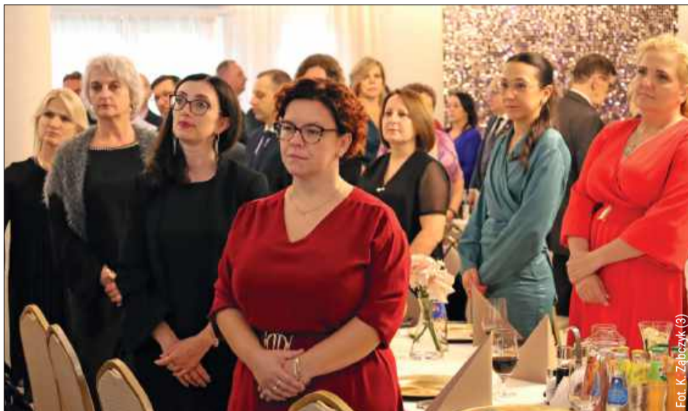
Zebrani na sali minutą ciszy oddali hołd zmarłym nauczycielom.