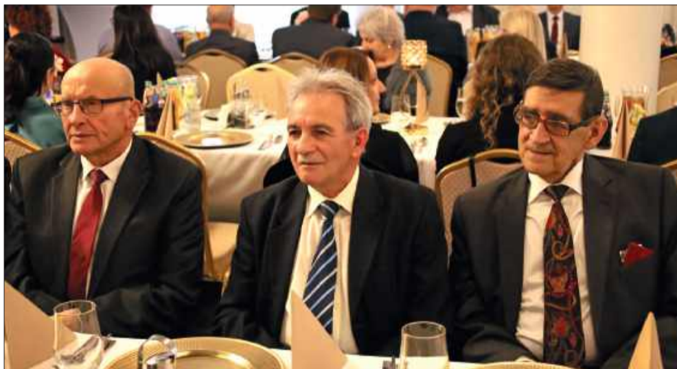
Był to czas radości, ale i wielu pozytywnych wspomnień.