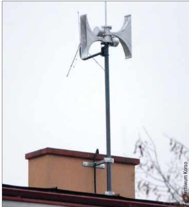
Syreny zamontowane są na większości budynków użyteczności publicznej.

Służby informują o zagrożeniach na kilka sposobów: przez syreny, megafony, radio i telewizję, internet, Regionalny System Ostrzegania (RSO), alerty RCB