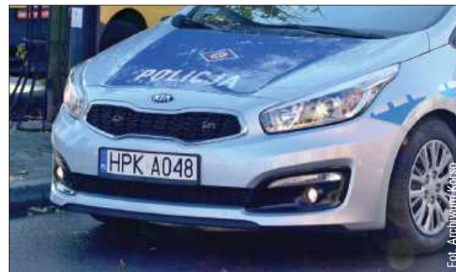
Sprawą zajmą się ich przełożeni.

– To normalna sytuacja, każdy może się zagapić, tylko gdyby nagrywający był policjantem, a samochód nagrywany cywilny