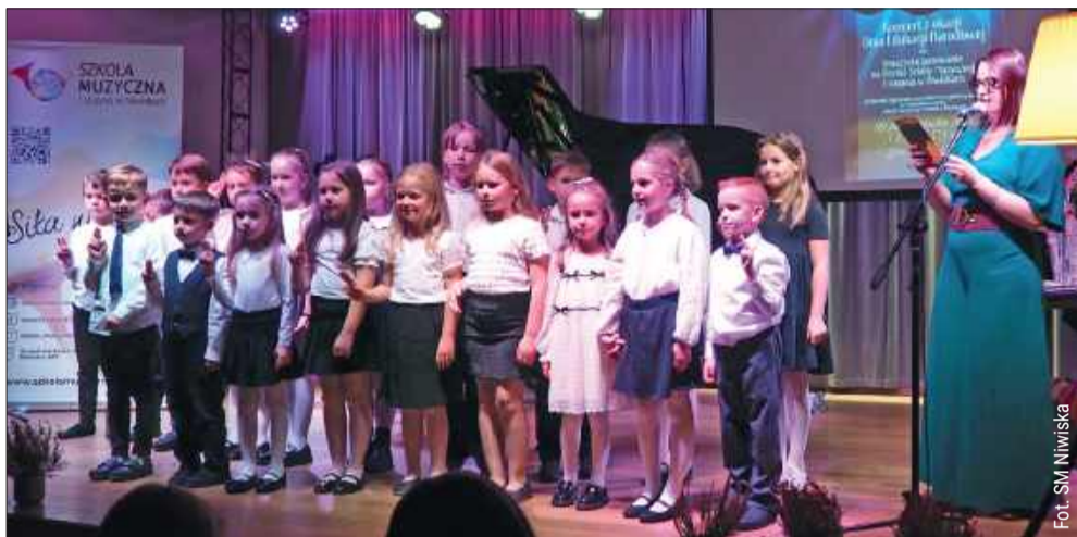
Najmłodszy muzycy zostali włączeni do grona uczniów.

Uczniowie pierwszych klas Szkoły Muzycznej I stopnia w Niwiskach 9 października zostali oficjalnie pasowani na młodych muzyków. Uroczystość połączono z koncertem z okazji Dnia Edukacji Narodowej, w trakcie którego wręczono także nagrody dla nauczycieli i pracowników szkoły.