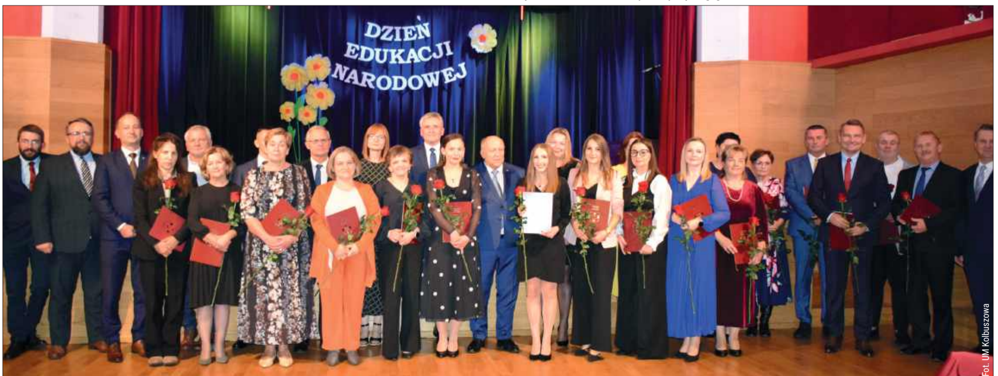
Nauczyciele z gminy Kolbuszowa odebrali nagrody w MDK.