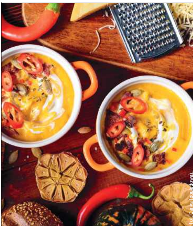
Rozgrzewający krem z dyni to idealny pomysł na chłodny, jesienny wieczór.

Rozgrzej piekarnik do 200°C. Pokrój dynię w kostkę, dodaj czosnek i skrop oliwą. Piecz przez około 45 minut, aż dynia będzie miękka. W blenderze zmiksuj dynię, ciecierzycę, tahini, czosnek, przyprawę i oliwę. Dopraw do smaku solą, pieprzem, papryką i sokiem z cytryny. Podawaj pastę z chrupiącym pieczywem.