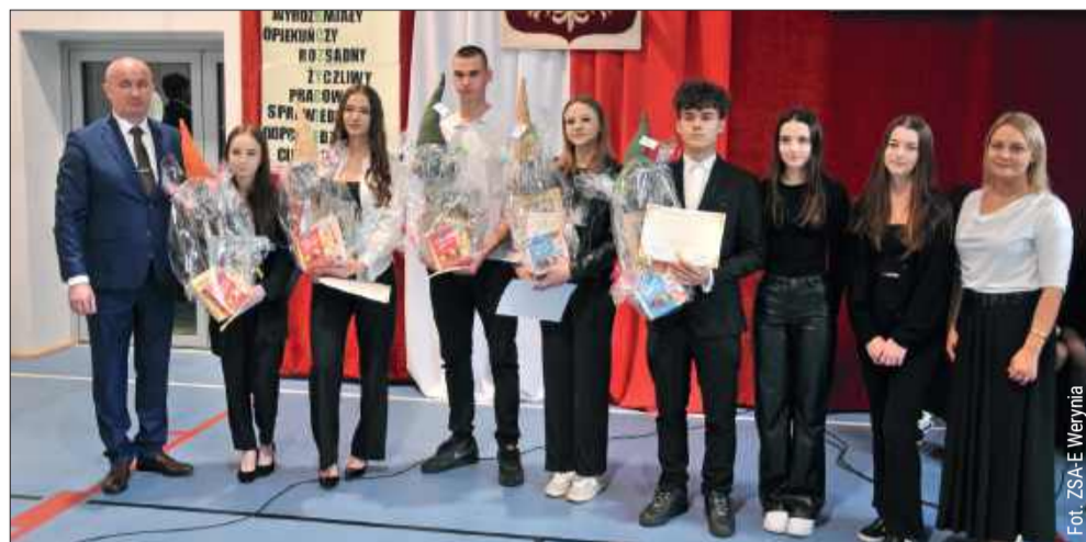
Podczas apelu nastąpiła zmiana samorządu uczniowskiego.

W piątek (10 października) w Zespole Szkół Agrotechnicznych i Ekonomicznych w Weryni odbyło się uroczyste ślubowanie klas pierwszych. Wydarzenie to miało miejsce o godzinie 12:00 i było pełne symbolicznych momentów, które na długo pozostaną w pamięci uczniów i pracowników szkoły.