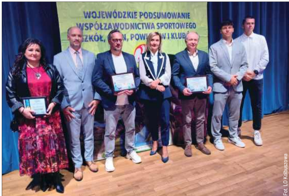
Liceum Ogólnokształcące w Kolbuszowej w TOP 10.

Na sukces złożyły się nie tylko indywidualne talenty, ale też konsekwentne przygotowania, organizacja szkolnych treningów i wsparcie środowiska — od nauczycieli wychowania fizycznego po samorządowe programy wspierające aktywność młodzieży. Wyróżnienie dla LO w Kolbuszowej to także promocja zdrowego stylu życia oraz zachęta dla młodszych roczników, by odważnie wchodzić do sportowej rywalizacji.