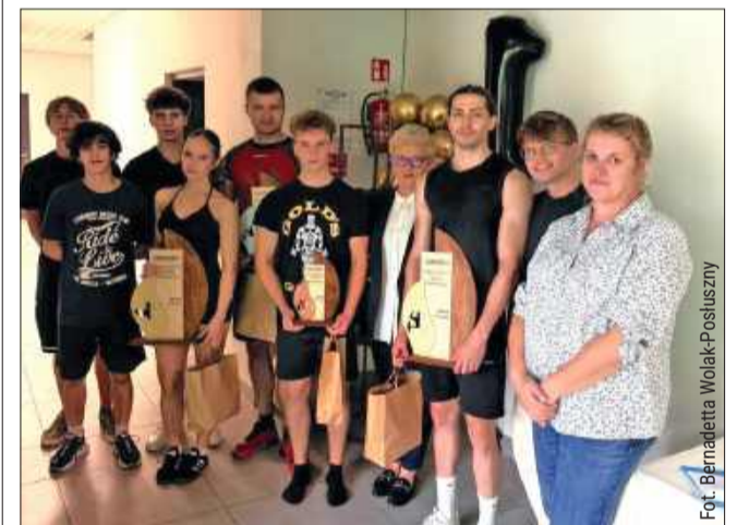
Siłownia w OWiR w Cmolasie obchodziła 1. urodziny.

Minął rok od otwarcia siłowni w gminie Cmolas, która zyskała miano pierwszej w powiecie oraz jednej z nielicznych na Podkarpaciu siłowni samorządowych.