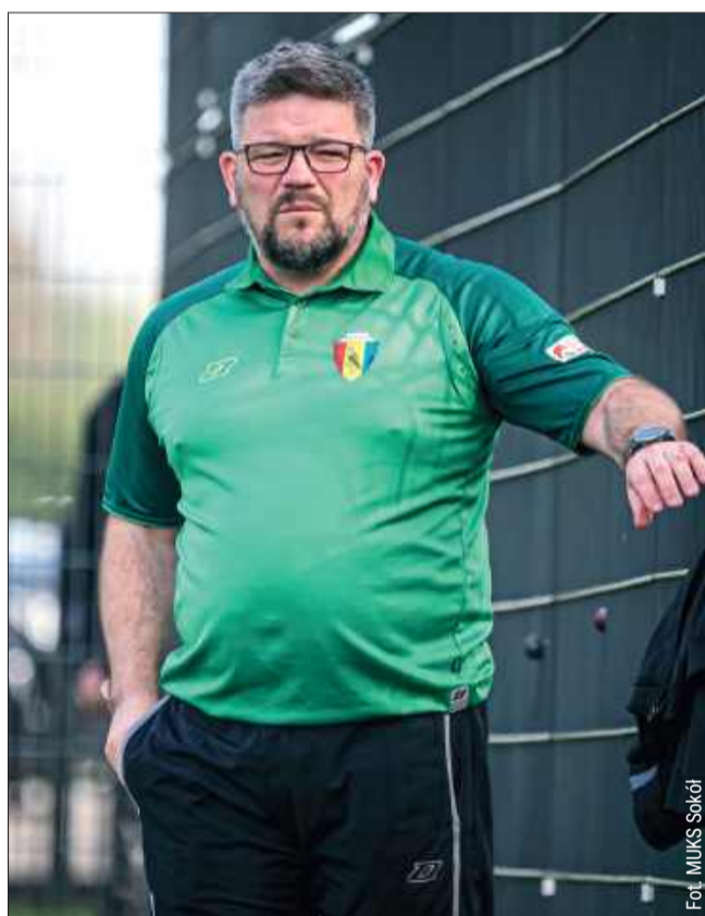
- Trenerze! Witamy w Przeworsku i życzymy wielu sukcesów z Orłowcami - napisali przedstawiciele MKS Orzeł Przeworsk.

Do Sokola Kolbuszowa Dolna Wołowiec trafił w październiku 2023 roku. Drużyna znaj-