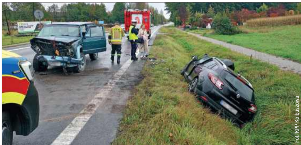
Do zderzenia pojazdów doszło na pograniczu Kolbuszowej Górnej i Kupna.

Policja apeluje o zachowanie szczególnej ostrożności na drodze, szczególnie w trudnych warunkach pogodowych. Pamiętajmy o dostosowaniu odpowiedniej prędkości i stanu nawierzchni, by zapewnić bezpieczeństwo sobie i innym uczestnikom ruchu. kz