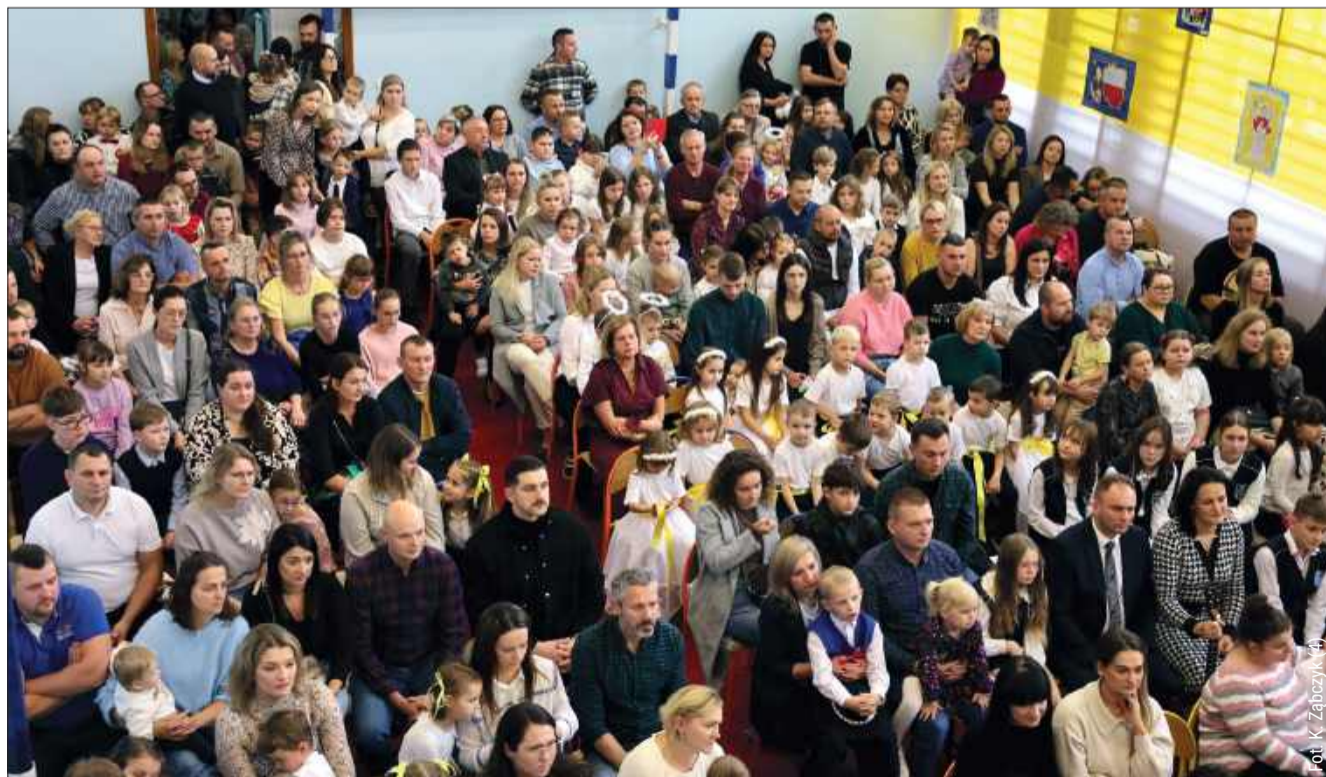
Sala gimnastyczna w Kupnie pękała w szwach.