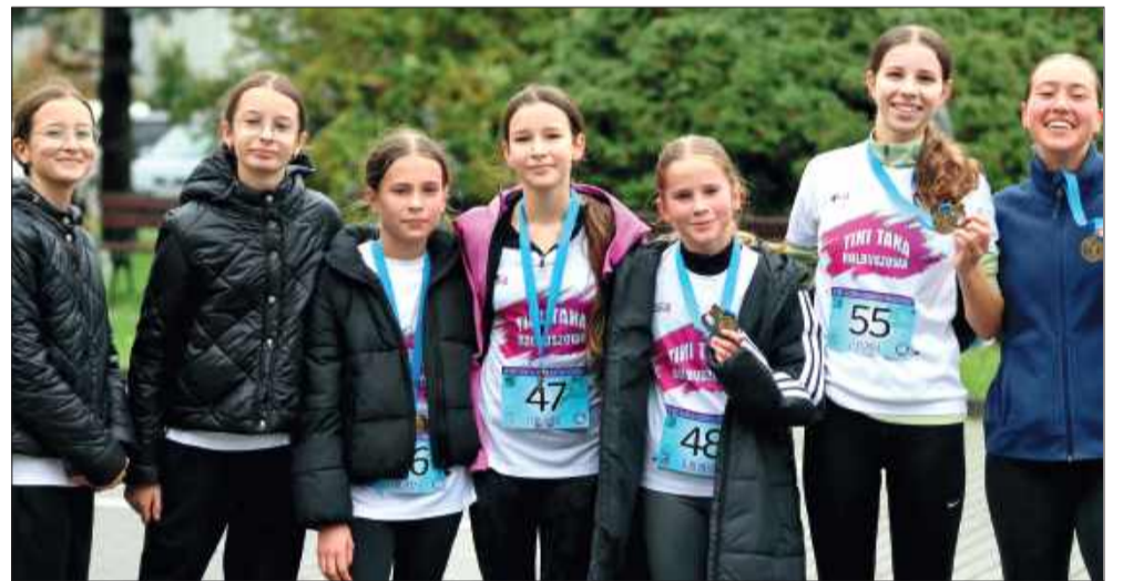
Bieg w Lipinkach również zakończył się sukcesem.