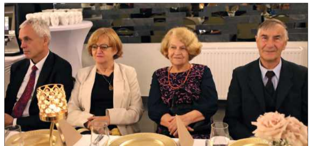
Na spotkaniu nie zabrakło emerytowanych pedagogów.