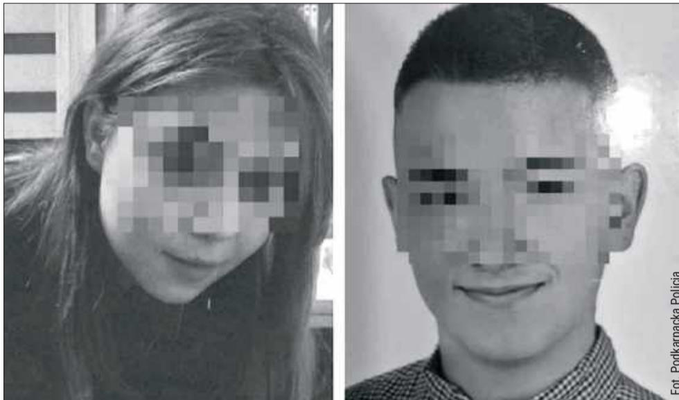
Dwoje nastolatków z Podkarpacia nie żyje. Policja odnalazła ich ciała.

dla miasta Rzeszowa. Ciała zabezpieczono do dalszych badań sekcyjnych. Służby publicznie apelują o niepublikowanie niesprawdzonych informacji oraz o szacunek dla rodzin przeżywających żal.