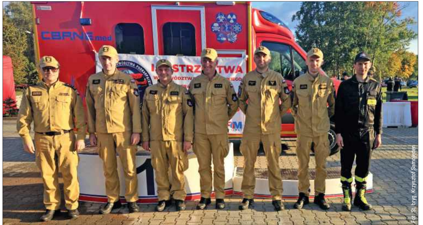
Funkcjonariusze z Kolbuszowej otarli się o podium.

Warto dodać, że strażacy z Kolbuszowej oraz Brzozowa zdobyli identyczny wynik (137 punktów), ale różnica w czasie wykonania zadań dała wyższe miejsce drużynie z Kolbuszowej. Pozostałe drużyny z regio-