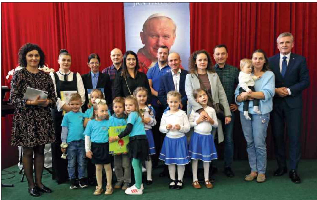
Nagrody odebrali uczniowie wraz ze swoimi rodzinami.