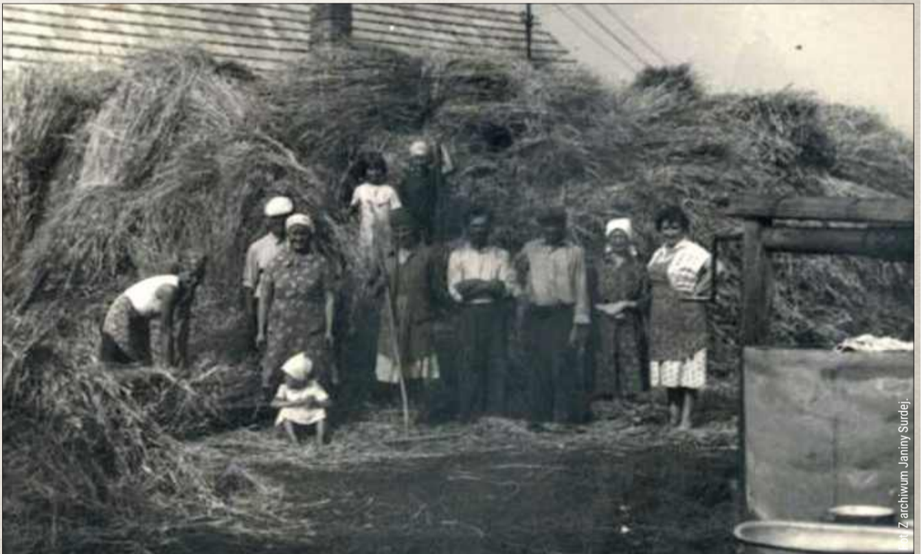
Młocka - 1979 rok.