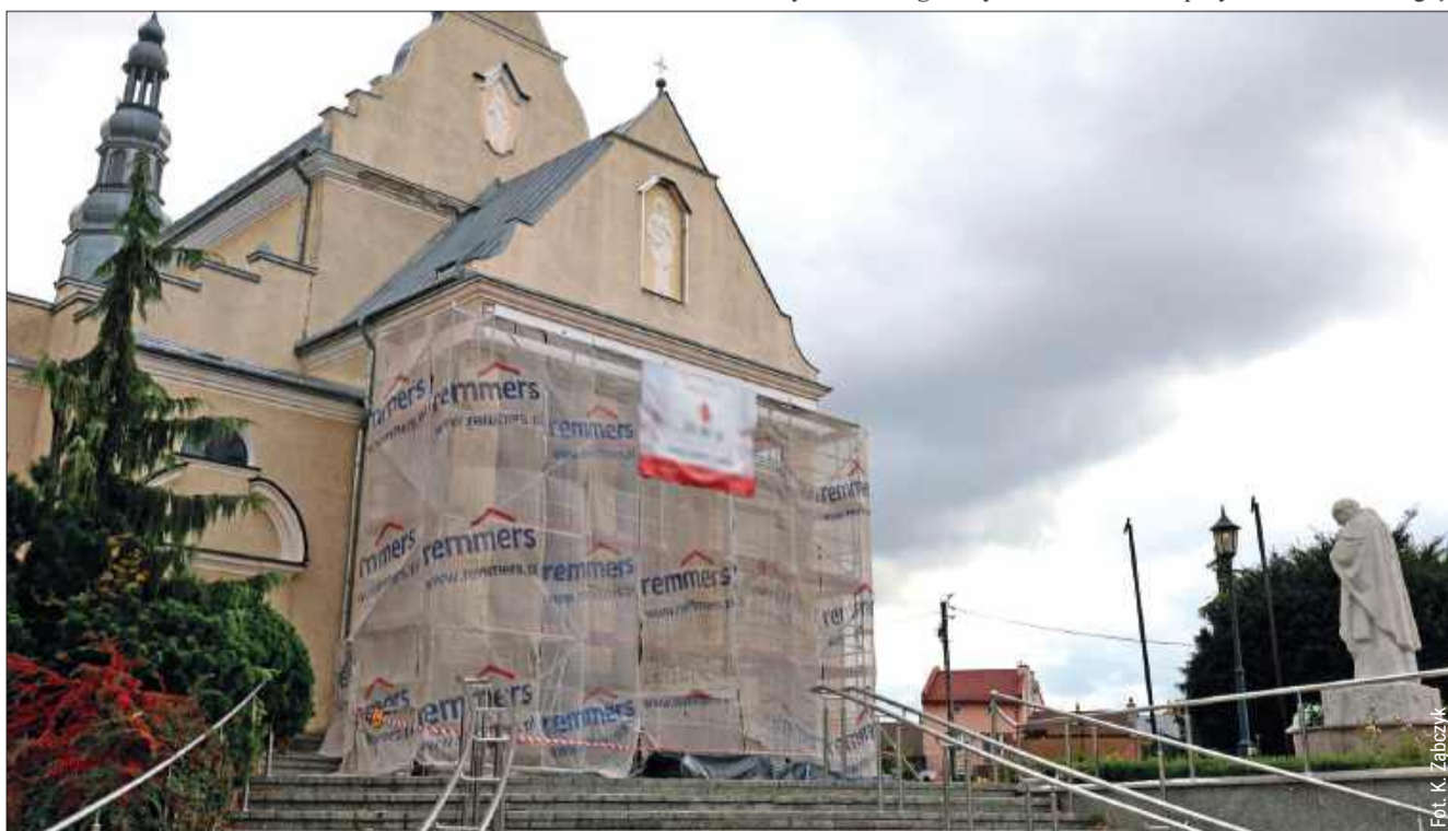
Wejście do świątyni głównymi drzwiami nie będzie możliwe.