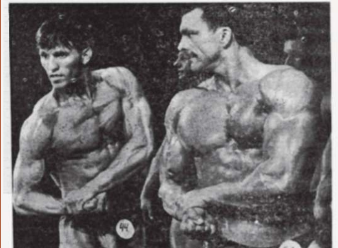
Głos z 16 maja 1996 r.