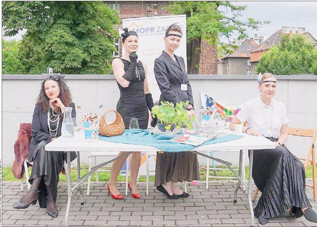
FACEBOOK PADA DZIELNICZY ZANDKA

Miejska gra detektywistyczna Dziennik detektywa , która rozegrała się w sobotę (7 czerwca) w Śródmieściu i na Zandce, była świetną okazją, żeby przenieść się ciałem i duchem w szalone lata 30. ubiegłego wieku. Wykwintne kreacje, szale boa, pióra we włosach, papierosowe lufki... Przy ulicy Stalmacha w Zabrze można było poczuć się, jak na planie filmowym Vabanku czy dekadencejki serialu Berlin Babylon . (ws)