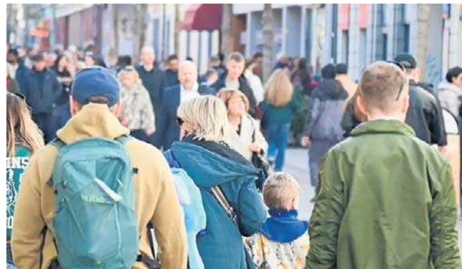
W 2025 r. wzrosła liczba zwolnień lekarskich jednodniowych, szczególnie przed weekendami

Najniższy wskaźnik absencji odnotowano w grupie wiekowej pracowników do 29. roku życia - 2,13%. Najwyższy wskaźnik dotyczył pracowników powyżej 50. roku życia i wyniósł 4,87%, czyli