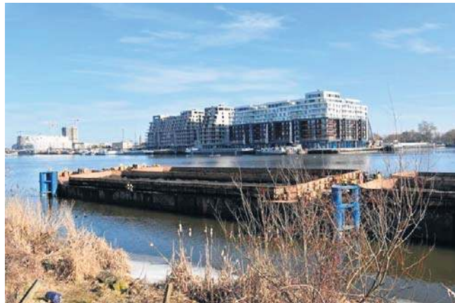
Kępa Parnicka cieszy się sporym zainteresowaniem deweloperów. Ma potencjał pod wysoką zabudowę

- Kępa Parnicka ma też pewną specyficzną cechę. Nie ma tam bezpośredniego kontekstu historycznego ani zwartej historycznej zabudowy, jak na przykład na sąsiedniej Łasztowni. Oczywiście nie oznacza to, że nowe budynki nie będą miały żadnego kontekstu urbanistycznego, ale z całą pewnością nie ma tam tak wrażliwego otoczenia jak w rejonie Wałów Chrobrego czy innych ważnych budynków publicznych - dodaje.