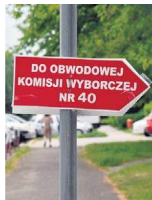
II tura wyborów odbyła się w czerwcu 2025 r.

- Podczas liczenia głosów doprowadzili do tego, że w grupie kart zawierających głosy oddane na kandydata Rafała Trzaskowskiego znalazła się