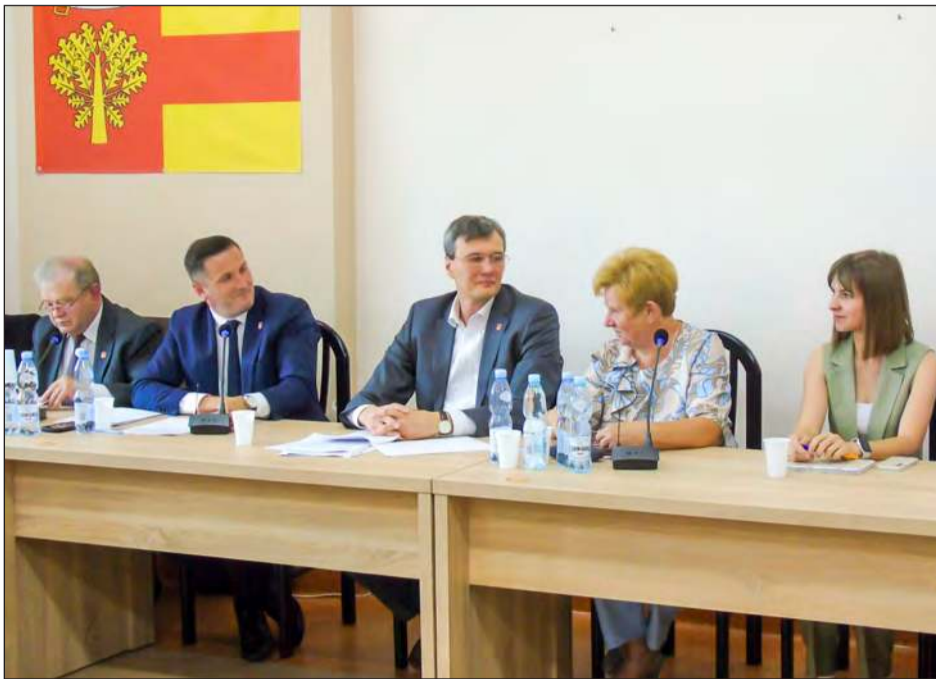
Podczas XVIII sesji Rady Gminy Sobolew radni stosunkiem głosów 13:2 podjęli uchwałę w sprawie podjęcia procedury związanej z nadaniem miejscowości Sobolew statusu miasta

Panie Wójcie, co było głównym impulsem, aby właśnie teraz zainicjować procedurę nadania Sobolewowi praw miejskich? Pomysł praw miejskich jest już analizowany od kilku lat, ale dopiero teraz można było do niego spokojnie przysiąść. Przypomnę, że w tamtej kadencji atmosfera w radzie gminy delikatnie mówiąc nie sprzyjała konstruktywnym rozmowom. Teraz mając komfort pracy można skupić się właśnie na takich rzeczach. Rok temu odbyły się wybory samorządowe, przy okazji kampanii wyborczej odbyłem wiele