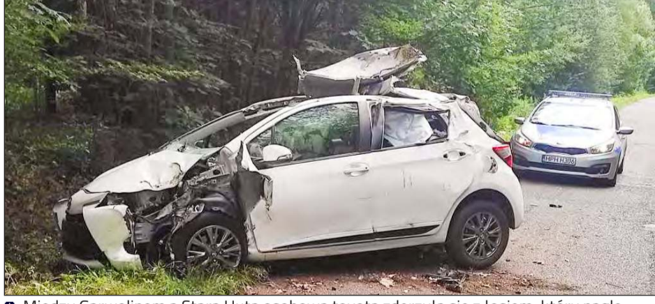
■ Między Garwolinem a Starą Hutą osobowa toyota zderzyła się z łośiem, który nagle wtargnął na jezdnię

Zdjęcia z miejsca zdarzenia pokazują ogromne uszkodzenia pojazdu. Przód i bok