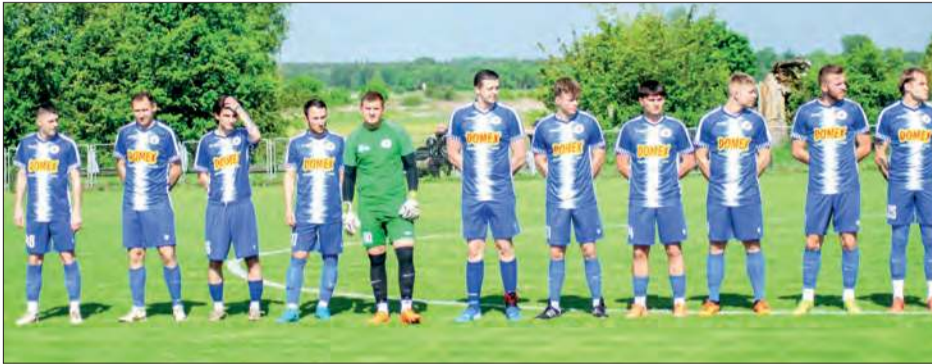
Orzeł Parysów w sezonie 2024/25 zajął czwarte miejsce