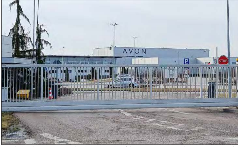
■ Zakończył się proces zwolnień grupowych w fabryce Avon w Garwolinie. Z ostatecznych danych, które uzyskaliśmy z Powiatowego Urzędu Pracy wynika, że pracę straciły 152 osoby

Zakończył się proces zwolnień grupowych w fabryce Avon w Garwolinie. Z ostatecznych danych, które uzyskaliśmy z Powiatowego Urzędu Pracy wynika, że pracę straciły 152 osoby. Do 25 lipca w urzędzie pracy zarejestrowało się 14 z nich