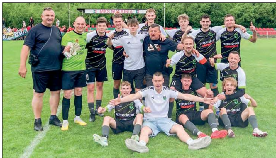
Orzeł Unin w sezonie 2024/25, zajmując 8 miejsce w siedleckiej klasie okręgowej, został najlepszym zespołem z powiatu garwolińskiego