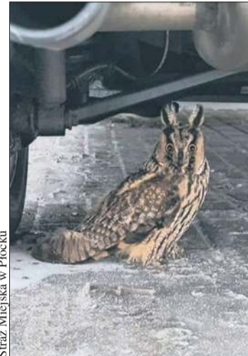
Straż Miejska w Płocku

Dodajmy, że w Straży Miejskiej w Płocku działa specjalistyczna komórka – EkoPatrol. Zajmuje się ratowaniem chorych i rannych zwierząt. Strażnicy pomagają ptakom, ssakom leśnym (sarny, łosie, jeże) oraz zwierzętom