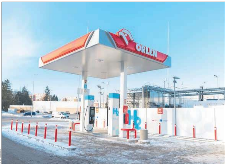
ORLEN uruchomił w Pile piątą ogólnodostępną stację wodorową w Polsce

Festiwal „Cudeńka” to idealna szansa na zakup wytworów sprzedawanych przez rzemieślników i małe, regionalne marki. Entuzjaści ekologicznych rozwiązań i pasjonaci DIY z pewnością poczują się komfortowo w świecie, w którym ważne są: dbanie o jakość produktu, związane z nimi historie, wysiłek włożony w ich wytworzenie oraz obecność twórców niszowych, lokalnych i przede wszystkim tworzących sztukę własnymi dłońmi. (ob)