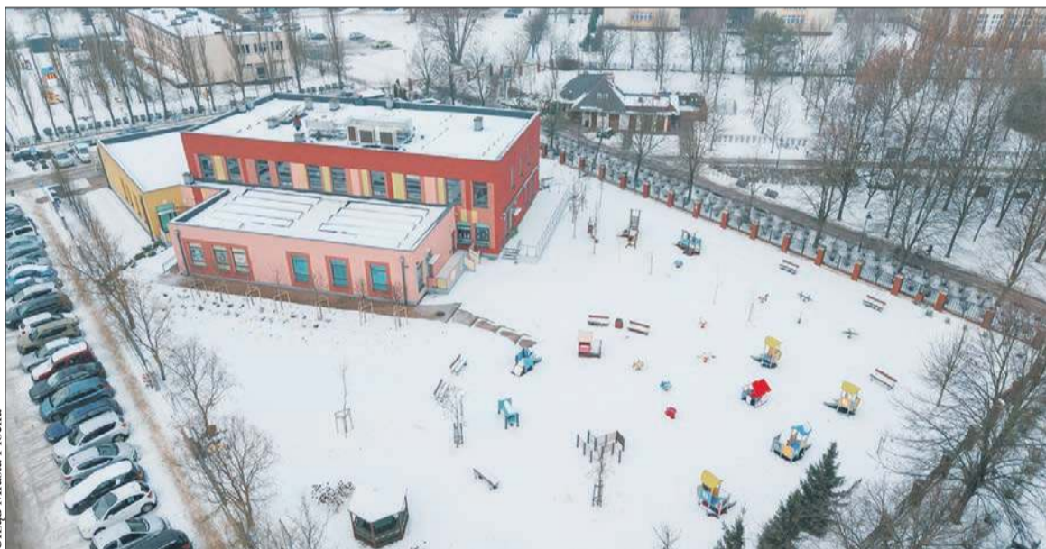
Żłobek Miejski nr 2 w Płocku

Płocka „Dwunastka” będzie miała nową salę gimnastyczną