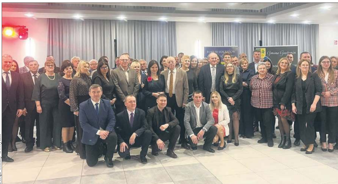
Urząd Gminy Gostynin

Spotkanie sołtysów i sołtysów gminy Gostynin to corocznie okazją do podsumowań i integracji