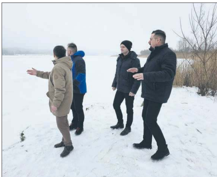
Samorządowcy przeprowadzili monitoring Wisły m.in. w rejonie Popłacina

- Z informacji przekazanych przez RZGW w Warszawie wynika, że w rejonie Płocka i Włocławka nie obowiązują obecnie ostrzeżenia hydrologiczne mogące wpływać na wzrost poziomu wód. Mimo to sytuacja hydro-meteorologiczna jest stale