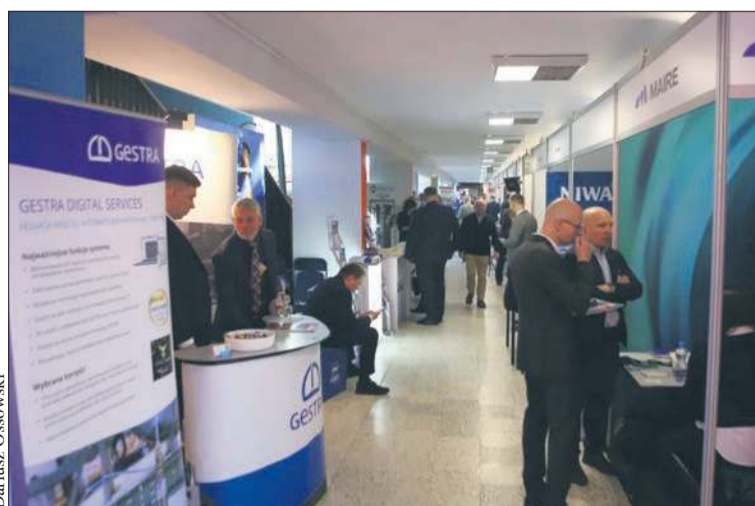
Podczas tegorocznego sympozjum Chemia zaprezentowało się ponad 40 wystawców