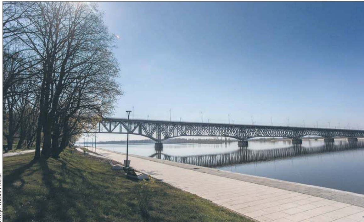
Urząd Miasta Płocka

Inwestycja na starej przeprawie jest jednym z elementów programu rozwoju infrastruktury mobilności indywidualnej w Płocku. Na liście przedsięwzięć w tym projekcie jest jeszcze 10 innych postulowanych przez płoczan projektów. Jednym z nich jest budowa także kładki rowerowej obok mostu nad Brzeźnicą w ciągu ul. Szpitalnej. W tym przypadku został już wybrany wykonawca, który przygotowuje obecnie projekt organizacji