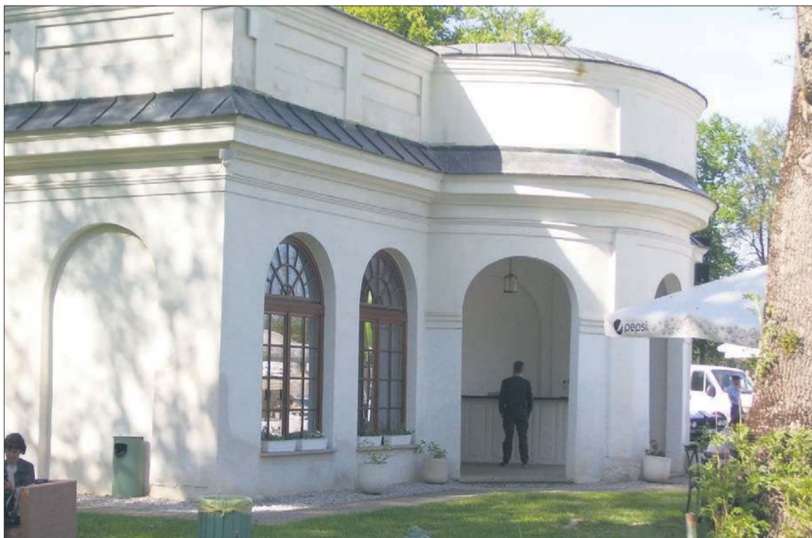
Pawilon zachodni, dawna oranżeria, obecnie hotel i letnia kawiarnia