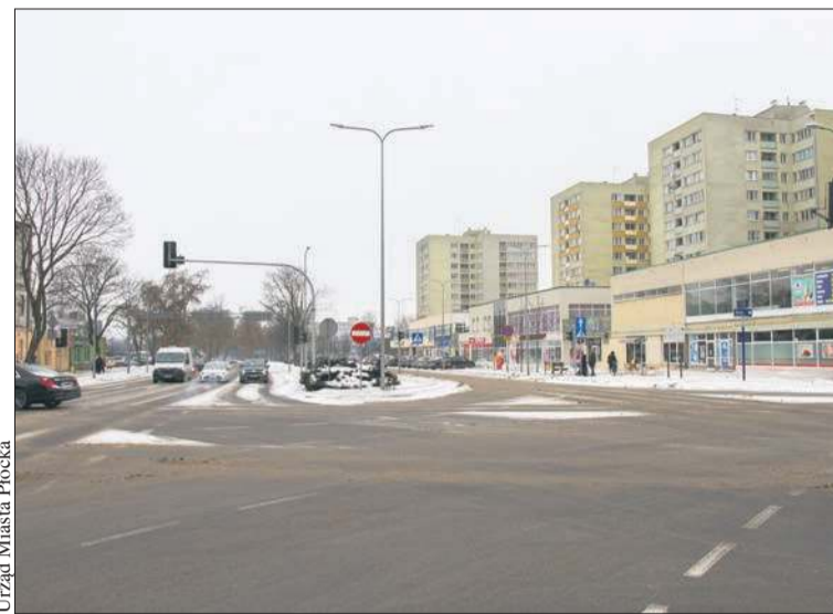
Urząd Miasta Płocka

– Utrudnień nie unikniemy, ale postaramy się je zminimalizować. Dlatego prace zostały podzielone