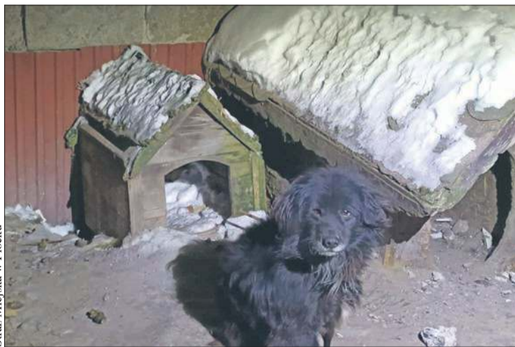
Straż Miejska w Płocku

O tej dramatycznej sytuacji poinformował Straż Miejską zaniepokojony mieszkaniec. Patrol na wskazanej posesji pojawił się w poniedziałek, 2 lutego przed godz. 20.00. Strażnicy nie mieli wątpliwości, że pies trzymany jest w zagrażających życiu warunkach. - Na dworze kilkunastostopniowy mroz, a pies był uwiązany na krótkim