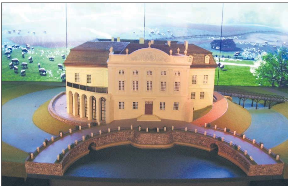
Makieta zamku z podjazdem po ostatniej przebudowie w XVIII wieku