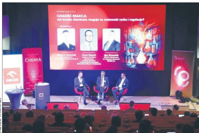
Sympozjum towarzyszyło szereg wykładów i paneli ze specjalistami z branży chemicznej i petrochemicznej

- Po raz kolejny mamy to sympozjum na Politechnice Warszawskiej, ponieważ jako ORLEN potrzebujemy kadr, a dokładniej nowych kadr – inżynierów przyszłości, którzy za 5-10 lat będą zajmować się naszymi procesami produkcyjnymi oraz nowymi technologiami, które wdrażamy. To już nie są ci sami inżynierowie, co