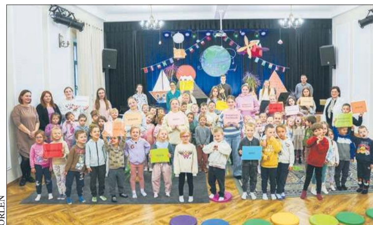
Dzięki udziałowi w programie „Kulturalny ORLEN” tysiące dzieci w całym kraju wzięło udział w ciekawych zajęciach przygotowanych przez placówki kultury