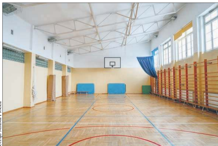
Obecna sala gimnastyczna w Szkole Podstawowej nr 12

ORLEN odkrył złożę gazu na Morzu Północnym