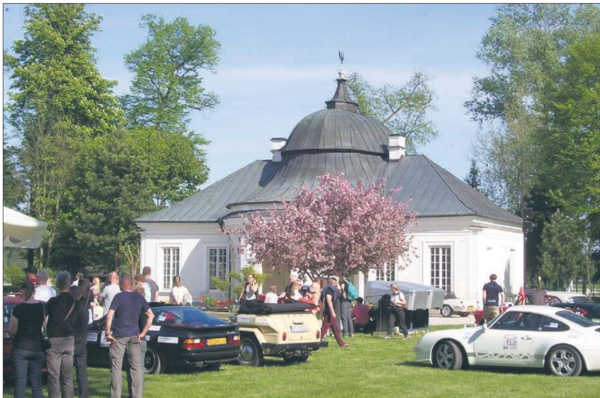
Pawilon wschodni, dawnej pałacyk myśliwski, obecnie hotel i miejsce konferencyjne