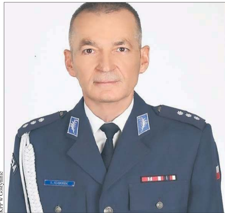
KPP w Gostyninie