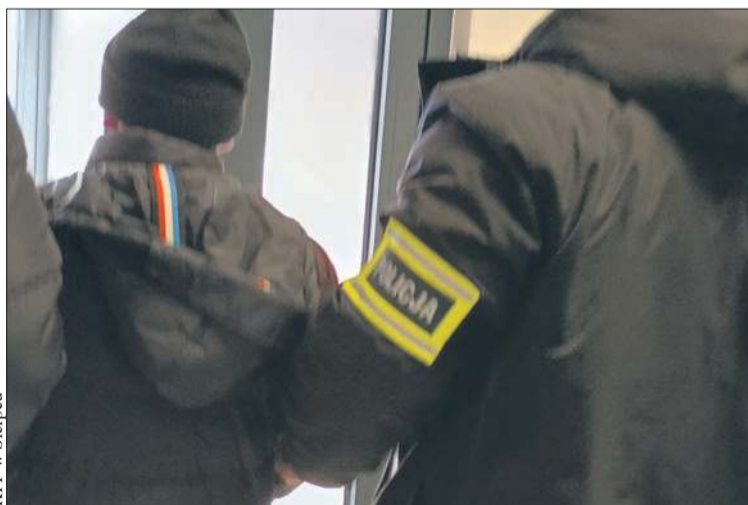
KPP w Sierpcu

55-latek z gminy Sierpc został zatrzymany przez policję w czwartek, 29 stycznia