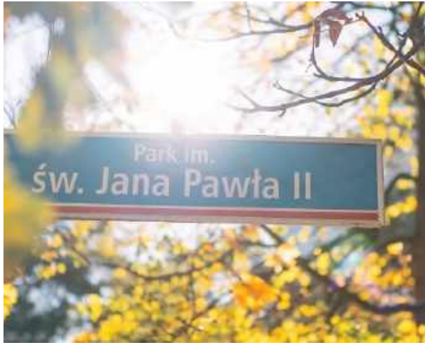
LEGIONOWO. Miejska zielen