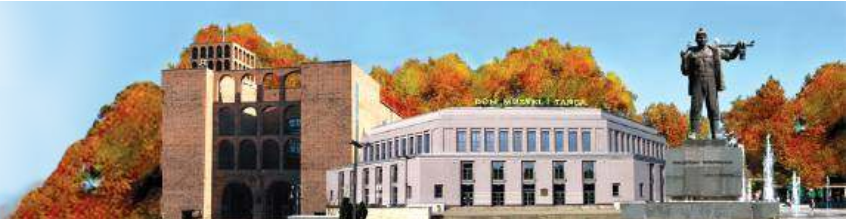
UKAZUJE SIĘ W KAŻDY CZWARTEK OD 1956 R.

Muzeum Górnictwa Węglowego ma kłopoty finansowe, bo prezydent nie chce go oddać w całkowity zarząd marszałkowi?