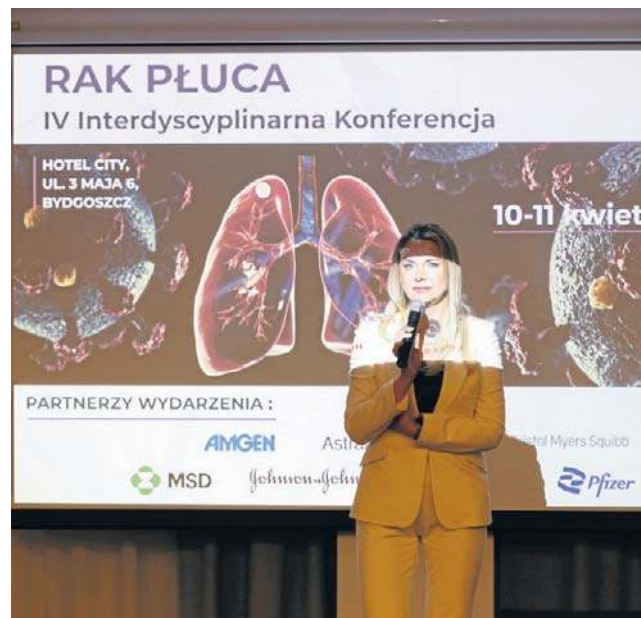
Organizatorami konferencji byli Centrum Onkologii oraz Lung Cancer Unit