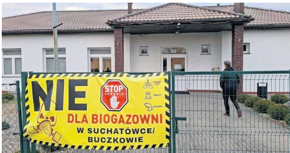
Mieszkańcy zapowiadają dalsze działania, w tym formalne zorganizowanie się w stowarzyszenie, które ma reprezentować ich interesy w postępowaniu

Z informacji przedstawianych mieszkańcom wynika, że planowana instalacja ma mieć znacznie większą moc niż typowe biogazownie funkcjonujące przy gospodarstwach rolnych. Zakład ma powstać kilkaset metrów od zabudowy i kilku miejscowości.