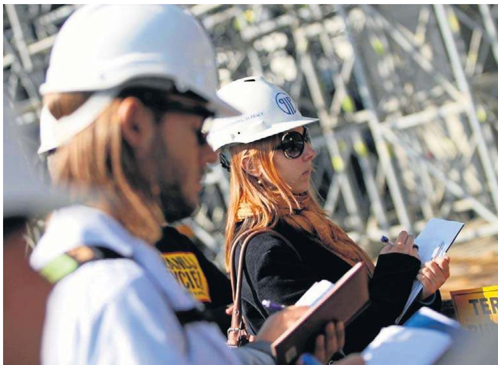
Uprawnienia inspekcji pracy będą szersze niż dotychczas

Jak zmiana umowy będzie wyglądała w praktyce? Najpierw inspektor wyda firmie polecenie usunięcia naruszenia (czyli zatrudnienie pracownika). Jeśli przedsiębiorca nie wykona polecenia, inspektor PIP będzie mógł złożyć wniosek do okręgowego in-