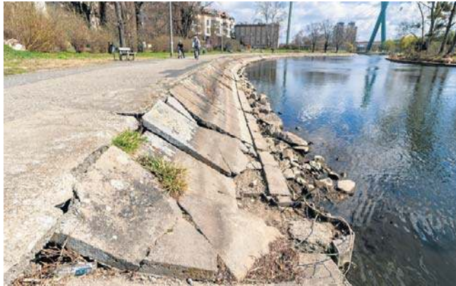
Także ten teren może doczekać się oczekiwanej rewitalizacji

Zapytaliśmy bydgoski ratusz czy zapadły już decyzje dotyczące tego, ile drzew trzeba będzie wyciąć, aby poprowadzić trasę pieszą i rowerową, jak ten zakres można ograniczyć