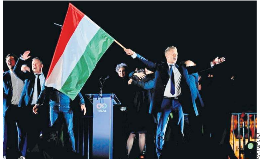
Objęcia urzędu premiera przez Petera Magyara należy oczekiwać najpóźniej w drugiej połowie maja - tak wynika z węgierskiej konstytucji i przepisów wyborczych

- Odzyskałiśmy nasze państwo, uwolniliśmy je. TISZA nie tylko wygrała, ale będzie mieć większość konstytucyjną