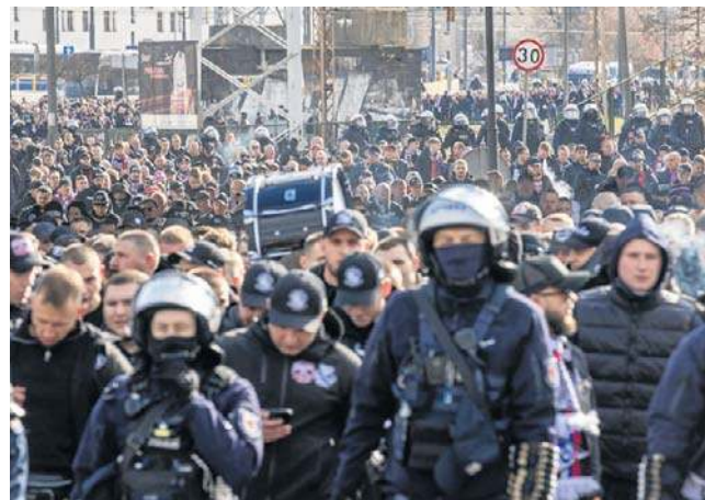
Kibice Górnika Zabrze, którzy przyjechali oglądać mecz w Bydgoszczy, byli eskortowani w drodze na stadion

„Dziękujemy zarówno mieszkańcom, jak i kibicom za wyrozumiałość w związku z utrudnieniami w ruchu, a przede wszystkim odpowiednie podejście do kwestii