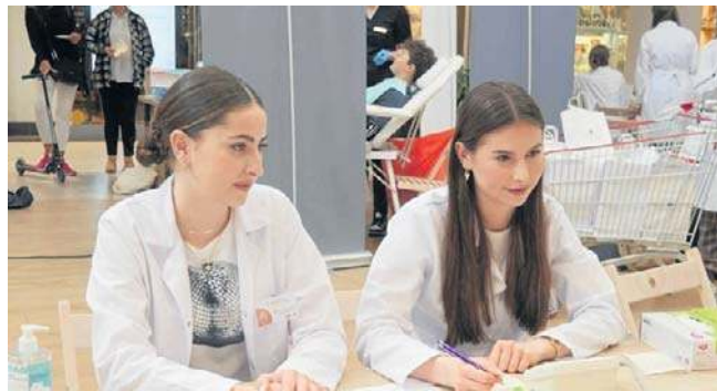
Program wydarzenia obejmie interaktywne warsztaty, sympozja, sesje szkoleniowe z zakresu kompetencji miękkich

Polskie Towarzystwo Studentów Farmacji jest samorządową i apolityczną organizacją non-profit zrzeszającą studentów i absolwentów farmacji z całej Polski. ©