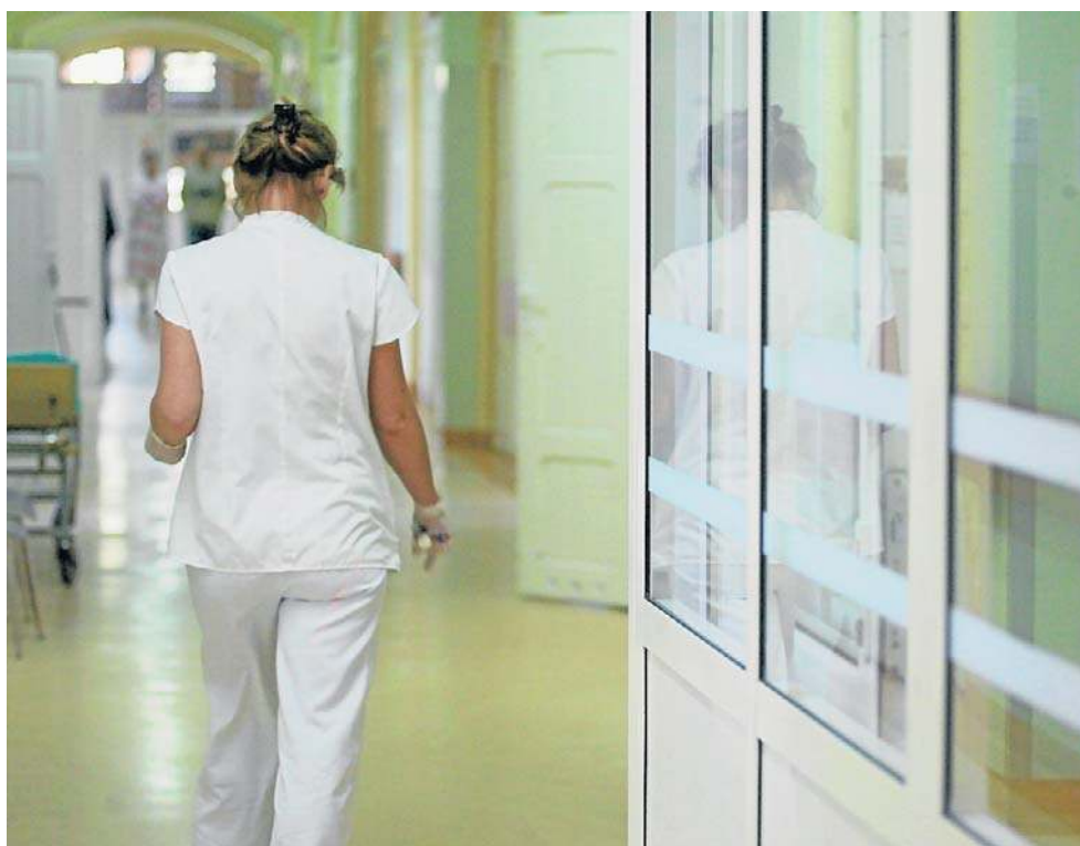
Nowe przepisy rozszerzające uprawnienia inspekcji pracy mogą zamieszać m.in. w szpitalach

- W sektorze ochrony zdrowia skutki reformy będą szczególnie odczuwalne, co wynika z unikalnej struktury zatrudnienia lekarzy oraz chronicznych niedoborów kadrowych. Reforma nie jest zmianą prawa pracy, lecz zmianą jego egzekucji. W sektorze medycznym, gdzie kontrakty są fundamentem operacyjnym, oznacza to wysokie ryzyko lokalnych turbulencji kadrowych, presji