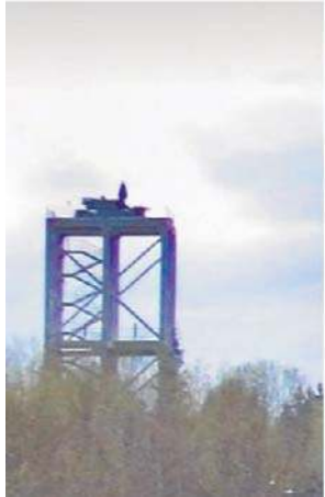
Rezydencji Putina strzeże już blisko 30 wież z systemami raketowymi Pancyr

Wcześniej Radio Swoboda odkryło również, że ponad 20 wież z karabinami maszynowymi dużego kalibru, a także kilka platform z przeciwlotniczym kompleksem raketowym Pancyr zostało zbudowanych na terenie i na obrzeżach specjalnej strefy ekonomicznej Ałabuga.