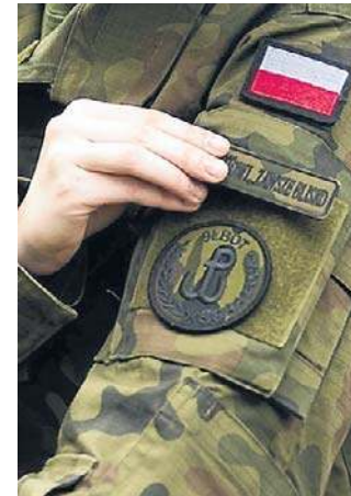
Jutro WOT ma swoje święto

Dzień Dumy z Munduru to moment, kiedy terytorialsi mogą wyjść z cienia i pokazać się w pełnym umundurowaniu, prezentując swoją podwójną społeczną rolę. A ich znajomi i sąsiedzi dowiedzą się, że osoby mijane na ulicy to także żołnierze Wojsk Obrony Terytorialnej, którzy łączą życie zawodowe i rodzinne ze służbą wojskową. ©©