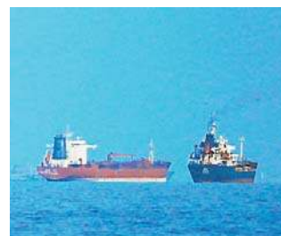
Porty nad Zatoką Perską muszą być dostępne albo dla wszystkich, albo dla nikogo

Rzecznik dodał, że porty nad Zatoką muszą być dostępne albo dla wszystkich, albo dla nikogo. Ostrzegł także,