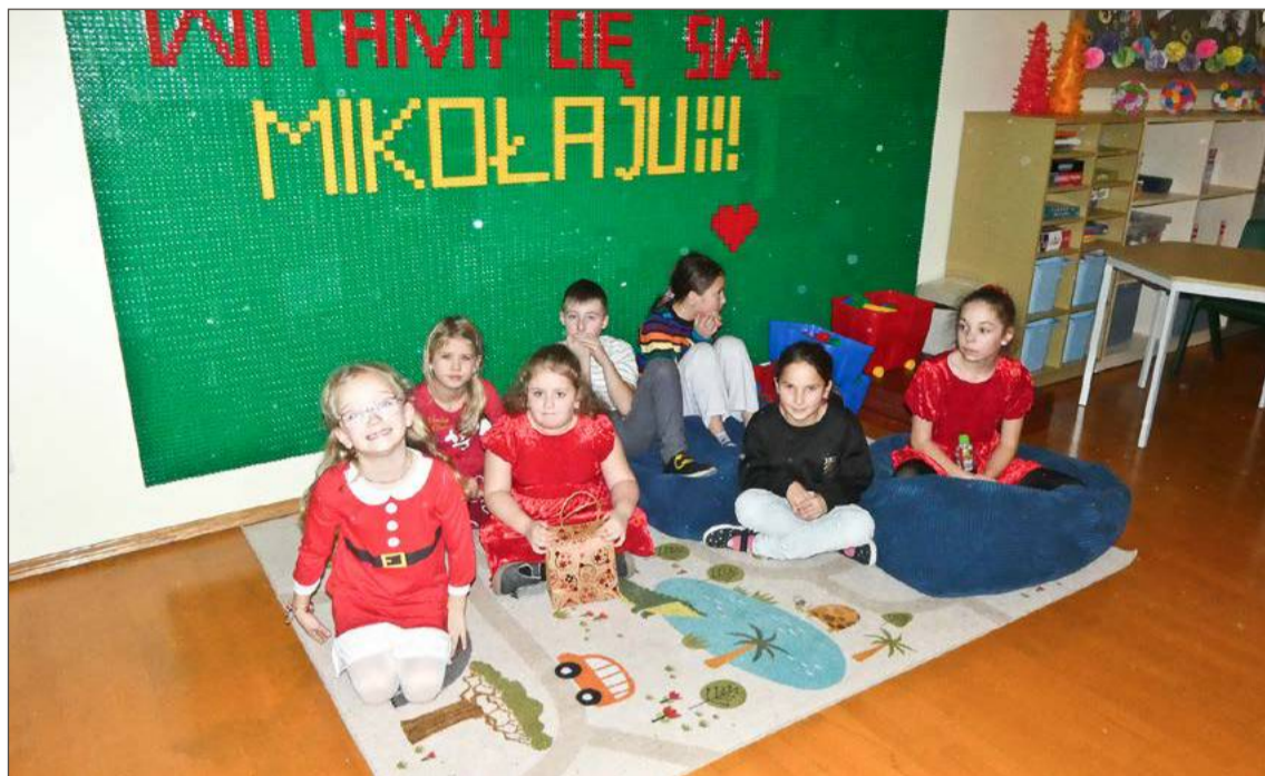
Z nowej świetlicy cieszą się wszyscy uczniowie SP w Łękach Górnych, a szczególnie ci najmłodszy.