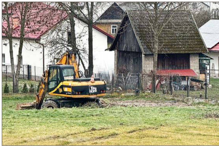
Pierwszy etap budowy kanalizacji w Starej Jastrzębce już się kończy.

W budżecie gminy Czarna na drugi etap budowy kanalizacji