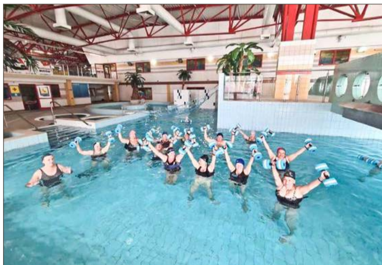
Agua aerobik z Radością.

Zadanie współfinansowane ze środków Województwa Podkarpackiego - Regionalnego Ośrodka Polityki Społecznej w Rzeszowie