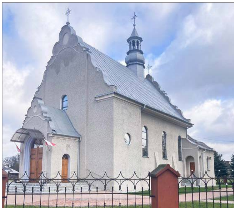
Na taki wizerunek swojej świątyni wierni z parafii Borowej czekali od lat.

Argumenty w nim zawarte były na tyle przekonujące, że do para-