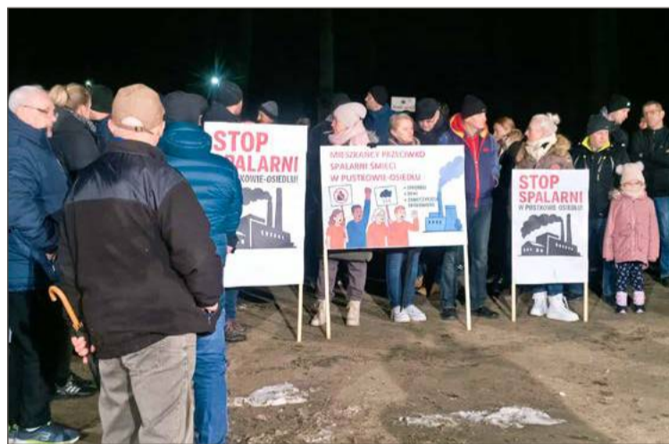
Mieszkańcy Pustkowa-Osiedla protestują przeciwko budowie instalacji.

Wniosek złożony został w czerwcu tego roku, analizując go, śledczy dopatrzili się nieprawidłowości.