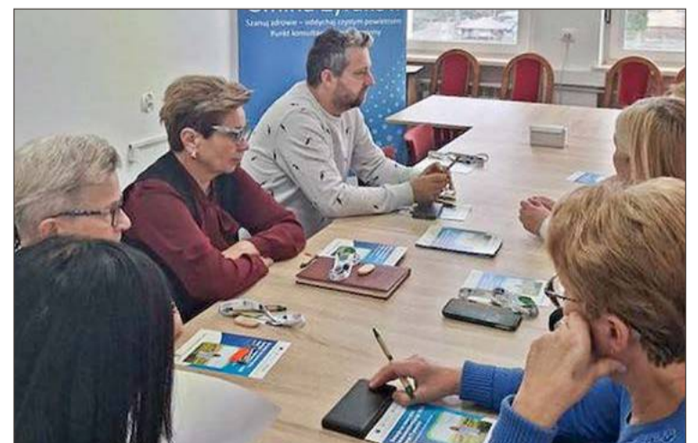
Podczas spotkania rozmawiano o potrzebach najuboższych mieszkańców.