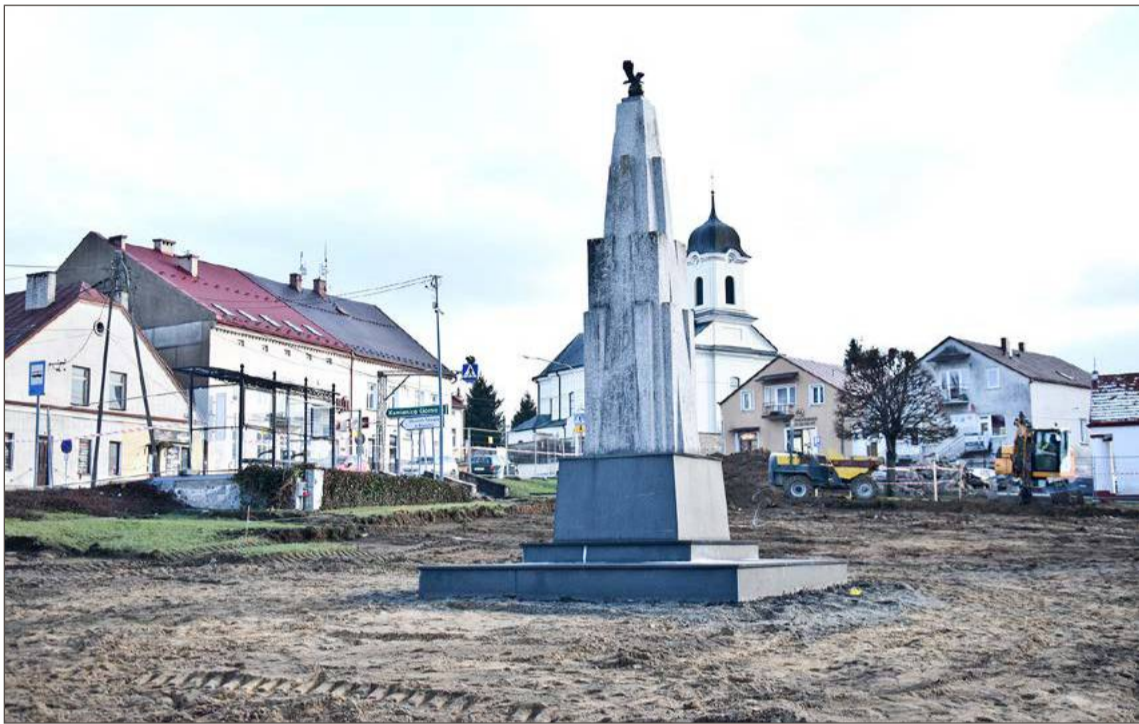
Burmistrz zgadza się z komentującymi, ale wyjaśnia, że on otrzymał gotowy projekt.

Dodaje jednak, że nie miał zbyt wielkiego wpływu na to, jak będzie ostatecznie wyglądało centrum miasta, bo kiedy objął urząd, to projekt był już gotowy. Jemu pozostało jedynie podpisanie umowy na wykonanie robót. Zanim jed-