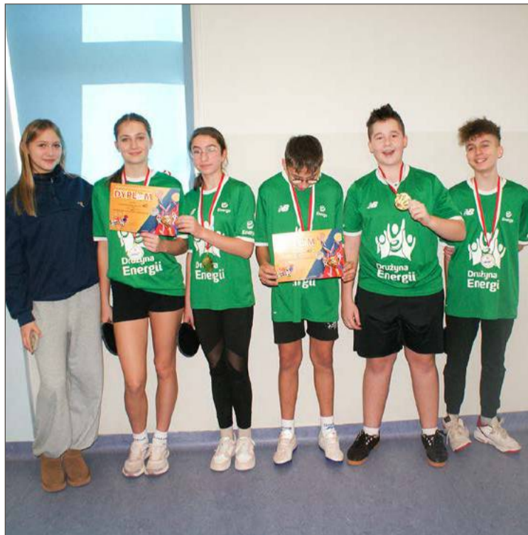
W tenisa stołowego najlepiej grają uczennice i uczniowie z SP nr 10.