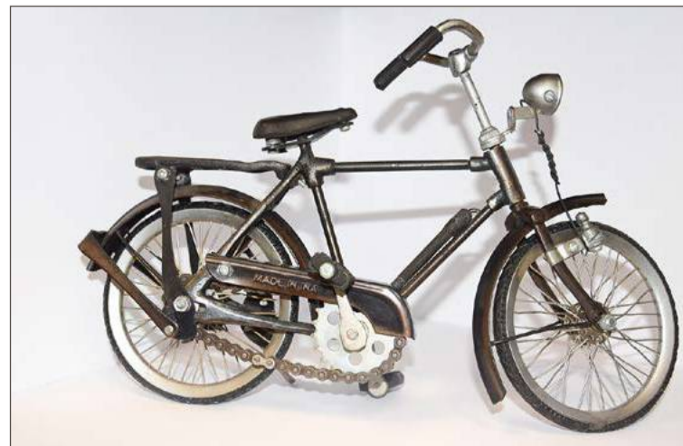
Na licytację trafi taka statuetka podarowana przez wójta Józefa Chudego.