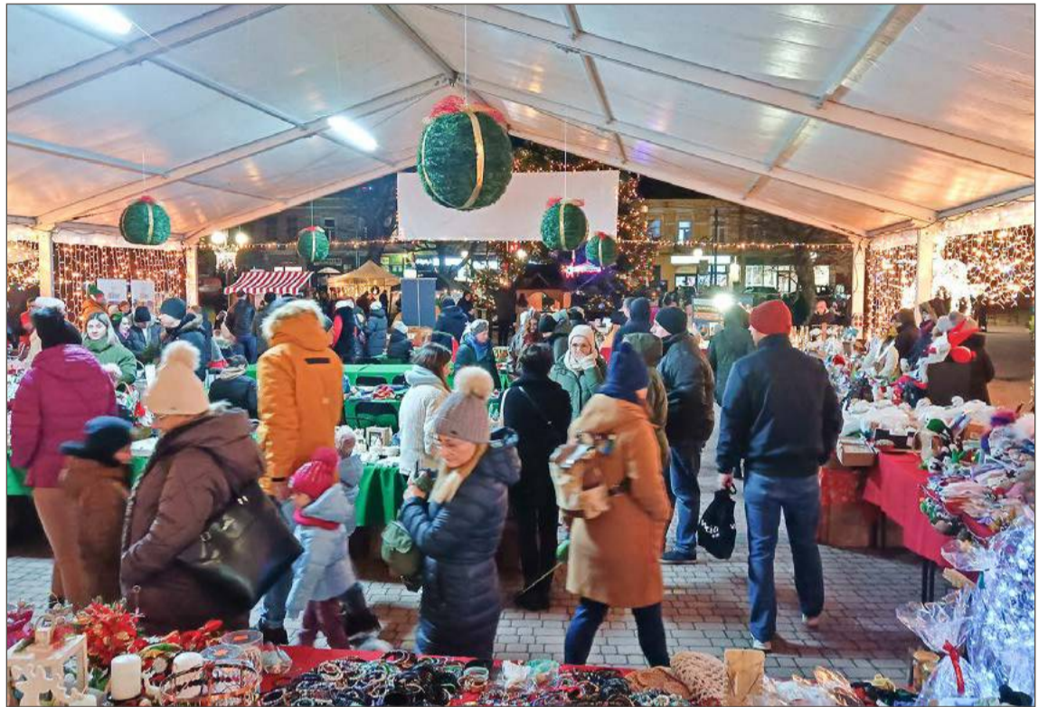
W Dębicy również zostanie zorganizowana miejska wigilia.

Kiermasz rozpocznie się o godz. 14 i potrwa do 18. Zmienia się miejsce jego organizacji w związku z trwającą przebudową Rynku. Wydarzenie zaplanowane zostało