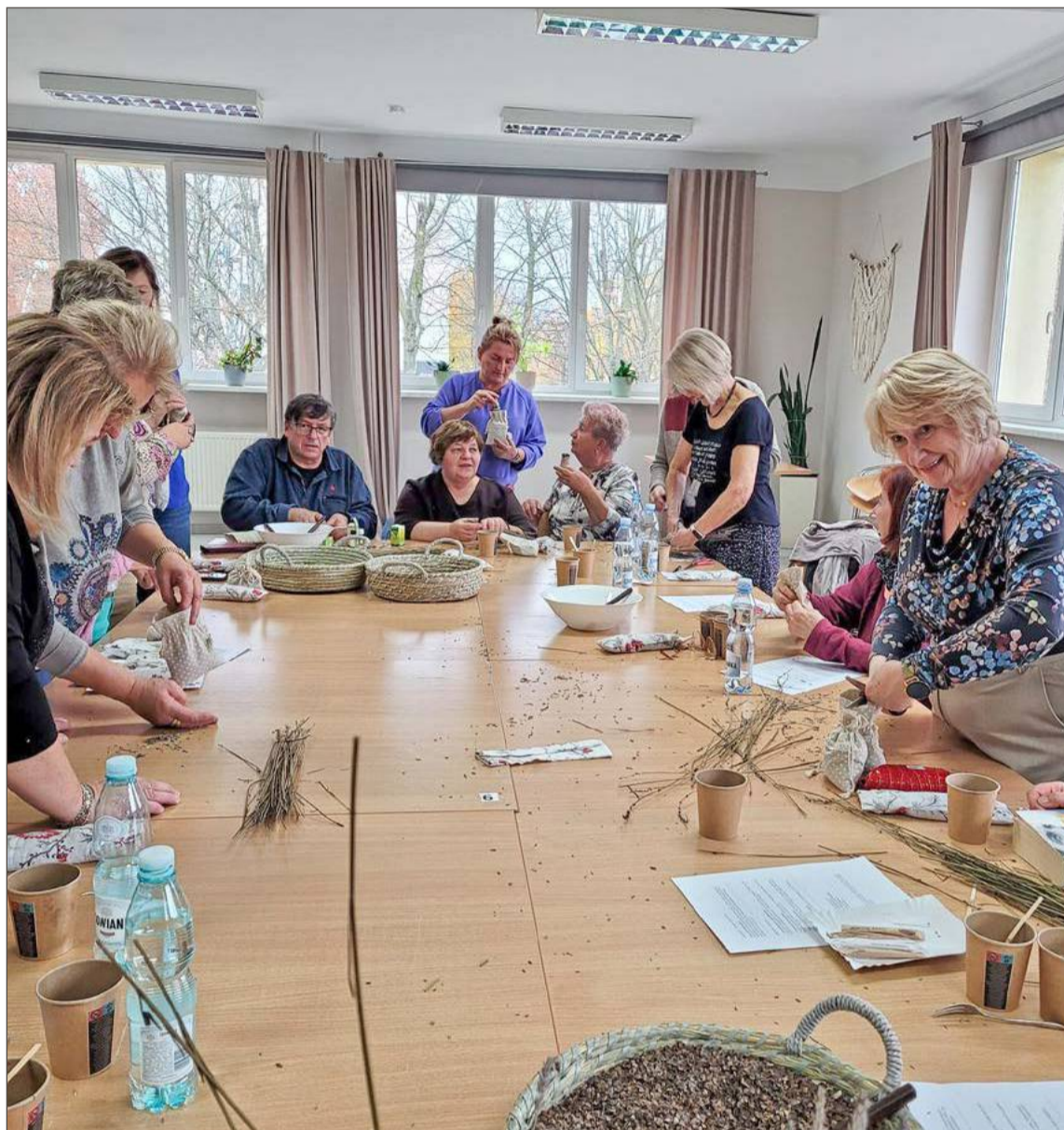
Botaniczne warsztaty sensoryczne.

Uczestnicy projektu bawili się na spotkaniu z piosenką biesiadną, uroczystości z okazji Dnia Seniora pod hasłem „Piosenki naszej młodości” oraz na spotkaniu Andrzejkowym.