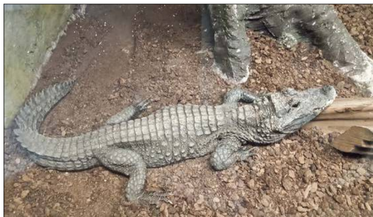
Krokodyl w ZOO.