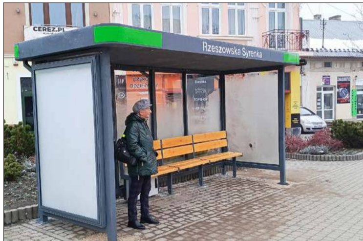
Przystanki mają barwę nawiązującą do koloru autobusów.

Nowe życie czeka wiaty już usunięte z ulicy Rzeszowskiej. Oby-