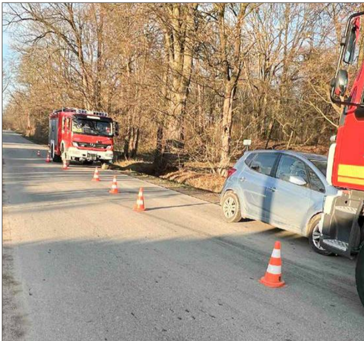
Pomocy poszkodowanemu udzielili strażacy, a następnie załoga pogotowia ratunkowego.

Kierująca osobowym hyundaiem 40-letnia mieszkanka Strzegocic je-