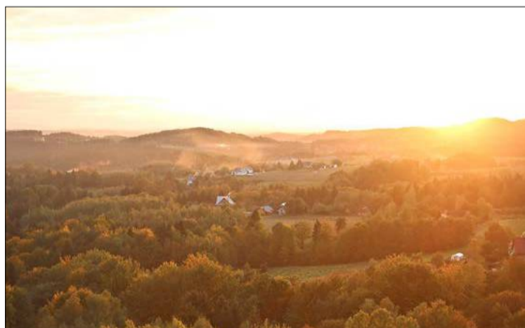
Światem zaczęła rządzić jesień.