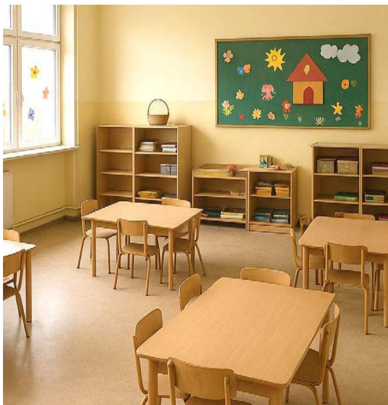
Czy za kilka lat przedszkola trzeba będzie zamykać. Fot. poglądowe/AI