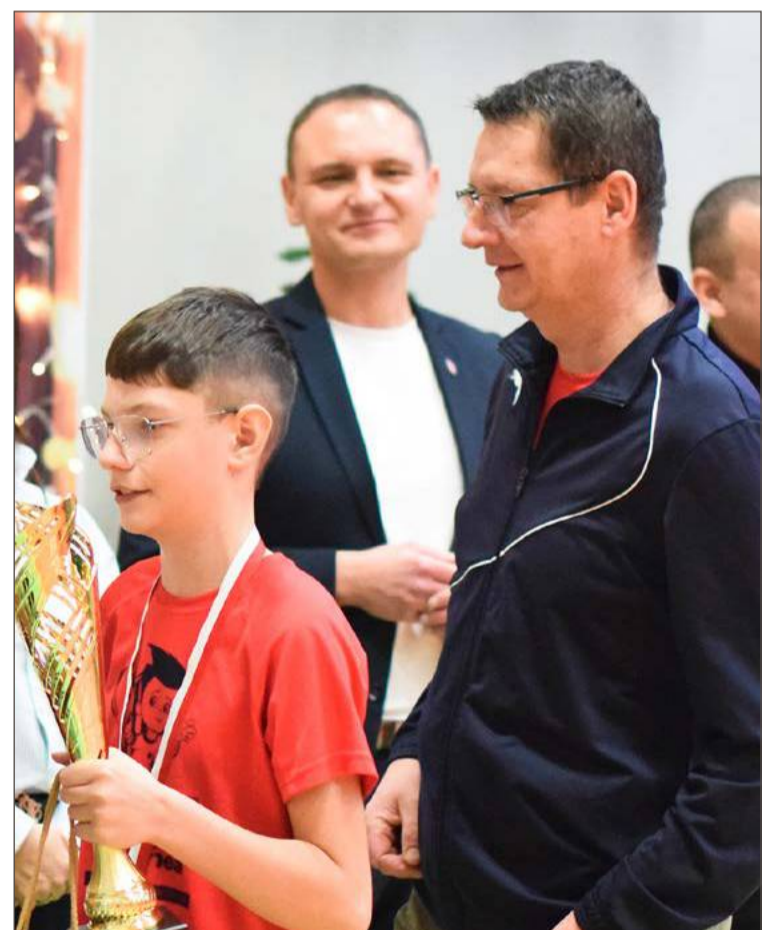
Druyna Madej Team zwyciężyła pierwsze mistrzostwa Dębicy.

Redakcję Obserwatora Lokalnego oraz debica24.pl były patronami medialnymi wydarzenia. Szersza fotorelacja z turnieju na debica24.pl.