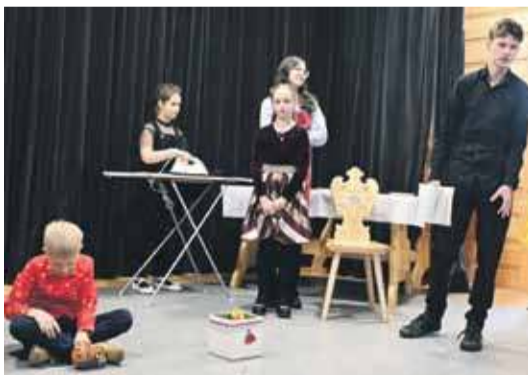
Krzątania domowa, a za chwilę będzie Boże Narodzenie.

Laureatami tegorocznego Gminnego Konkursu Jasełek i Grup Kolędniczych zostały: dwie grupy kolędnicze zespołu regionalnego „Krzesany” z Cichego, „Małe Orleńskie” z SP Czarny Dunajec, „Gwiazdeczki z zerówki” SP Piekielek, „Motylki” SPSK Czerwienne, „Krokusiki” z SP Podszkle, „Fantazja” z PSP nr SPSK Stare Bystre, „Trzynastka” z SP Odrowąż, „Kolędnicy spod Skałki” PSP nr 2 SPSK Stare Bystre, „Gracja” z SP Ratułów,