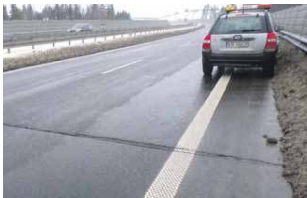
Pęknięcia w asfalcie pojawiły się ledwo rok po otwarciu nowego odcinka drogi krajowej.

Uszkodzenia mają postać niewielkich nierówności dro-