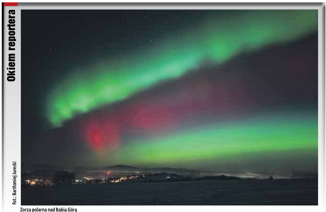
Zorza polarna nad Babią Górą