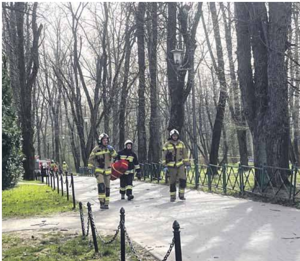
Upadające drzewo zabiło trzy osoby. - Tej tragedii nie dało się przewidzieć - uważa prokuratura.

Biegli wskazali, że bezpośrednią przyczyną upadku drzewa były anomalne podmuchy wiatru. Położone w okolicy Rabki stacje badawcze zanotowały podmuchy o sile 19,1 metra na sekundę. Wiatr wiejący