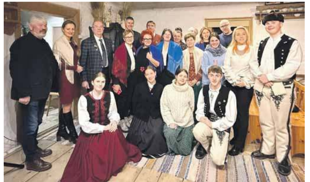
To oni stoją za wielkim sukcesem Stowarzyszenia Rozwoju Orawy.

Mało które stowarzyszenie może się pochwalić nawet reali-