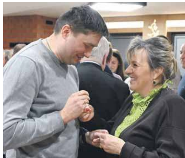
Spotkanie opłatkowe było okazją nie tylko do złożenia sobie życzeń, ale także również rozmowy, snucia planów na przyszłość.

Z członkami Związku Podhalan spotkał się proboszcz pa-