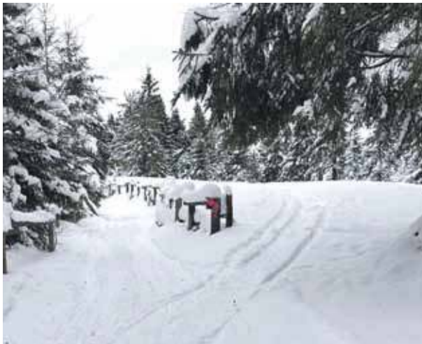
Przewężone płotami miejsce na trasie biegowej na Turbacz.

– Miejsce zwężone nadal istnieje, co uniemożliwia przejazd ratrakowi, aby przygotować trasę. Gmina wpadła na pomysł omińnięcia wspomnianego odcinka. Ratrak dojeżdża do zwężonego miejsca, po czym wraca do Obidowej i porusza się drugą doliną,