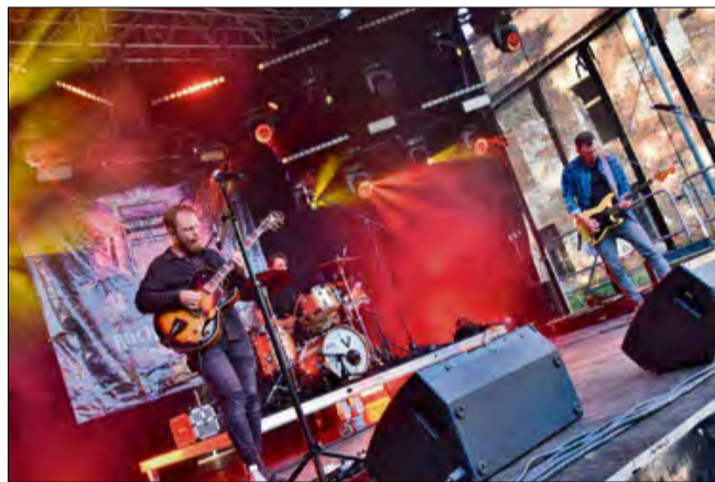
Festiwalowe chwile, które zostają na długo.