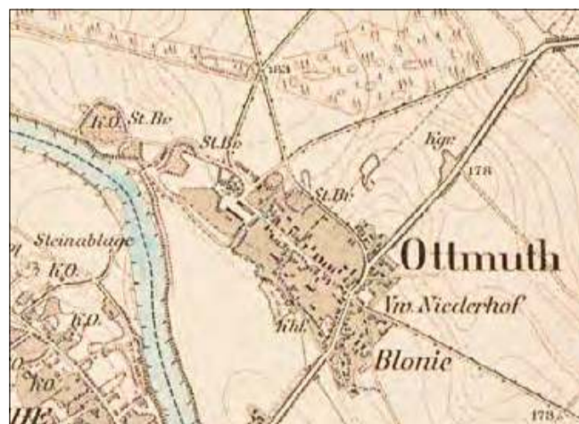
Otmęt na mapie sprzed 141 lat. To najmniejsza z miejscowości dzisiejszego powiatu krapkowickiego, która znalazła się w naszym zestawieniu.

kobiety. Wspólnota katolicka liczyła 639 dusz, ewangelicka – 103, a żydowska – 3. W Dąbrowie było 181 budowli, w tym 95 budynków mieszkalnych. Miejscowość zajmowała obszar liczący 1600 hektarów, w tym 574 hektary pól, 86 hektarów łąk i 843,3 hektara lasów.