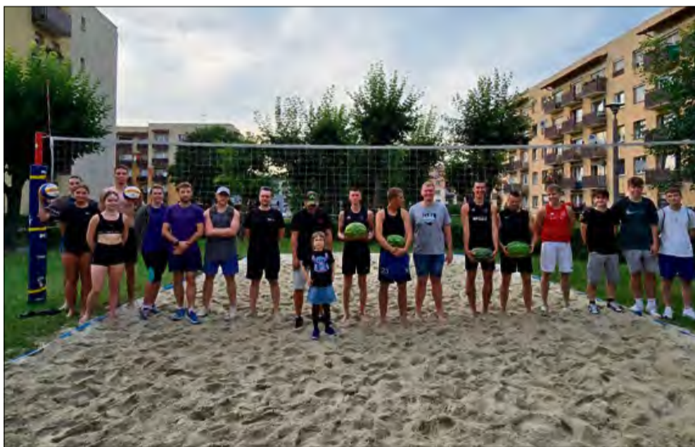
Arbuzowe trofea trafiły do rąk najlepszych zawodników turnieju siatkówki plażowej w Krapkowicach.

Letnie popołudnie, osiedlowe boisko i sportowa atmosfera pełna dobrej energii - tak wyglądał turniej siatkówki plażowej na Osiedlu XXX-lecia przy bloku nr 7. 25 lipca na piaszczystym boisku spotkały się cztery drużyny, by powalczyć nie tylko o zwycięstwo, ale i o niecodzienną nagrodę - arbuzy, ufundowane przez lokalny warzywniak z Otmętu.