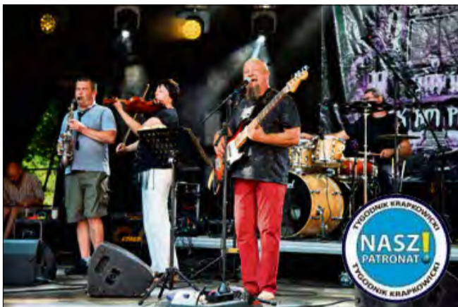
Dobra zabawa w rytmie rocka.

Są takie chwile w roku, kiedy muzyka staje się czymś więcej niż tylko dźwiękiem. Gdy gitary niosą emocje, bębny wyznaczają wspólny puls, a ludzie - mimo różnych historii, miejsc i języków - tworzą jedną społeczność. Właśnie taka atmosfera unosiła się nad Rozkochohem podczas Rock am Palast 2025. To nie tylko festiwal - to dowód na to, że dobre brzmienie ma siłę budowania mostów i zostaje w sercach na długo po wybrzmieniu ostatnich akordów.