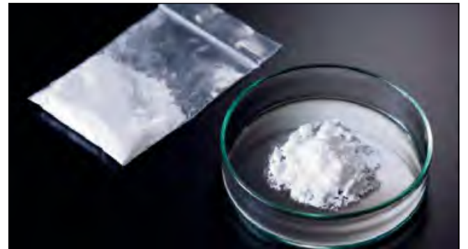
Lodówka pełna narkotyków. Zamiast żywności – amfetamina.

Kryminalni z Krapkowic i Ozimka wspólnymi siłami pracowali nad sprawą mieszkańca regionu, którego podejrzewali o związki z przestępczością narkotykową. Podczas pracy operacyjnej zbierali informacje i przeanalizowali zebrany materiał. Badania