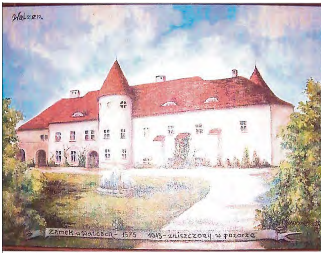
To, co zostało jedynie w pamięci - wizualizacja rezydencji, która przez wieki była sercem Walce.