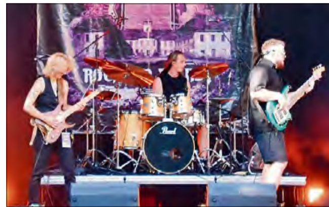
Letnia energia, świetna muzyka i niezapomniana atmosfera.

Łącznie podczas Rock am Palast 2025 wystąpiło 13 zespołów z Polski i Czech,