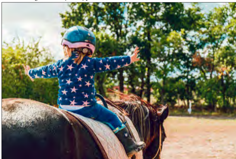
Zooterapia jest skuteczna m.in. zmniejszaniu poziomu lęku u dzieci.

2 czy schorzenia nerek. Wiele osób wyraża chęć zbliżenia się do natury, aby czerpać z niej pozytywne korzyści dla zdrowia psychicznego i fizycznego. Terapia naturą, czyli leczenie przyrodą, istnieje od dawna, a ludzie przez dziesiątki tysięcy lat żyli w bliskim związku z Ziemią, zanim zaczęli się wycofywać do wnętrza i odłączać od natury w ciągu ostatnich kilkuset lat.