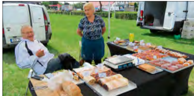
Warto wybrać się na Straganek po naturalne smaki prosto od regionalnych producentów.

Ale Straganek to znacznie więcej niż zwykły targ. To spotkanie z ludźmi - z pasją, z doświadczeniem, z historią. To forma wsparcia dla małych, rodzinnych gospodarstw, które codziennie, wbrew trendom masowej produkcji, wybierają jakość,