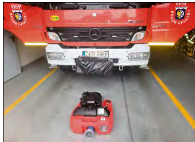
Nowoczesna motopompa znacząco zwiększy możliwości operacyjne rogowskich strażaków.