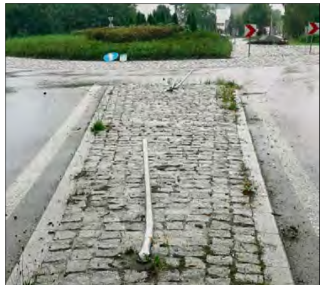
Uszkodzony został jeden znak oznajmiający oraz zielona tabliczka z nazwą miejscowości.