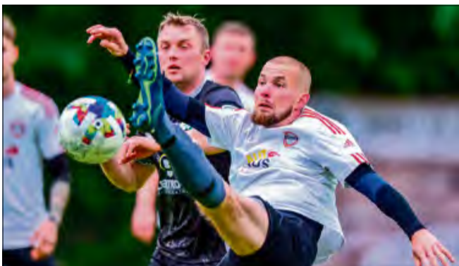
Piłkarze z Żywocia grę o ligowe punkty rozpoczną domowymi derbami z ekipą Raclawiczek.

Po tygodniach oczekiwania kibice w końcu doczekali się podziału na grupy w klasie A. Wśród 84 drużyn, które przystąpią do rywalizacji w sezonie 2025/2026 cztery są z powiatu krapkowickiego.