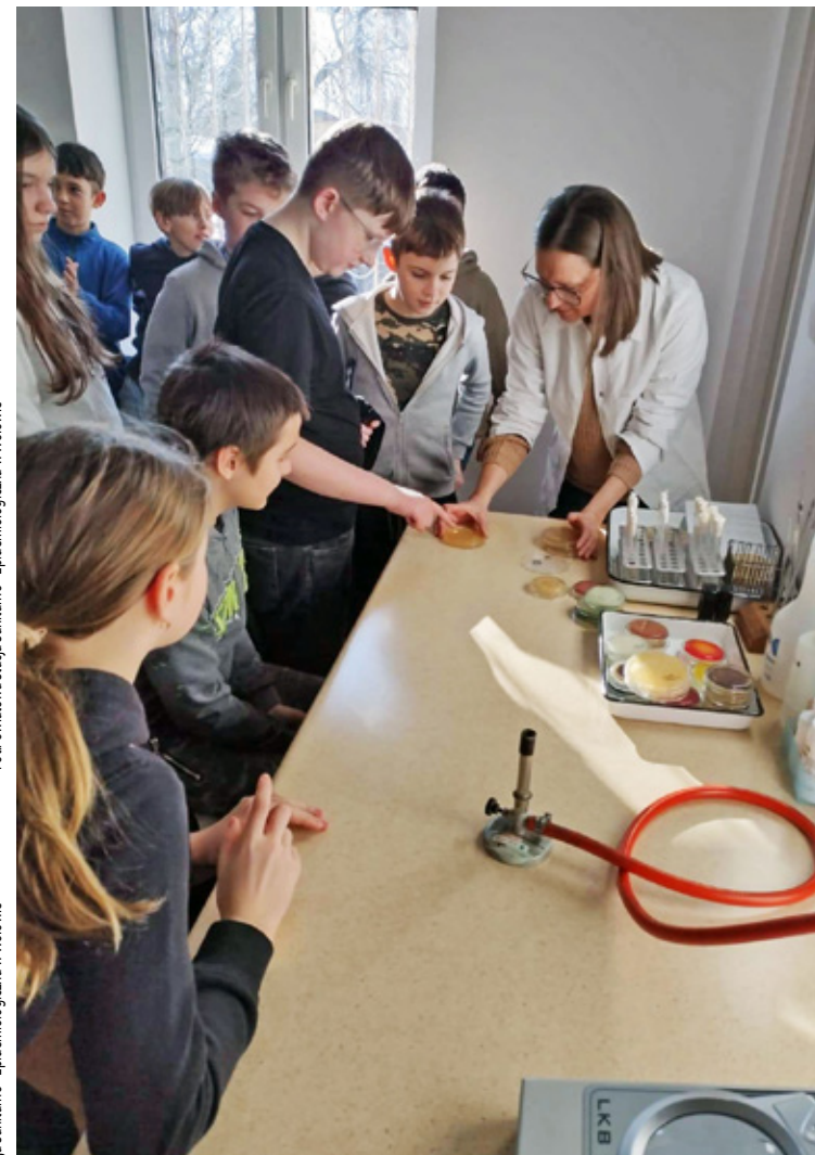
Fot.Powiatowa Stacja Sanitarно-Epidemiologiczna w Wołowie

jedząc jogurty i ogórki kiszone a także przyjmując antybiotyki podczas choroby oraz podziwia-