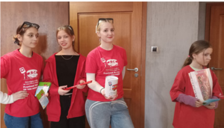
Wolontariuszki Fundacji Przystanek Rodzina

Gratulujemy pomysłodawcom Targów i dziękujemy za to wyjątkowe wydarzenie – to był dzień pełen inspiracji i emocji! KaTa