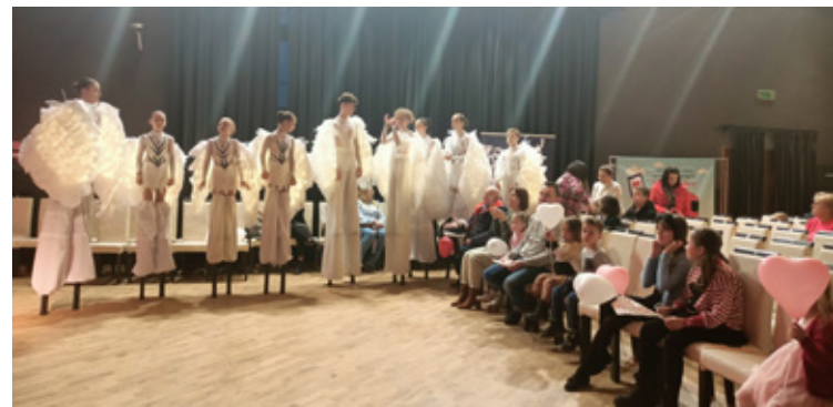
Widownia czekała z niecierpliwością na występy cyrkowe Areny