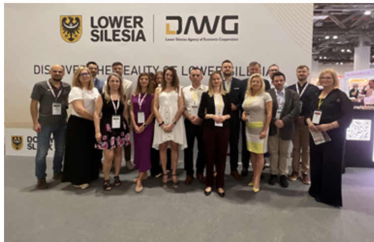
Delegacja z Dolnego Śląska na targach w Singapurze promowała lokalne firmy.