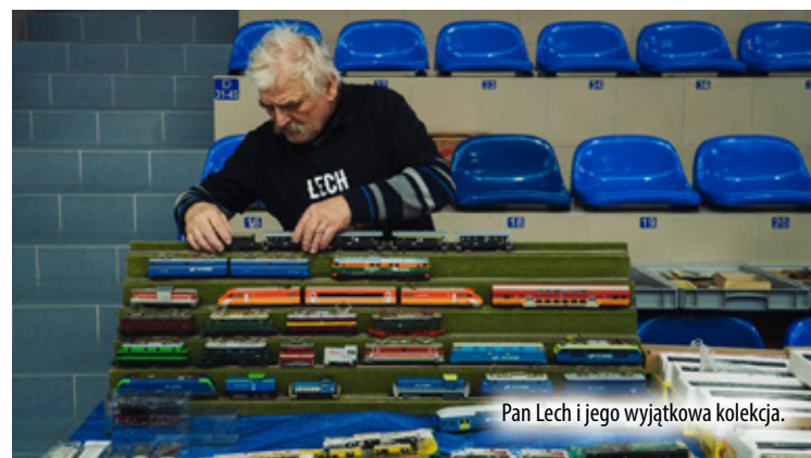
Pan Lech i jego wyjątkowa kolekcja.