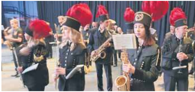
Orkiestra Dęta Zakładu Górniczego Sobieski