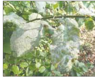
Mączniak na iwie

Lasy otaczające Sosinę są nieco starsze od tych, które poznaliśmy w poprzednim artykule, ale skład gatunkowy niewiele się różni. Znaczący wpływ na kondycję drzewostanu ma podwyższona wilgotność podłoża. Dominują sosny zwyczajne, jest sporo brzozy brodawkowatej. Dalej idzie topola osika, lipa drobnolistna. Nie brak oczywiście olszy czarnej oraz olszy szarej. Trafiły się nawet jawory, buk pospolity. Z krzewów wyróżnia się kalina koralowa. Zauważyłem jeszcze wierzbę iwę porażoną przez mączniaka – Erysiphe capreae oraz rdzę Melampsora caprearum . Mączniak