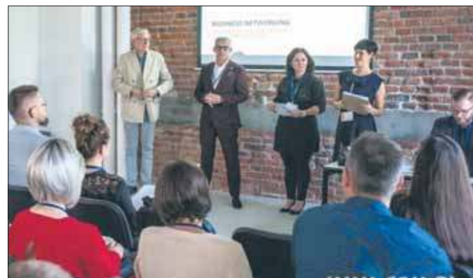
Ekipa Łętowski Consulting tworzy nowoczesną przestrzeń networkingową

Sto tysięcy złotych – właśnie tyle otrzymali przedsiębiorcy, którzy dzięki projektom realizowanym przez Łętowski Consulting zdecydowali się otworzyć własne firmy. Podczas drugiego networkingowego spotkania w Jaworznie mogli nie tylko zaprezentować swoje biznesplany, ale także pochwalić się pierwszymi sukcesami. Była to również świetna okazja do integracji lokalnego środowiska biznesowego.