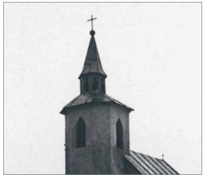
Kaplica św. Barbary i Matki Boskiej Częstochowskiej

Na terenie Jaworzna sygnaturek takich pozostało niewiele. Wiąże się to z faktem, że i starych, zabytkowych kościołów jest u nas jak na lekarstwo. Dominują bowiem świątynie, które powstawały w latach siedemdziesiątych czy osiemdziesiątych XX wieku. Wieżyczka taka jest m.in. w obrębie kościoła św. Elżbiety Węgierskiej w Szczakowej. Była też na wybudowanym tuż przed wojną prezbiterium obecnego kościoła św. Wojciecha w Jaworznie. Prezbiterium istnieje oczywiście do dziś, aczkolwiek sygnaturkę rozebrano i „przykryto” charakterystycznym płaszczem, nawiązującym do zadania przedniej części obecnego budynku kościelnego. Ale co ciekawe, w jednej ze świątyń w obrębie naszego miasta jest sygnaturka, którą zawieszono na wieży, przez którą wchodzi się do wnętrza. Chodzi tutaj o niewielką kaplicę pw. św. Barbary, znaną szerzej jako kaplica Matki Boskiej Często-