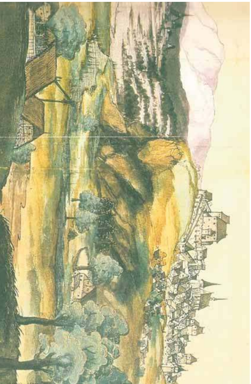
Widok Będzina w XVI wieku, będącego siedzibą starostwa niegrodowego (wikipedia)

Chłopi w Rzeczpospolitej szlacheckiej byli grupą społeczną notorycznie spychaną na margines i upośledzaną. Byli pozbawieni większości praw, pozbawieni własności, sami zresztą będąc własnością swoich panów. Perspektywę jakiegokolwiek awansu byli znikome, zaś jedną z nich, acz przeznaczoną dla bardzo niewielu, był zaciąg do wojska.