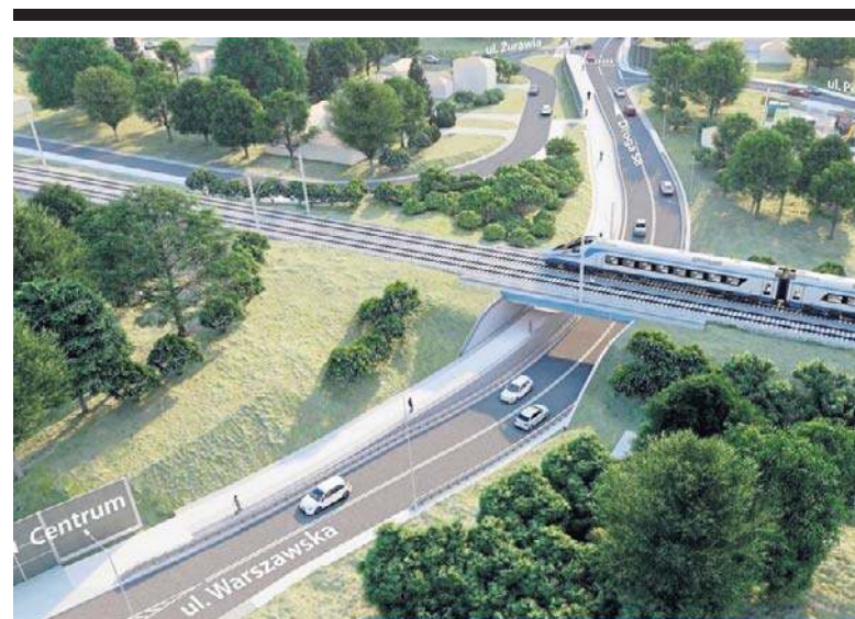
WIZUALIZACJA PKP PLK