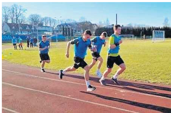
Podczas egzaminów sędziowie musieli wykazać się kondycją podczas biegów na krótkich dystansach

była interpretacja kontaktów z piłką podczas meczów - mówi. - Potem przyszedł czas na egzaminy. Najpierw sędziowie zmierzali się z testem wideo oraz testem teoretycznym, a następnie sprawdzili swoją formę na bieżni podczas biegów krótkich oraz testu interwałowego. Muszę powiedzieć, że wszyscy byli bardzo dobrze przygotowani zarówno pod względem merytorycznym, jak i fizycznym. To napawa optymizmem przed zbliżającymi się wiosennymi meczami ligowymi. ©