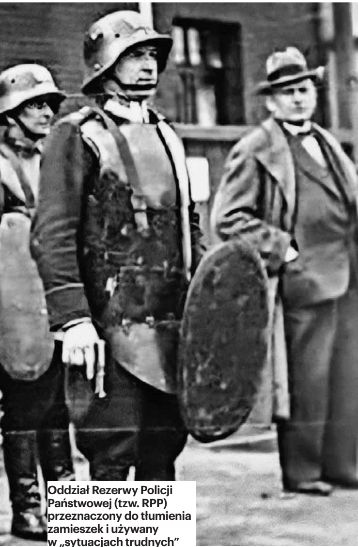
Oddział Rezerwy Policji Państwowej (zw. RPP) przeznaczony do tłumienia zamieszek i używany w „sytuacjach trudnych”