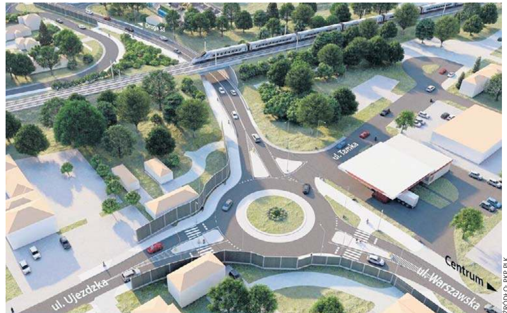
Wizualizacja dwupoziomowego skrzyżowania, które pozwoli na likwidację dotychczasowego przejazdu drogowo-kolejowego w Tomaszowie

Tunel zastąpi przejazdy kolejowo-drogowe Budowa bezkolizyjnego skrzyżowania oraz nowego