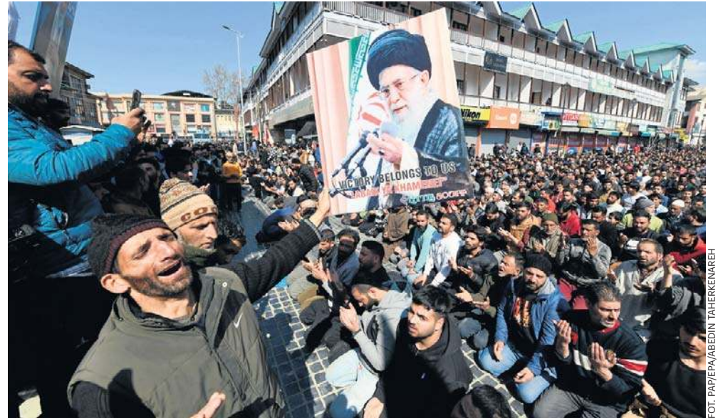
W sobotę w amerykańsko-izraelskim ataku zginął najwyższy przywódca duchowo-polityczny Iranu Ali Chamenei. Jego następcę ma wybrać Zgromadzenie Ekspertów

Ali Chamenei, który od 1989 r. zajmował pozycję najwyż-