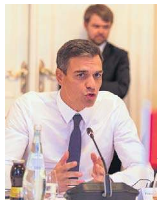
Premier Pedro Sanchez zajął stanowczą postawę

Trump określił Hiszpanię jako „straszny” sojusznika. - Hiszpania nie ma zupełnie niczego, czego potrzebujemy, poza wspaniałymi ludźmi. Ma wspaniałych ludzi, ale nie ma wspaniałych władz - stwierdził Trump.