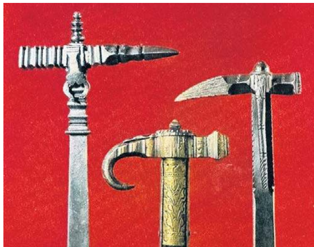
Od lewej: nadziak z XVII w., obuszek z wieku XVIII i nadziak z tego samego okresu (Muzeum WP w Warszawie)

Jak Chryzostom Pasek pisze w swoich pamiętnikach: „»Obuchem w piersi - padł«. Był to zatem cios ciężki, choć nie krwawy, tłómaczący wyrażenie językowe »pod obuchem«, czyli pod groźną ciosu”.