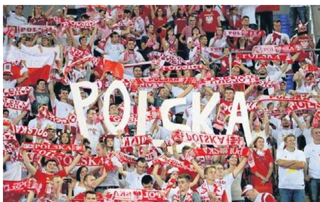
Tak bywało w Atlas Arenie podczas meczów siatkarzy

Poinformowano także, że grudniowa ceremonia losowania odbędzie się Kopalni Soli w Wieliczce.