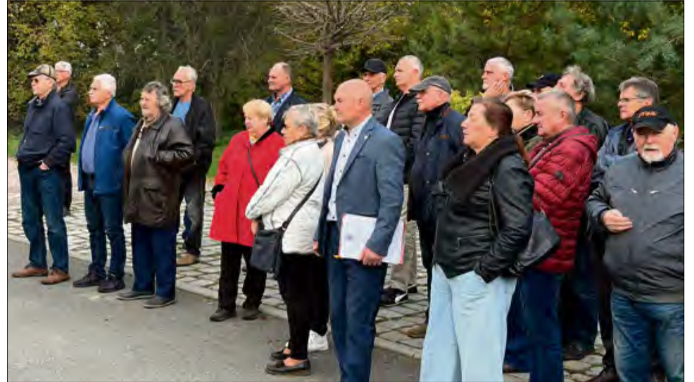
Goście z uwagą przyglądali się strażackim działaniom.

proszonych gości. Następnie oddano głos krapkowickim policjantom. Ci wykonali pokaz zachowywania się pod wpływem alkoholu z użyciem specjalnych alkohogoli. Mundurowi omówili też kwestie związane z zagrożeniem wynikającym z wyludzeń pieniędzy metodą na wnuczka.