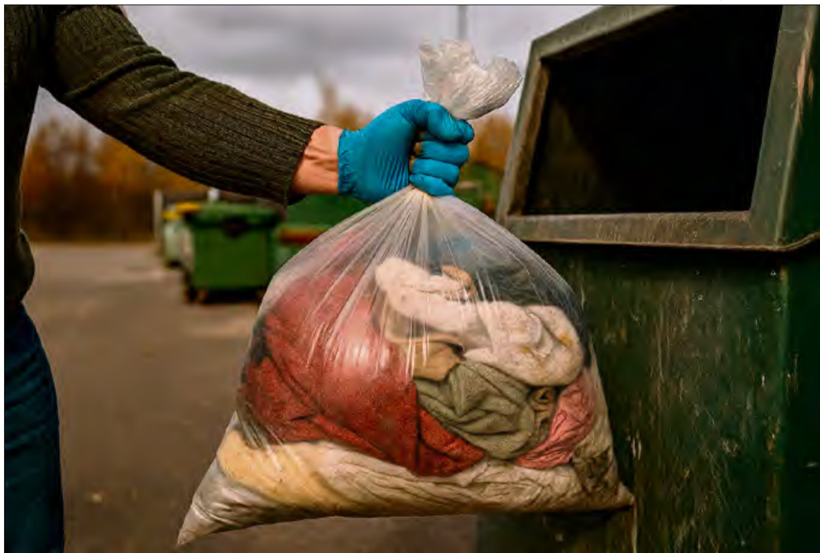
Zużyte tekstylia trafiają do PSZOK-ów – selektywna zbiórka w praktyce.

Resort klimatu i środowiska podkreśla, że recykling tekstyliów wciąż napotyka pewne wyzwania. Jednym z nich jest duże zróżnicowanie materiałów, z których wykonane są ubrania, co utrudnia ich przetwarzanie i recykling. Dodatkowo niektóre procesy recyklingowe mogą generować odpady, które wymagają dodatkowego przetwarzania.