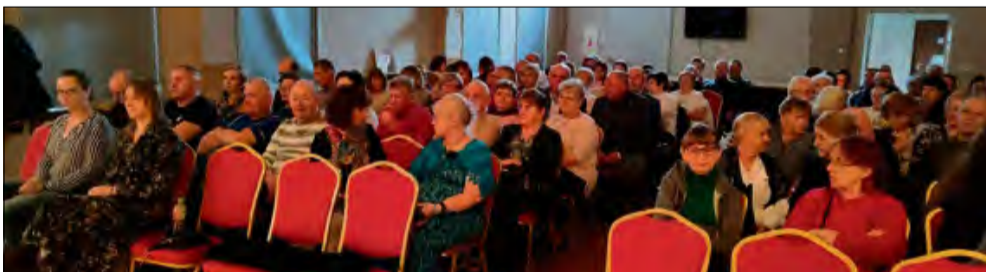
Spektakl obejrzało aż 120 osób.

W niedzielę 12 października w Gminnym Ośrodku Kultury w Strzeleczkach odbył się spektakl pod tytułem „Pomożecie? Pomożemy!”. Sztuka w lekki i humorystyczny sposób przeniosła publikę do realiów PRL-u, do miejscowości o wdzięcznej nazwie Nędza.