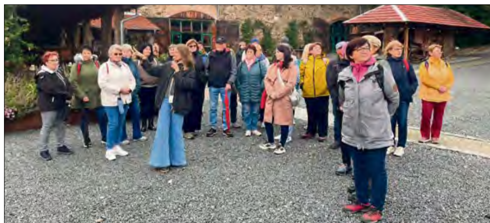
Uczestnicy wycieczki z uwagą wsłuchiwali się w opowieści przewodniczki.

Samorząd gminy Gogolin zorganizował wycieczkę dla swoich mieszkańców. Celem eskapady było znane Arboretum w Wojstawicach na Dolnym Śląsku.