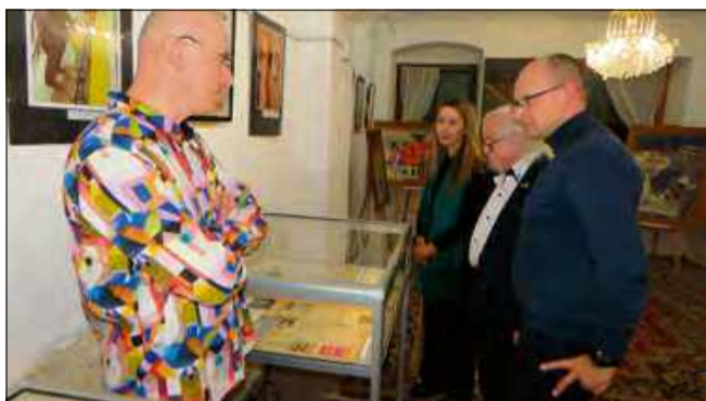
Podczas finału uczestnicy mogli podziwiać prezentację archiwalnych zdjęć.

Sentymentalny wieczór, prezentacja archiwaliów i nastrojowa muzyka - tak w Galerii „Studnia” w Krapkowicach wyglądał finał wystawy „Otwarta Galeria Malarstwa Polskiego na Rynku w Krapkowicach 1975-2025. Wspomnienie...”. Wydarzenie było artystycznym zwieńczeniem obchodów 50-lecia jednej z najważniejszych inicjatyw kulturalnych w historii miasta, która na nowo ożyła we wspomnieniach i opowieściach.