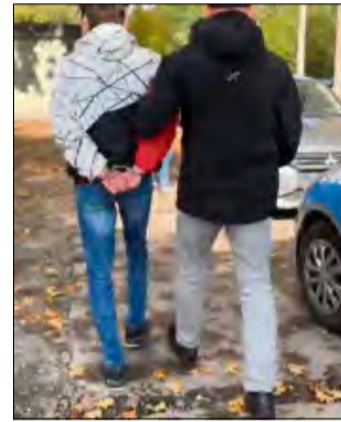
Po sprzeczce agresor udał się do kuchni, skąd wrócił z nożem i rzucił się na rodzinę.

Tuż po ataku 39-latek uciekł z mieszkania. Na miejscu szybko pojawili się funkcjonariusze policji oraz medycy. Do poszukiwań