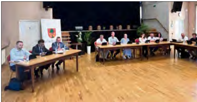
Temat został poruszony podczas przedostatniej sesji Rady Miejskiej w Strzeleczkach. Posiedzenie odbyło się 25 września.

- Panie radny, tę wodę pije pan już od trzech ty-