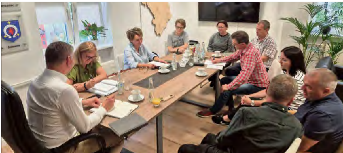
Rada ekologiczna omówiła kilka bardzo ważnych tematów.

Z a nami kolejne posiedzenie Rady ds. Ekologii w Urzędzie Miejskim w Gogolinie. W centrum dyskusji znalazły się kluczowe kwestie dotyczące gospodarki odpadami, walki z inwazyjnymi gatunkami roślin oraz edukacji młodego pokolenia.