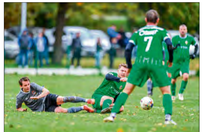
Grząska murawa nie ułatwiła zadania zawodnikom obu ekip.