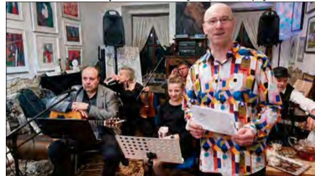
Artystyczną atmosferę dopełniły nastrojowe dźwięki zespołu „Gramy z Beata”.

Efektom tych wieloletnich starań było nie