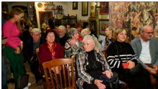
Wydarzenie przyciągnęło bardzo wielu mieszkańców.

- Gdy doszły mnie słuchy, że Władysław Strzemiński (bohater