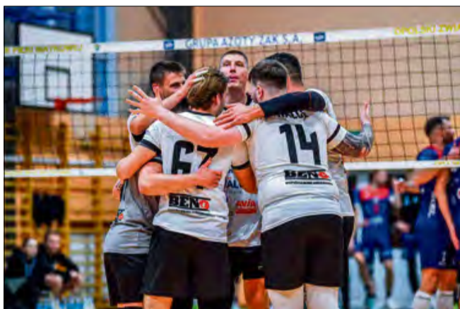
Siatkarze z Walce byli zadowoleni po meczu z pierwszoligowcem.

stawówki wypełniła się po brzegi a blisko setka fanów siatkówki stworzyła fajną, piknikową atmosferę przy wsparciu zaprzyjaźnionego bębniarza.