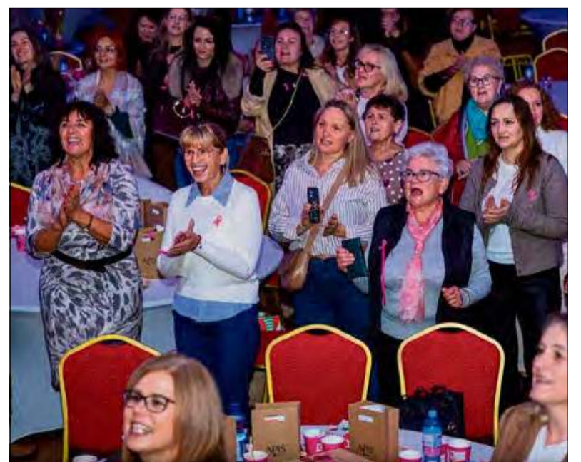
Była też okazja do wspólnego śpiewu.