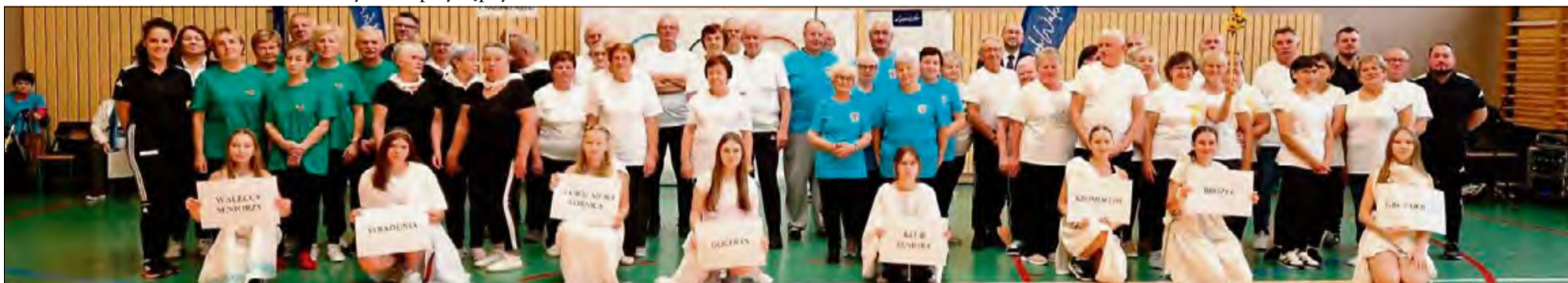
Podczas Seniorady każdy był zwycięzcą.