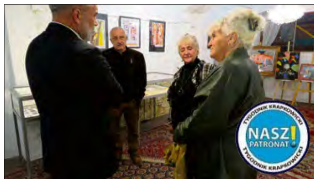
Zwiedzający żywo dyskutowali o całej wystawie.