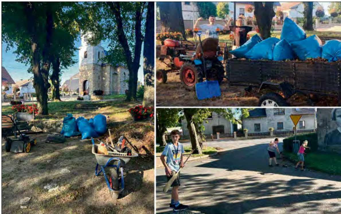
Mieszkańcy Oleszki zadbali o piękno swojej miejscowości.

D zięki wspólnemu zaangażowaniu mieszkańców Oleszki Plac Rekreacyjny przy lokalnej kapliczce, przystanek oraz skwery zyskały nowy, zadbane wygląd. W ramach społecznej inicjatywy zgrabiono i uprzątnięto liście oraz suche gałęzie, które następnie trafiły do worków i zostały wywiezione.