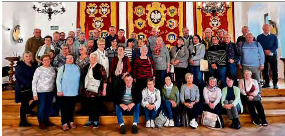
Wycieczka do Brzegu pozwoliła seniorom na odkrywanie nowych zakątków Opolszczyzny.

Uczestnicy musieli zmierzyć się z dziesięcioma konkurencjami, które bardziej przypominały zabawę niż poważne zawody, ale wymagały sprytu, refleksu i koordynacji. Były m.in. wyścigi z piłeczką na łyżce, rzuty do celu, strzały do bramki, wyścigi z balonem czy – ku uciechu publiczności –