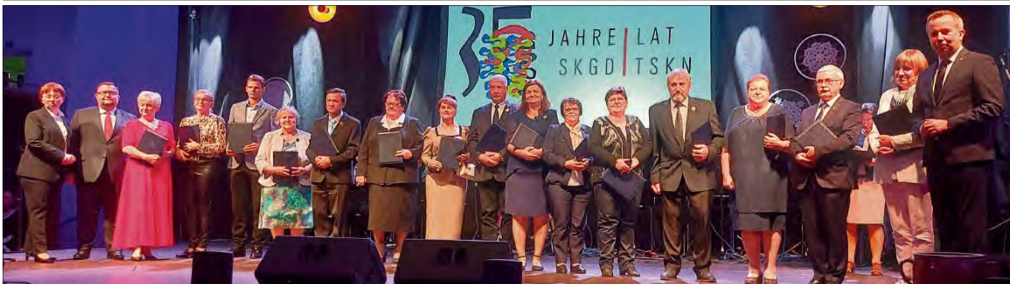
Wśród odznaczonych byli też przedstawiciele z naszego powiatu krapkowickiego.