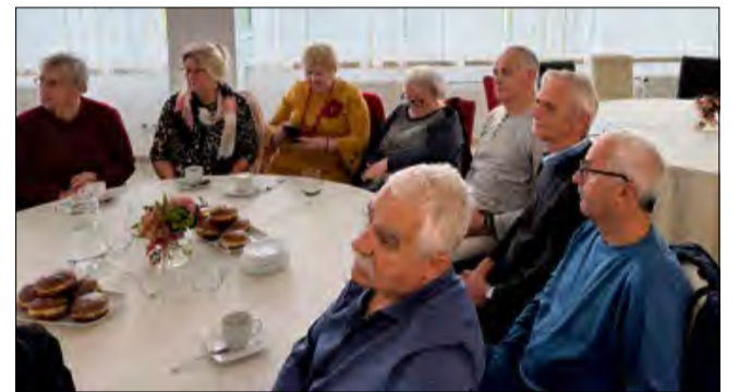
W siedzibie starostwa można było dowiedzieć się czegoś więcej na temat szeroko rozumianego bezpieczeństwa.

Potem strażacy podzielili się poradami związanymi z szeroko rozumianym bezpieczeństwem. Były też zajęcia praktyczne z udzielania pierwszej pomocy i postępowaniem w sytuacjach niebezpiecznych. Na koniec, czyli po podsumowaniu warsztatów nastąpiło przekazanie pakietów seniora.