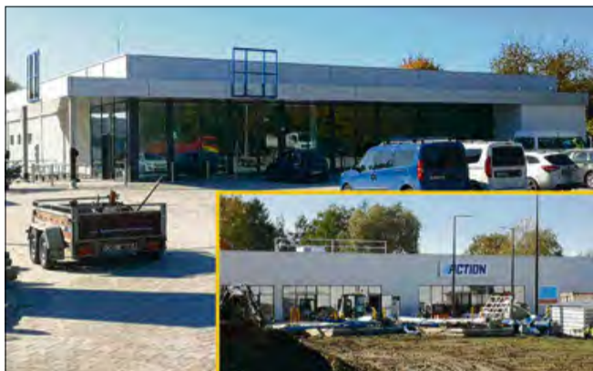
Mieszkańcy Zdzeszowic zyskają nowe miejsca zakupów jeszcze w tym roku.

Action i Lidl niebawem otworzą swoje sklepy w Zdzeszowicach. Budowa nowego centrum handlowego przy ulicy Góry Świętej Anny wkracza w decydującą fazę, a mieszkańcy zyskają nowe miejsca zakupów jeszcze w tym roku.