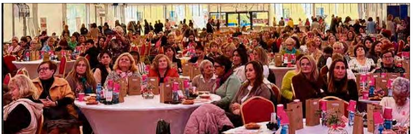
W spotkaniu udział wzięło liczne grono kobiet z powiatu krapkowickiego.

W sobotę, 11 października 2025 roku, w zabytkowym Pałacu w Żyrowej odbyło się wydarzenie „Siła Kobiet Żyrowa 2025”, które zgromadziło mieszkanki powiatu krapkowickiego oraz sąsiednich gmin. Spotkanie poświęcone było zdrowiu kobiet, profilaktyce i inspirującym rozmowom o roli kobiet w życiu społecznym.