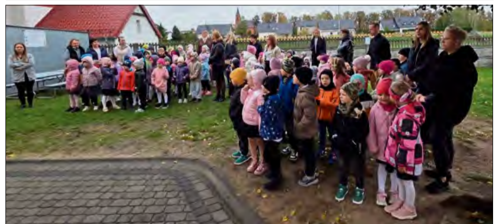
Dla dzieci to były bardzo ważne chwile.

W połowie października odbyło się ważne dla maluchów święto w Strzeleczkach. Mowa o uroczystości nadania logo Publicznemu Przedszkolu z Oddziałem Integracyjnym. To były niezapomniane chwile.