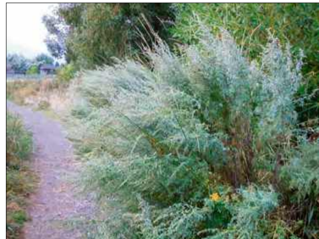
Bylica piołun Artemisia absinthium to roślina o wielu twarzach jednak w nadmiarze może być trująca.