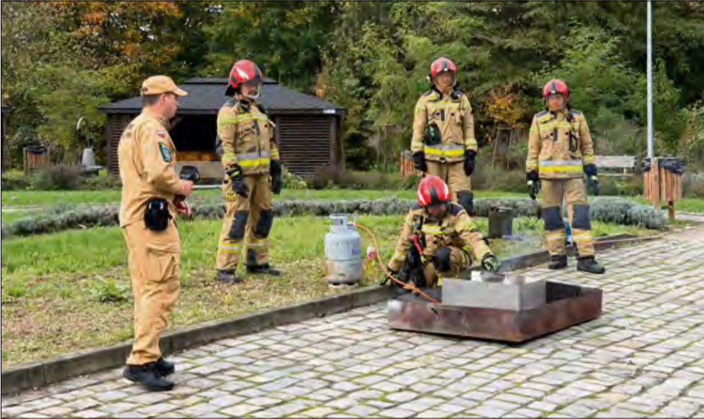
Wszystko zaczęło się od pokazu gaszenia płonącego oleju w wykonaniu krapkowickich strażaków.

W starostwie powiatowym w Krapkowicach odbyły się warsztaty dla seniorów, które poprowadzili nasi policjanci oraz strażacy. Tematyką zajęć było szeroko rozumiane bezpieczeństwo.