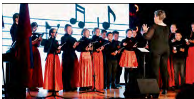
Konferencja była okazją do prezentacji artystycznych uczniów.

Program wydarzenia nie ograniczył się do oficjalnych podsumowań. Na scenie po-