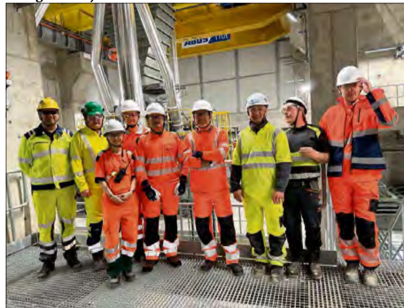
Nowa instalacja to milowy krok na drodze do dekarbonizacji branży budowlanej.

my, który pozwala odpowiedzieć na rosnące zapotrzebowanie rynku na materiały zgodne z ideą zrównoważonego budownictwa. Unikatowość instalacji polega na jej wyposażeniu w prasę rolową, która pozwala na niezwykle precyzyjny, niezależny przemiał klinkieru portlandzkiego oraz surowców alternatywnych, takich jak kamień wapienny czy granulowany żużel wielkopiecowy. Ta technologiczna precyzja umożliwia następnie dokładne komponowanie i mieszanie tych składników w celu stworzenia