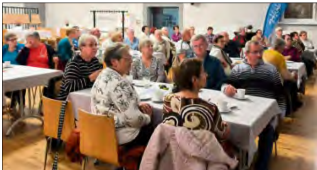
To nie tylko spotkania, ale też praktyczna dawka wiedzy serwowanej... herbatce.

To był ich tydzień. Od 12 do 18 października gmina Walce rozbrzmiewała śmiechem, muzyką i rozmowami. Tegoroczny Tydzień Seniora podkreślił, że aktywne życie zaczyna się tam, gdzie są ludzie, którzy chcą się spotykać, działać i czerpać radość z bycia razem. Program obfitował w spotkania międzypokoleniowe, wyjazdy, zawody sportowe i koncerty - każdy dzień niósł ze sobą nowe emocje i doświadczenia.