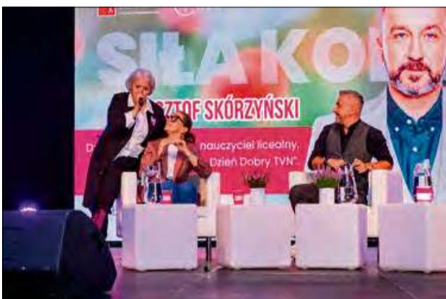
Na zebranych czekało wiele prelekcji i rozmów.

W Pałacu w Żyrowej odbyło się wyjątkowe wydarzenie „Siła Kobiet Żyrowa 2025”. Bezpłatne badania profilaktyczne, eksperckie panele i inspirujące rozmowy pokazały, że kobiety w powiecie krapkowickim mają ogromną siłę i realny wpływ na życie społeczne.