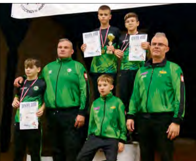
Tak prezentowała się drużyna ZKS-u Gogolin na turnieju w Kędzierzynie-Koźlu.

Kraśnicki, krajowy był w ramach XXXIII czempionat rozgrywany Międzynarodowego Tur-