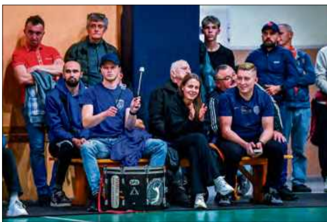
Doping kibiców i dźwięki bębna niosły drużynę gospodarzy.

Szóstka z Będzina od początku narzuciła swoje warunki gry, choć kilka akcji, zwłaszcza w obronie wzbudziło uznanie nie tylko w oczach kibiców. – Jestem pod wielkim wrażeniem przyjęcia drużyny gospodarzy. Był fragment meczu, w którym Walce były pod tym względem zdecydowanie lepsze od nas, a cyfry ich przyjęcia oscylowały w granicach 88 procent. To naprawdę