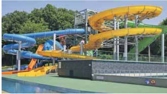
Wśród atrakcji cztery zjeżdżalnie