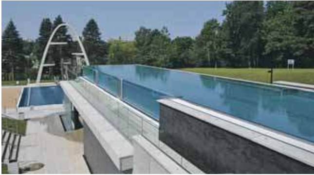
Fala została wybudowana od podstaw

W weekend po wieloletniej przerwie otwarto kąpielisko Fala w Parku Śląskim w Chorzowie. To kultowe miejsce, podobno nigdy tutaj nie było pusto. W ubiegłym tygodniu obiekt pokazano dziennikarzom, otwarcie Fali nastąpiło w sobotę, 14 czerwca.