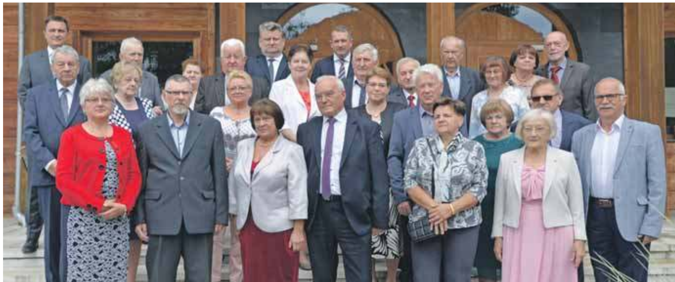
Jubilaci z gminy Tworóg

Pary z 50-letnim i 60-letnim małżeńskim stażem z gminy Tworóg świętowały w ubiegłą środę, 11 czerwca, w restauracji Barć Dębowa.