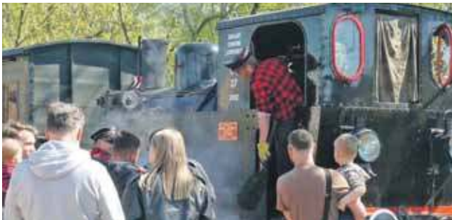
Nadchodzi lato, a wraz z nim letni rozkład jazdy kolei wąskotorowej