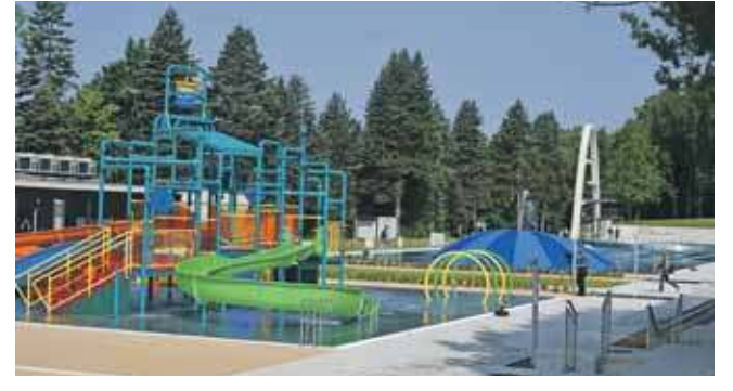
Jedną z atrakcji jest wodny plac zabaw