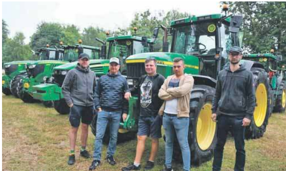
Uczestnicy ubiegłorocznego zlotu JD