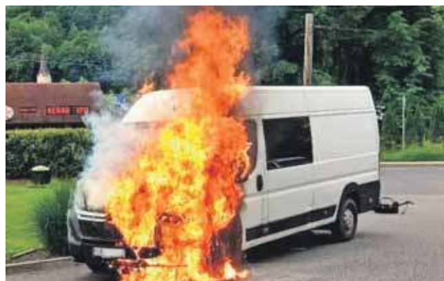
Bus doszczętnie spłonął