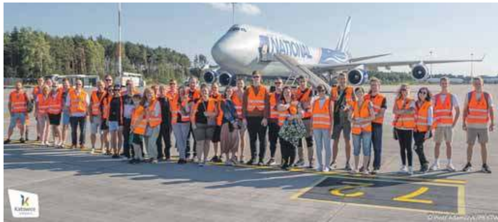
Katowice Airport zaprasza na wycieczkę po strefie zastrzeżonej lotniska

Spacery zaplanowano 29 czerwca, w godz. 10-17 (co godzinę), zbiórka na pl. Sy-