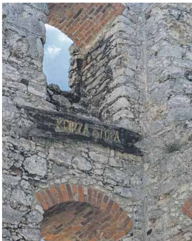
„Kurza stopa”, czyli dobudowana odnoga, która powiększyła pomieszczenia mieszkalne i zwiększyła walory obronne zamku

Imponująca, bogata historia i niezwykły klimat tego miejsca sprawiają, że zamek w Ogrodzieńcu fa-