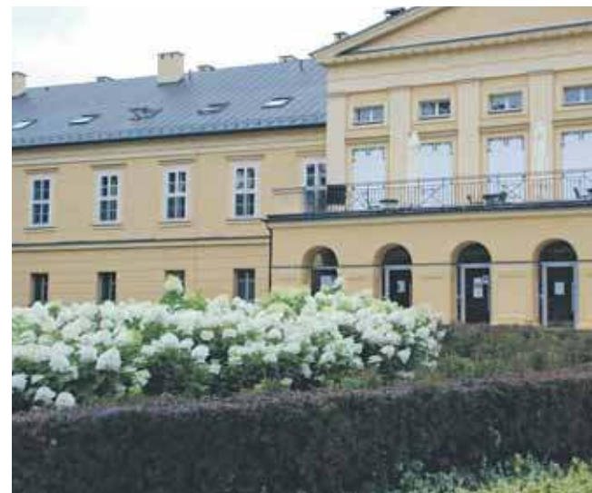
Jedną z atrakcji będzie możliwość zwiedzenia pałacu – siedziby zespołu i przymierzenie strojów scenicznych (konieczne są zapisy)

19.30 – „Masztalski” – występ kabaretowy