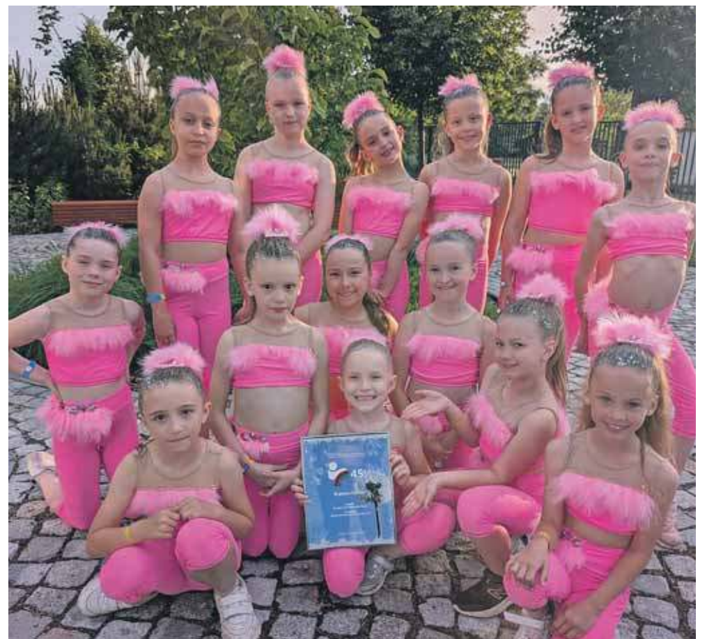
Młode tancerki z Akademii Tańca Dance a Lot w Tarnowskich Górach zdobyły Brązowy Aplauz dla formacji jazz