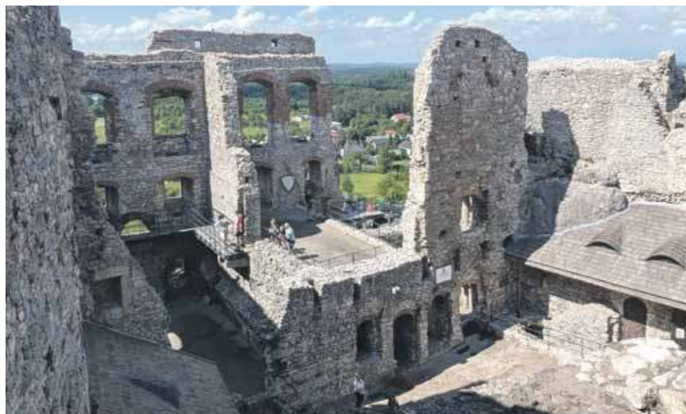
To była jedna z najwspanialszych rezydencji magnackich