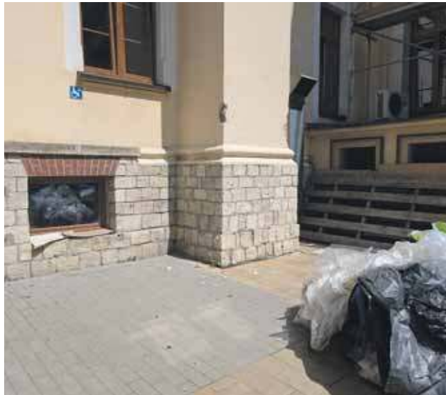
Miejsce dla niepełnosprawnych jest zastawione

– Dostęp do miejsc parkingowych powinien być absolutnym standardem, nawet podczas remontów. Moim zdaniem to tylko sprawa chęci i organizacji – dodaje. (EKA)