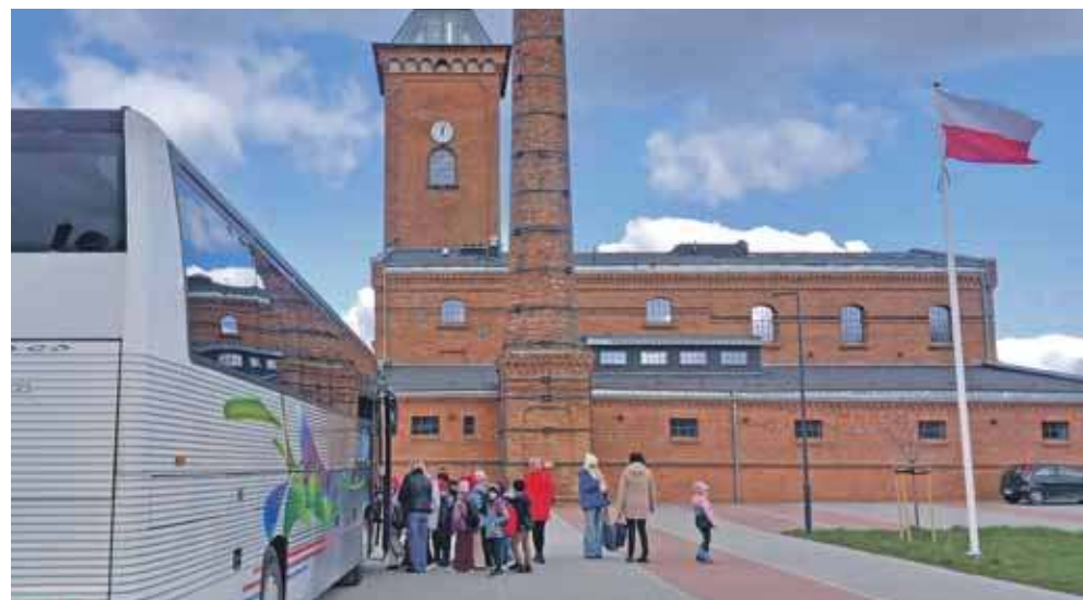
Prawdziwa przemiana Żółtego Folwarku nastąpiła w latach 2020–2024, kiedy to gmina Kochanowice, przy wsparciu funduszy unijnych, przeprowadziła gruntowną renowację dawnej gorzelni i ujeżdżalni

Po II wojnie światowej cały majątek przeszedł w ręce państwowe – funkcjonowało tu państwowe gospodarstwo rolne, a zabudowania gorzelni stopniowo popadały w ruinę,