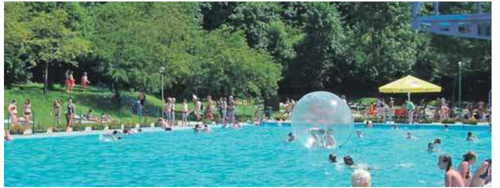
Kąpielisko na Księżej Górze zostanie otwarte w ostatnią sobotę czerwca