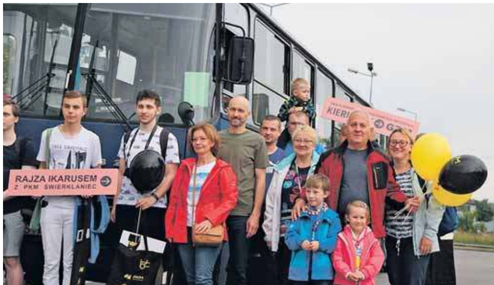
Na rajzie ikarusem byliśmy w poprzedniej edycji i polecamy

Wycieczki będą 28 czerwca o godz. 10, 12.30 i 15, start w Izbie Regionalnej miejskiej biblioteki. Rezerwacja nie jest wymagana.