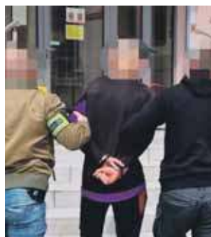
18-latek groził nożem. Odpowie za rozbój z użyciem niebezpiecznego narzędzia

nej celi, a w poniedziałek prokurator postawił mu zarzut dokonania rozbój z użyciem niebezpiecznego narzędzia – informuje rzecznik prasowy policji w Tarnowskich Górach, podkom. Kamil Kubica. – Sąd przychylił się do wniosku śledczych i zastosował wobec niego tymczasowy areszt. Zgodnie z przepisami prawa, grozić mu może teraz do 20 lat więzienia. (EKA)