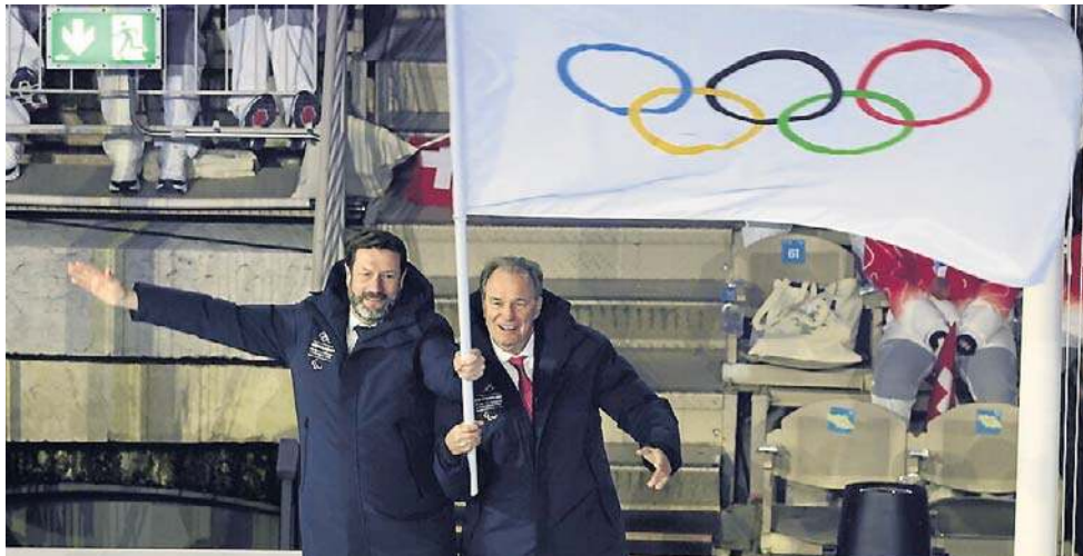
Flaga olimpijska opuściła maszt i została przekazana w ręce przedstawicieli Francji. To właśnie w tym kraju odbędzie się XXVI Zimowe Igrzyska Olimpijskie

W igrzyskach Mediolan-Cortina d'Ampezzo startowało łącznie 2871 zawodników z 92