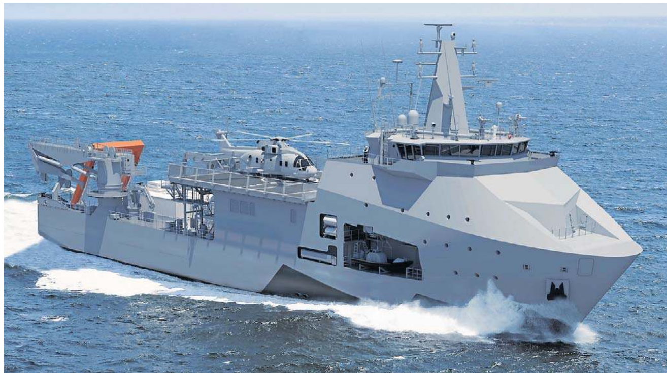
Wizualizacja okrętu Ratownik. Wielozadaniowa, specjalistyczna jednostka powstaje w Stoczni Wojennej

Było to trzecie podejście do programu. Umowę na Ratownika po raz pierwszy podpisano w roku 2017. Budowa miała kosztować 755 mln zł i trwać do 2022 r. MON zleciło to zadanie konsorcjum Polskiej Grupy Zbrojeniowej z należąca do niej Stocznia Wojenna, Stocznia Remontowa „Nauta” oraz Ośrodkiem Badawczo-Rozwojowym Centrum Techniki Morskiej. W lutym 2020 roku gotowy był ostateczny projekt tego okrętu (autorstwa biura spółki MMC Ship Design & Marine Consulting), który został zatwierdzony przez resort. Jednak już dwa miesiące później MON kontrakt anulowało tłumacząc się koniecznością analizy „bieżących i przyszłych potrzeb” Sił Zbrojnych RP. Co ciekawe, pod koniec maja 2020 r. ówczesny szef MON Mariusz Błaszczak informował, że po konsultacjach z prezydentem, zamówienie na okręt ratowniczy zostanie wznowione.