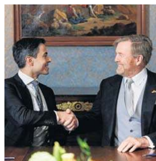
Król Wilhelm-Aleksander zaprzysiężył w pałacu Huis ten Bosch w Hadze mniejszościowy rząd Roba Jettena

Rob Jetten obejmuje urząd w wieku 38 lat. Jest najmłodszym premierem w historii Holandii i pierwszym otwarcie homoseksualnym szefem rządu. PAP