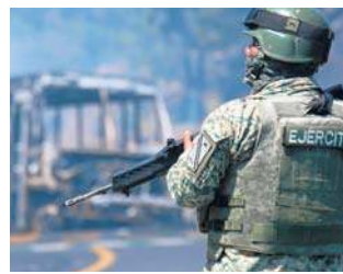
Meksyk w stanie wrzenia po zabiciu przywódcy Kartelu Nowej Generacji Jalisco, znanego jako „El Mencho”

Siły bezpieczeństwa schwytały Oseguerę w Tapalpie, mieście liczącym 20 000 mieszkań-