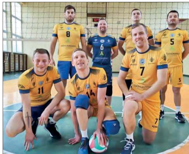
Powiślak Końskowola wygrał bardzo ważny mecz z AWP Developmentem i został nowym liderem ALS w Rykach