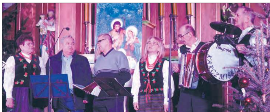
✚ Niespodziankę publiczności zrobili sołtysi z sołectw parafii Leopoldów. Postawili na tradycyjne polskie kolędy „Pójdźmy wszyscy do stajenki” oraz „Przybieżeli do Betlejem”