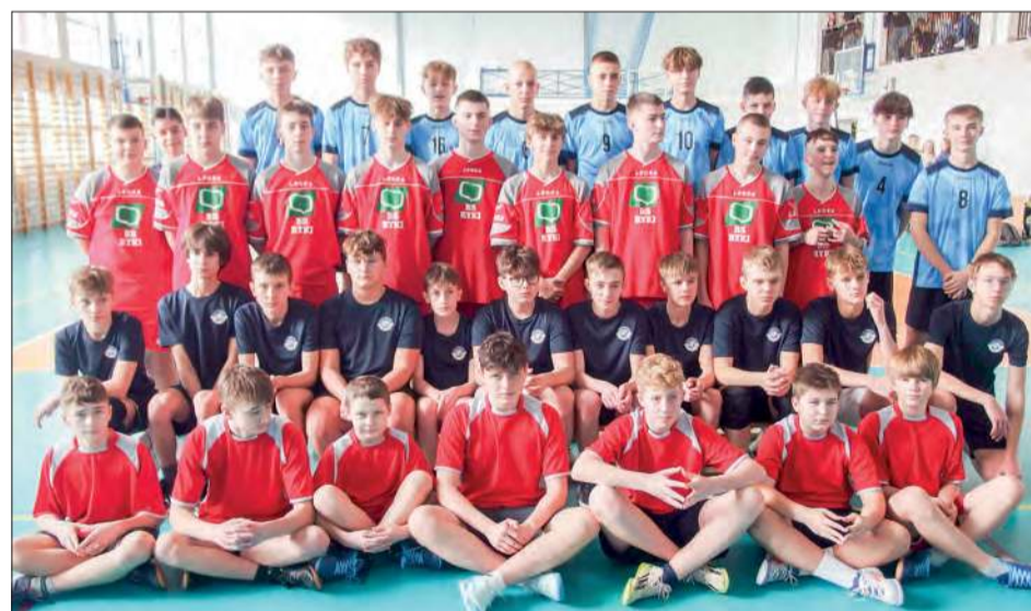
Uczniowie z dwóch ryckich szkół nr 1 i 2 oraz z Czernica i Stężyczy walczyli o szkolne mistrzostwo siatkarzy z klas 7-8

Chłopcy ze Szkoły Podstawowej nr 1 w Rykach wygrały zawody powiatowe siatkarzy z klas 7-8