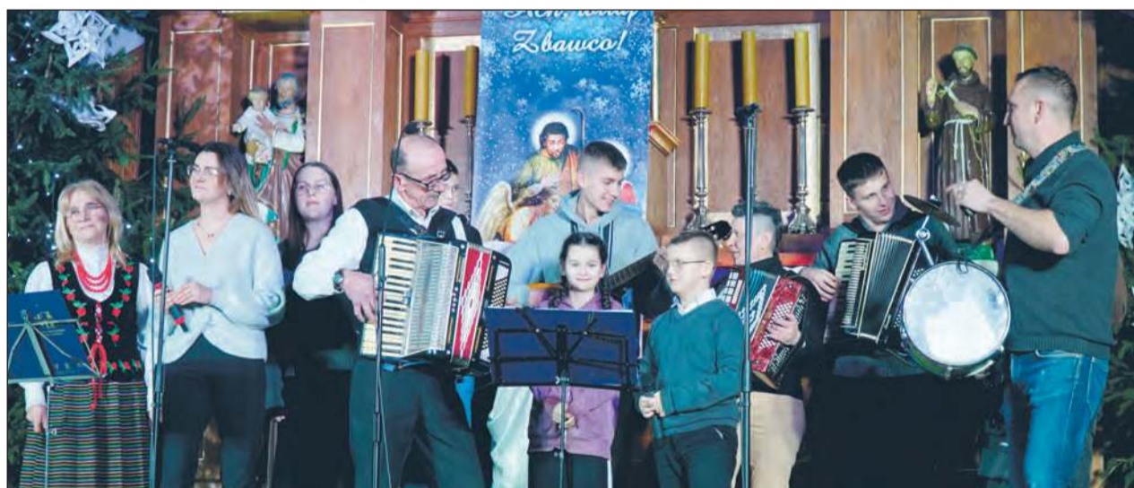
✚ Swoją cegiełkę do koncertu jak co roku dorzucił też rodzinny zespół „PiK” i Przyjaciele, czyli Parzyszki i Kamińscy. Trzy-pokoleniowa rodzina wykonała pastorałki „Biją dzwony” oraz „Gloria Glorija”, a jako bonus, za zgodą księdza proboszcza, piosenkę nie związaną z Bożym Narodzeniem, ale też o miłości