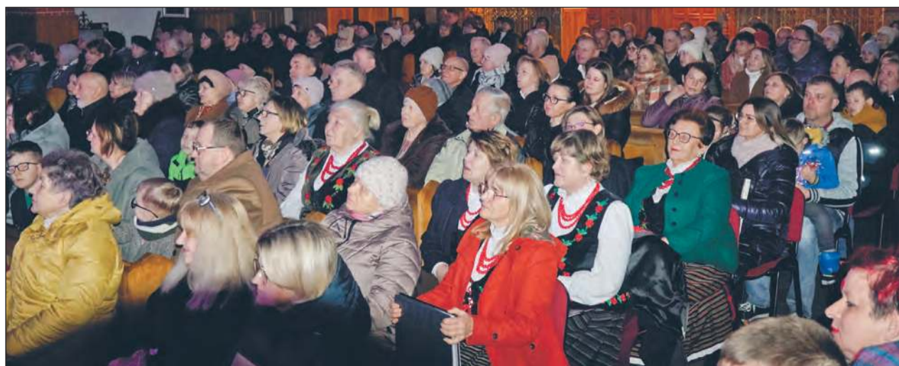
✚ Kościelne ławki wypełniły się do ostatniego miejsca. Zgromadzeni nie tylko oklaskiwali kolejne występy, ale też chętnie włączali się do wspólnego śpiewania. 4fc