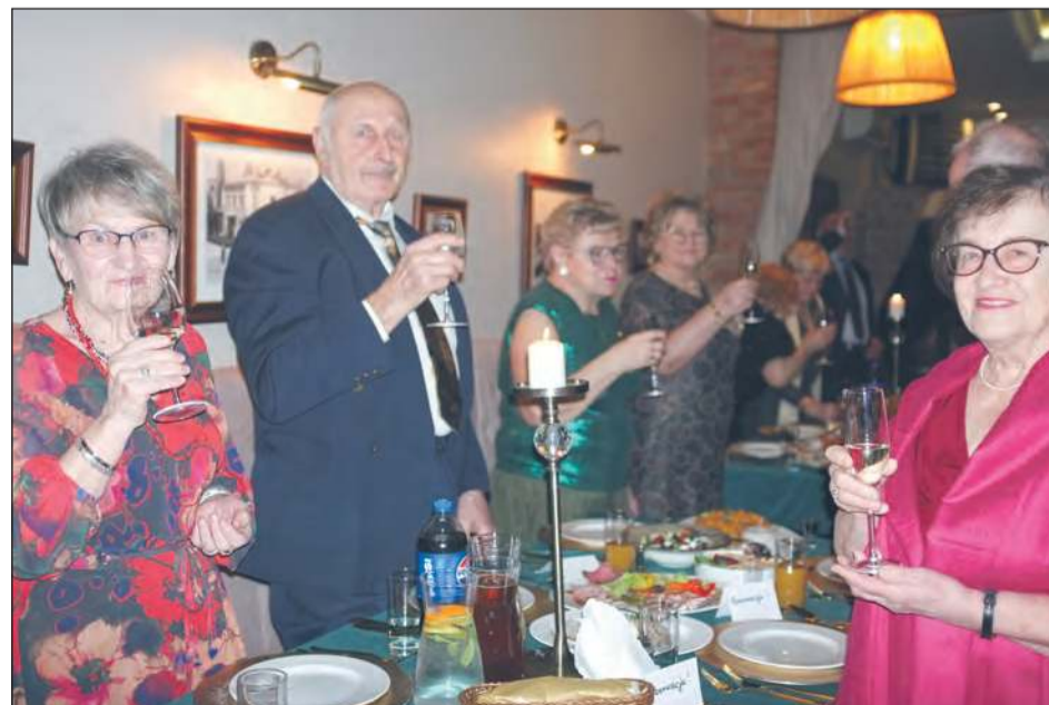
☛ Spotkanie zainaugurował toast lampką szampana. Seniorzy życzyli sobie zdrowia i pomysłowości w rozpoczętym roku oraz podobnych okazji do zabawy