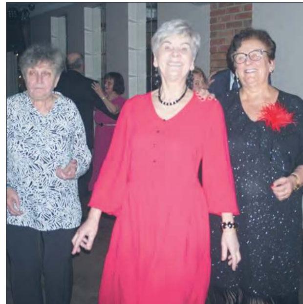
☛ Kto chciał, mógł tańczyć solo, liczyła się przede wszystkim dobra zabawa i radość

» Biesiada przy stołach i tańce na parkiecie trwały do późnych godzin nocnych. Uczestnicy oraz sympatycy Uniwersytetu Trzeciego Wieku w Rykach bawili się na dorocznym balu karnawałowym