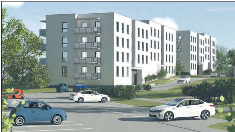
Investycja zlokalizowana będzie w południowej części Ryk przy ulicy Granicznej

Investycja zostanie zrealizowana przez Społeczną Inicjatywę Mieszkaniową (SIM) Lubelskie. Przedsięwzięcie wspiera gmina Ryki, która przekazała swoją działkę. Bloki powstaną przy ulicach Kochanowskiego i Granicznej. W pobliżu znajdują się m.in. szkoła, przedszkole i sklepy. Jeszcze w tym roku ma rozpocząć się budowa nowej