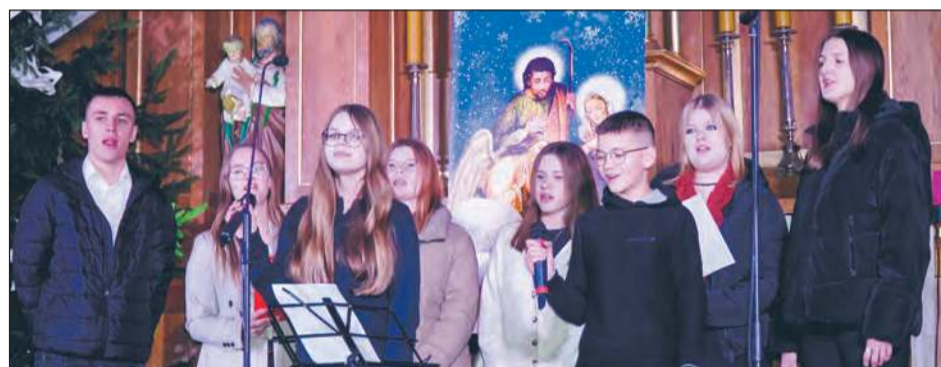
✚ Kilka miesięcy temu w parafii reaktywowało się KSM. Aktywna młodzież skorzystała z okazji, by zaprezentować się publiczności podczas „Wieczoru Kolęd i Pastorałek”, śpiewając skoczną piosenkę „Skrzypi wóz”