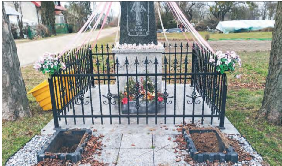
Mieszkańcy Zielonki są zirytowani aktem wandalizmu przy ich kapliczce

Kilka lat temu mieszkańcy Zielonki odnowili przydrożny krzyż. Z biegiem czasu znów wymagał on renowacji, dla-