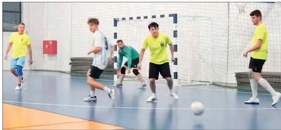
W ryckiej „halówce” do zakończenia fazy zasadniczej pozostała już tylko jedna kolejka