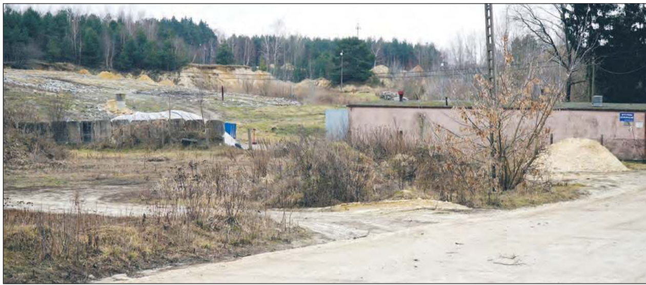
Wysypisko przy ulicy Janiszewskiej funkcjonuje od ponad 50 lat. Firma z Luksemburga jest zainteresowana, aby w tym miejscu powstał nowoczesny zakład gospodarki odpadami

» Burmistrz Ryk nie wyklucza referendum w sprawie planowanej inwestycji przy ulicy Janiszewskiej. Tymczasem przedstawiciele sołectwa Stare Miasto przygotowali petycję, w której nie zgadzają się na sortownię w tym miejscu