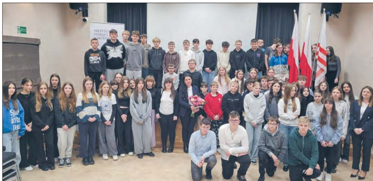
✚ W sali widowiskowej Gminnego Ośrodka Kultury w Kłoczewie odbyła się prelekcja pt. „Tragedia ofiar przestrogą przed nieludzkim systemem totalitarnych dyktatur”

Okazją do podjęcia tego trudnego tematu były VII