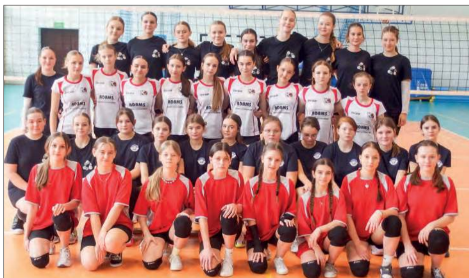
W zawodach powiatowych siatkarek z klas 7-8 szkół podstawowych zagrały cztery drużyny

Dziewczęta ze Szkoły Podstawowej nr 1 w Rykach wygrały zawody powiatowe w siatkówce klas 7-8