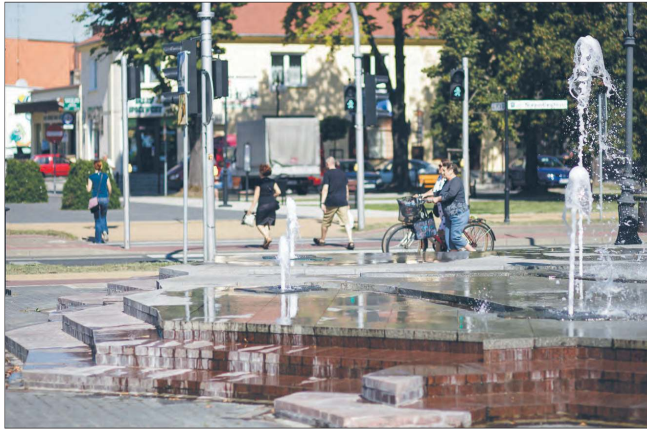
➤ Liczba zameldowanych mieszkańców spadła już poniżej 14 tysięcy. Jeszcze na koniec 2020 roku w Dęblinie zameldowanych było 15.748 osób