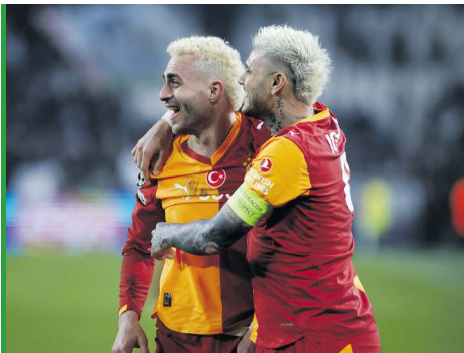
Galatasaray walczy na trzech frontach, jest w grze o mistrzostwo, puchar kraju, a także w Champions League.