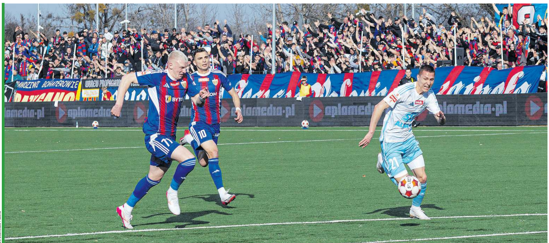
Fot. Stanisław Mucha