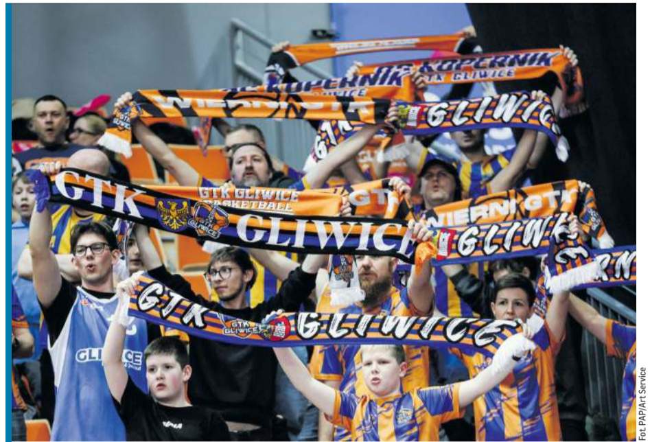
Kibice GTK tym razem nie mieli powodów do zadowolenia.