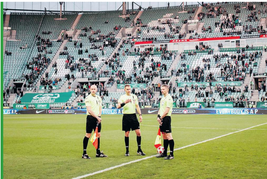
Trójka sędziowska odczekała 15 minut i odgwizdała koniec meczu we Wrocławiu.

Z takim rozstrzygnięciem sprawy kompletnie nie zgadza się Królewski i już zapowiada, że jeśli piłkarskie władze ukarzą jego zespół, ten sięgnie po jeszcze mocniejsze karty. - Nie dopuszczamy do siebie myśli, że przegramy