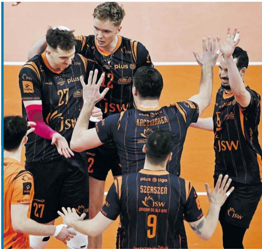
Jastrzębianie w Gdańsku zrobili duży krok w kierunku play offu.

Do zakończenia fazy zasadniczej pozostały już tylko kolejka i spotkania zaległe. O trzy miejsca w play offie walczą: JSW Jastrzębski Węgiel, PGE GiEK Skra Bełchatów, Energa Trefl Gdańsk i ZAKSA Kędzierzyn-Koźle. Jastrzębianie w ostatniej kolejce odnieśli bardzo ważny