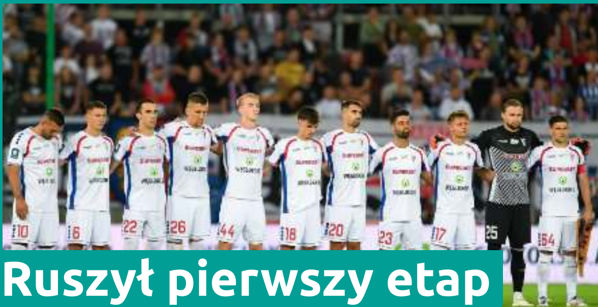
Fot. Górnik Zabrze (2)