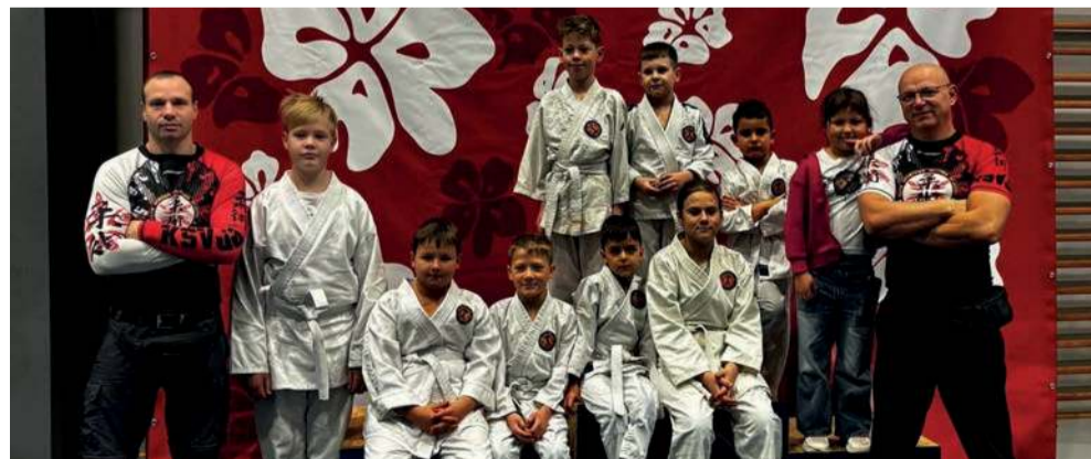
Victoria Ju-Jitsu Chrzanów.