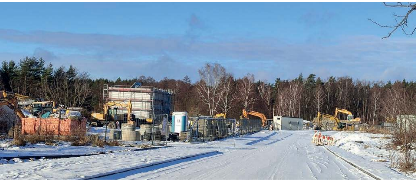
Pavimental buduje swoją siedzibę w chrzanowskim Kroczymiechu

Bliżej wiaduktu nad linią kolejową Chranów - Oświęcim jest też Ocynkownia Śląsk, otwarta w 2000 r. Ponadto Betoniarńia Kroczymiech, istnieje-