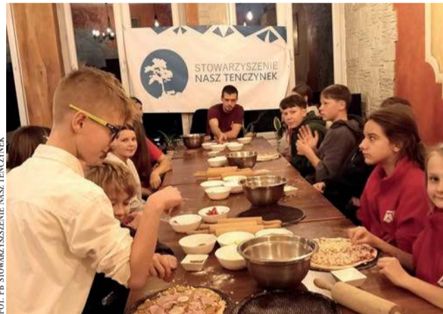
Młodzież z Tenczynka podczas warsztatów pizzy

Dzieci i młodzież z tenczyńskiej Młodzieżowej Drużyny Pożarnej wzięli udział w warsztatach robienia pizzy. Zorganizowano je w restauracji Zamkowa w Tenczynku.