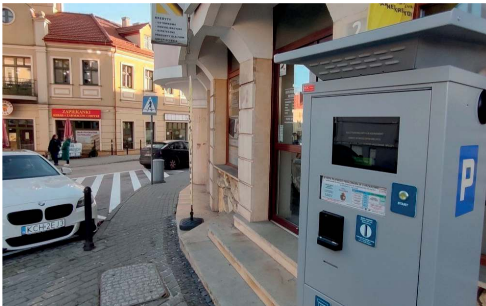
Parkomat przy Rynku w Chrzanowie

Najpierw łupem padły pieniądze z parkomatów przy ul. Sokoła i Kościuszki. Potem przy ul. Mickiewicza i Ogrodowej w Chrzanowie.