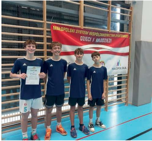
SP w Filipowicach, Igrzyska Młodzieży Szkolnej - 2. miejsce