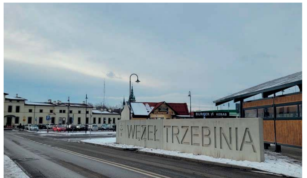
12 stycznia to miejsce zacznie żyć