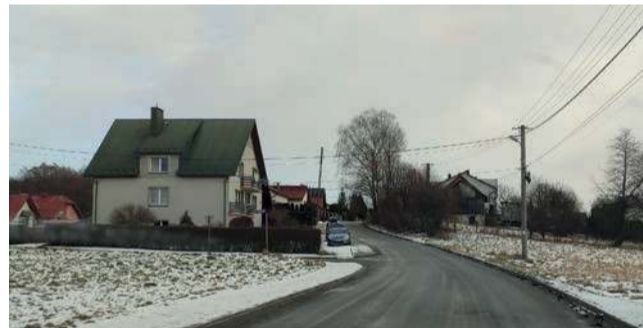
Ul. Kasztanowa w Alwerni

W tym roku ma się zakończyć modernizacja ul. Kasztanowej. Już teraz zdecydowana większość prac jest gotowa.