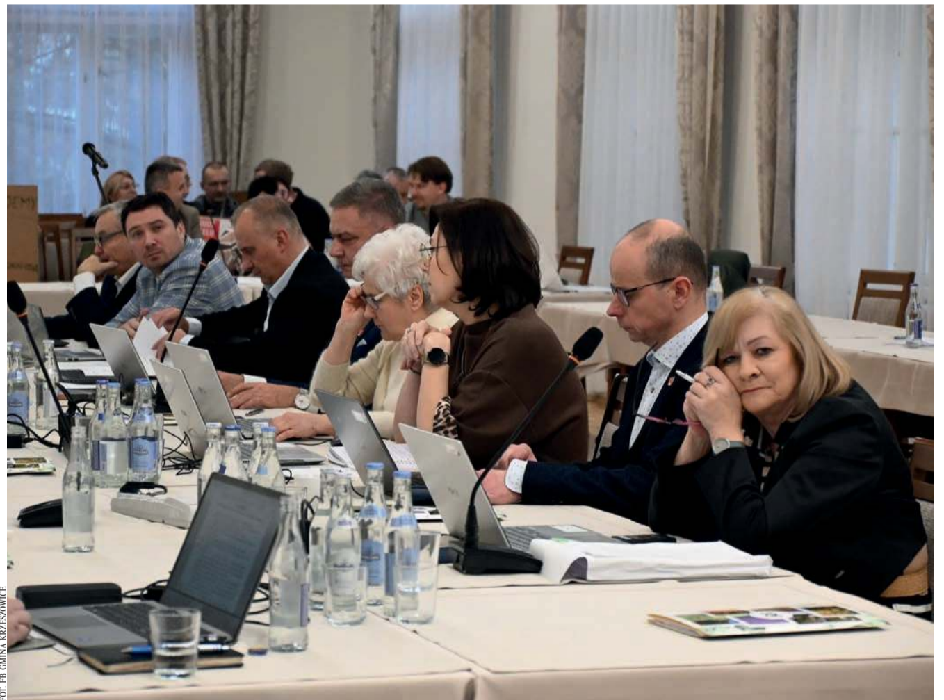
Radni z Krzeszowic jednomyślnie przyjęli uchwałę budżetową

• Gospodarka komunalna i ochrona środowiska - 26,3 mln zł