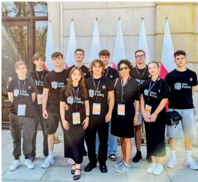
ZST-U w Trzebini, laureaci ogólnopolskiego konkursu edukacyjnego „Silni Polską!”