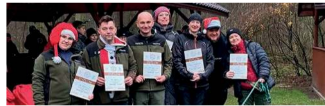
Arrow Trzebini.

Centralna Liga 3D to cykl prestiżowych zawodów łucznich rozgrywanych w terenie, gdzie zawodnicy strzelają do trójwymiarowych figur