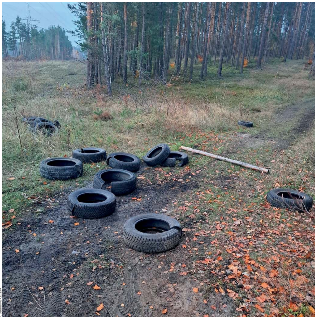
Do lokalnych lasów bardzo często podrzucane są opony

Zgłoszenia o odpadach znajdujących się w niedo-