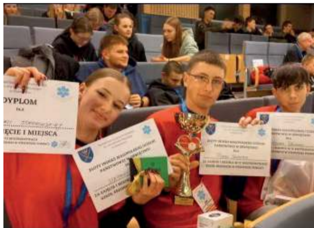
ZS w Libiążu, 1. miejsce drużynowo w IV Mistrzostwach Szkół Średnich w Pierwszej Pomocy