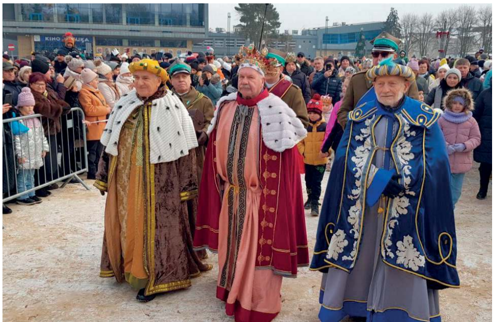
Trzej Królowie na Placu Tysiąclecia w Chrzanowie