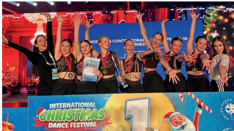
Reprezentacja Kremer Dance Studio Libiąż.

Tancerki z Kremer Dance Studio Libiąż odniosły sukces podczas międzynarodowego turnieju International Christmas Dance, który odbył się w Mikołajkach.