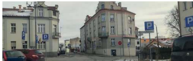
Przez wiele lat na ul. Sądowej w Chrzanowie funkcjonowało przejście dla pieszych

Uważa, że likwidacja znaku pionowego oznaczającego przejście dla pieszych oraz po-