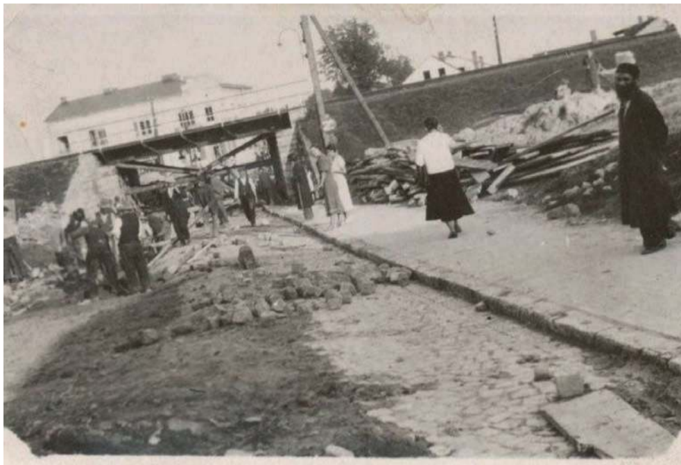
Prace wodociągowe w latach 30. XX w. na Krakowskiej w Chrzanowie.

31 sierpnia 1933 r. oficjalnie w dokumentach rady miejskiej użyto sformułowania „Przedsiębiorstwo Wodociągowe w mieście Chrzanów”. Za cmentarzem parafialnym powstał ogromny zbiornik, istniejący do dzisiaj, gromadzący wodę, następnie spływającą do miasta. Halę pomp wybudowano w rejonie ul. Zielonej. Pompy zamówiono w Stoczni Gdańskiej.