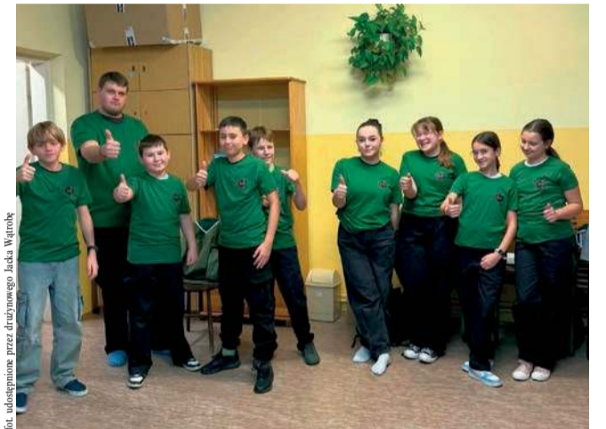
Harcerze z Babiec podczas zbiórki

7. Babicka Drużyna Harcerska „Silva” zaprasza do wstąpienia w swoje szeregi.