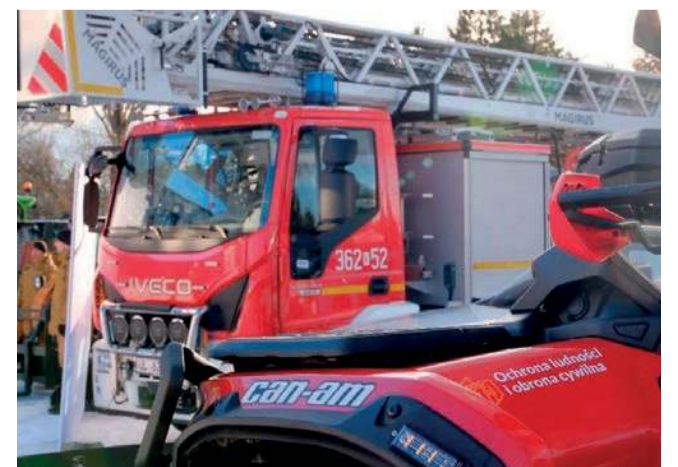
W całym województwie do jednostek straży zakupiono ponad 40 pojazdów

Uwzględniono także zakup takiego sprzętu jak np. stacje uzdatniania wody, miniaturowe osuszacze powietrza, piły do betonu i stali, ratownicze zestawy hydrauliczne, łodzie ratownicze, urządzenia pomiarowe, zapory przeciwpowodziowe, fantomy i systemy kompresji klatki piersiowej, umundurowanie osobiste i specjalne itp.