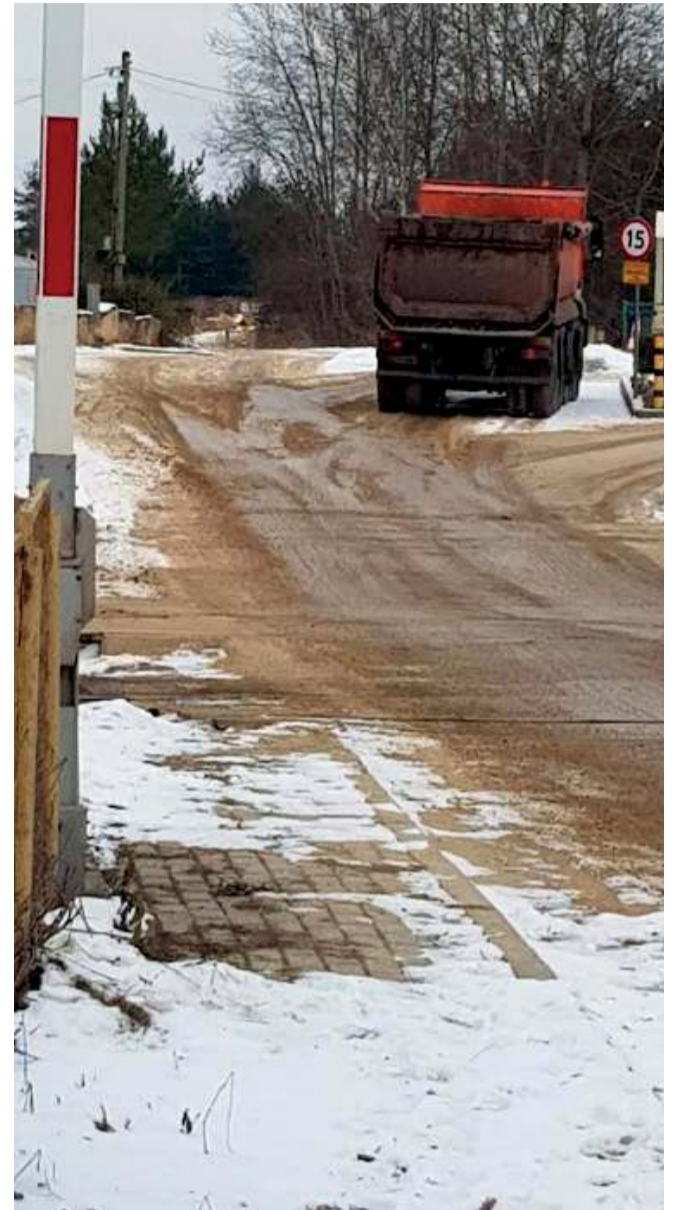
Do libiąskiego zakładu przyjeżdża wiele ciężarówek