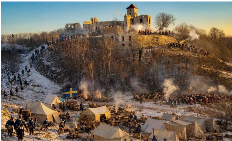
Oblężenie zamku Tenczyn w Rudnie

Nowy rok witamy ciekawym zdjęciem zamku Tenczyn w Rudnie, opublikowanym przez Piotra Łasia z naszej facebookowej grupy PRZEŁOMowe Kadry.