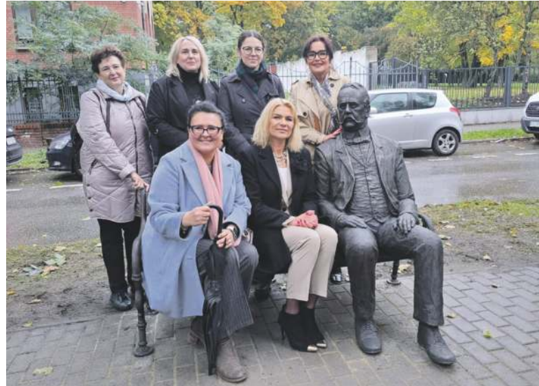
Jak widać, nadburmistrz ma powodzenie wśród pań

Renesans pamięci o Brüningu nastąpił w roku 2004, kiedy obchodzono jubileusz 750-lecia lokacji Bytomia. Wówczas redakcja „Życia Bytomskiego” powołała kapitułę dla wyboru Panteonu Bytomskiego, czyli