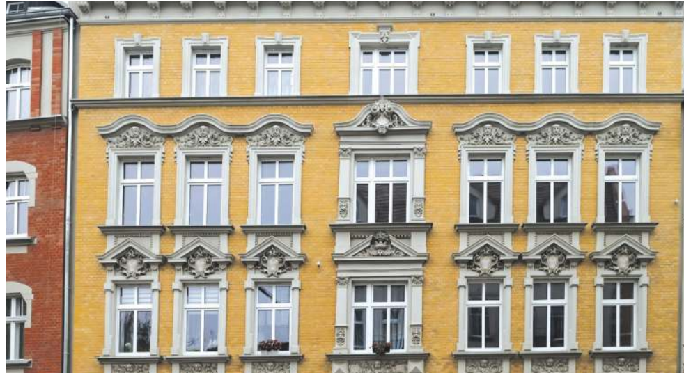
W bazie można znaleźć wiele bytomskich lokali mieszkalnych

Bytomskie Mieszkania stworzyły i prowadzą bazę danych służącą do ewidencjonowania zgłoszonych ofert oraz zawierającą kontaktowe potencjalnych kontrahentów, parametry zajmowanych przez nich lokali, a także oczekiwania dotyczące zamiany. Część bazy danych (anonimowo) została upubliczniona poprzez specjalnie stworzoną w tym celu stronę internetową, która w formie wyszukiwarki udostępnia mieszkańcom informacje dotyczące parametrów lokali