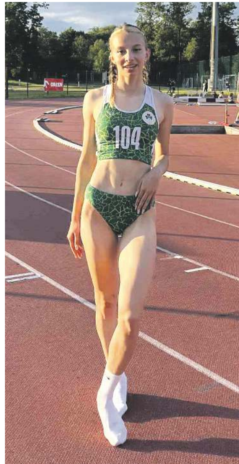
... i na bieżni

dach pod skrzydłami AKS Chorzów. Ze sportowymi sukcesami. Była między innymi akademicką mistrzynią Śląska na 100 i 200 metrów, z powodzeniem brała także udział w mistrzostwach Polski.