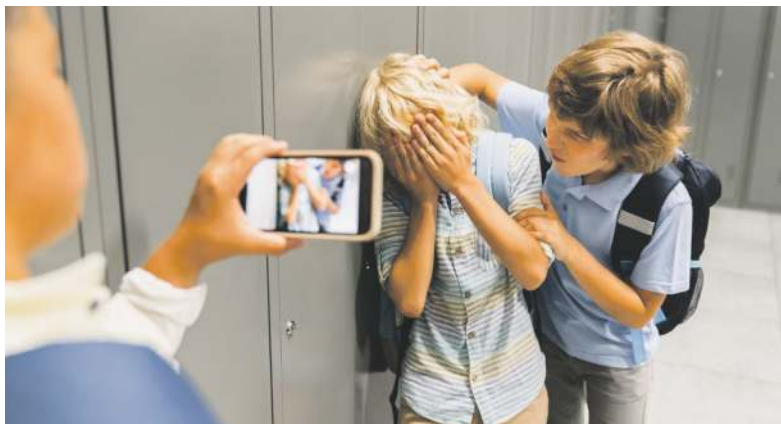
Każda forma przemocy jest groźna. Nie tylko ta fizyczna

Konsekwencje takiej sytuacji bywają dramatyczne. Z badań wynika, że 22 proc. młodych osób sięga po samookaleczenie, a 9 proc. próbowało odebrać sobie życie. Szczególnie alarmujące jest to, że ryzyko samookaleczeń u ofiar przemocy rówieśniczej jest czterokrotnie wyższe niż w przypadku młodych, którzy jej nie doświadczają. Skąd się bierze przemoc wśród najmłodszych i nastolatków?