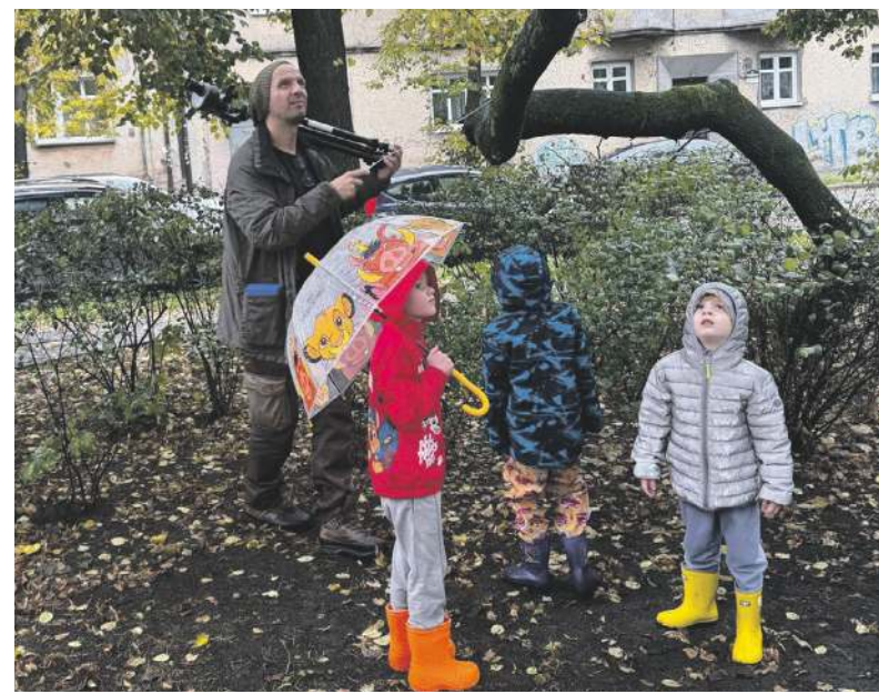
Dzieci wybrały się na eskapadę wokół BeCeKu