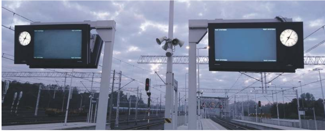
Na nowych wyświetlaczach będą się pojawiać informacje o przyjeżdżających do nas i odjeżdżających stąd pociągach

ŚRÓDMIEŚCIE. NARESZCIE MAMY DWORZEC KOLEJOWY, KTÓREGO NIE TRZEBA SIĘ WSTYDZIĆ. JEST ZMODERNIZOWANY, WYPOSAŻONY W NOWOCZESNĄ INFRASTRUKTURĘ, A DO TEGO DO DYSPOZYCJI PODRÓŻNYCH SĄ ELEKTRONICZNE WYŚWIETLACZE I TABLICE PEŁNE CIEKAWOSTEK Z HISTORII NASZEGO MIASTA.