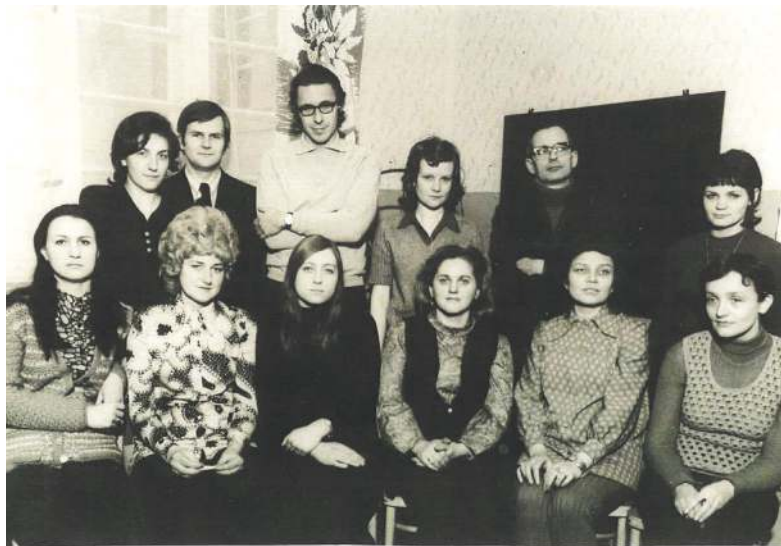
GRONO PEDAGOGICZNE III LICEUM OGÓLNOKSZTAŁCĄCEGO W BYTOMIU - LISTOPAD 1973

Skąd nazwa Cambridge? Miała ona wydźwięk ironiczny, albowiem liceum w Bobrku uważano za gorsze pod względem poziomu od renomowanych ogólniaków w centrum: „Smolenia”, „Sikoraka” i „Żeroma”.