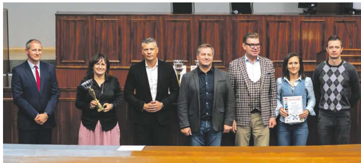
Ceremonię zorganizowano w Urzędzie Miejskim

Przedstawiciele bytomskich szkół, sportowcy, uczniowie oraz reprezentanci władz naszego miasta podsumowali sportowy rok szkolny 2024/2025. Stało się to podczas niedawnej uroczystości zorganizowanej w sali sesyjnej Ratusza.