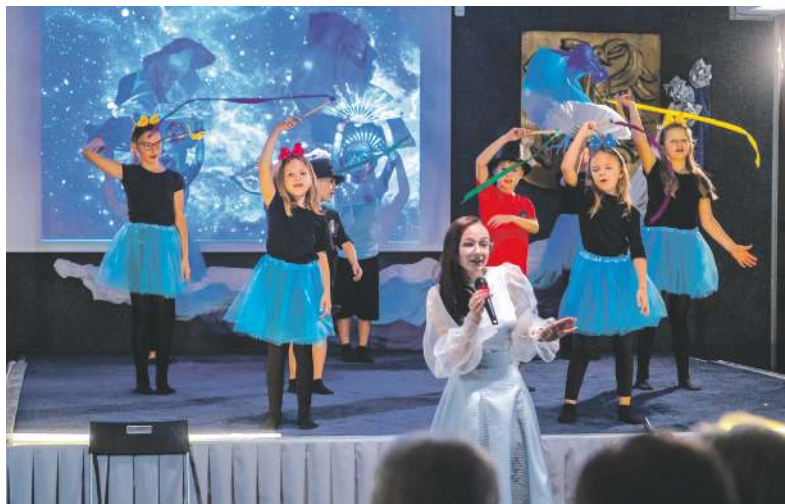
Jubileusz okraszono występami artystycznymi

Kolejne zmiany organizacyjne następowały jedna po drugiej. W roku 1999 powstało Gimnazjum nr 10 wchodzące w skład Zespołu Szkół Ogólnokształcących nr 11. Włączono do niego Szkołę Podstawową nr 32 im. gen. Jerzego Ziętkę i Gimnazjum nr 10, do których łącznie uczęszczało blisko 1700 uczniów. To nie koniec,