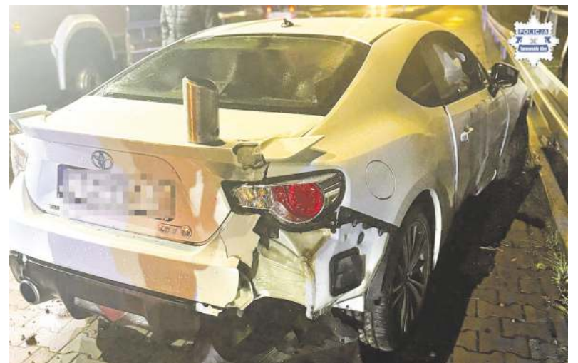
Auto zostało poważnie uszkodzone

30-letni mężczyzna jechał toyotą z dość dużą prędkością. Tymczasem warunki do jazdy były kiepskie: późna pora dnia, szaruga, padający deszcz znacznie ograniczający widoczność i do tego mokra, śliska nawierzchnia. Kierowca nie dostosował się do tych trudnych okoliczności i w pewnym momencie stracił panowanie nad autem po czym zjechał na pobocze ulicy Unii Europejskiej. Rozpędzony samochód staranował znaki drogowe i uległ poważnemu uszkodzeniu.