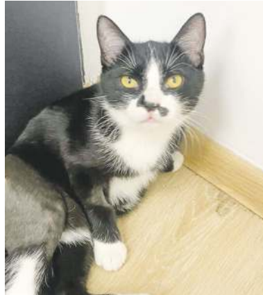
mają zapewnioną szeroką pomoc

Kosztuje to wiele, zarówno pod względem finansowym, jak i emocjonalnym, ale wolontariusze z Chatulą są przekonani, że warto: - Wszystkich nas łączy wiara w to, że uda się poprawić życie zwierząt. Nie jesteśmy marzycie-