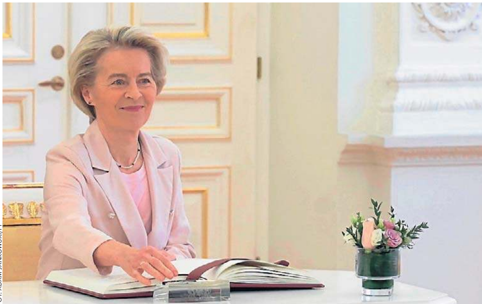
W liście do przywódców UE von der Leyen wskazała pięć kluczowych obszarów działań, przed którymi stanie Unia Europejska

Pierwszym z nich jest deregulacja i uproszczenie prawa unijnego. KE zapowiedziała dalsze pakiety „Omnibus” (uprosz-