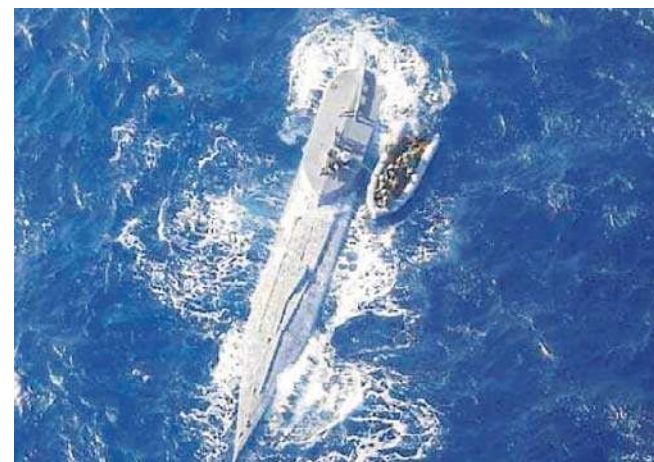
Zdjęcie z przejęcia łodzi podwodnej pełnej kokainy wartej 441 milionów dolarów