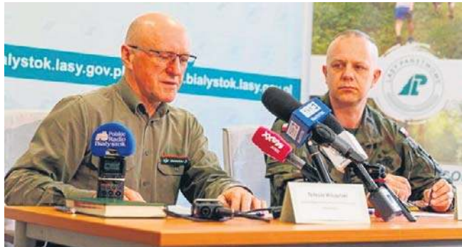
Porozumienie zawarły RDLP oraz WCR w Białymstoku

- Możemy bezpiecznie udostępnić las, możemy współpracować w zakresie logistyki i przekazać nasze umiejętności żołnierzom i tym, którzy się szkolą. Przekazać nasze metody edukacji, które będziemy w stanie wymieniać z Wojskowym Centrum Rekrutacji - mówi dyrektor RDLP dodając, że do zadań lasów zaliczane są te z zakresu obronności.