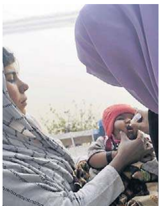
Kampania szczepień w Pakistanie

- Najczęściej ekipa medyczna nie zastała dziecka w domu. W innych przypadkach pracownikom nie udało się dotrzeć na miejsce z powodu problemów z bezpieczeństwem lub trudnych warunków atmosferycznych - powiedział dzien-