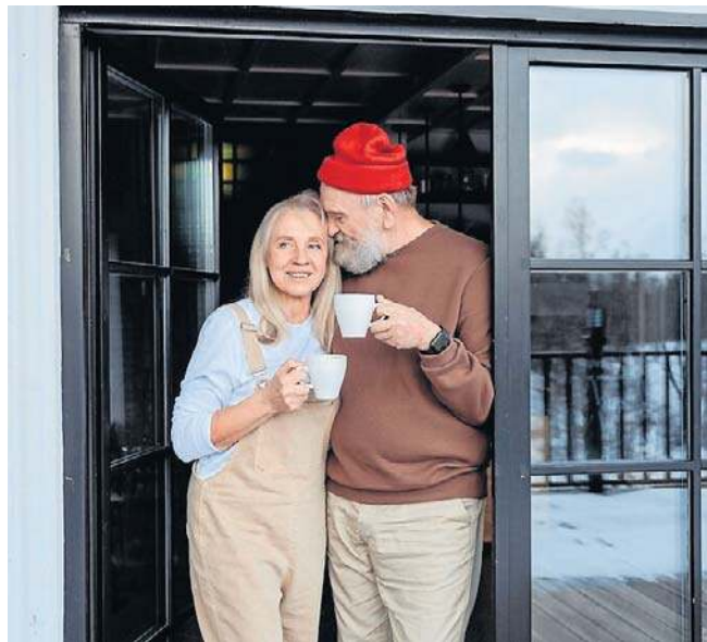
Bliskość drugiej osoby wpływa zarówno na nasze samopoczucie psychiczne, jak i na stan zdrowia