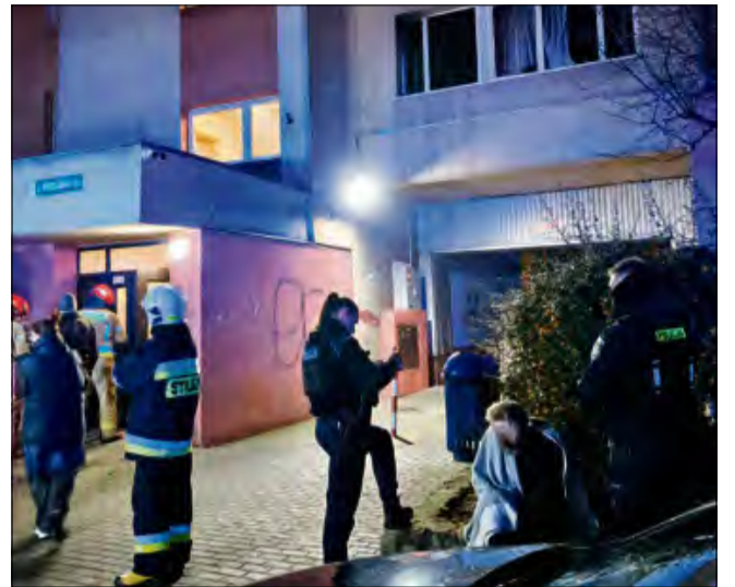
W akcji gaśniczej brały udział 4 zastępy straży pożarnej z JRG 2 Opole, OSP Opole-Szczepanowice, a także policja oraz zespół ratownictwa medycznego.

O gień w mieszkaniu przy ul. Wrocławskiej w Opolu został zauważony 2 grudnia około godziny 17.52. Z budynku wielorodzinnego ewakuowano mieszkańców bloku. W objętym pożarem pomieszczeniu znajdowały się dwie osoby, którym udzielono pomocy medycznej.