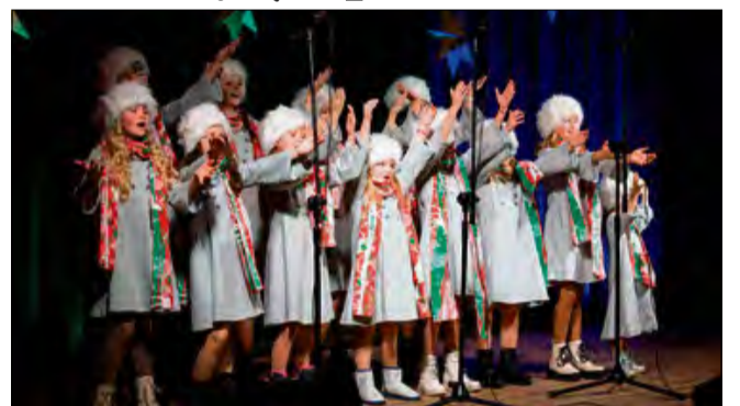
Po raz pierwszy festiwal zorganizowano w 2009 roku.

S amorządowy Ośrodek Kultury w Komprachcicach po raz kolejny stanie się stolicą świątecznych piosenek i pastorałek. A wszystko za sprawą XVII Ogólnopolskiego Festiwalu Kolęd i Pastorałek „Hej! Kolęda, Kolęda...”. Wydarzenie o charakterze konkursu odbędzie się 10 stycznia 2026 roku, a zgłoszenia będą przyjmowane do 5 stycznia 2026 roku.