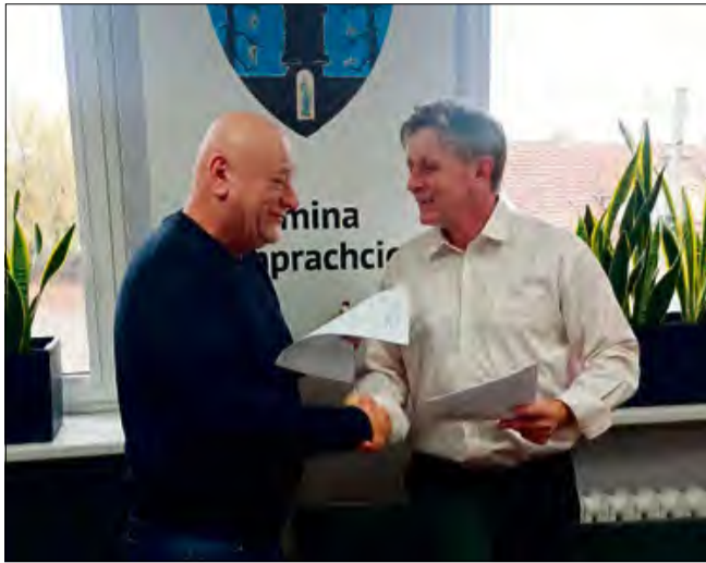
Modernizacja podłogi będzie kosztować 700 tys. zł.

Montaż finansowy projektu wygląda w ten sposób, że 30 proc. wartości inwestycji przekaże marszałek woje-