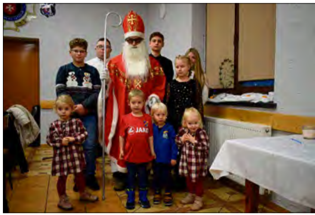
Adwentowe spotkanie zorganizowało DFK Szczedrzyk - Pustków.

W przyszłości każda z gmin w Polsce będzie funkcjonować w oparciu o plan ogólny. Stanie się obowiązkowym aktem prawa miejscowego. W praktyce zastąpi studium uwarunkowań i kierunków zago-