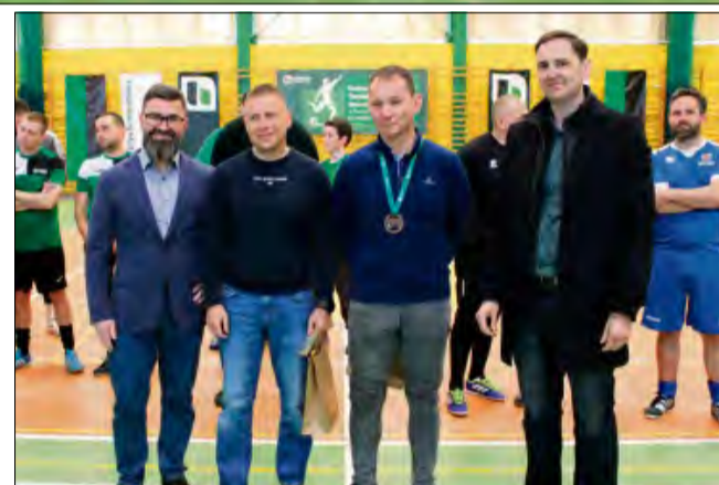
Organizatorzy nagrodzili „najbogatszych stażem” uczestników turnieju.

GOGOLIN, 22-23 LISTOPADA 2025 r. KLASYFIKACJA KOŃCOWA 1. BETARD 2. ROTEX CS 3. BETON JUNAJTED 4. ALL STAR TEAM 5. WARSZTAT UR 6. EKOCEM 7. F.G. KOPALNIAKI GRUPA JD EJBRY POZNAŃ