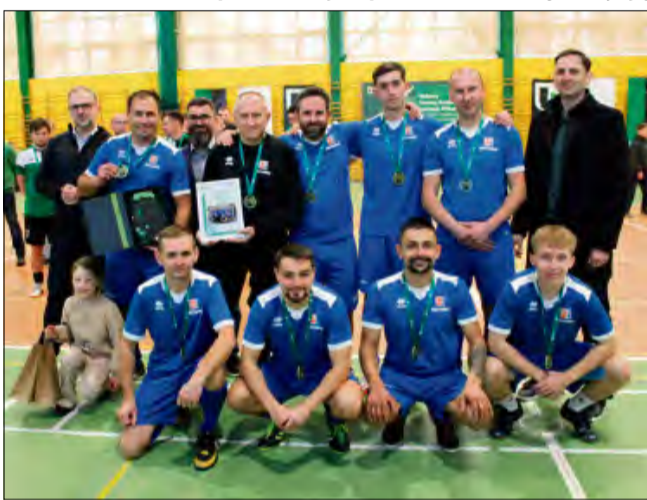
Betard - mistrz Anno Domini 2025.