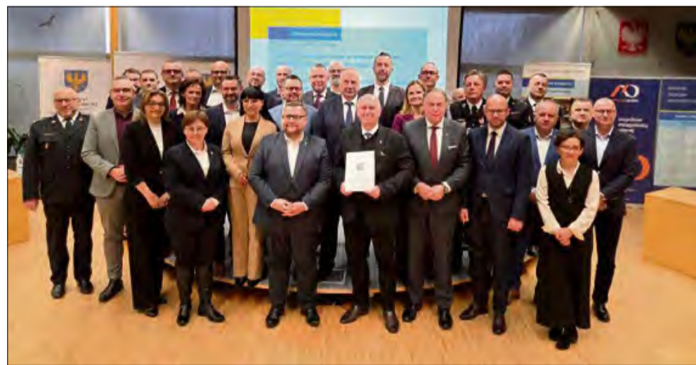
Samorządowcy z Aglomeracji Opolskiej, do której należy też powiat opolski, odebrali umowy na dofinansowanie z Funduszy Europejskich dla Opolskiego 2021–2027.

P owiatowe Centrum Zarządzania Kryzysowego w powiecie opolskim otrzyma nowoczesny sprzęt ratunkowy o wartości 136 tysięcy zł. Projekt zostanie sfinansowany niemal w całości z Funduszy Europejskich – dofinansowanie wynosi 129 tysięcy zł, co stanowi 95 proc. całkowitej wartości. Powiat dołoży jedynie około 7 tysięcy zł.