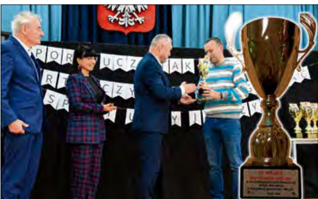
Przyznanie nagrody Publicznej Szkole Podstawowej w Tarnowie Opolskim.