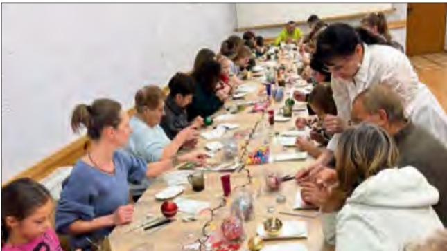
W Szczedrzyku zorganizowano warsztaty malowania bombek.