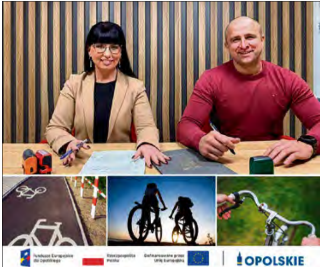
Nowa ścieżka pieszo-rowerowa powinna powstać w ciągu siedemnastu miesięcy.

Przedstawiciele gminy Dąbrowa podkreślają, że wybór tego odcinka był podyktowany przede wszystkim kwestiami bezpieczeństwa. Przy drodze wojewódzkiej, dotychczas nie istniała żadna infrastruktura pieszo-rowerowa, co od lat było sygnalizowane zarówno