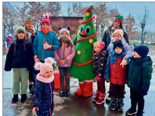
Kiermasz świąteczny w Żlincach już na stałe wpisał się w kalendarz wiejskich imprez.

świąteczne warsztaty, a atmosferę wydarzenia dopełniały ogniska, przy których można było się ogrzać. Organizatorzy stworzyli też świąteczną ściankę do robienia zdjęć.