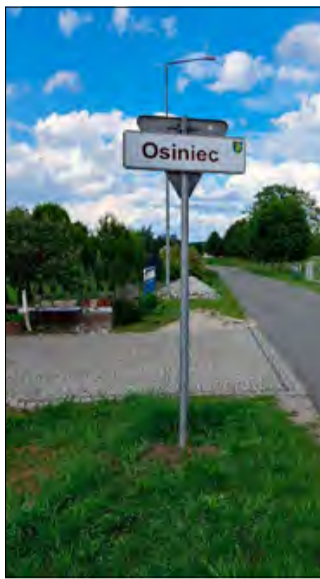
Tablice „opowiadają” historię wsi Dobrzeń Wielki.