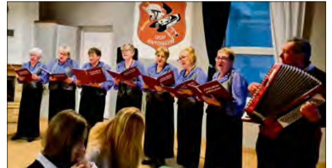
Podczas spotkania adwentowego w Antoniowie na scenie wystąpiły Opolskie Dziołchy.

Również w Antoniowie członkowie lokalnego DFK zorganizowali podobne