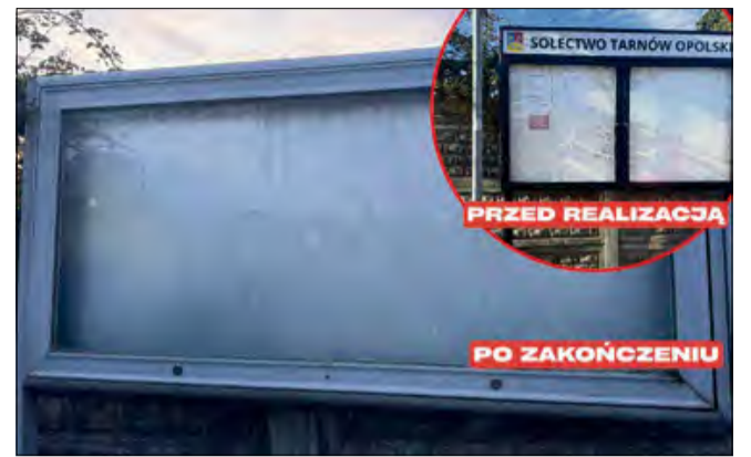
Nowa tablica już stoi na swoim miejscu.

– Nowa tablica już stoi na swoim miejscu i mamy nadzieję, że będzie dobrze