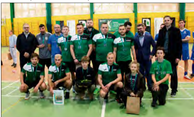
Tym razem drużyna Rotexu musiała zadowolić się drugą lokatą.