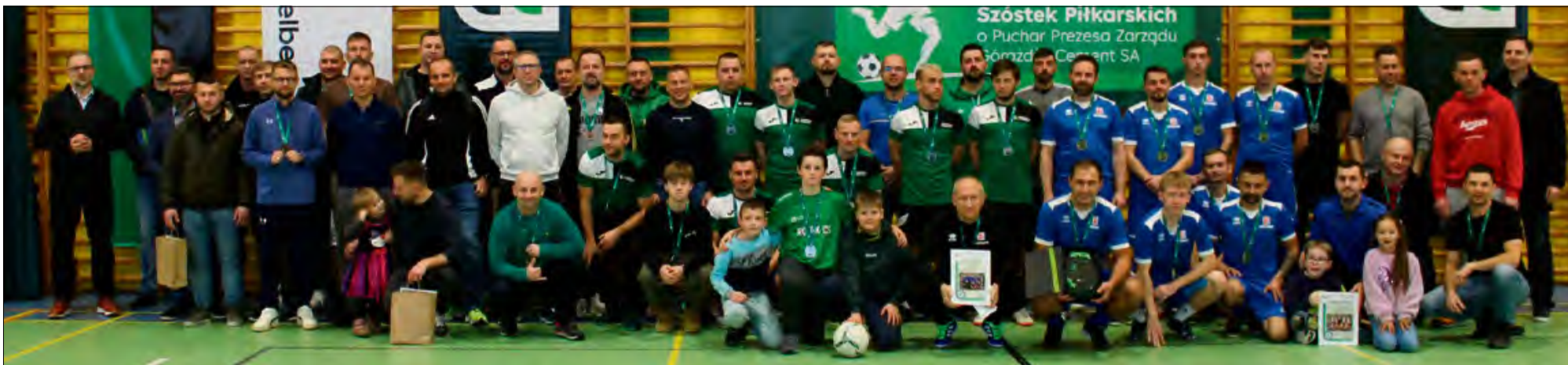
Górażdżańska impreza ma już prawie 30 letnią tradycję.

Dwudziesta siódma edycja halowych szóstek piłkarskich o puchar Prezesa Zarządu Górażdże Cement S.A. przeszła do historii. Barbórkowy turniej dostarczył sporo emocji, a kibice byli świadkami naprawdę solidnego futbolu w wykonaniu pracowników firmy. Tytuł mistrzowski, po raz pierwszy w historii zdobyła drużyna Betardu.