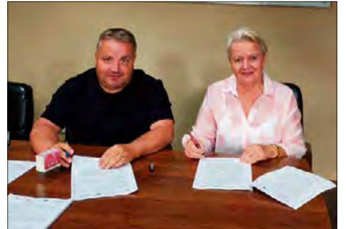
Pod koniec sierpnia podpisano umowę z wykonawcą na budowę ścieżki Popielów - Karłowice.

lofunkcyjne z nawierzchnią poliuretanową, zaplecze sanitarne, oświetlenie, ogrodzenie, piłkochwyty, a także ławki i stojaki rowerowe. Ważnym elementem będzie pumtrack o długości 145 metrów - atrakcyjny tor rowerowy rozwijający koordynację i sprawność dzieci i młodzieży.