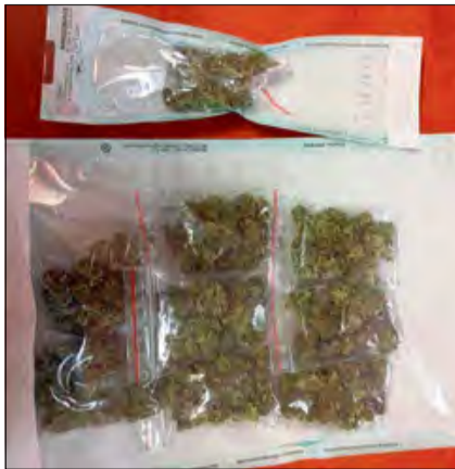
Przy zatrzymanym znaleziono narkotyki i środki odurzające.

W trakcie prowadzonych czynności potwierdziły się wszystkie zebrane przez policjantów informacje i pod koniec listopada mundurowi przystąpili do zatrzymania