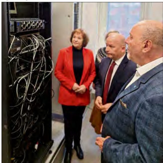
Urządzenie zapewni lepsze zabezpieczenie cyfrowych map i dokumentów geodezyjnych. Dane będą przechowywane bezpieczniej, a ich odzyskanie w razie awarii stanie się prostsze.