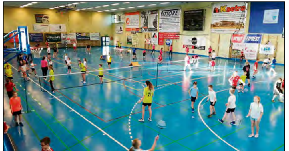
Już niedługo zawodnicy będą korzystać ze zrewitalizowanej nawierzchni w hali OSiR-u.

(ml), Fot. OSiR Komprachcice, gmina Komprachcice