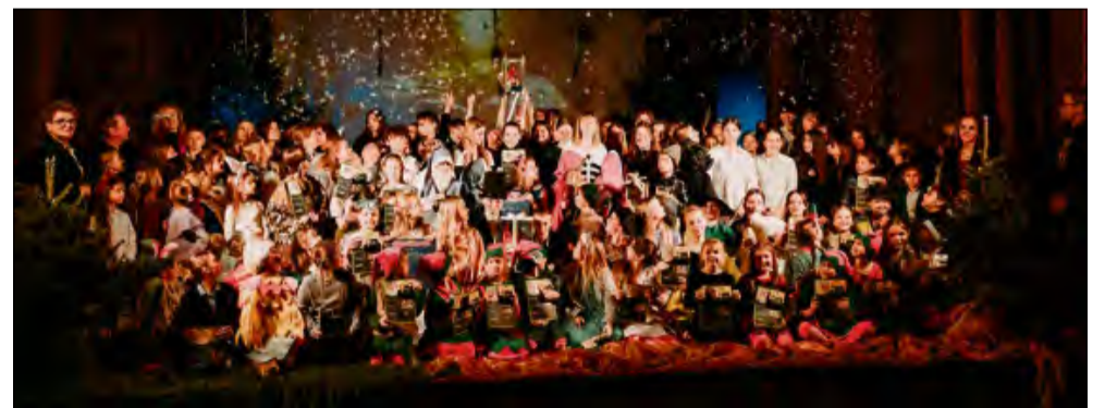
Uczniowie z sześciu szkół zaprezentowali spektakle w języku niemieckim podczas XIV Konfrontacji Teatralnych w Tarnowie Opolskim.

W Tarnowie Opolskim odbyły się XIV Niemieckojęzyczne Konfrontacje Teatralne. Podczas festiwalu, zorganizowanego przez stowarzyszenie Pro Liberis Silesiae, sześć szkolnych grup z gminy Tarnów Opolski zaprezentowało spektakle oparte na klasycznych opowieściach.