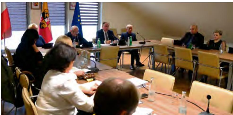
Podczas obrad zaprezentowano mieszkańcom oraz radnym Europejską Inicjatywę Społeczną.

Jedną z nich dotyczyła szczegółowego trybu i harmonogramu prac nad projektem Strategii Rozwoju Gminy Prószków na lata 2025–2030. Radni wyrazili zgodę w sprawie przystąpienia do sporządzenia wycinkowej zmiany miejscowego planu zagospodarowania przestrzennego wsi Nowa Kuźnia. Kolejną uchwałą dotyczyła planu nadzoru nad żłobkami, klubami dziecięcymi i dziennymi