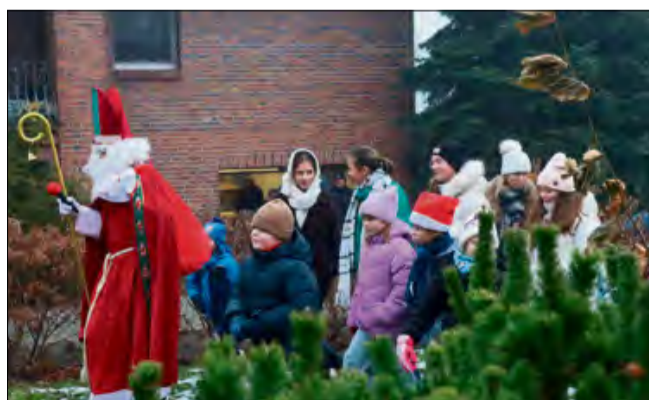
Podczas jarmarku w Chrzęszczycach odbyło się spotkanie ze św. Mikołajem.