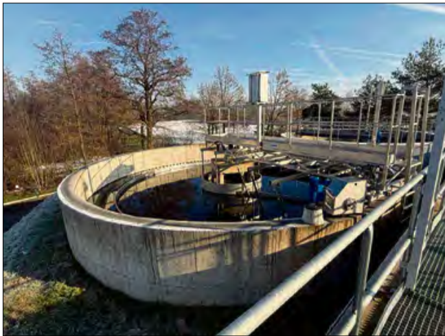
Modernizacja oczyszczalni ścieków w Starych Siołkowicach kosztowała 24 mln zł.

W 2025 roku przeprowadzono również termomodernizację Ośrodka Zdrowia w Karłowicach, połączoną z remontem wnętrza i wymianą instalacji. Koszt tego zadania wyniósł 2,1 mln zł. Ważną inwestycją była także przebudowa poddasza Centrum Kultury oraz pomieszczeń biblioteki