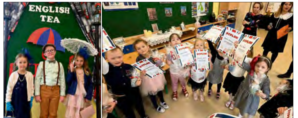
Dzieci wykazały się nie tylko wiedzą, ale też wyobraźnią i chęcią zabawy.

W przedszkolu w Chróście odbył się gminny konkurs języka angielskiego „English Tea”, który zgromadził najmłodszych miłośników angielszczyzny. W wydarzeniu wzięły udział dzieci z gminnych przedszkoli, prezentując swoje umiejętności językowe, kreatywność oraz odwagę.