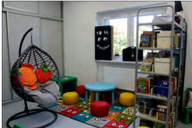
Ważną inwestycją była przebudowa poddasza Centrum Kultury oraz pomieszczeń biblioteki w Popielowie.

W trakcie realizacji znajduje się przebudowa i rozbu-