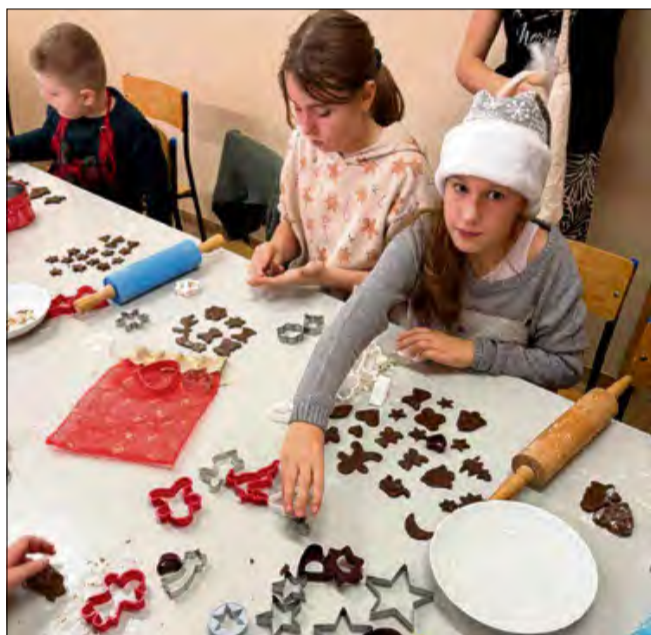
W Złotnikach zorganizowano piernikowe warsztaty.

P odczas minionego weekendu mieszkańcy gminy Prószków brali udział w świątecznych i adwentowych jarmarkach. Wydarzenia cieszyły się dużym zainteresowaniem ze strony uczestników. Oferowały świąteczne stoiska, drobne atrakcje oraz okazję do wspólnego spędzenia czasu w wyjątkowej atmosferze.