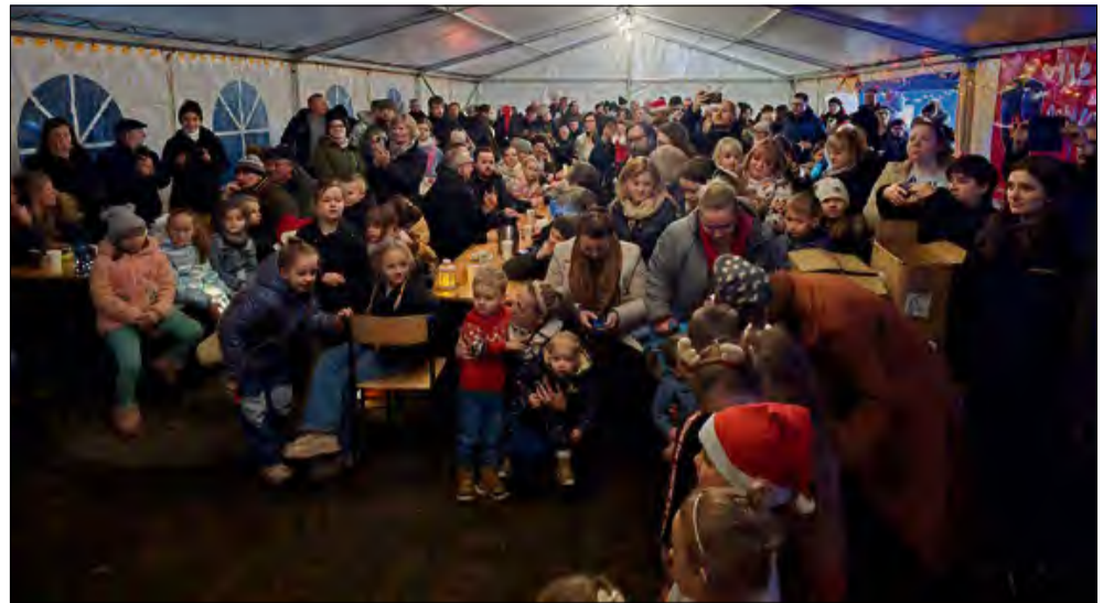
Mieszkańcy Krasiejowa spotkali się na jarmarku świątecznym.

nie Miłośników Krasiejowa oraz OSP Krasiejów. W przeprowadzenie świątecznej imprezy zaangażowało się wiele instytucji oraz wolontariuszy. Mogli też oni liczyć na wsparcie finansowe Urzędu Gminy i Miasta w Ozimku.