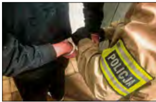
Zatrzymanemu grozi kara nawet do 5 lat pozbawienia wolności.

Do zdarzenia doszło krótko po godzinie pierwszej w nocy. - Uwagę policyjnych wywiadowców z Opola zwrócił kierujący audi. W trakcie kontroli mężczyzna był bardzo nerwowy. Po chwili funk-