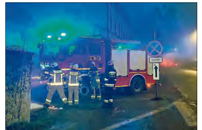
Na miejsce zgłoszenia przyjechała OSP Tarnów Opolski.

Do zdarzenia doszło 1 grudnia około godziny 16.00. Na miejsce zgłoszenia, gdzie miał być wyczuwalny zapach gazu wysłana została jednostka Ochotniczej Straży Pożarnej z Tarnowa Opolskiego, która po dojeździe zbadała miernikiem poziom niebezpiecznych substancji. Po weryfikacji okazało się, że na szczęście nie ma zagrożenia i potrzeby