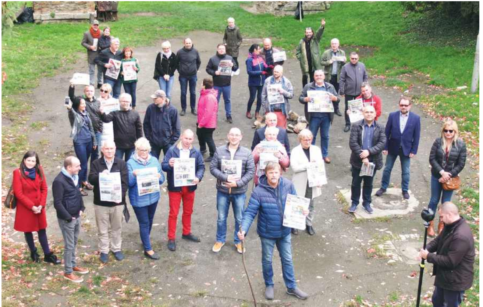
Grupa wydawców gazet lokalnych, należących do SGL - Zamek Czocho, jesień 2019 r.

Żeby móc w dalszym ciągu wspierać niezależne lokalne media, SGL potrzebuje jednak pomocy ze strony ich Czytelników. Ci mogą to zrobić przekazując 1,5 procenta podatku. Wystarczy, że w formularzu PIT wpiszą numer KRS 0000090214