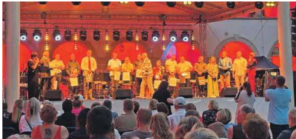
W rywalizacji wzięło udział aż 13 orkiestr z całej Polski, prezentując niezwykle wysoki i wyrównany poziom artystyczny

Występ tarnogórskiej orkiestry w tak prestiżowym festiwalu to nie tylko muzyczny sukces, ale także promocja Tarnowskich Gór i jego bogatej tradycji artystycznej. (MIR)