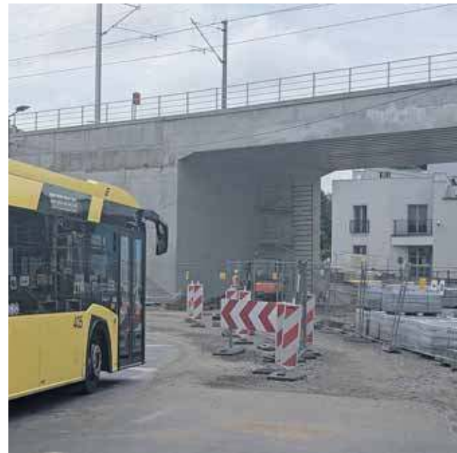
Prace mają się zakończyć pod koniec sierpnia

Jak tłumaczy wykonawca, opóźnienia są wynikiem przeszkód niezależnych od firmy. W trakcie prac natrafiono bowiem na niezidentyfikowane elementy infrastruktury podziemnej. Pod powierzchnią starej nawierzchni znaleziono m.in. betonowe elementy, co wy-