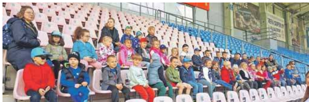
Podczas jednej z wycieczek przedszkolaki miały okazję obserwować trening zawodników klubu Piast „Gliwice”