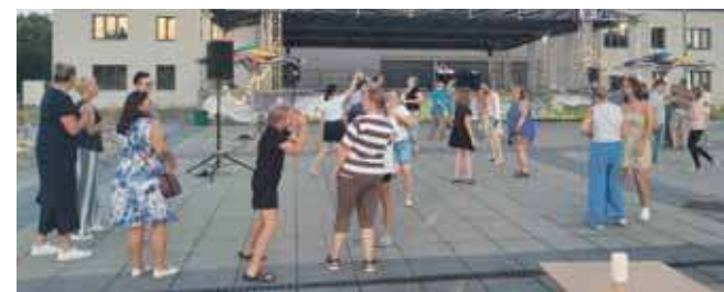
Pierwsza potańcówka odbyła się 6 lipca