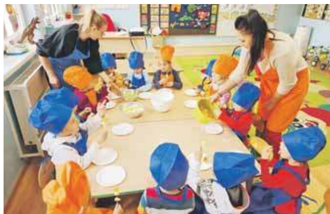
W ramach działań konkursowych zorganizowano także kulinarny dzień pod hasłem „Jedz smacznie i zdrowo”

To ogromny powód do dumy – przedszkole w Świętoszowicach zdobyło I miejsce w Wojewódzkim Konkursie Śląskiego Kuratora Oświaty „Bądź Aktywny z Kuratorem”. Nagroda została odebrana podczas uroczystej gali, która odbyła się w Pałacu Młodzieży w Katowicach, w ramach Wojewódzkiego Zakończenia Roku Szkolnego.