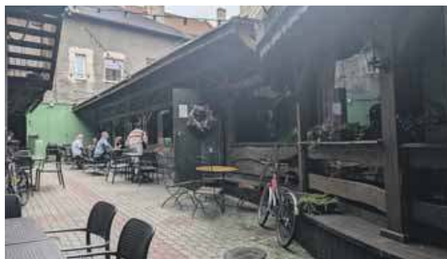
Do końca lipca działa na dotychczasowych zasadach