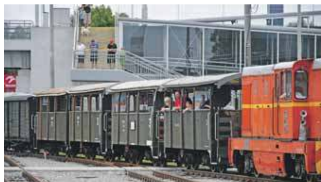
Wąskotorówka pierwszy raz po długiej przerwie wjechała na stację w Miasteczku Śląskim