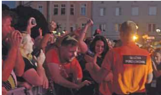
Gwarki 2024. Próba przeskokowania barierek pod sceną w czasie koncertu zespołu Kult

Na przetarg wpłynęły trzy oferty. O co zabiegali oferenci? Tegoroczne Gwarki będą odbywać się w dniach 12-14 września. Kompleksowe zabezpieczenie Gwarków 2025 obejmuje ochronę i patrolowanie na terenie imprezy masowej i imprez towarzyszących, monitoring, zabezpieczenie medyczne. Imprezy towarzyszące to festyn bezalkoholowy „Postaw na rodzinę” przy Tarnogórskim Centrum Kultury, XXI Tarnogórski Bieg Sedlaczka w parku Miejskim, Pochód Gwarkowski oraz organizowany na pl. Wolności kiermasz rzemiosła artystycznego.