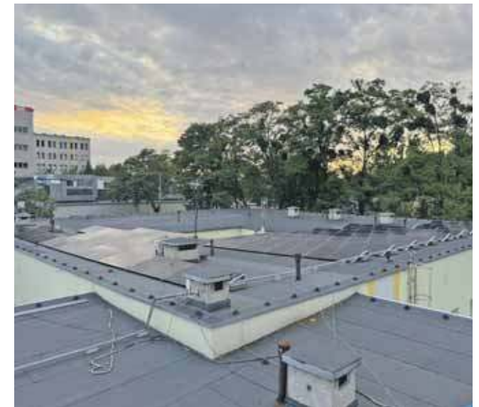
Zakończono instalację paneli fotowoltaicznych