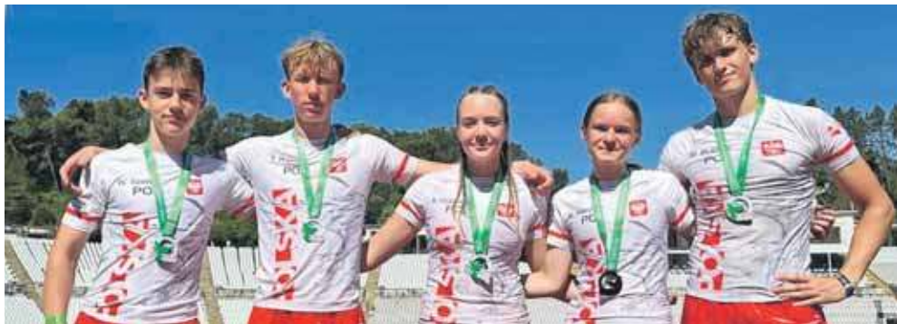
Reprezentacja Spartan Team Kalety pokazała się z dobrej strony