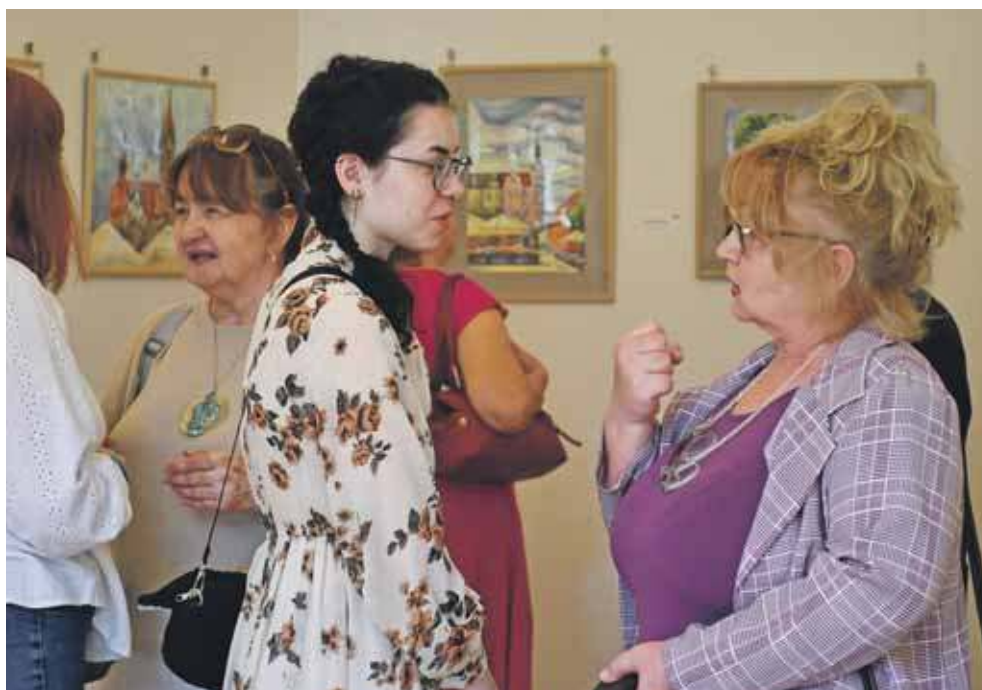
W piątek w Centrum Kultury Śląskiej odbył się wernisaż

Prezentowane prace to efekt zarówno ostatniego tygodnia spędzonego w Tarnowskich Górach i powiecie