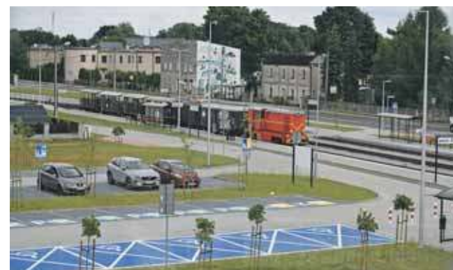
Zmodernizowana stacja jest częścią nowego węzła przesiadkowego wybudowanego przez samorząd Miasteczka Śląskiego