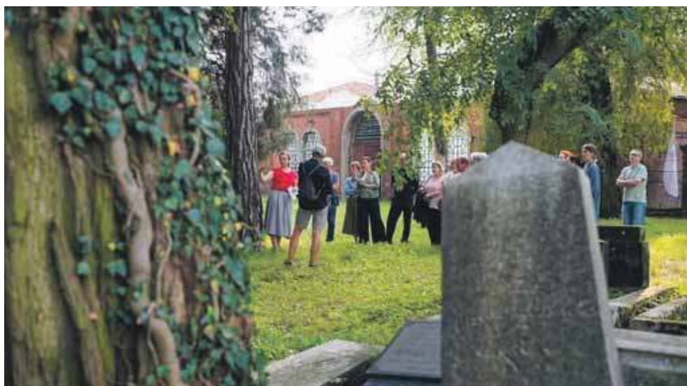
Oprowadzania odbywają się co środę do końca sierpnia

W tych godzinach organizowane jest bezpłatne oprowadzanie wszystkich zainteresowanych po cmentarzu. „Opowiemy o historii i kulturze tarnogórskich Żydów, specyfice tutejszego cmentarza oraz działalności stowarzyszenia” – zachęca Stowarzyszenie Gliwicka 66. (EKA)