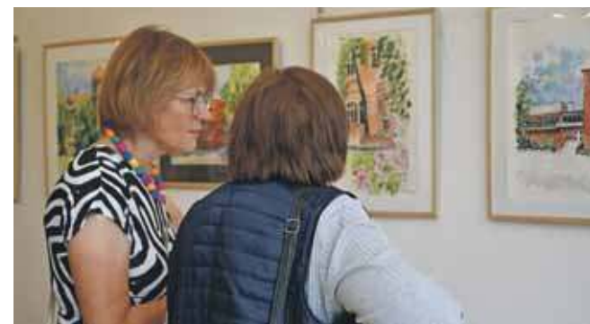
Wystawę można oglądać do 22 lipca