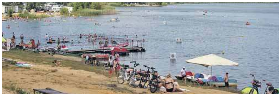
Do ostatniej chwili nie było wiadomo, kto będzie czuwał nad bezpieczeństwem osób kąpiących się w zalewie Nakło-Chechło