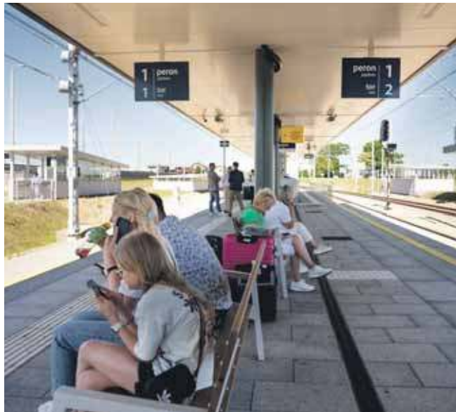
Bezpośrednie połączenie kolejowe z lotniskiem mają już mieszkańcy m.in. Bytomia, Radzionkowa, Tarnowskich Gór