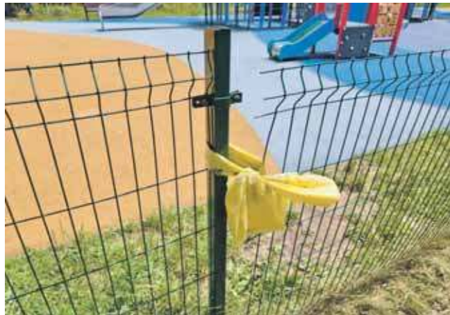
Prowizoryczne „zabezpieczenia” ogrodzenia na placu zabaw na os. Fazos

W interpelacji Krzysztof Bergier wskazuje m.in. na