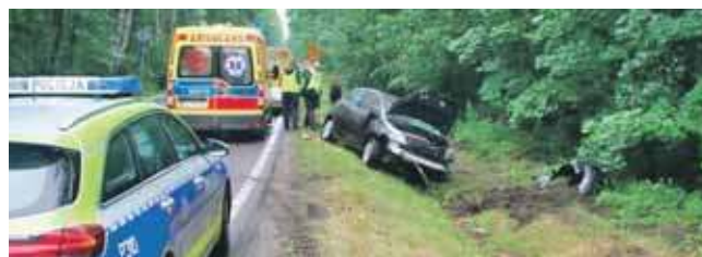
Kobiecie nic się nie stało