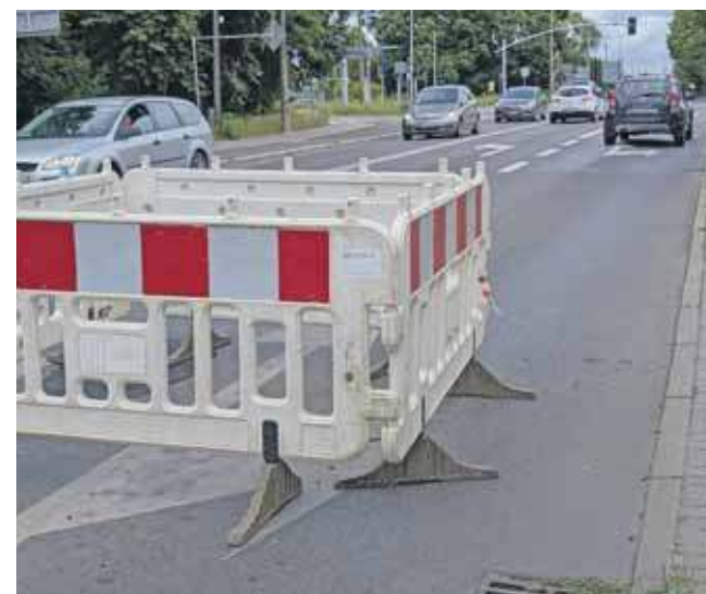
Droga ma być zamknięta przez trzy dni