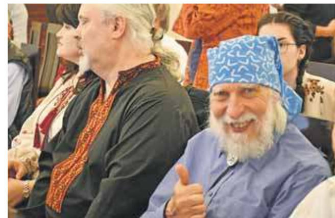
Artyści zrzeszeni w Stowarzyszeniu Artystów Śląskich STAS, a także goście z niemieckiego powiatu Erlangen-Höchstadt oraz z Ukrainy, malowali nasz powiat

Wystawa potrwa do 22 lipca w pałacu w Nakle Śląskiej. (EKA)