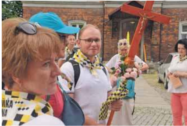
W drogę do Piekar wyruszyło z kościoła pw. Świętych Apostołów Piotra i Pawła w Tarnowskich Górach około 130 pielgrzymów