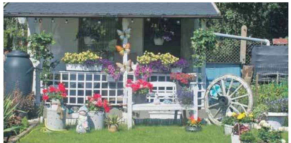
Mieszkańcy po raz kolejny udowodnili, że mają niezwykle zmysł estetyczny, ogromne serce do roślin i pasję do ogrodnictwa