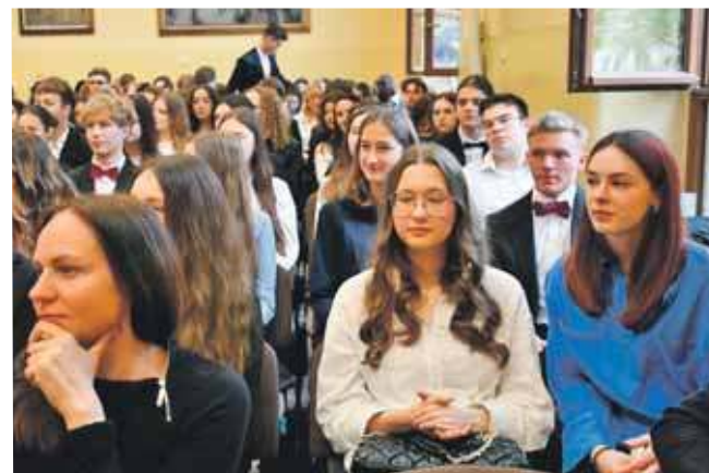
Zdecydowanymi liderami wśród liceów ogólnokształcących są: II LO im. Stanisława Staszica w Tarnowskich Górach oraz Liceum Sztuk Plastycznych w Tarnowskich Górach, gdzie wszyscy uczniowie zdali maturę

Pełną listę szkół można znaleźć na stronie Okręgowej Komisji Egzaminacyjnej w Jaworznie. (EKA)