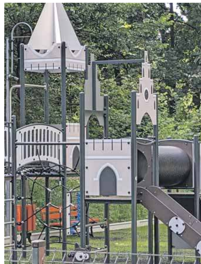
Charakterystycznym elementem jest „zamek”