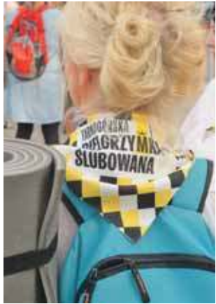
Pielgrzymi w tym roku mieli chusty z tarnogórką kratką

W niedzielę, 6 lipca odbyła się kolejna ślubowana pielgrzymka z Tarnowskich Gór do Piekar Śląskich . Była liczniejsza niż w ostatnich latach.