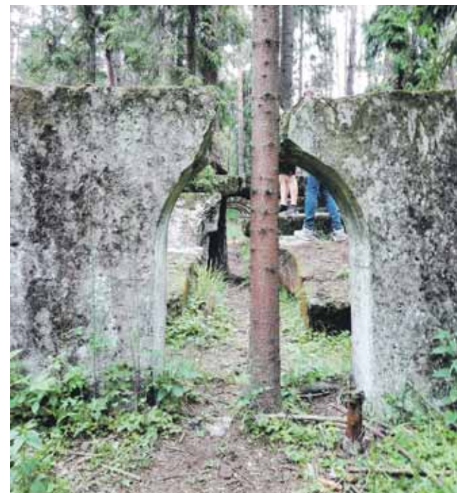
17 czerwca 1917 r. do wyrobisk wdarła się woda, ale nic nie zapowiadało katastrofy

Po kopalni pozostały resztki zabudowań i stawki o charakterystycznym odcieniu wody.