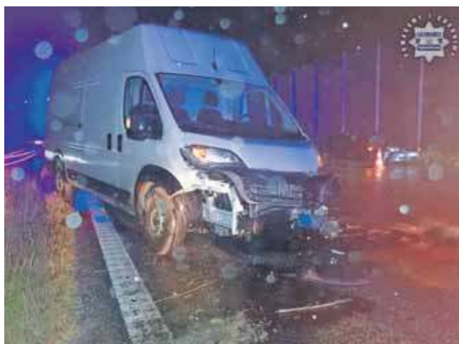
W zdarzeniu nikt nie ucierpił

Po godzinie 1.00 na autostradzie A1 na wysokości Świętoszowic 20-letni kierowca bmw, mieszkaniec Żor, zaczął wyprzedzać dostawczego fiata, którym jechał 28-latek z Bytomia. Podczas manewru stracił panowanie nad pojazdem i uderzył w fiata. Oba sa-