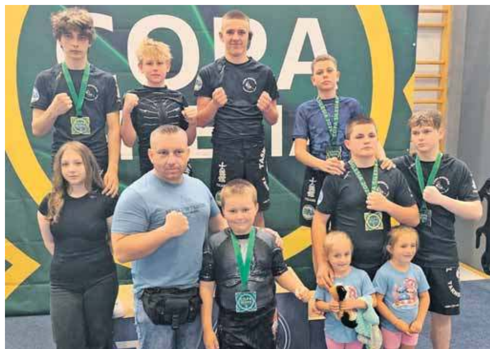
Budokan Tarnowskie Góry wywalczył 14 medali na turnieju w Gliwicach