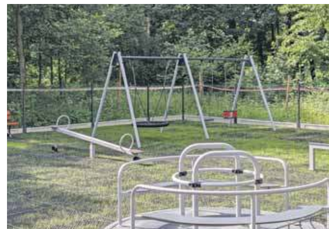
Plac zabaw kosztował prawie 400 tys. zł