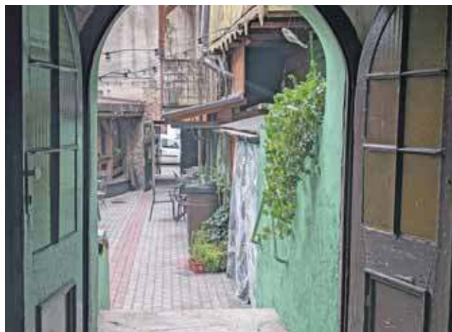
Po Gwarkach lokal definitywnie zostaje zamknięty