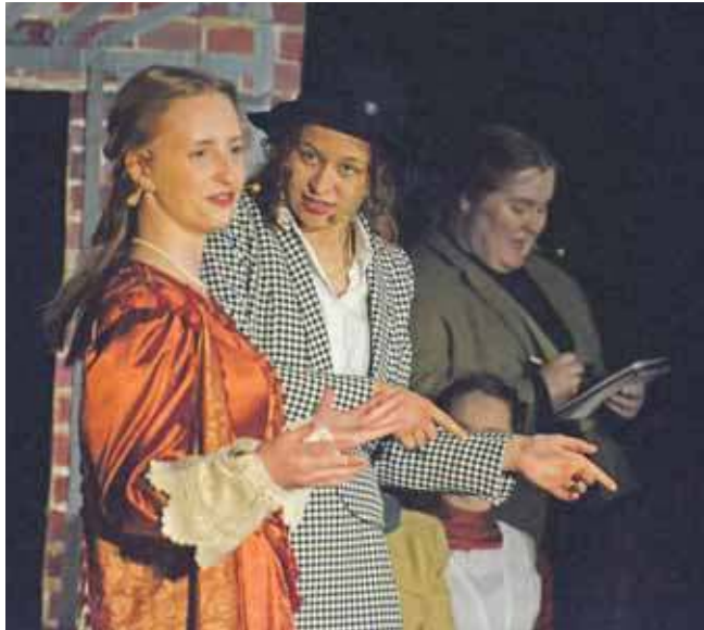
Przed sklepem Panofsky'ego przy ul. Zamkowej w Tarnowskich Górach spotkały się spotkało się osiem kobiet, które zaznaczyły swoją obecność w Tarnowskich Górach

W Tarnowskich Górach rozpoczęło się Teatralne Parkowanie 2025. W sobotni wieczór Nie-spasowani i TG Akt – wystawili „Zagadkowe spotkanie w TG”.