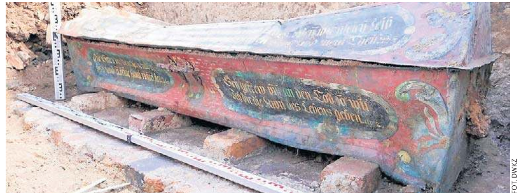
Odnaleziony sarkofag trafił w ręce specjalistów

Po wydobyciu sarkofagu szczątki burmistrza zostały potraktowane z należytym szacunkiem. Złożono je w drewnianej trumnie i pochowano na miejscowym cmentarzu w Lubaniu. Wzięli w niej udział duchowni różnych wyznań: pastor parafii ewangelicko-augsburskiej ks.