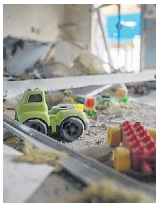
Irańskie pociski spadły na izraelskie przedszkole

Niedzielną operację odwetową nastąpiła niespełna dobę po uderzeniu irańskiego pocisku balistycznego w miasto Arad na południu Izraela.