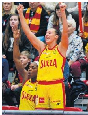
Śleza Wrocław udanie zaczęła grę w play-offach

W pozostałych ćwierćfinałowych starciach obyło się bez nie-