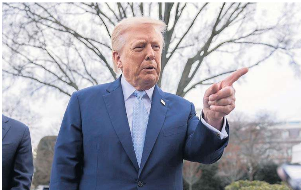
Oświadczenie Trumpa pojawiło się w sobotę wieczorem na platformie Truth Social. Ultimatum upływa tuż przed 1 w nocy czasu polskiego z poniedziałku na wtorek

Amerykański prezydent wielokrotnie wcześniej groził zniszczeniem irańskich elektrowni - w tym elektrowni jądrowej - twierdząc, że w ten sposób w ciągu godziny mógłby spowodować takie zniszczenia, że kraj nie byłby się w stanie z tego podnieść. Trump podkreślał jednak wówczas, że jest „miły” i tego nie robi.