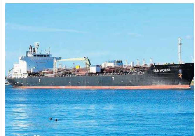
Tankowiec „Sea Horse” uważany za część „floty cieni”, które transportują rosyjską ropę i gaz

Wiceminister spraw zagranicznych Kuby Carlos Fernandez de Cossio powiedział, że „system polityczny Kuby nie podlega negocjacji ze Stanami Zjednoczonymi”.