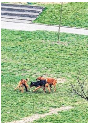
Biegające luzem psy atakują ludzi bez żadnego powodu. I to od kilku lat