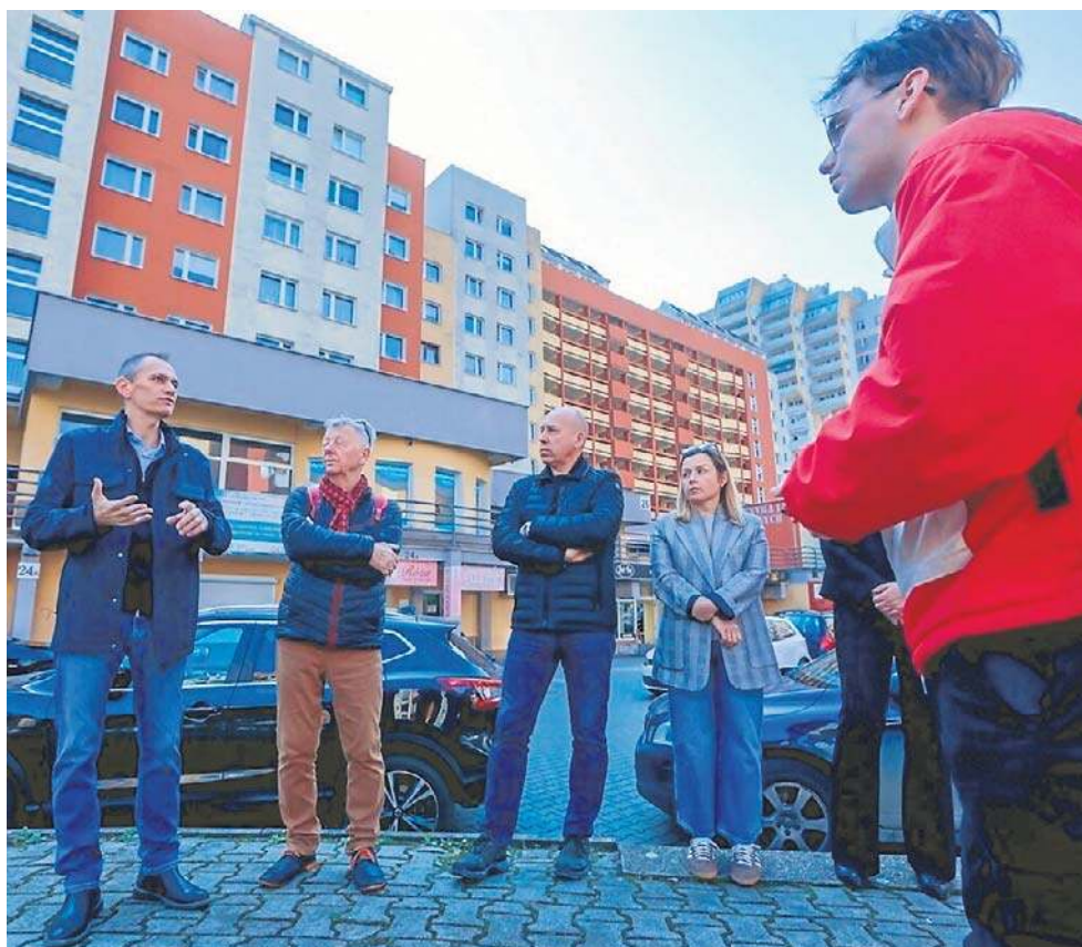
Przedsiębiorcy poskarżyli się nam na rozwiązania wprowadzone przez spółdzielnię

- Nikt z nami tego nie przedyskutował. Decyzje zapadły ponad naszymi głowami. Nie widzieliśmy żadnych dokumentów, które jasno pokazywałyby, że większość mieszkańców rzeczywiście chce tych szlabanów. W budynku mieszka 300 osób, a prezes SM