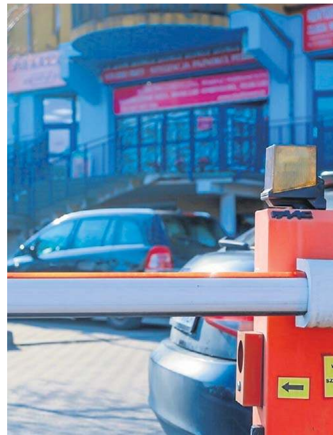
Szlabany utrudniają klientom dotarcie do firm

Prezes zaznacza, że kluczowy jest interes większości mieszkańców, nawet jeśli oznacza to utrudnienia dla przedsiębiorców. Petycję dotyczącą spornego szlabanu podpisało