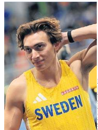
Armand Duplantis - jego rekord świata to dziś 6.31

HMŚwlekkolatlyce-4x400sztafeta mieszana: 1. Belgia 3:15.60; 2. Hiszpania 3:16.96; 3. Polska (Duszyński, Gryc, Karolewski, Święty-Ersetic) 3:17.44; 4. Holandia 3:20.14; 5. USA 3:21.35. ©️