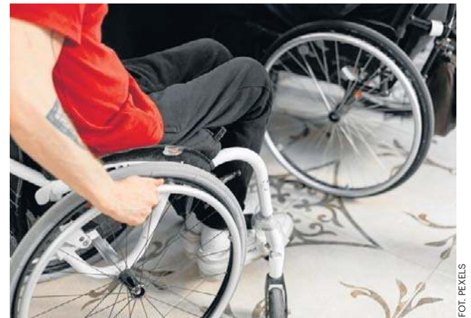
Sąd: zaniedbanie urzędnika odebrało mężczyźnie zdrowie i plany na przyszłość. Zdjęcie ilustracyjne