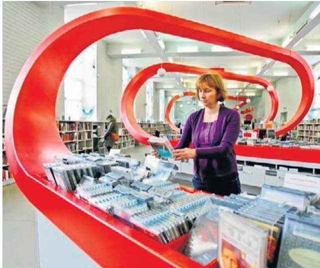
Pilotaż skróconego czasu pracy wdrożyła m.in. wrocławska Mediateka

- Myślę, że to jednak nie sprawi nam większych problemów, będziemy już po zastoso-