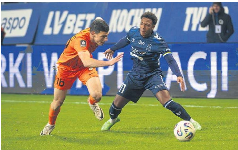
Nie tak wyobrażali sobie mecz w Lublinie piłkarze Zagłębia. Rywale wygrali zasłużenie