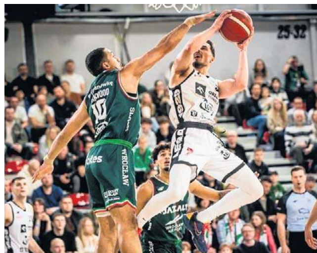
Spotkanie w Warszawie może śmiało kandydować do miana najlepszego widowiska sezonu zasadniczego

„Trójkolorowi” drugi raz w tym sezonie pokonali aktualnego mistrza Polski (we Wrocławiu padł wynik 98:84) i awansowali na pozycję wicelidera Orlen Basket Ligi.