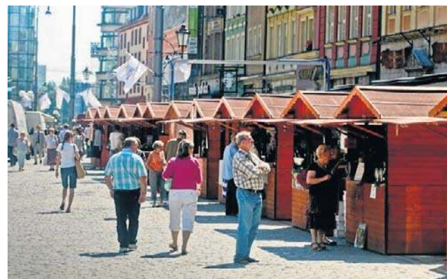
W ubiegłym roku jarmark cieszył się sporym zainteresowaniem

Na Rynku przed przegierem, na ulicy Świdnickiej i ulicy Oławskiej we Wrocławiu łącznie stanie około 80 drewnianych domków oferujących wyroby rzemieślnicze, regio-