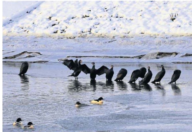
Przez coraz cieplejsze zimy kormorany przestały odlatywać z Polski

- Było to najprawdopodobniej związane z wyjątkowo mroźną zimą, podczas której większość akwenów była zamrznięta, natomiast przy wylotach kanałów odpływo-