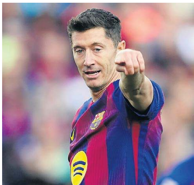
Kapitan reprezentacji Polski Robert Lewandowski zdobył jedenastą bramkę w obecnym sezonie La Ligi

W hiszpańskiej La Lidze lider rozgrywek, Barcelona, pokonała na własnym stadionie Vil-