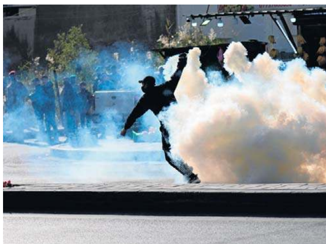
Zamieszki na moście prowadzącym do bagdadzkiej Zielonej Strefy. Ochrona ustawiła bariery na moście

Ochrona ustawiła bariery na moście prowadzącym do ściśle strzeżonej dzielnicy dyplomatycznej, w której znajdują się m.in. ambasada USA oraz irackie budynki rządowe - podała kurdyjski portal Shafaq News.