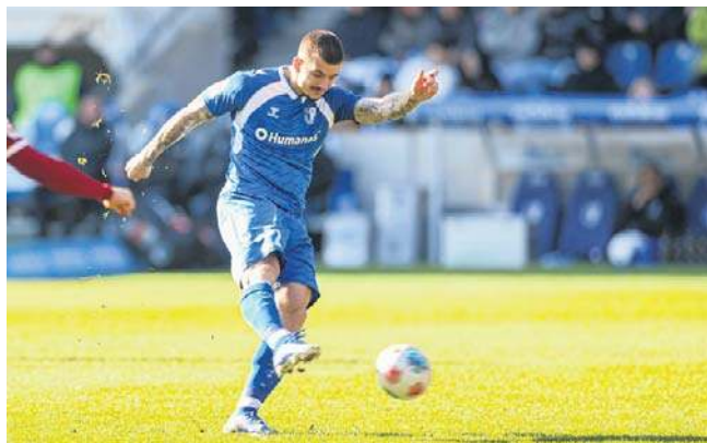
Żukowski goni popularnością naszych... szczypiornistów

Finał zgromadził na trybunach 4641 widzów. Dziś taka frekwencja szkodzi, lecz wtedy mieszkańiec NRD miał nikłe