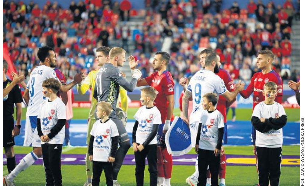
Raków i Lech prezentują odmienne style gry, ale oba zespoły są skuteczne w Europie

Warto odnotować, że jeśli Lech dostałby się do półfinału i osiągnął największy sukces