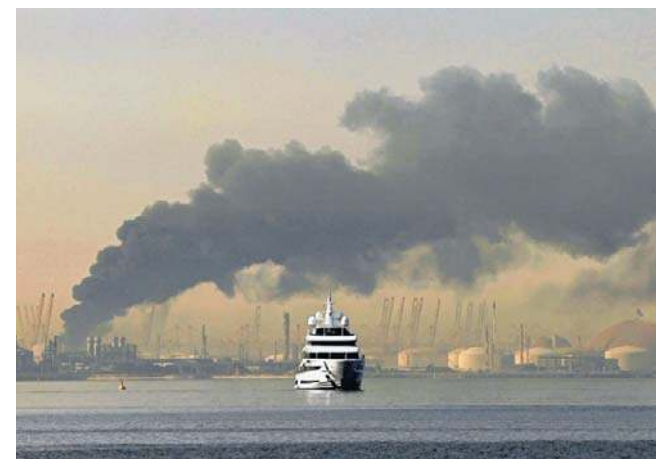
W niedzielny poranek w miastach Zatoki Perskiej: Dubaju, Dosze i Manamie, słychać było wybuchy

Ministerstwo spraw wewnętrznych Omanu podało, że podjęto działania w związku z niewielkim pożarem, do którego doszło w strefie przemysłowej po upadku fragmentów straconej rakiety. W ataku na tankowiec Skylight płynący pod banderą Palau rannych zostało czterech marynarzy. Całą 20-osobową załogę składającą się z Indusów i Irańczyków ewakuowano. Nie jest na razie jasne, kto zaatakował tankowiec, ale - jak przypominała agencja AP - Iran zagroził wcześniej, że uderzy w statki płynące przez Cieśninę Ormuz.