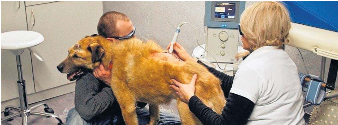
Przypadków okrucieństwa wobec zwierząt jest wiele. Weterynarze ratują im życie, czasem w ostatniej chwili