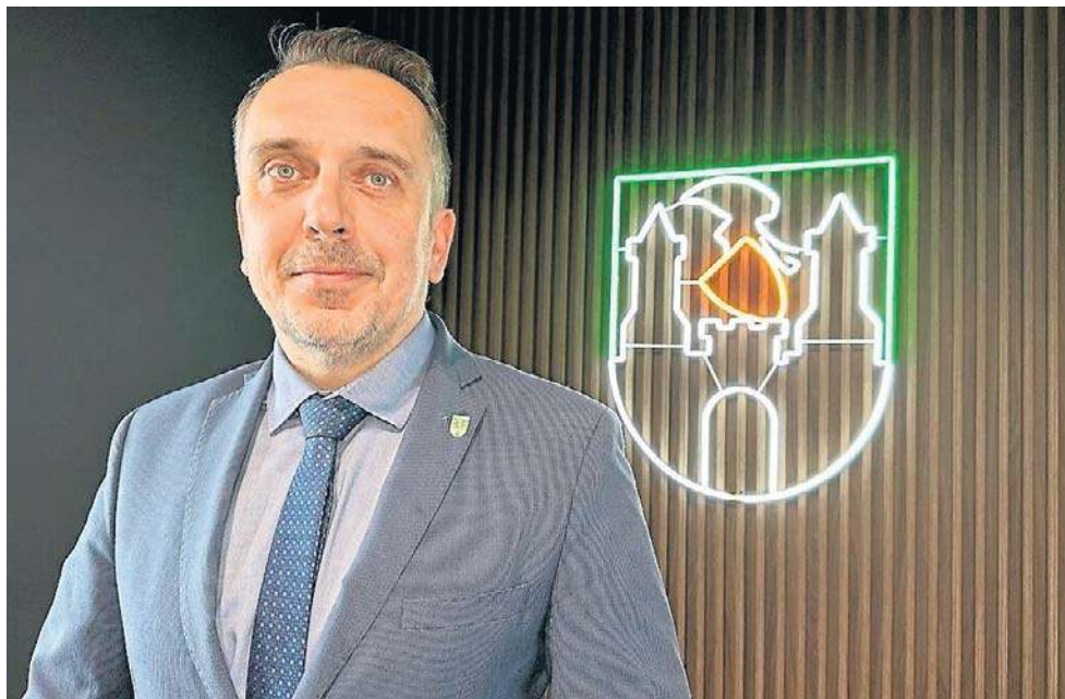
Prezydent miasta przedstawił listę inwestycji zaplanowanych na ten rok

W Zielonej Górze powstają nowoczesne hale sportowe. W Zespole Szkół Zawodowych przy ul. Botanicznej wykonano już 80 proc. zaplanowanych prac. Otwarcie obiektu zaplanowano na czerwiec. Około dwóch miesięcy dłużej trzeba będzie poczekać na halę przy Zespole