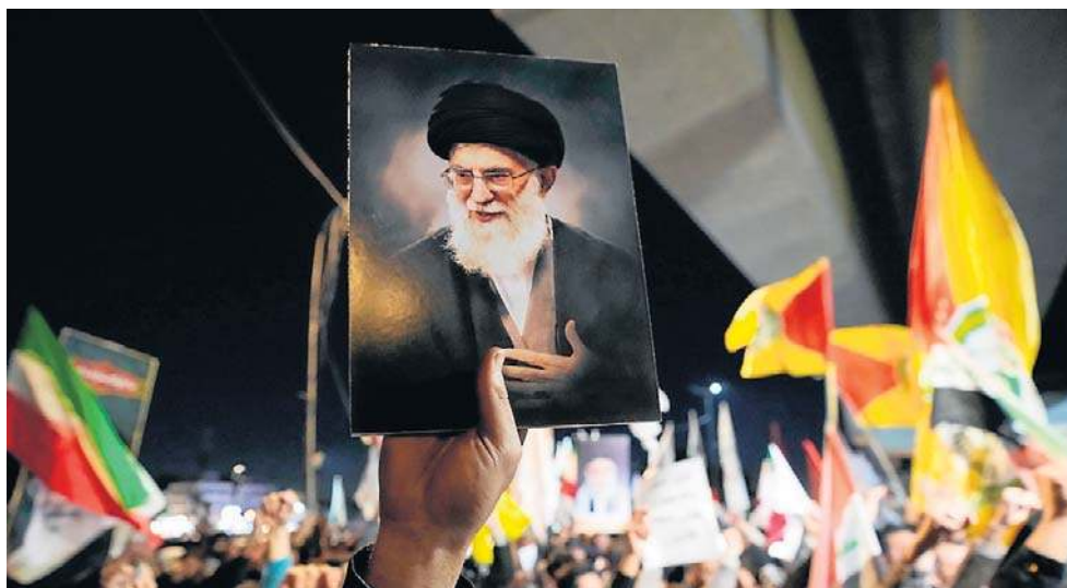
Tysiące osób wyszły na ulice po ogłoszeniu informacji o śmierci najwyższego przywódcy duchowo-politycznego Iranu, ajatollaha Alego Chameneia

Proces przekazania władzy w Iranie po śmierci ajatollaha Alego Chameneia rozpoczął się wczoraj. - Wkrótce zostanie sformowana tymczasowa rada przywódcza. Do czasu wyboru przyszłego przywódcy kraju odpowiedzialność przejmą prezydent Masoud Pezeszkian, szef władzy sądowej Golamhosejn Mohseni Edżei oraz jeden z prawników Rady Strażników - oznajmił sekretarz irańskiej Najwyższej Rady Bezpieczeń-