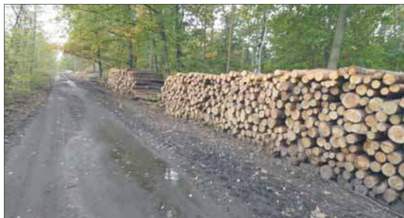
Przy ulicy Mysłowickiej

topole kanadyjskie oraz klony jesionolistne. Pojawia się robinia akacyjna i czeremcha amerykańska. Sosny zwyczajne także tutaj są. Jeśli chodzi o śmieci, to dominują tutaj artefakty z kategorii budują, remontują urządząją. Jest sporo szkła i butelek z tworzyw sztucznych. Są jeszcze opony. Więcej tego jest na obszarze pobliskich zrujnowanych historycznych budynków.