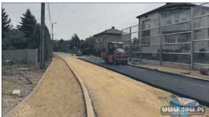
Prace na Niedzieliskach – ulica Górnośląska

skiej oraz na ulicy Upadowej. Te prace powinny zakończyć się w lipcu, wtedy też ruch samochodowy zostanie puszczony tymi ulicami, co z kolei umożliwi rozpoczęcie przebudowy ulicy Szczakowskiej.