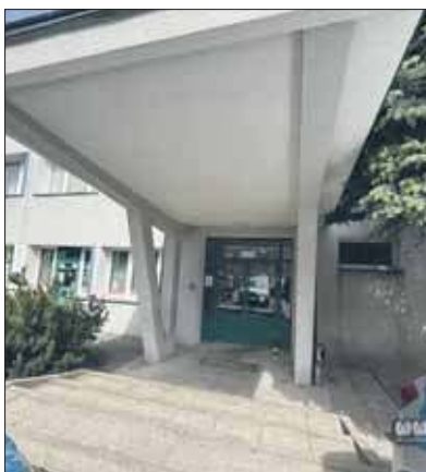
Lokalizacja ul. Gwarków

– W imieniu Elvita NZOZ GZLA zakładu leczniczego PŚZ i PZ Elvita – Jaworzno III Sp. z o.o. informuję, iż z dniem 1 czerwca 2025