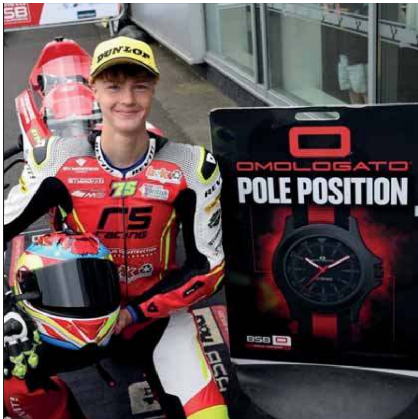
Wygrane kwalifikacje