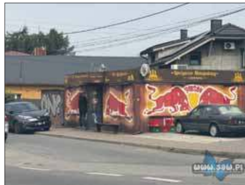
Tragedia na Długoszyńcu. Nie żyje 53-letni właściciel sklepu

Sytuacja była dramatyczna, jednak sąsiedzi nie czekając na przyjazd służb ratunkowych, sami podję-