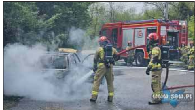
Pożar auta na Pieczyzkach

We wtorek 13 maja, około godziny 14:00 doszło do pożaru samochodu osobowego. Zaparkowany dawoo matiz stanął w płomieniach, a kłęby dymu były widoczne z daleka. Samochód ten spłonął, stojąc na ulicy Przemysłowej na Pieczyzkach. Do walki z pożarem natychmiast zadysponowano strażaków z Jednostki Ratowniczo-Gaśniczej w Jaworznie.