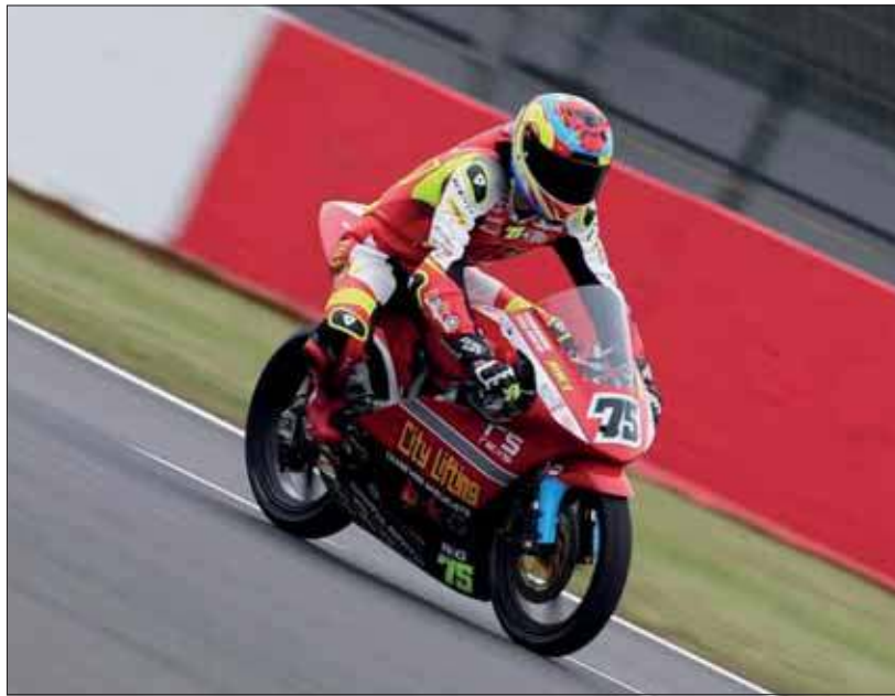
Pierwsza runda na torze Donington Park

Linie mety przekroczył z przewagą 0.084 sekundy.