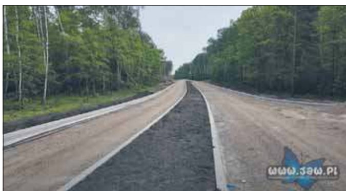
Prace na wysokości Parku Lotników – ulica Nowoszczakowska

Równolegle prowadzone są roboty na pierwszym odcinku ulicy Nowoszczakow-