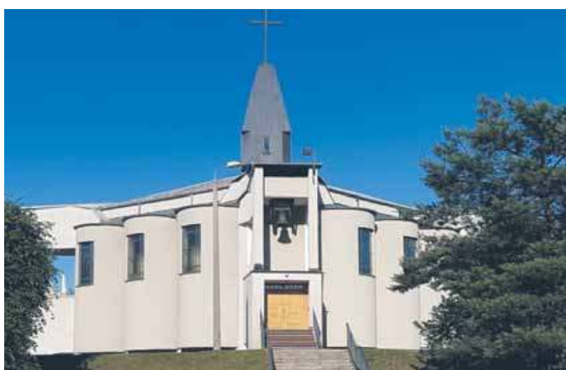
Kościół parafialny w Długoszynie z zawieszonym nad wejściem głównym dzwonem

W drugi dzień świąt wielkanocnych, kiedy leżałem sobie po śniadaniu wygodnie, zwróciłem nagle uwagę na to, że o nietypowej porze i nietypowo długo dzwoni w kościele parafialnym św. Wojciecha. Jego dźwięk jest czysty i doniosły. Niemal natychmiast, kiedy zorientowałem się z nietypowości pory i długości dzwonienia, pierwszą myślą, jaka przemknęła mi przez głowę, była śmierć papieża Franciszka. Niemal natychmiast zająłem na media społecznościowe, w ramach których niemal wszędzie informowano o zgonie Ojca Świętego. Z jednej strony było to zaskoczenie. Jeszcze dzień wcześniej Franciszek był obecny na placu św. Piotra. Pojawiła się nadzieja, że stan jego zdrowia się poprawia. Okazało się jednak, że jest zupeł-