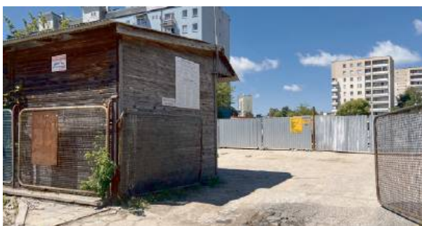
Tym razem remont odbywa się od ulicy Czerwonego Krzyża.