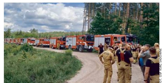
To było duże przedsięwzięcie szkoleniowe!

nać współdziałanie jednostek ochrony przeciwpożarowej podczas walki z pożarami wielkoobszarowych lasów, a także współpracę ze służbami leśnymi podczas tego typu zdarzeń. Dodatkowo była to możliwość praktycznego sprawdzenie możliwości dostarczenia wody na duże odległości. Każde ćwiczenia strażackie są formą podnoszenia umiejętności służb oraz wypracowania właściwych metod szybkiego reagowania w sytuacji pożaru lasu. W szkoleniu wzięły udział następujące jednostki: JRG Węgrów KP PSP Węgrów, JRG Węgrów posterunek w Ostrówku, OSP