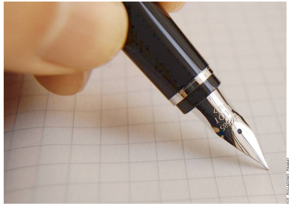
Podpisy pod petycją będą zbierane w formie elektronicznej przez cały okres wakacyjny.

Przypomnijmy, w Prokuraturze Okręgowej w Siedlcach już od ponad dwóch miesięcy gromadzony jest materiał dowodo-