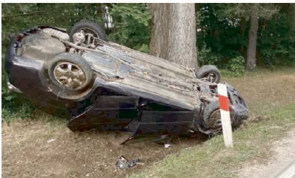
Wyglądało bardzo niebezpiecznie...

– Badanie wykazało, że kierowca miał 1,6 promila alkoholu w organizmie, dodatkowo nie posiadał uprawnień do kierowania pojazdem, dlatego trafił do policyjnego aresztu – dodaje przedstawicielka komendy. Z kolei pasażerka została zatrzymana w areszcie w związku z tym, że Sąd Rejonowy w Siedlcach już wcześniej poszukiwał ją do odbycia kary 25 dni pozbawienia wolności. Dzieci po badaniach w szpitalu trafiły pod opiekę babci. OPR. RED