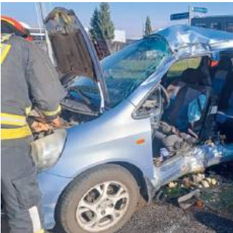
Kobieta również nie przeżyła.

14 czerwca uzyskaliśmy informacje od siedleckiej policji, potwierdzające, że kobiety nie udało się uratować.