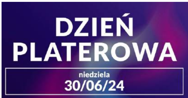
Ostatni dzień czerwca warto będzie spędzić w Platerowie.

Szkicując planszę kulturalnej rozrywki na koniec czerwca w powiecie łosickim, nie sposób pominąć nadchodzącego Dnia Platerowa.