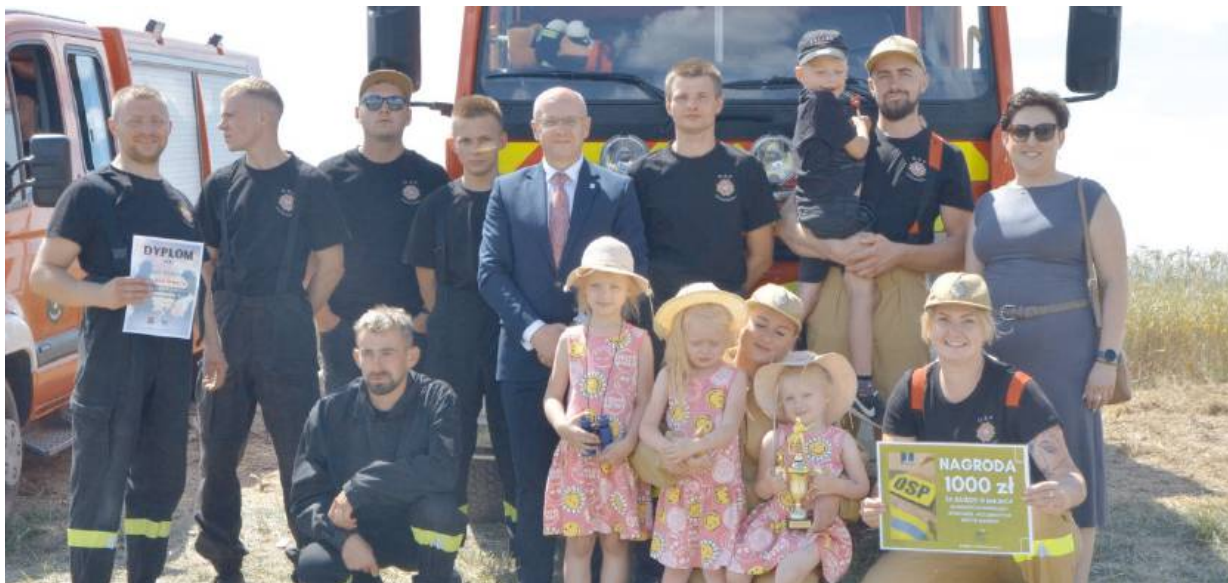
Jedna z drużyn gminy Sokół Podlaski z przedstawicielami urzędu

Podczas zawodów strażackich sprawdzono nie tylko umiejętności i wytrzymałości drużyn, ale również element współpracy drużynowej. Takie wydarzenia budują ducha wspólnoty, edukacji oraz są dobrym sposobem szkolenia pożarniczego strażaków. Dzięki nim strażacy doskonalą swoje umiejętności, a społeczeństwo