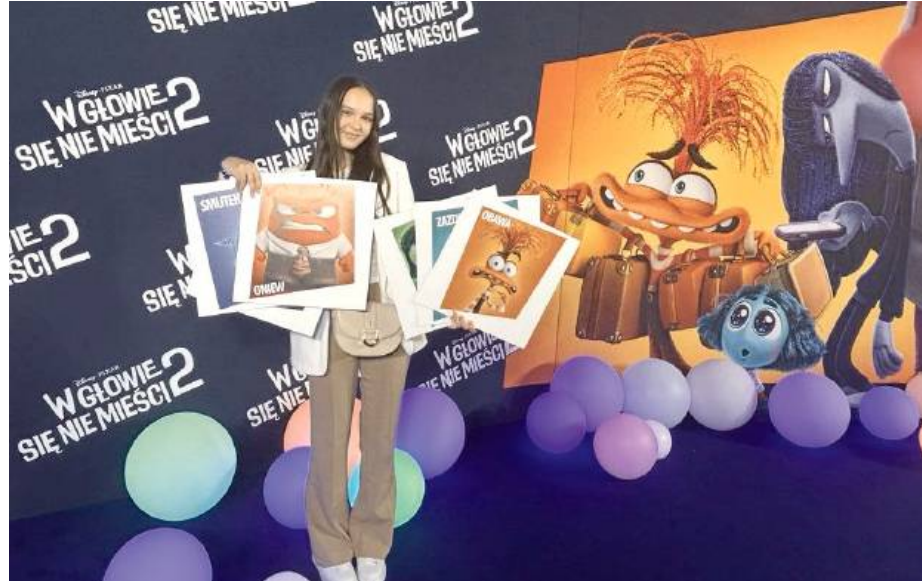
Droga Agaty do sukcesu dubbingowego to owoc ciężkiej pracy, ale i odrobina szczęścia.

Jak się okazuje, droga Agaty do sukcesu dubbingowego to przede wszystkim owoc ciężkiej pracy, ale i odrobina szczęścia. Rok temu otrzymała zaproszenie na zamknięte warsztaty artystyczne w Warszawie, podczas których miała możliwość spróbowania swoich sił w studio dubbingowym. Na koniec warsztatów, osoby zainteresowane mogły zostawić swoje dane kontaktowe i próbki głosu nagrane podczas zajęć. Jakie było zaskoczenie, gdy po dwóch tygodniach odezwano się naj-