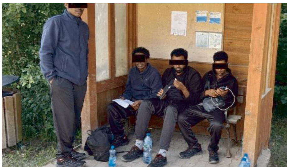
Ścieżka obiega zdjęcie migrantów koczujących na przystanku w Czerlonkach (woj. podlaskie).

W Sokółowie Podlaskim policja zatrzymała samochód osobowy, z którego bagażnika miało wyskoczyć sześciu imigrantów, którzy rozbiegli się po mieście, by funkcjonariusze ich „nie zgarnęli”. Nie jest to jednak informacja w pełni potwierdzona, bowiem