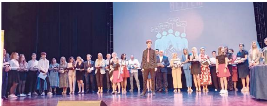
Finał przedsięwzięcia realizowanego przez Zespół Oświatowy w Krześlinie „Na krok przed...hejtem”

Każdy wiedział, jak poważne mogą być konsekwencje hejtu w Internecie? – Jeżeli ktoś zamieszkał post ośmiemającą inną osobę, może spotkać się z odpowiedzialnością karną