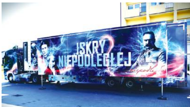
Projekt Iskry Niepodległej po raz kolejny zawitał do Łosic.

W dniach 11-13 czerwca w Łosicach zagościło mobilne widowisko multimedialne "Iskry Niepodległej".