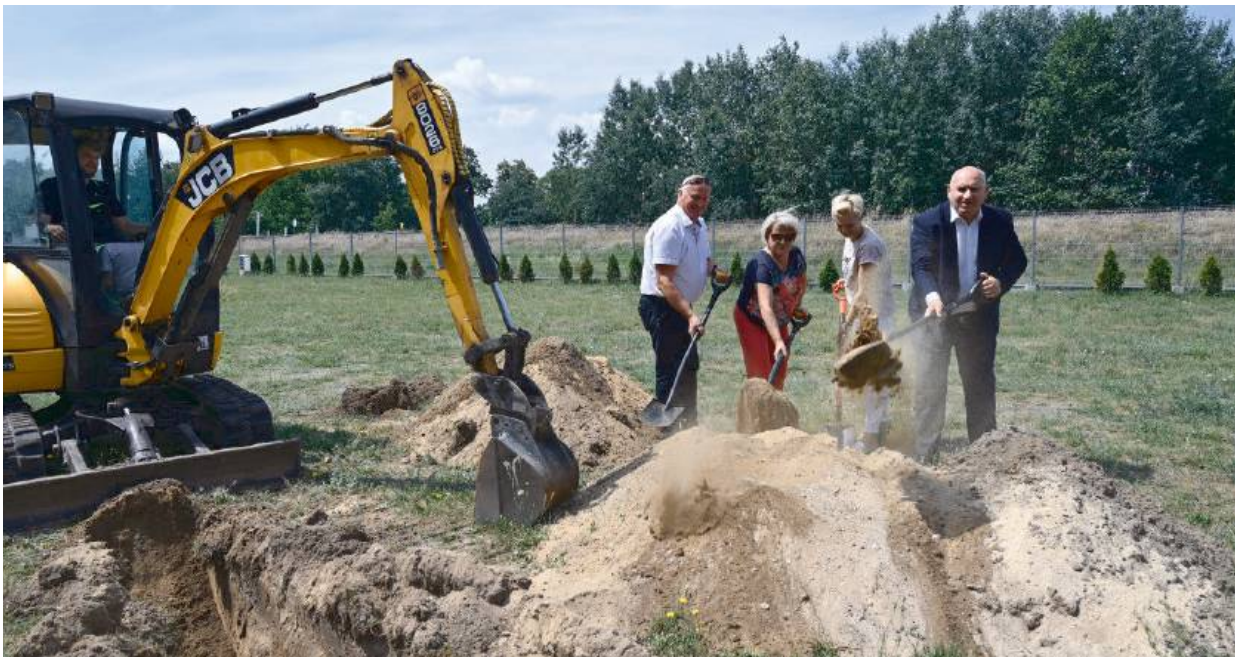
Prace ruszyły z początkiem czerwca, a zakończą się pod koniec roku

Prace nad budową świetlicy zakończą się w grudniu, a jak zapowiedziało Koło Gospodyń Wiejskich zabawa sylwestrowa może być dla mieszkańców pierwszą historyczną imprezą w tej miejscowości. MAT.PRAS.