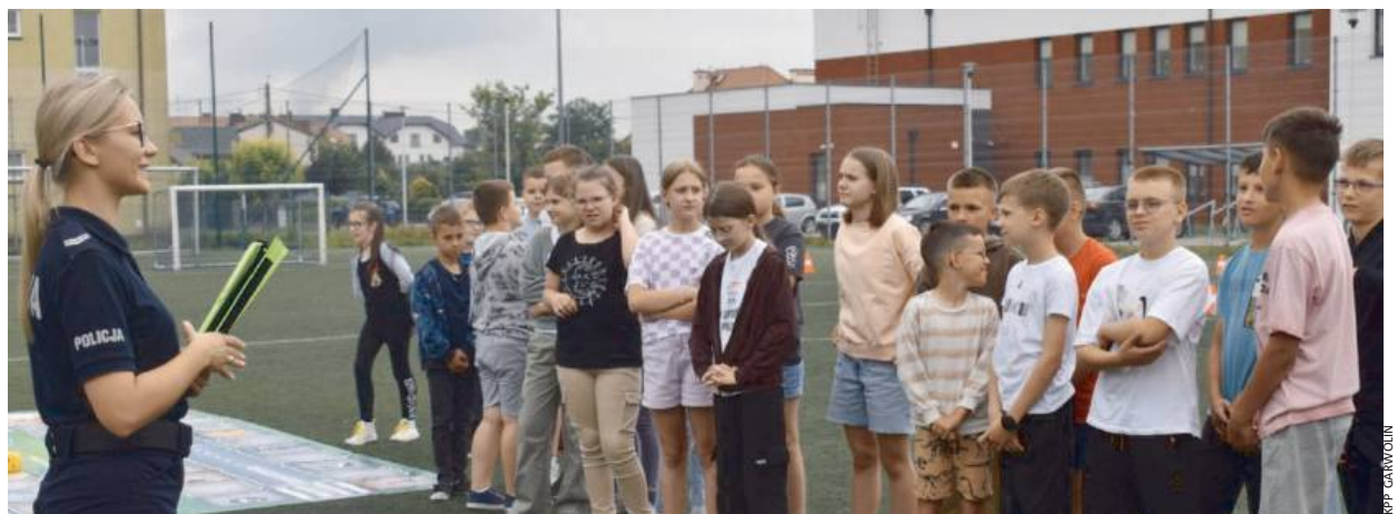
Zajęcia z bezpieczeństwa zostały połączone z profilaktyką

Niemal całonocne działanie zostało zrealizowane we współpracy z dyрекcją PSP im. Tadeusza Kościuszki w Maciejowicach oraz Wojewódzkim Ośrodkiem Ruchu Drogowego w Siedlcach. Zakup upominków dla