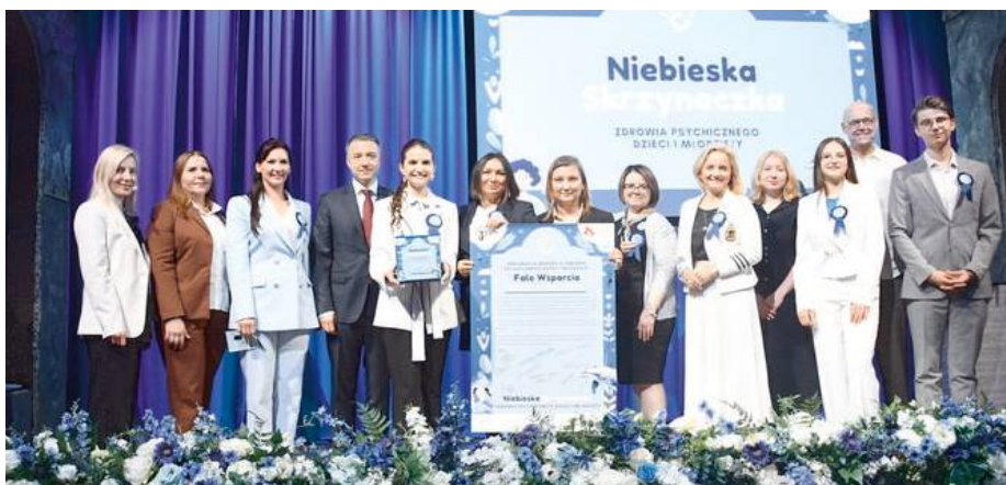
Podczas konferencji przedstawiciele szkół odebrali skrzyneczki i materiały wspierające.