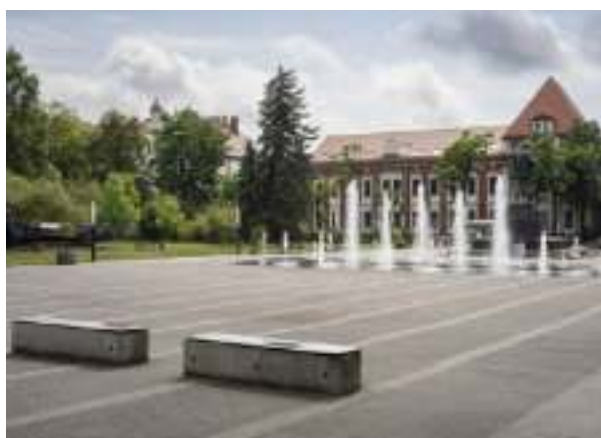
► Plac z pomnikiem Braci Górniczej