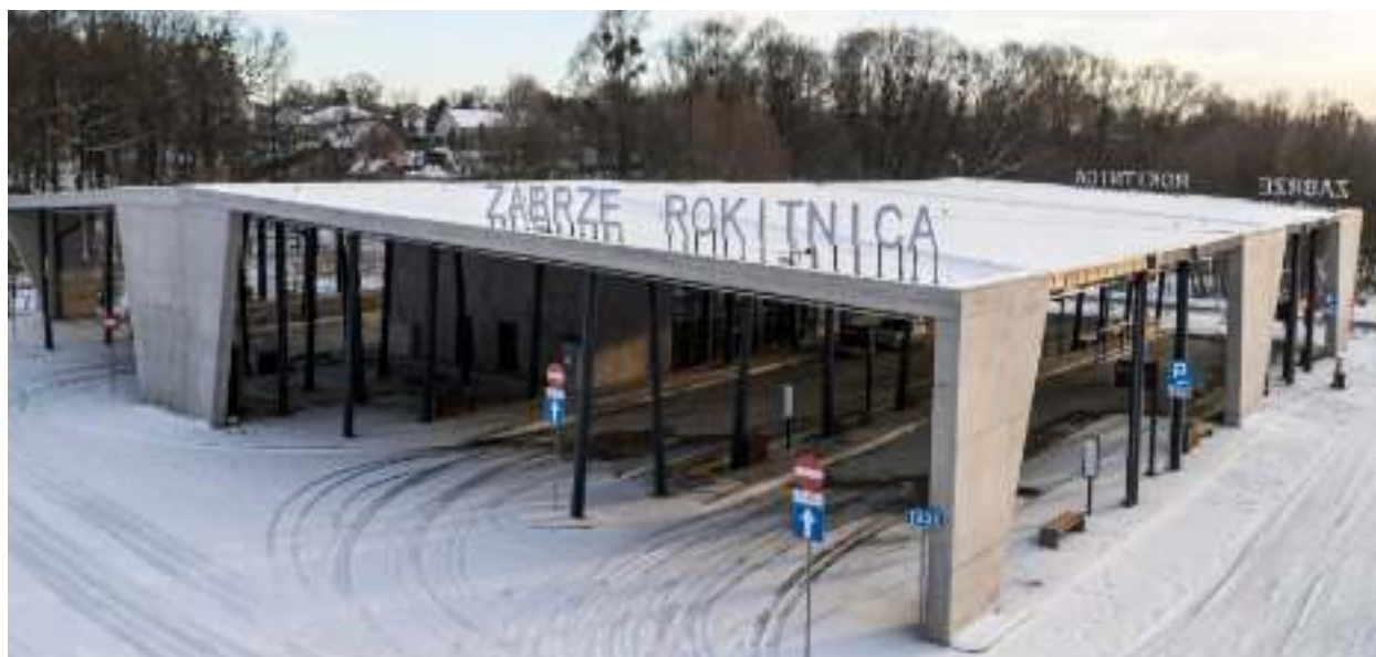
► ...a tak w Rokitnicy