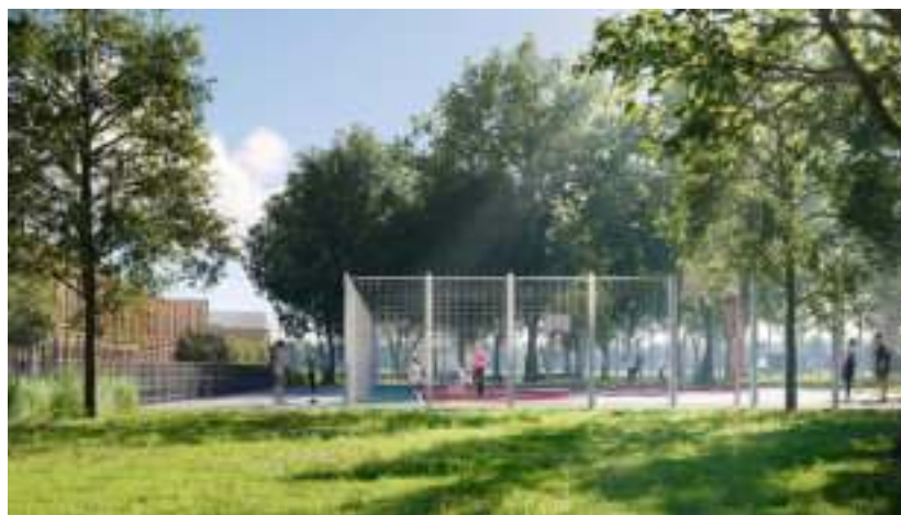
► Zaplanowano m.in. wielofunkcyjne boisko wiz. LemonTree

Bardzo się cieszę, że te ogromne zdegradowane tereny przemysłowe zostaną odbudowane i powstanie coś wyjątkowego, co potęczy nasze dzielnice. Tam będą mogli się spotykać mieszkańcy, zarówno dzieci, młodzież, jak i osoby starsze.