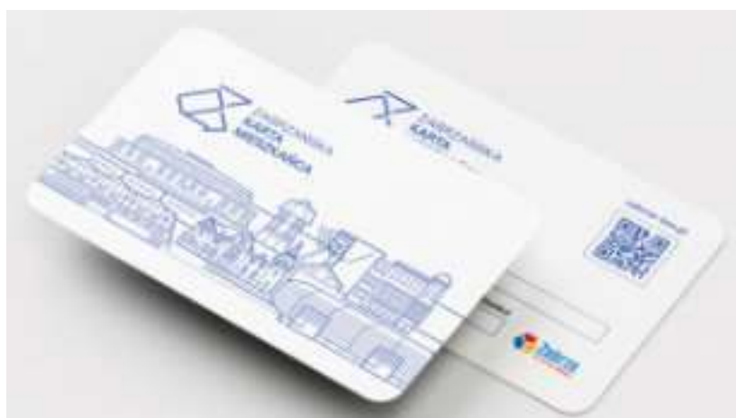
► Karta będzie wydawana w formie elektronicznej oraz dokumentu z tworzywa sztucznego