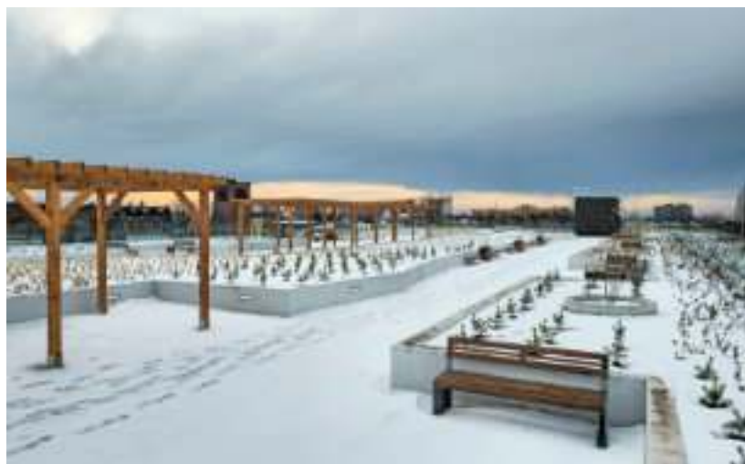
► Na dachu obiektu powstał ogród