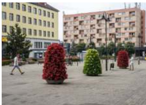
► Plac Wolności