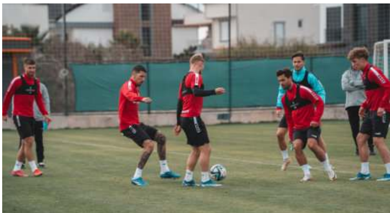
► Jeden z treningów Trójkolorowych przed wznowieniem rozgrywek

Do wiosennej rundy rozgrywek ekstraklasy przygotowywał się Górnik podczas zgrupowania w tureckim Belek. Tymczasem na miejscu trwają działania dotyczące możliwych zmian właścicielskich w klubie.