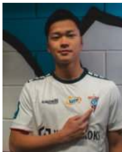
► Soichiro Kozuki

do wznowienia rozgrywek PKO BP Ekstraklasy. W pierwszym sparingu Górnicy zmierzyli się z bułgar-