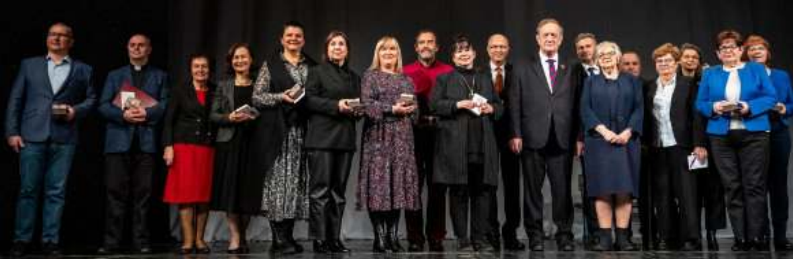
► Jubileuszowa gala odbyła się w Teatrze Nowym