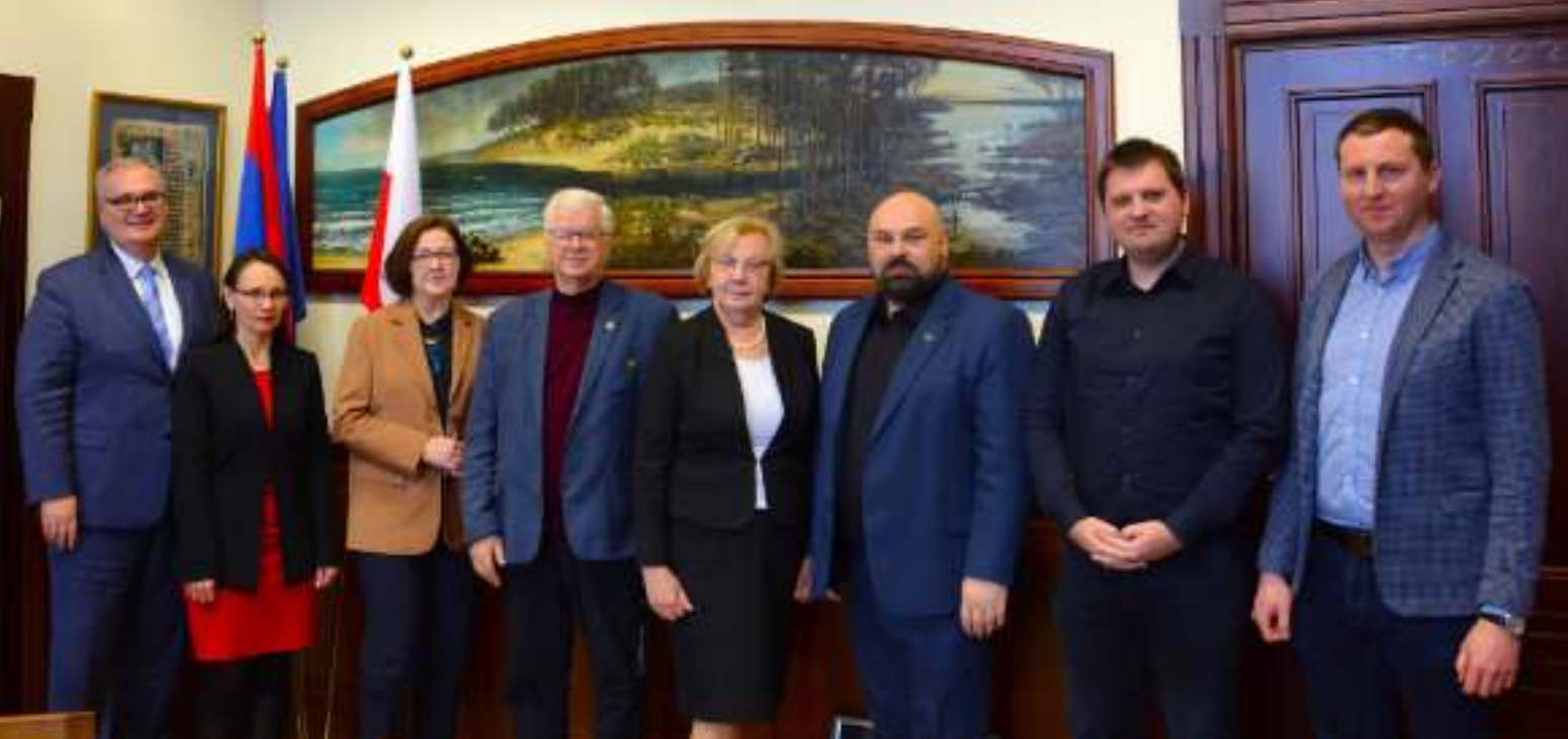
► Spotkanie w ratuszu z przedstawicielami działkowców