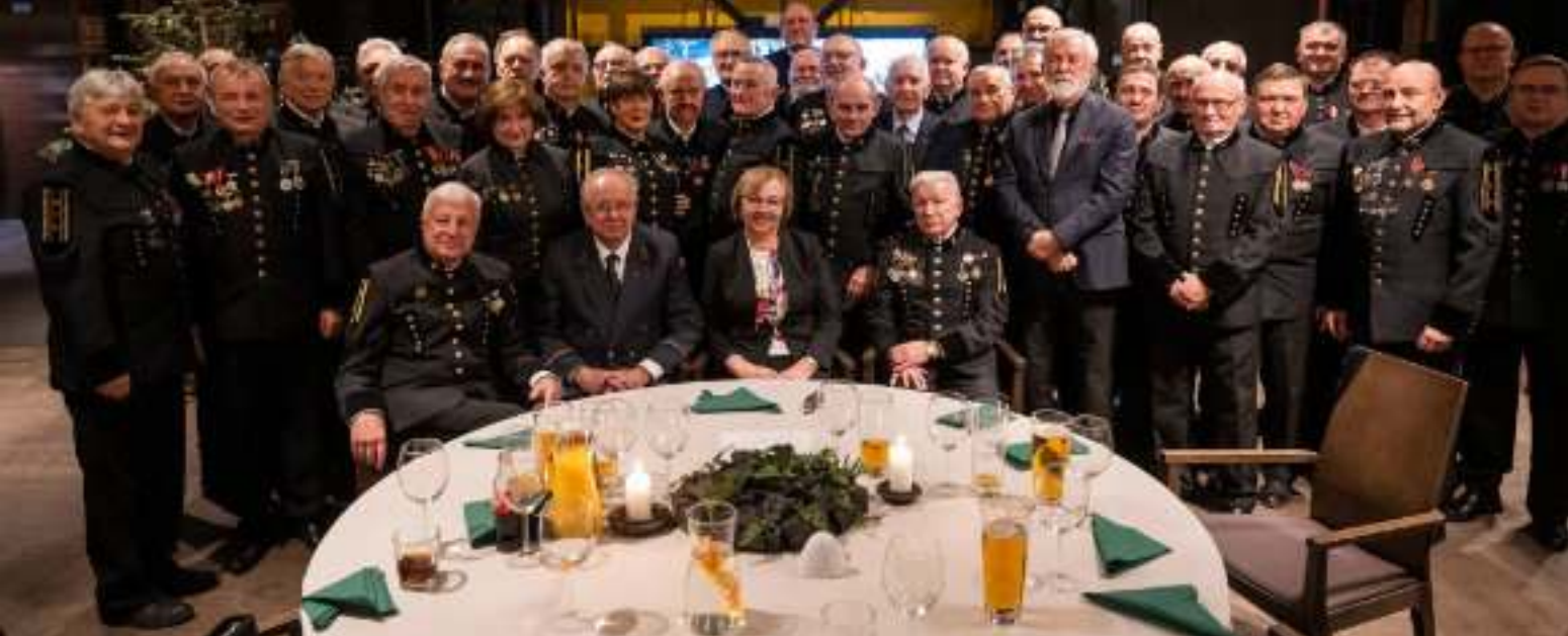
► Spotkanie zostało zorganizowane w Szybie Maciej