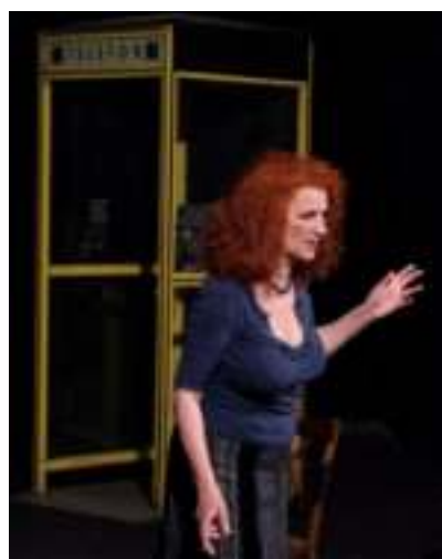
► Spektakl „Mój boski rozwód”

Wizyta w magicznym Parku Miliona Świąteł? A może przepiętny uczuciami spektakl teatralny? Albo koncert pod znakiem miłosnych przebojów? Już 14 lutego będziemy obchodzić Walentynki, a w Zabrzu nie brakuje propozycji na niezapomniane spędzenie ich z ukochaną osobą.