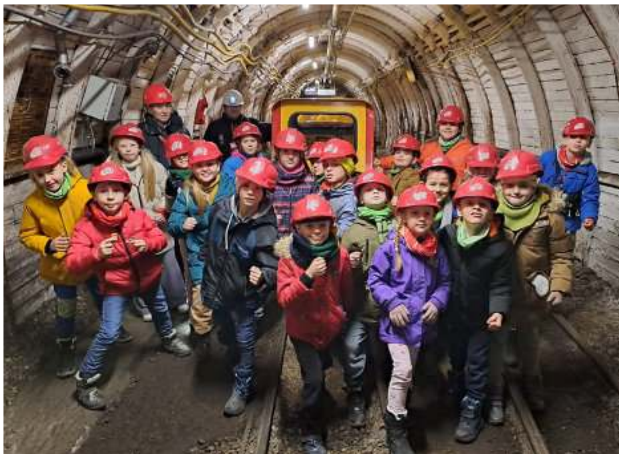
► Z wizytą na jednej z podziemnych tras Muzeum Górnictwa Węglowego

Biblioteka Publiczna. Chętni mogą uczestniczyć w zajęciach plastycznych, grach i zabawach. Będzie też kontynuowana akcja głośnego czytania dzieciom książek, które pozwolą im trafić do świata przygód i rozwinąć swoje zainteresowania. W tegorocznej edycji „Zima w Bibliotece” zaplanowano 15 spotkań.