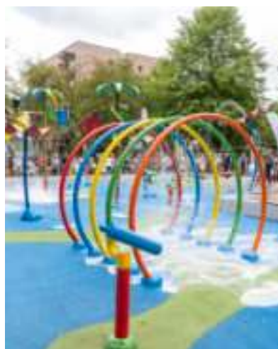
► Pierwszy w mieście wodny plac zabaw