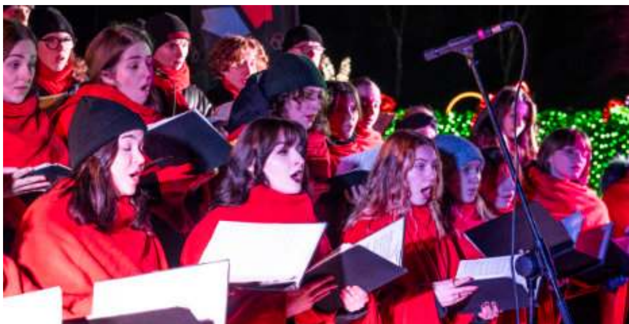
► Występ chóru Resonans con tutti z okazji Dnia Babci i Dnia Dziadka

Wyjątkowy koncert z okazji Dnia Babci oraz Dnia Dziadka przygotował Zabrzeński Chór Młodzieżowy „Resonans con tutti”. Chórzystów można było posłuchać w niezwykłej scenerii Parku Miliona Świąteł.