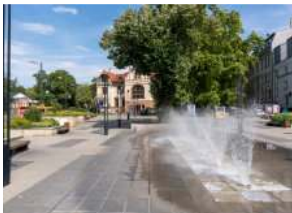
► Plac Teatralny