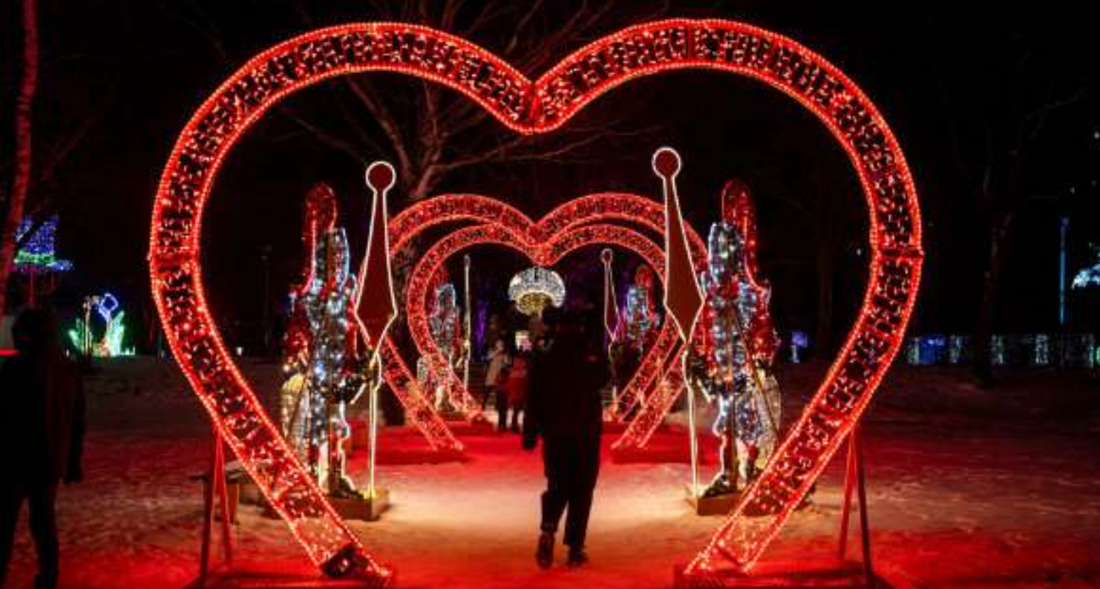
► Jedna z efektownych instalacji w Parku Miliona Świąteł

14 LUTEGO BĘDIEMY OBCHODZIĆ DZIEŃ ZAKOCHANYCH