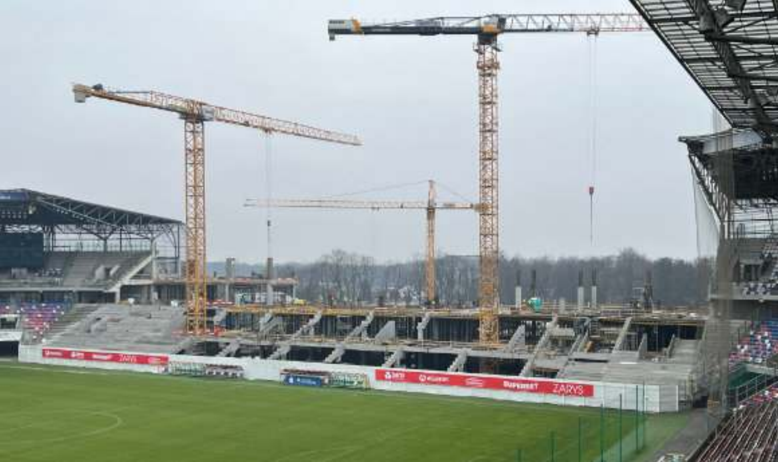
► Na budowie czwartej trybuny Areny Zabrze trwają intensywne prace

NA PRZESTRZENI OSTATNICH KILKUNASTU LAT MAJĄTEK GMINY WZRÓSŁ CZTERO