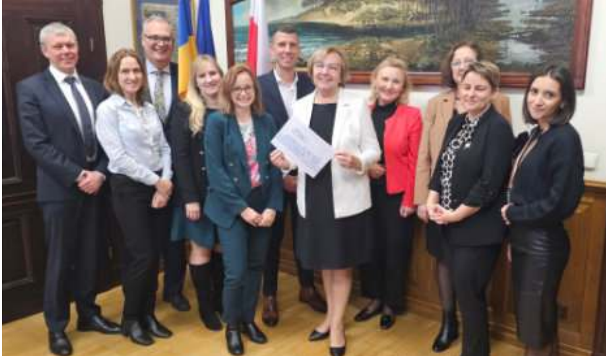
► Spotkanie zespołu zajmującego się przygotowaniem Zabrzeńskiej Karty Mieszkańca