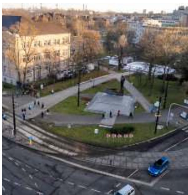
► Skwer przy ratuszu