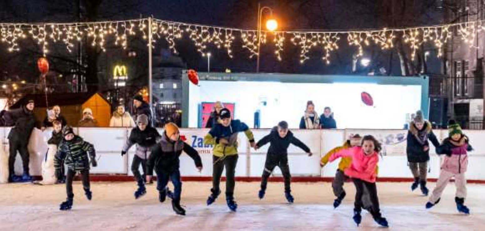
► Miejskie lodowisko na skwerze przy ratuszu