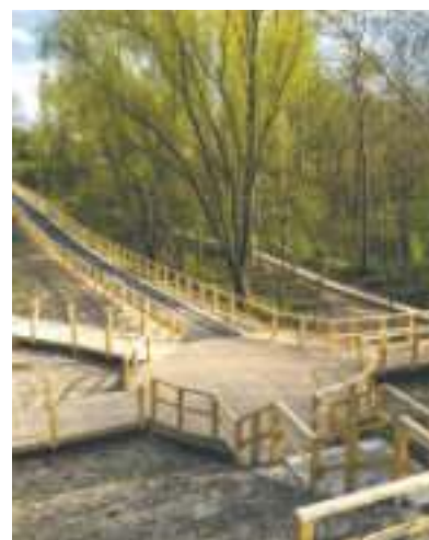
► Geopark w Grzybowicach