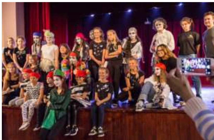
► Ferie mogą być okazją do szlifowania talentów aktorskich

Do połowy lutego zaprasza z kolei Park Miliona Świąteł, w którym można się poczuć jak bohater książki „Alicja w Krainie Czarów”. MM