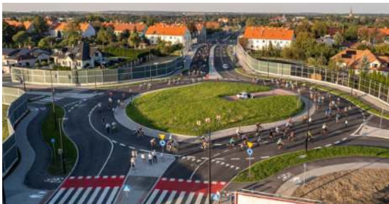
► Przedłużenie alei Korfantego to jedna z najważniejszych inwestycji drogowych ostatnich lat