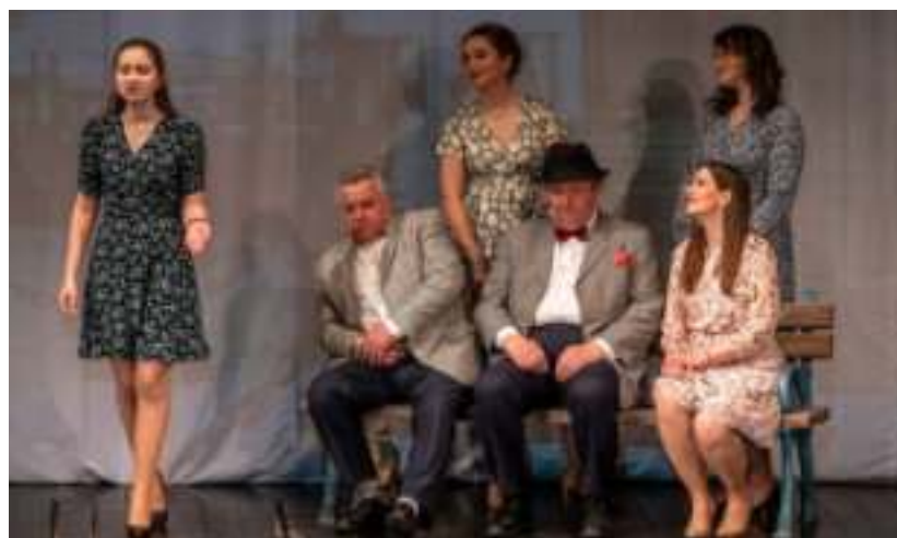
► Wodewil „Tutaj się urodziłam”