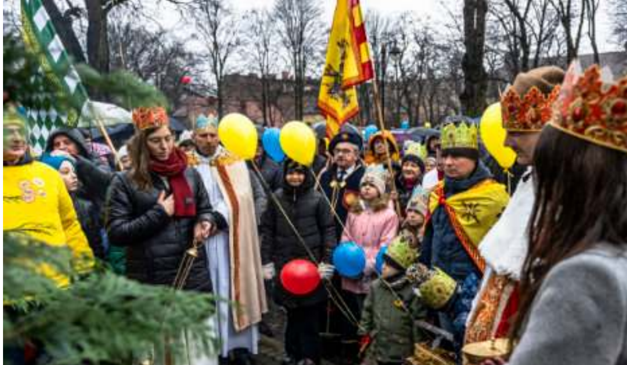
► Wielobarwny tłum spotkał się na placu przed kościołem św. Anny

ULICAMI NASZEGO MIASTA PRZESZEDŁ TRADYCYJNY ORSZAK TRZECH KRÓLI