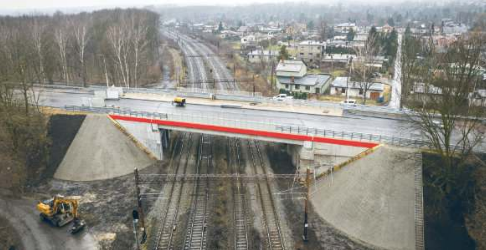
► Zakończył się remont wiaduktu nad torami kolejowymi w ciągu ul. Roosevelta

W STYCZNIU RUSZYŁY KOLEJNE OCZEKIWANE PRZEZ MIESZKAŃCÓW INWESTYCJE