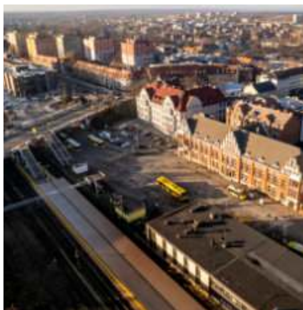
► Plac Dworcowy