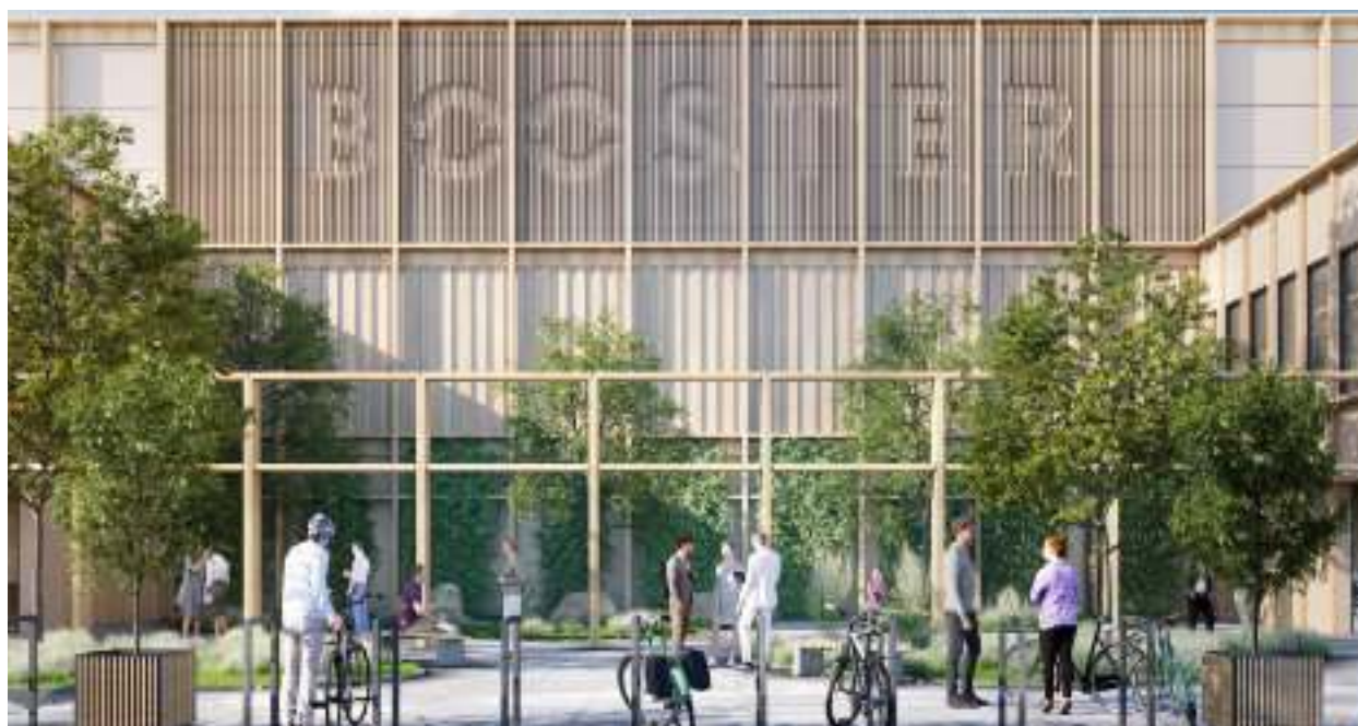
► Tak ma wyglądać nowy kompleks wiz. LemonTree