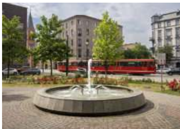
► Plac Krakowski