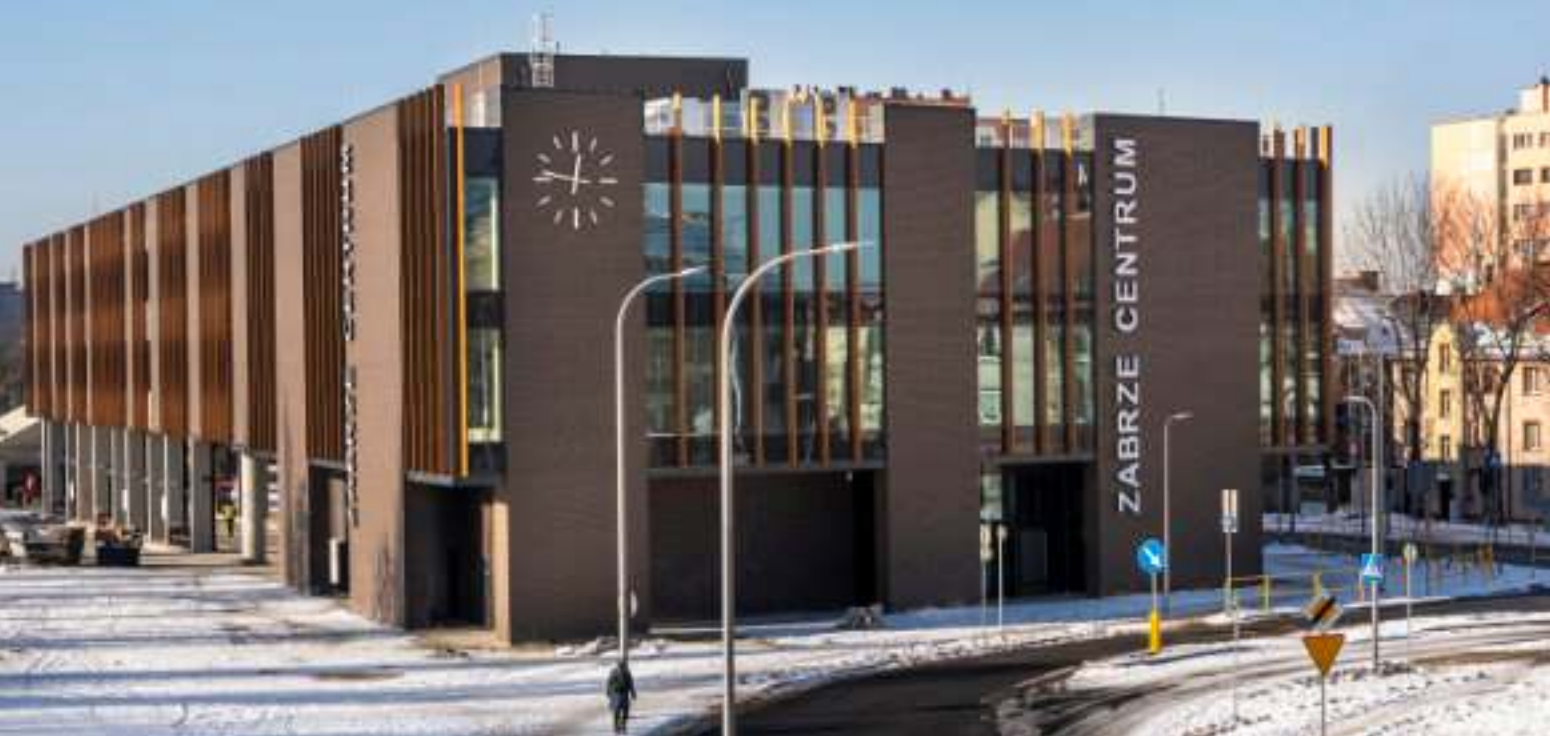
► Tak prezentuje się centrum przesiadkowe przy ul. Goethego...

GOTOWE SĄ CENTRA PRZESIADKOWE PRZY UL. GOETHEGO ORAZ W ROKITNICY