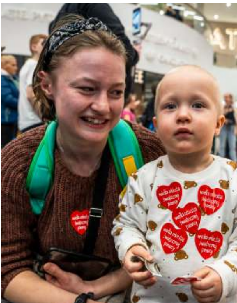
► W dniu Finału wszędzie królowały czerwone serduszka WOŚP

Na muzyczną podróż zaprosiło Kino Roma. Zebrane w tym roku pieniądze zostaną przekazane na zakup urządzeń do diagnostyki obrazowej, czynnościowej, endoskopowej, rehabilitacji oraz torakochirurgii. W ciągu 31 wcześniejszych Finałów WOŚP zebrała blisko 2 mld zł