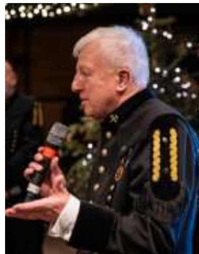
► Zbigniew Barecki