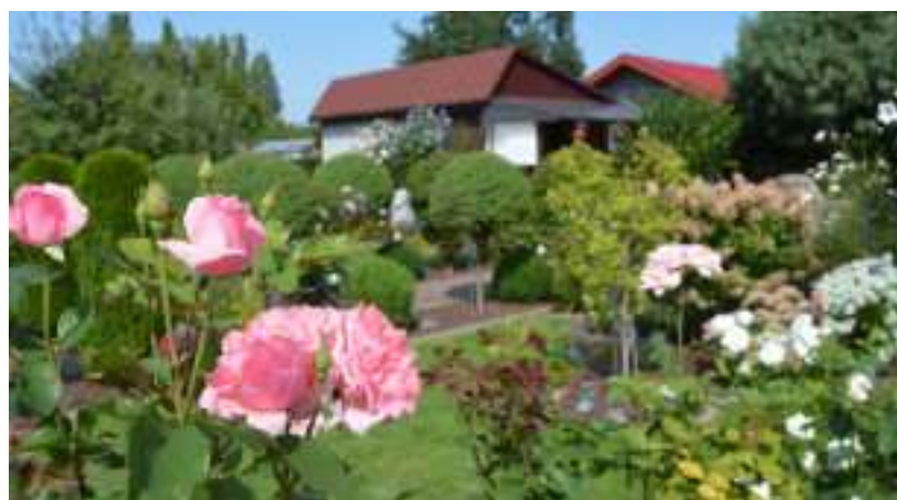
► Zabrzańskie ogrody zachwycają od lat

kulczycach. Tu może przybyć kilkanaście kolejnych działek. Ogród w Kończykach również się powiększy. Tam także znajduje się teren przylegający, nieużytek, na którym mogłoby powstać kolejnych 10-12 działek. Każda jedna działka, która może powstać w mieście, na pewno ucieszy tych, którzy będą mogli z niej korzystać i na niej wypoczywać – dodaje. MM