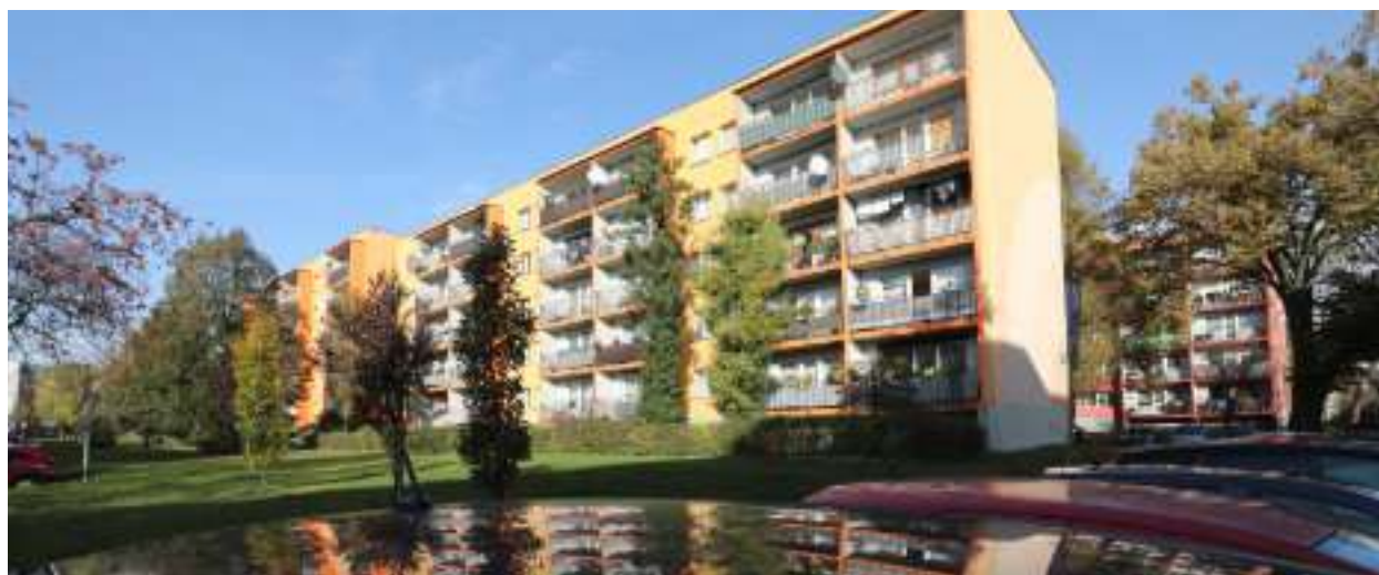
► Kolejne bloki zmieniają oblicze w ramach prowadzonych termomodernizacji