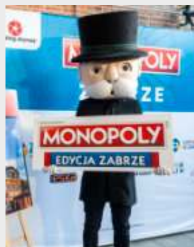
► Tajemniczy biznesmen z gry

blioteki Publicznej w Zabrzu. Przypomnijmy, że zabrzańska wersja Monopoly miała swoją premierę w grudniu ubiegłego roku. Na planszy znalazły się najciekawsze budynki, miejskie obiekty kultury czy parki. Najdroższym polem jest Wieża Ciśnień, pozostałe to m.in. Dom Muzyki i Tańca, AdmiralsPalast, Arena Zabrze, Strefa Carnall, Szyb Maciej czy Miejski Ogród Botaniczny. Zabrze znajduje się w elitarnym gronie około dwustu miejscowości z całego świata, która mają własne wydania kultowej planszówki. GOR