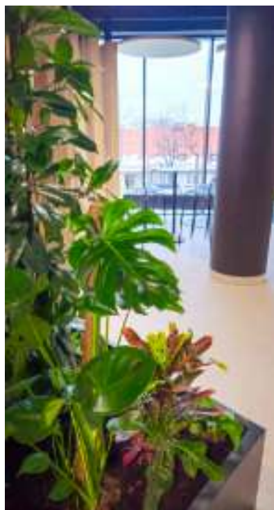
► Nowoczesne wnętrza obiektu

Przestronne i nowoczesne poczekalnie, punkty usługowo-handlowe, wewnętrzny parking z możliwością ładowania samochodów elektrycznych i przygotowany na dachu ogród. Tak w największym skrócie można opisać centrum przesiadkowe, które zastąpiło popularną „Belkę” przy ul. Goethego. Gotowy jest także obiekt w Rokitnicy.