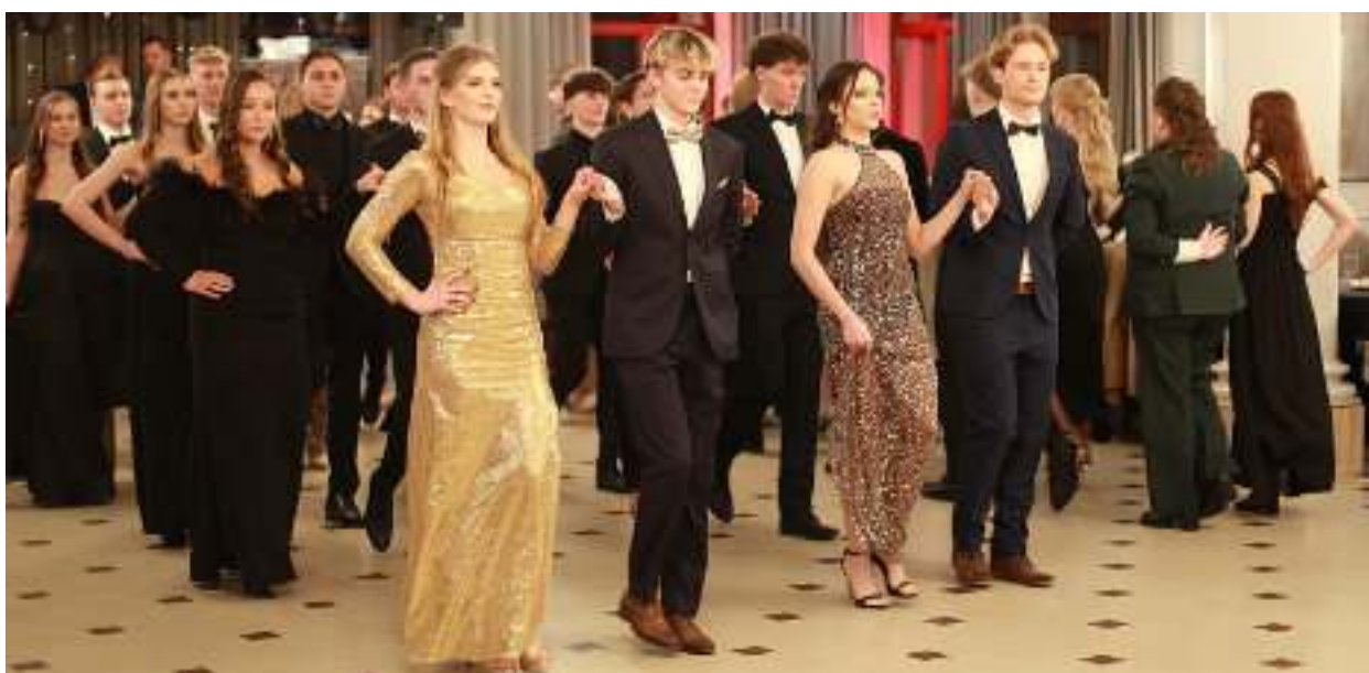
► W szkołach średnich styczeń upływał pod znakiem studniówek

Sezon studniówkowy w pełni! W poszczególnych szkołach odbywają się uroczyste bale. Ich zwieńczeniem będzie plenerowy polonez, na którym spotkają się wszyscy maturzyści.