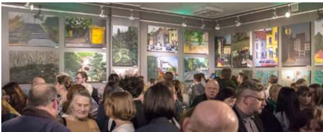
► Wernisaż wystawy przyciągnął tłumy

Prawdziwe tłumy przyciągnął zorganizowany w Galerii Miejskiego Ośrodka Kultury wernisaż wystawy „Zabrze naturalnie”. Znalazły się na niej prace uczniów Liceum Sztuk Plastycznych w Zabrzu.