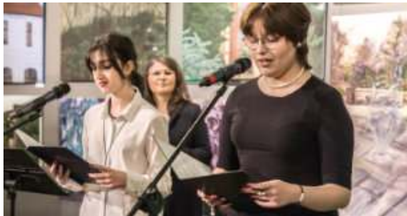
► Ekspozycję można oglądać do 4 marca