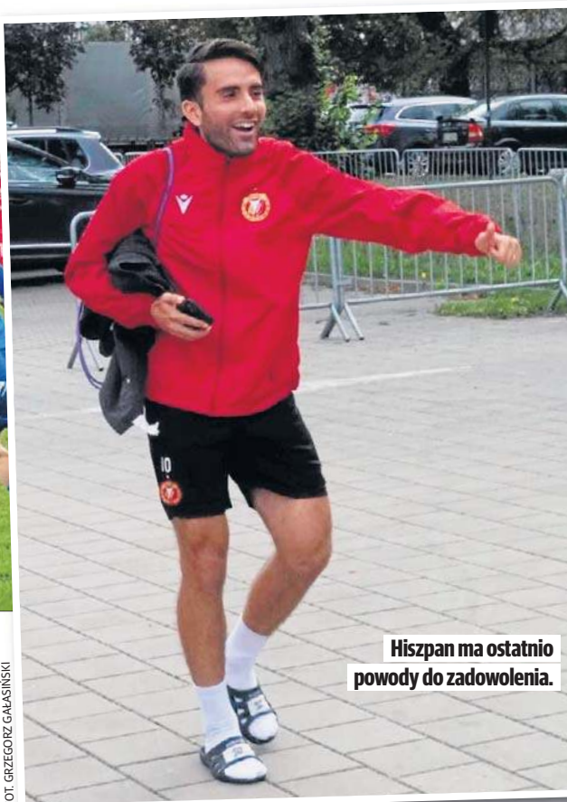
Hiszpan ma ostatnio powody do zadowolenia.