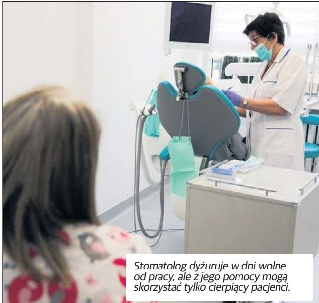
Stomatolog dyżuruje w dni wolne od pracy, ale z jego pomocy mogą skorzystać tylko cierpiący pacjenci.