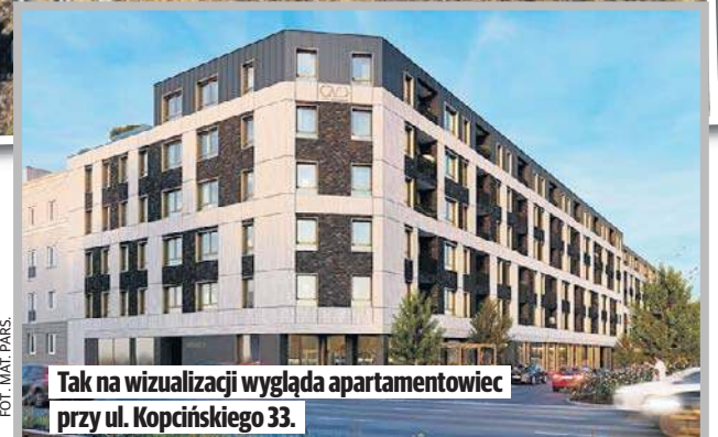
Tak na wizualizacji wygląda apartamentowiec przy ul. Kopcińskiego 33.

Przy założeniu, że przeciętny łódzianin zarabia na rękę około 4 tys. zł, odkładanie całej pensji pozwoliłoby mu kupić mieszkanie po... ponad 36 latach. A to nie licząc wydatków na życie, inflacji czy kredytu np. na samochód. W praktyce kupno takiego apartamentu jest to praktycznie nierealne dla przeciętnego mieszkańca Łodzi.