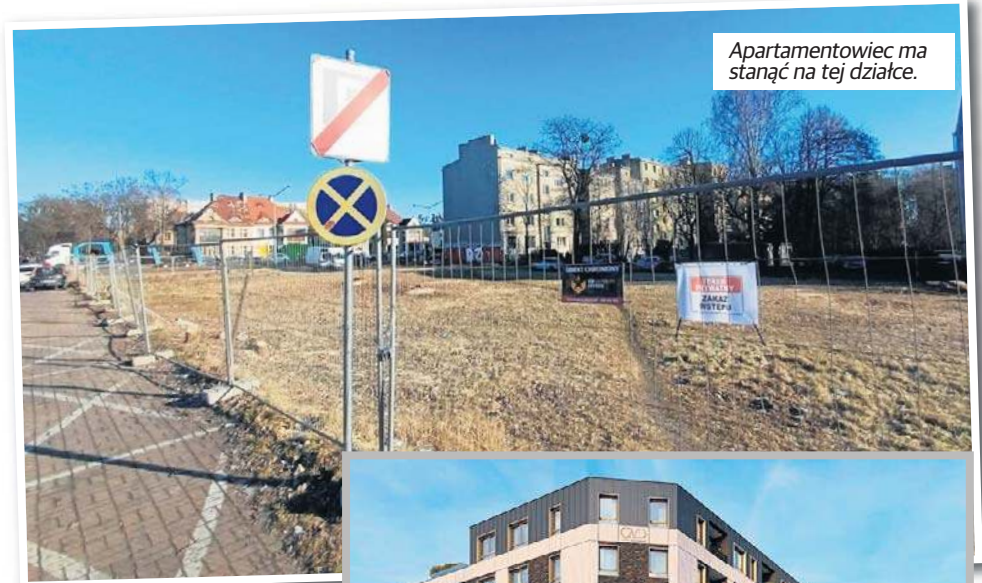
Apartamentowiec ma stanąć na tej działce.