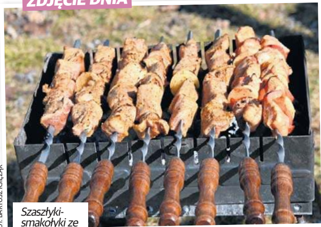
Szaszłyki-smakofyky ze Stawów Jana