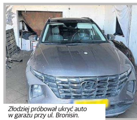
Złodziej próbował ukryć auto w garażu przy ul. Bronisin.

Sprawa ma charakter rozwojowy, ponieważ na posesji policjanci znaleźli ponad 6 tys. części samochodowych. Biegły, po sprawdzeniu, wypowie się, czy pochodzą z przestępstwa.