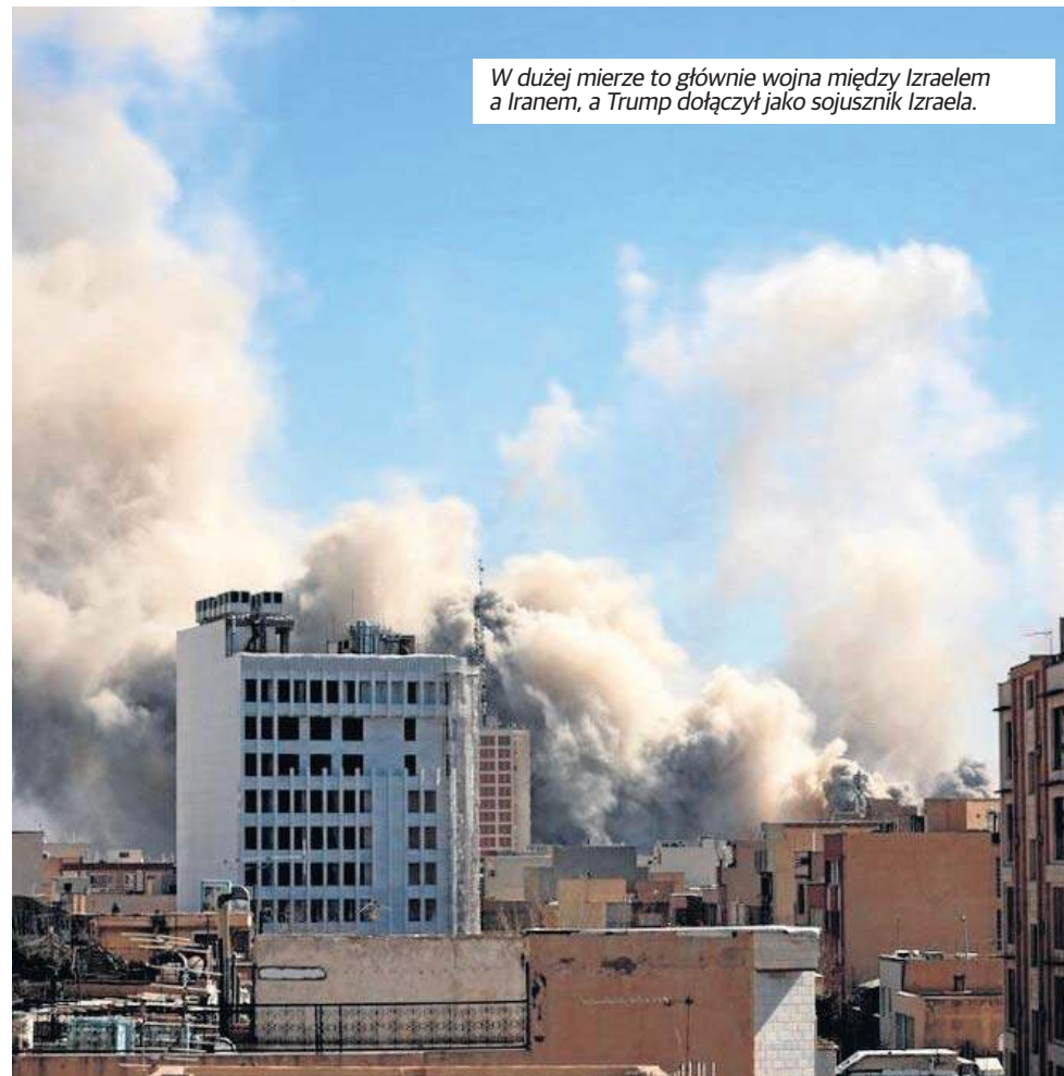
W dużej mierze to głównie wojna między Izraelem a Iranem, a Trump dołączył jako sojusznik Izraela.

O długości trwania konfliktu z pewnością zadecydują USA i Izrael, kiedy stwierdzą, że osiągnięte zostały cele wojenne, lub że obalenie reżimu jest niemożliwe i zrezygnują dalszego prowadzenia działań wojennych ze względu na zbyt wysokie koszty prowadzenia operacji militarnych oraz koszty polityczne i wizerunkowe. Sam Donald Trump sugerował, że operacja może potrwać około 4-5 tygodni. Ten scenariusz zakłada osiągnięcie przewagi powietrznej (co już się udało), zniszczenie części infrastruktury (także cel osiągnięty), zawieszenie broni pod presją międzynarodową (tu wciąż trwa strona murskułów przez obie strony konfliktu). Jednak powyższe granice konfliktu się rozszerzyły w związku z atakami Iranu na państwa arabskie w Zatoce Perskiej oraz wprowadzoną przez Iran „blokadą” Cieśniny Ormuz. Najbardziej niebezpiecznym scenariuszem jest eskalacja do wojny regionalnej. Wydarzy się on wtedy, gdy USA zdecydują się na operację lądową, wspólnie z Izraelem