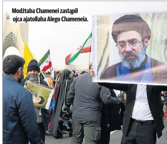
Modżtaba Chamenei zastąpił ojca ajatolla Alego Chameneia.

56-letni Modżtaba Chamenei nosi średni rangą tytuł duchowny w szyickim islamie - hodżatoleslama, niższy od ajatolla i wielkiego ajatolla. Jest znany z bliskich, pielęgnowanych od dziesięcioleci powiązań z Korpusem Strażników Rewolucji Islamskiej (IRGC). Przez lata był kluczowym łącznikiem między ojcem a dowódcą tej formacji. Syn Alego Chameneia, zabitego w trwających od 28 lutego atakach USA i Izraela na Iran, był jednym z głównych kandydatów na nowego najwyższego przywódcę irańskiej republi-