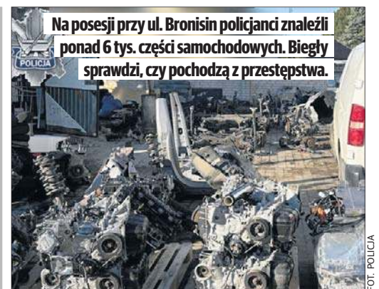
Na posesji przy ul. Bronisin policjanci znaleźli ponad 6 tys. części samochodowych. Biegły sprawdzi, czy pochodzą z przestępstwa.