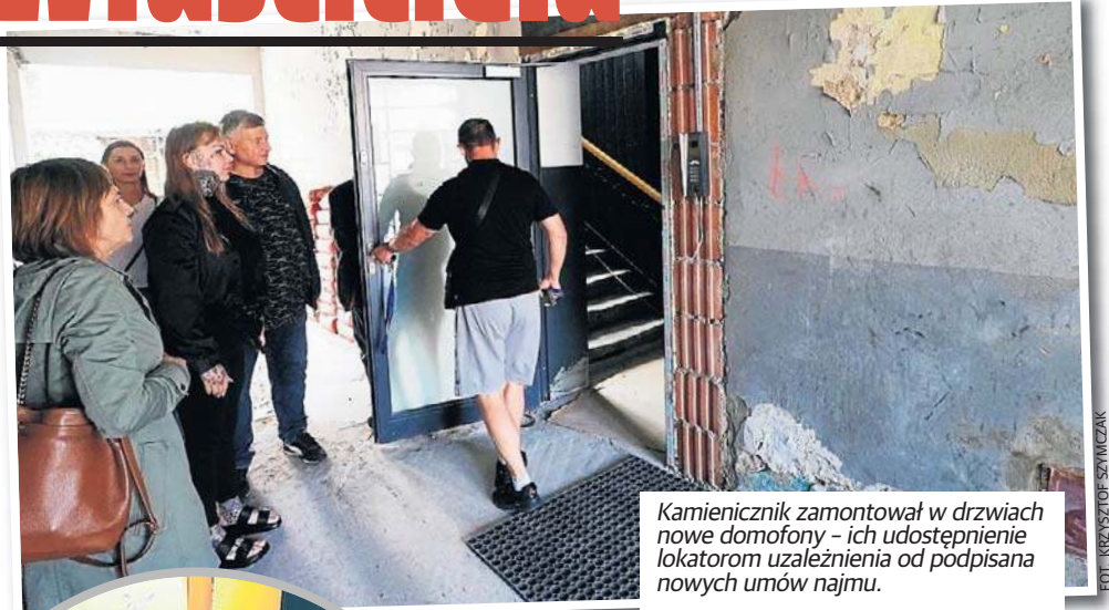
Kamienicznik zamontował w drzwiach nowe domofony - ich udostępnienie lokatorom uzależnienia od podpisania nowych umów najmu.

Jest też problem domofonów - właścicielich udostępnił uzależnienia od podpisania nowych umów najmu. Zdaniem najemców, kamienicznik chce się ich pozbyć, a opuszczone przez nich mieszkania podzielić na mniejsze i wynająć. Dlatego - jak twierdzą - dwóch lokatorów otrzymało eksmisję.