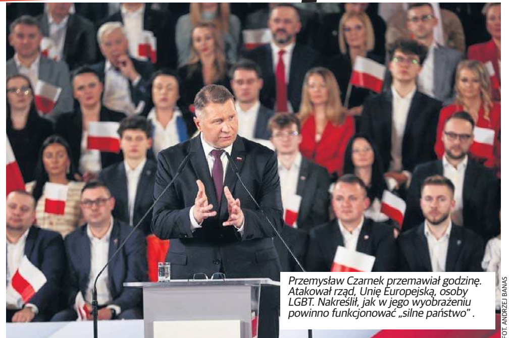
Przemysław Czarnek przemawiał godzinę. Atakował rząd, Unię Europejską, osoby LGBT. Nakreślił, jak w jego wyobrażeniu powinno funkcjonować „silne państwo”.

Dali też o sobie znać wywołani do tablicy liderzy Konfederacji.