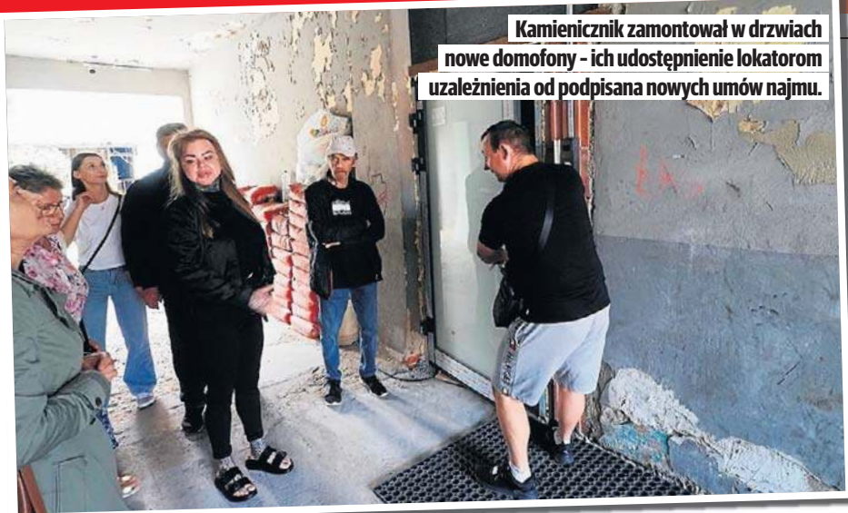
Kamienicznik zamontował w drzwiach nowe domofony - ich udostępnienie lokatorom uzależnienia od podpisania nowych umów najmu.

• Alicja Szemplińska drugi raz wygrała krajowe preselekcje STR. 13