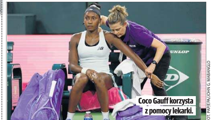
Coco Gauff korzysta z pomocy lekarki.