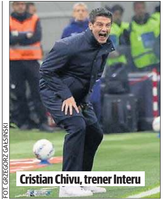
Cristian Chivu, trener Interu

● Piłkarze trzecioligowego Port Vale pokonali u siebie drużynę z najwyższej klasy Sunderland 1:0 w meczu 1/8 finału Pucharu Anglii. Bramkę na wagę sensacyjnego zwycięstwa