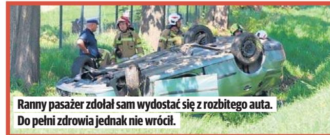
Ranny pasażer zdołał sam wydostać się z rozbitego auta. Do pełni zdrowia jednak nie wrócił.

Poszkodowany pasażer po wypadku musiał zmodyfikować swoje plany zawodowe. Zamiast wracać na Wyspy Bry-