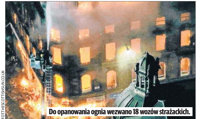
Do opanowania ognia wezwano 18 wozów strażackich.

Europa będzie wspierać Ukrainę bez względu na to, co dzieje się gdzie indziej - zadeklarowała wczoraj szefowa Komisji Europejskiej Ursula von der Leyen. Von der Leyen w przemówieniu na dorocznej konferencji ambasadorów UE na świecie przekonywała, że Unia w obliczu nowych wyzwań potrzebuje bardziej realistycznej i zorientowanej na własne interesy polityki zagranicznej.