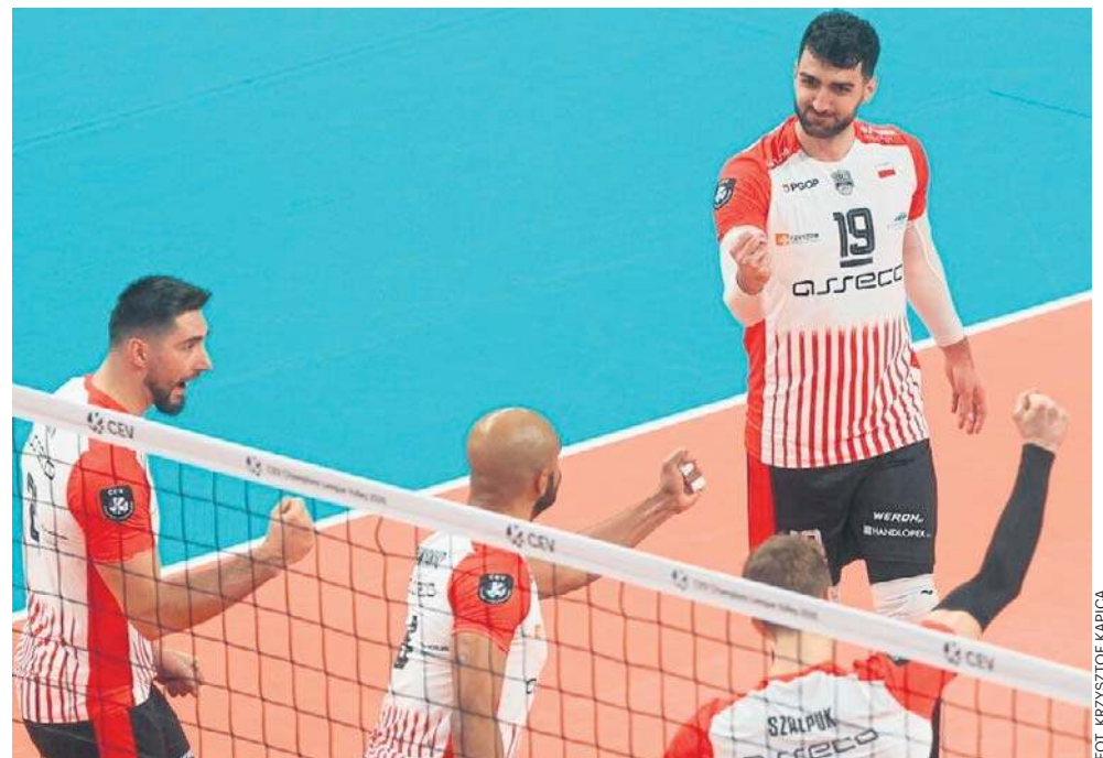
Asseco Resovia stanie dziś na Podpromiu do 33. odsłony rywalizacji z drużyną z Zawiercia licząc PlusLigę, europejskie puchary i Puchar Polski. Wygrywała 13 razy

Jurajscy Rycerze z kompletem czterech zwycięstw i 12 punktów zajmują pierwsze miejsce w tabeli i są już pewni awansu do fazy pucharowej. W środowym meczu wystarczy im wygrać dwa sety, aby przed ostatnim meczem z SVG - wicemistrzami Niemiec definitywnie zapewnić sobie pierwsze miejsce w grupie D i przepustkę do ćwierćfinału CEV Champions League. Rzeszowianie nie ukrywali chęci wygrania grupy D i znalezienia się automatycznie w 1/4 finału tych prestiżowych rozgrywek, ale niespodziewana wyjazdowa porażka 1:3 z SVG Luneburg definitywnie rozwiała ich marzenia. Nasza drużyna ma na koncie dwie wygrane, 6 punktów, zajmuje drugie miejsce i do końca fazy grupowej musi walczyć o jej utrzymanie. Bezpośredni awans do ćwierćfinału uzyskają zwycięzcy pięciu grup, a zespoły z drugich miejsc i drużyna z trzeciego miejsca z najlepszym bilansem utworzą pary barażowe, które wyłonią trzech kolejnych ćwierćfinalistów. Cztery pozostałe drużyny, które uplasują się na trzecich po-