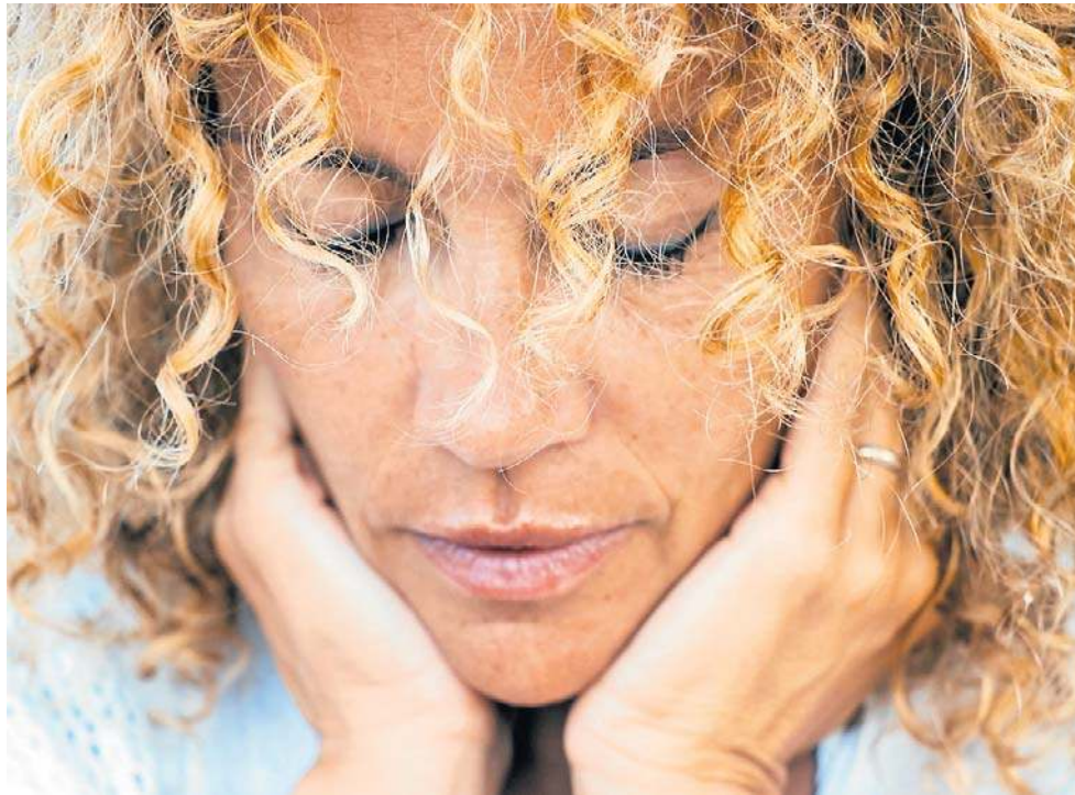
Już wcześniej łączono menopauzę z pogorszeniem funkcji poznawczych

Oprócz wypełniania ankiet odnoszących się do przebiegu