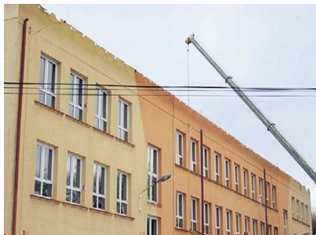
W szkole przy ul. Orzeszkowej trwają prace po wyburzeniu sali gimnastycznej, przewiązki i zdjęciu dachu

W IX LO z klasami dwujęzycznymi uczy się 600 uczniów. Na czas remontu liceum przeniosło się do zaadaptowanych pomieszczeń Full Marketu przy al. Rejtana. Lekcje WF uczniowie mają w obiektach UCSiR przy ul. ks. Jałowego. ©️