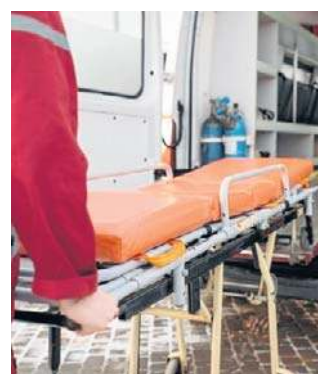
31-latek, z uwagi na wychłodzenie organizmu wymagał pomocy medycznej i karetką pogotowia został przewieziony do szpitala

Na miejscu policjanci zauważyli Fiata, a w nim mężczyznę ubranego jedynie w bieliznę, który trząsał się z zimna. Widać było, że jest mocno wychłodzony. Był trzeźwy, ale jego zachowanie wskazywało,