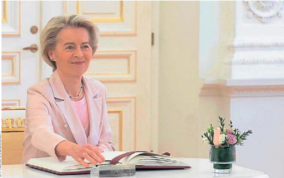
W liście do przywódców UE von der Leyen wskazała pięć kluczowych obszarów działań, przed którymi stanie Unia Europejska

Pierwszym z nich jest deregulacja i uproszczenie prawa unijnego. KE zapowiedziała dalsze pakiety „Omnibus” (uprosz-