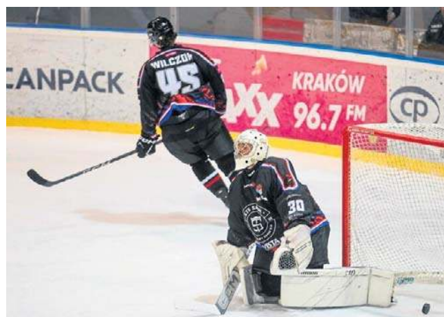
STS Sanok został wycofany z rozgrywek ligowych po 34 kolejkach. Wszystkie mecze w tym sezonie przegrał

Prezes STS-u Sanok odniosła się m. in. do ostatnich wydarzeń gdy przed Areną Sanok został zapalony znicz. - Od dłuższego czasu byłam prywatnie straszona, obrażana i wyzywana, poza kamerami i mediami, w wiadomościach, których nikt nie widzi. Doszło również do realnego zdarzenia, w którym zostałam zaatakowana słownie i personalnie na parking. W momencie, gdy otrzymałam zdjęcia znicza, odebrałam je nie jako gest pamięci, lecz jako kolejny element wymierzony bezpośrednio we mnie, w atmosferze strachu,