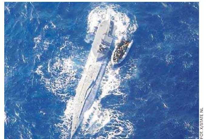
Zdjęcie z przejęcia łodzi podwodnej pełnej kokainy wartej 441 milionów dolarów