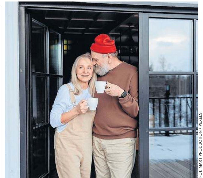
Bliskość drugiej osoby wpływa zarówno na nasze samopoczucie psychiczne, jak i na stan zdrowia