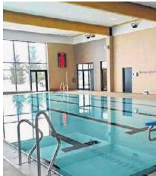
Park Wodny FREDROpool ma zostać otwarty 14 lutego

Nowoczesne natryski mają możliwość regulacji strumienia: deszcz arktyczny, deszcz tropikalny, bryza. Ciekawostką jest ścieżka Kneippa, która umożliwia naprzemienne wchodzenie do zimnej i ciepłej wody, co poprawia krążenie krwi i hartuje organizm.