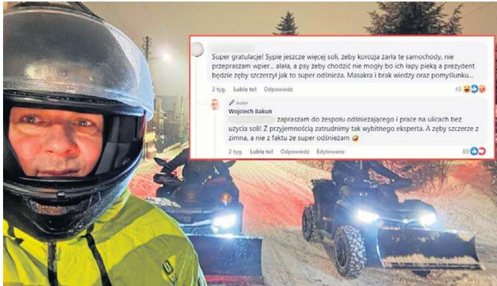
Samorządowcy (na zdj. W. Bakun) wykorzystują media społecznościowe do bezpośredniej, z pominięciem urzędowych kanałów, komunikacji z mieszkańcami

Na Facebooku „Wojciech Bakun - Prezydent Miasta Przemysłu - Profil Oficjalny” przemyskiego gospodarza obserwuje 42 tys. osób. To więcej niż mają wspólnie dwa oficjalne działające profile Urzędu