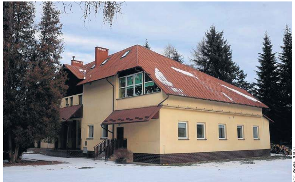
Los „willi dyrektorskiej” na osiedlu Dąbrowskiego w Rzeszowie wydaje się przesądzony

Mieszkańcy w piśmie podnoszą, że willa mogłaby być