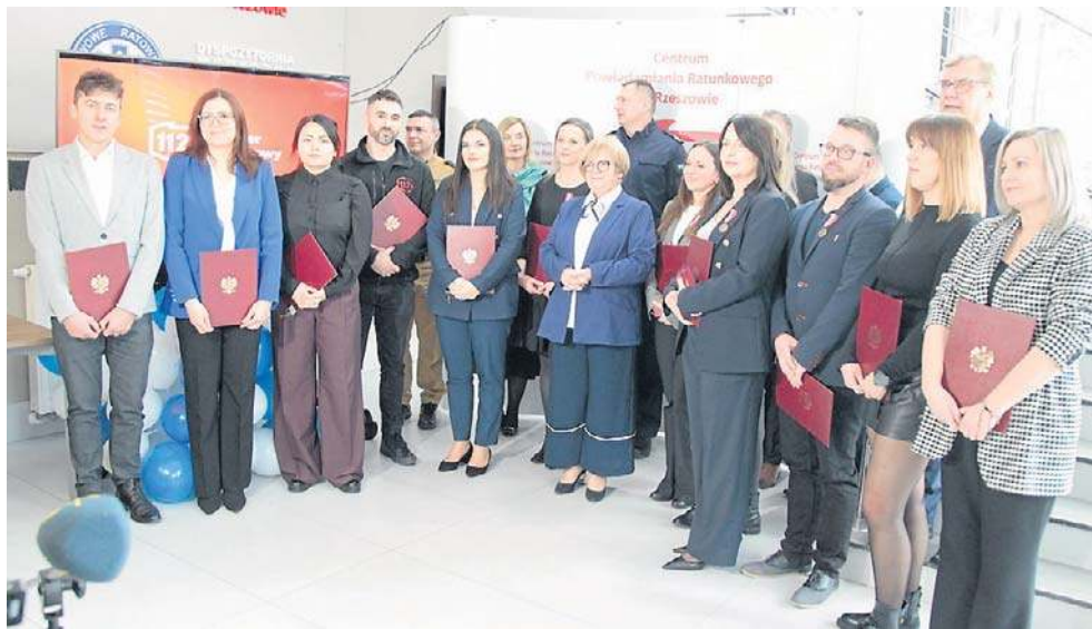
Wojewoda podkarpacki Teresa Kubas-Hul wręczyła odznaczenia państwowe i nagrody specjalne zasłużonym pracownikom CPR w Rzeszowie

- W 2025 roku na numer alarmowy 112 w centrum w Rzeszowie wpłynęło 719 397 zgłoszeń, z czego 283 889 zgłoszeń zasadnych zostało przekazanych do służb. I tak: 113 760 - do policji, 24 771 - do Państwowej Straży Pożarnej, 121 372 - do Dyspozytorni Medycznej, 24 076 - do służb pomocniczych, jak np. WOPR, GOPR, pogotowie elektryczne - wyliczyła wojewoda podczas obchodów Europejskiego Dnia Numeru Alarmowego 112 w Centrum Po-