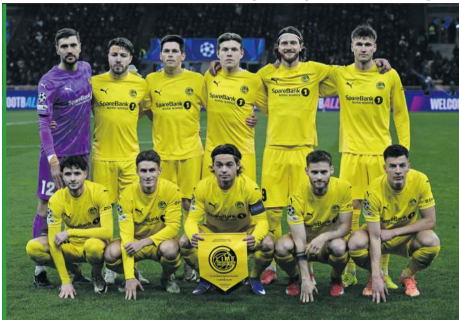
Bodo/Glimt, wicemistrz Norwegii, największa sensacja obecnej edycji Ligi Mistrzów.

W dniu meczu w mediach pojawiła się informacja, że bieżący sezon będzie prawdopodobnie ostatnim w Madrycie dla żywej legendy klubu – Antoine'a Griezmanna. „The Athletic” poinformował, że Francuz grający w Atletico od 2014 roku (z dwuletnią przerwą na Barcelonie) prowadzi intensywne rozmowy z Orlando City. Kierunek nie wydaje się zresztą specjalnie zaskakujący. Na dogranie kariery w MLS decyduje się bowiem coraz więcej gwiazd z topowych lig europejskich. Przed spotkaniem Diego Simeone, o którym znów spekuluje się, że to również jego ostatni sezon w Atleti (miałby odejść do Interu) miał obawy, że Belgowie przyjadą zagrać na dużym luzie, bez presji, a do tego po swojej stronie mieli statystykę (Atletico nie wygrało czterech wcześniejszych