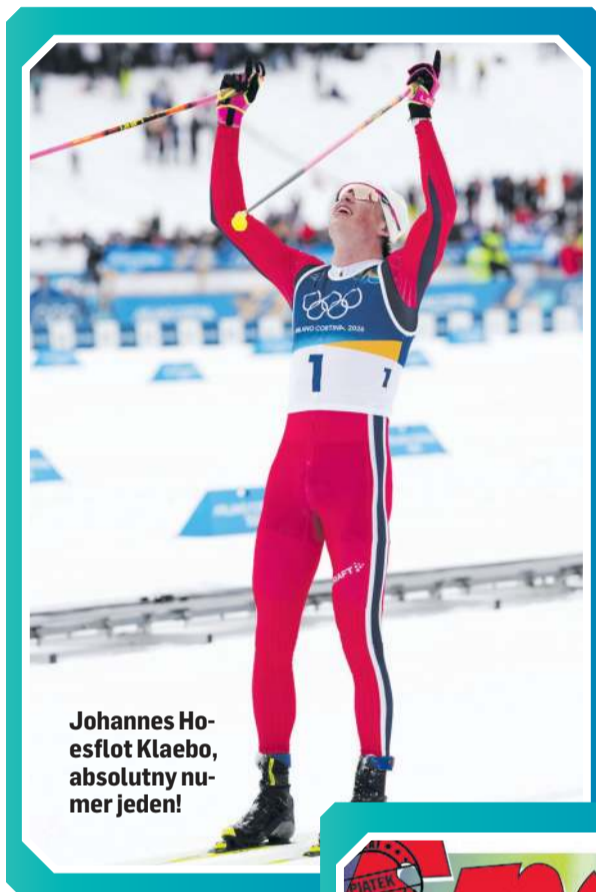
Johannes Hoesflot Klaebo, absolutny numer jeden!