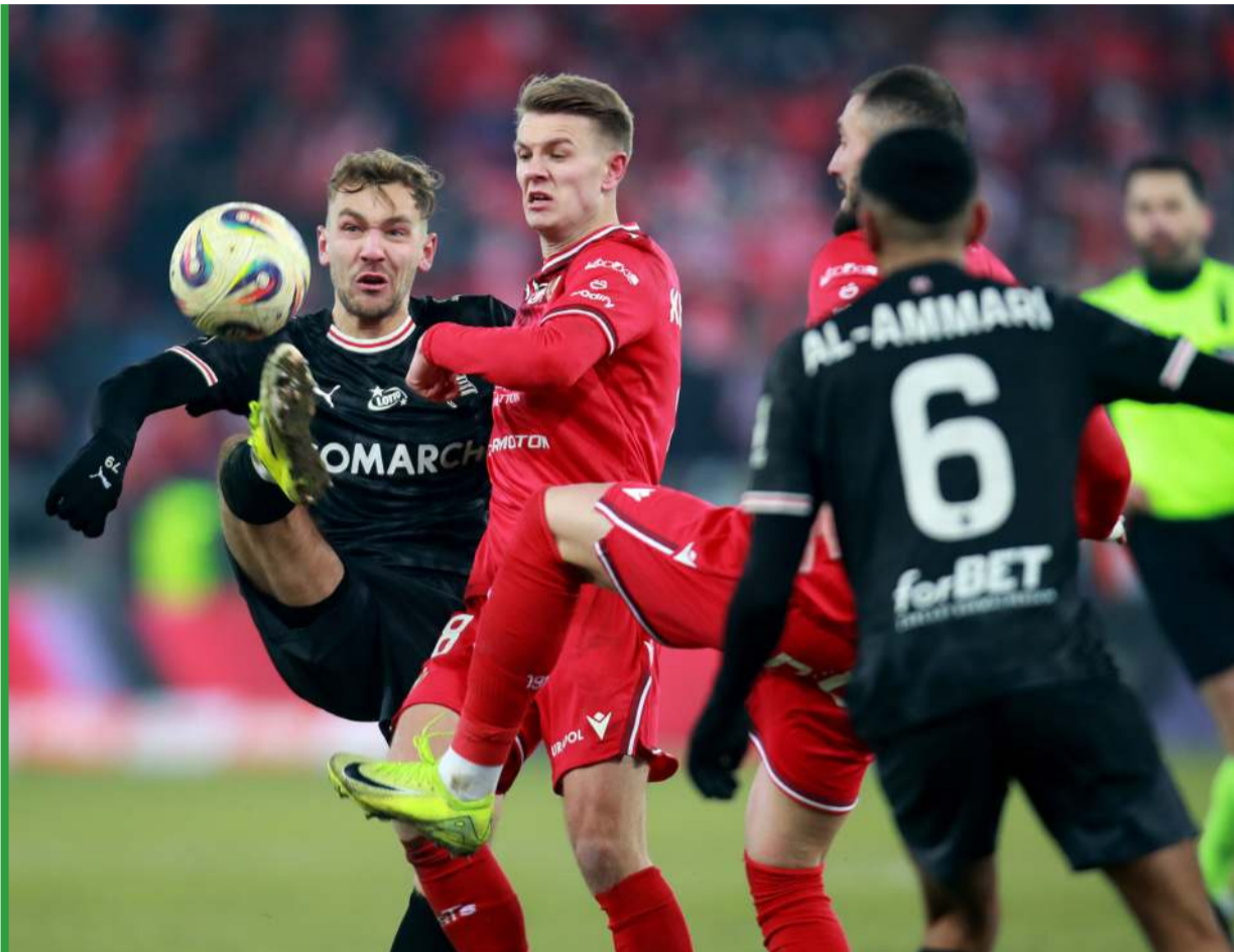
Starcie Widzewa z Cracovią (0:0) było antyreklamą ekstraklasy.

się, że przed takim składem rywale będą wręcz klękać na boisku, błagając o litość, a to 7:0 z meczu z Cracovią sprzed lat nie będzie takie nierealne. Cztery punkty w czterech meczach to z punktu widzenia