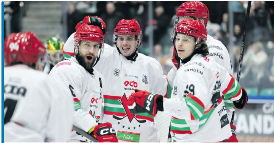
Siła Sosnowiczanki tkwi w kolektywie – wspierają się na lodzie i poza nim.

To ostatnie słowo, powtarzane na okrągło, brzmi jak wytrych.