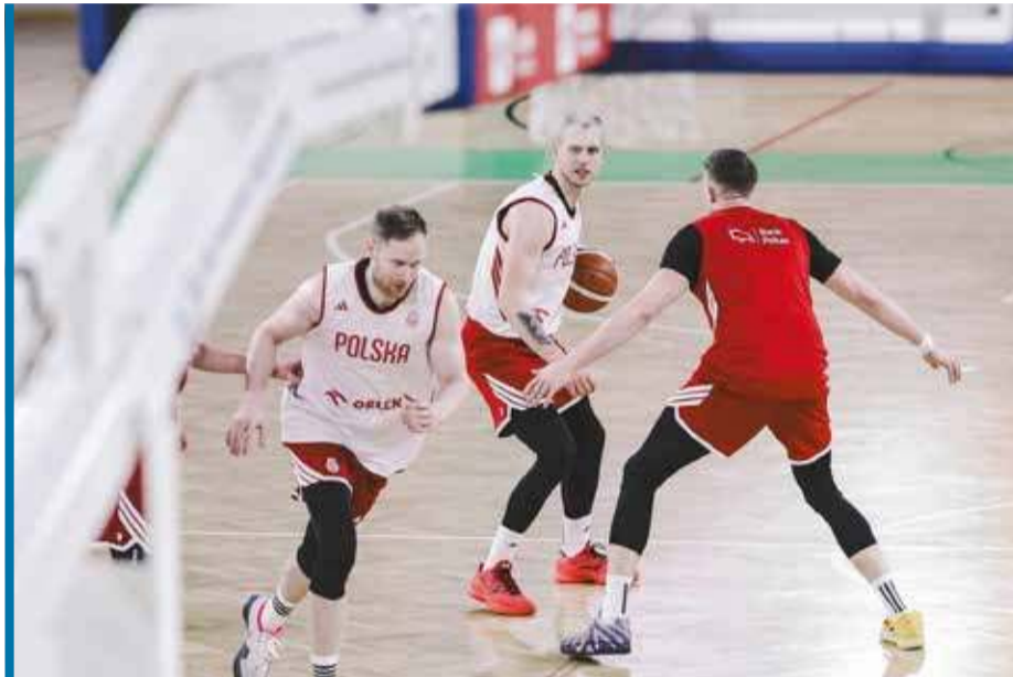
W pierwszym dniu kadra trenowała w okrojonym składzie.