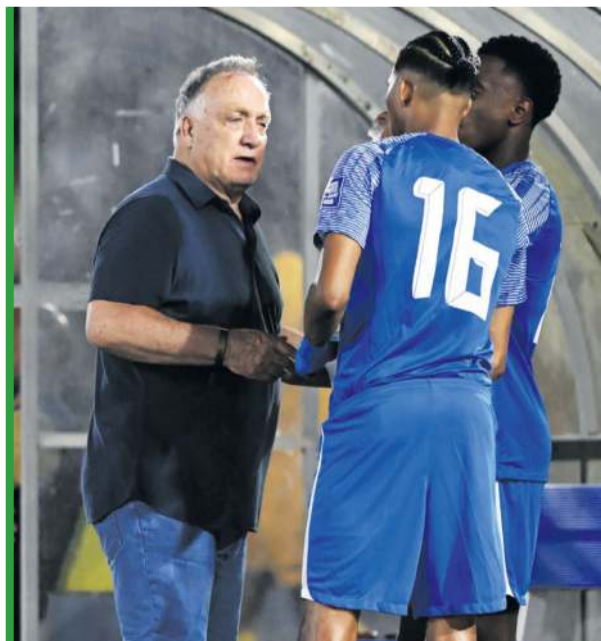
Dick Advocaat i jego byli podopieczni w meczu z Barbadosem.